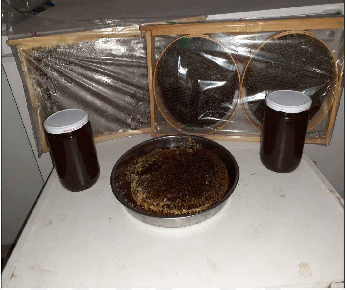
Şekil A.17. Lavanta balı çeşitleri