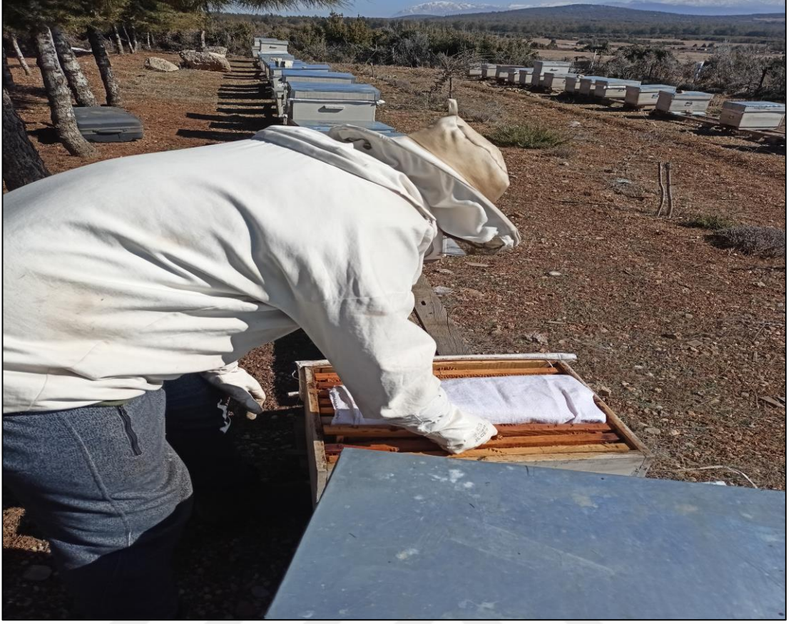
Şekil A.5. Arı kovanı kış hazırlığı