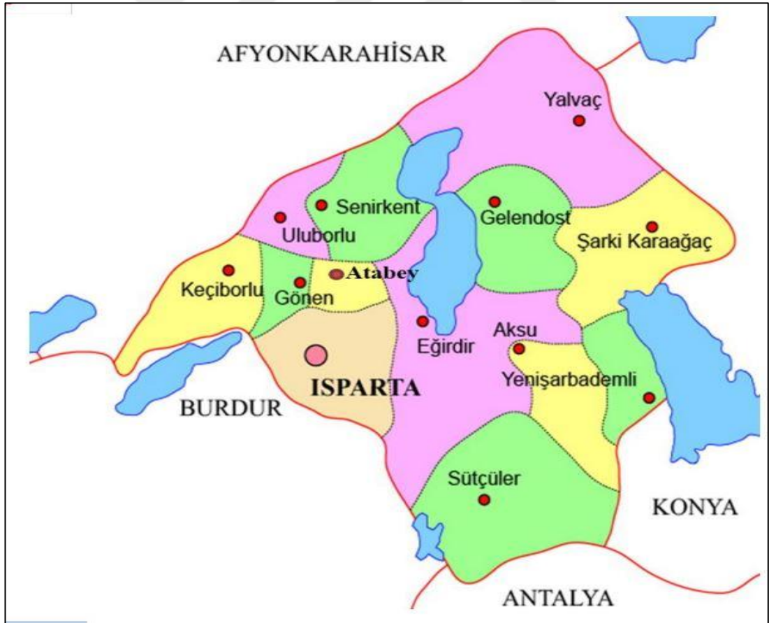
Şekil 3.1. Isparta ili haritası (Anonim, 2023d)

Isparta'ya 41 km uzaklıkta olan Keçiborlu ilçesinin ortalama rakımı 1 010 m ve yüzölçümü 562 km 2 'dir. Burdur Gölü'nün 22 km'lik kuzey kıyı şeridi Keçiborlu sınırları içerisinde yer almakta ve Süleyman Demirel Havalimanı ilçe sınırlarındadır. Isparta ili haritası Şekil 3.1'de verilmiştir (Anonim, 2022d).