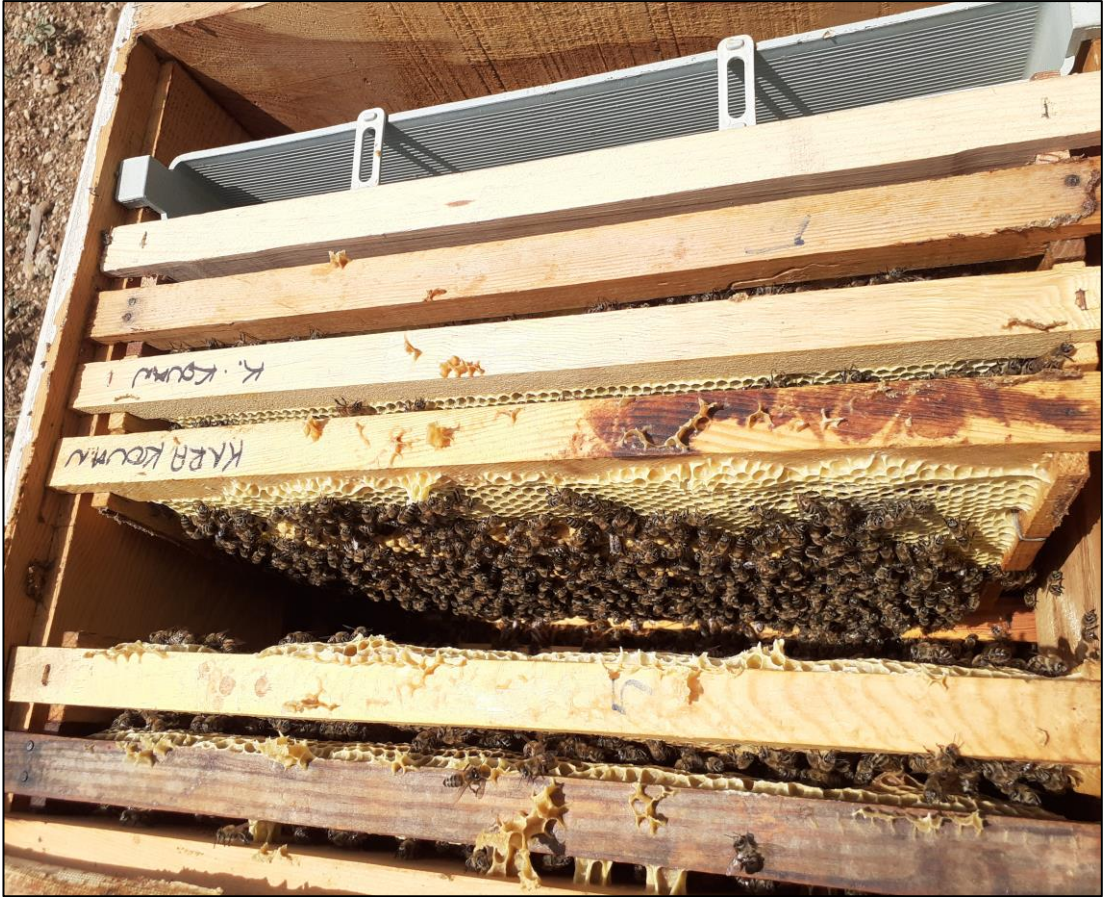
Şekil A.12. Kovan içi görünümü