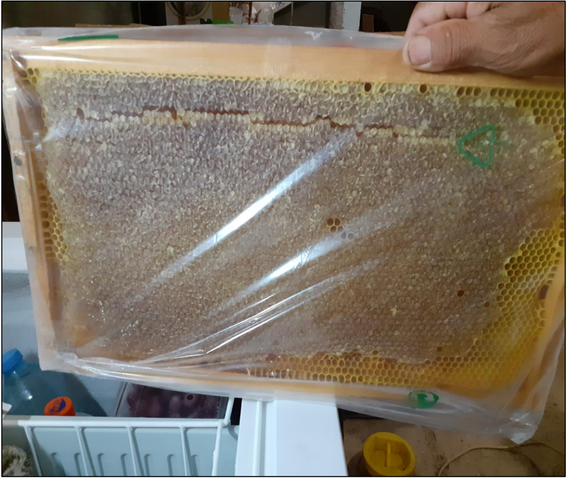
Şekil A.14. Petek lavanta balı