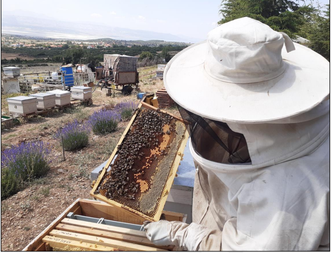
Şekil A.11. Arı kovanında varova kontrolü