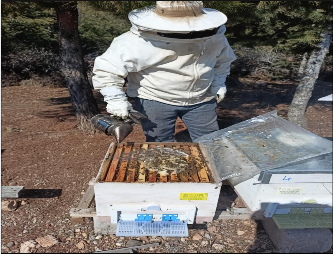
Şekil A.6. Arı kovanı takibi