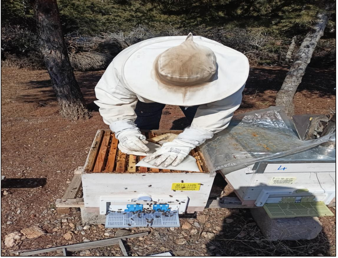
Şekil A.7. Arı kovanına kek verilmesi