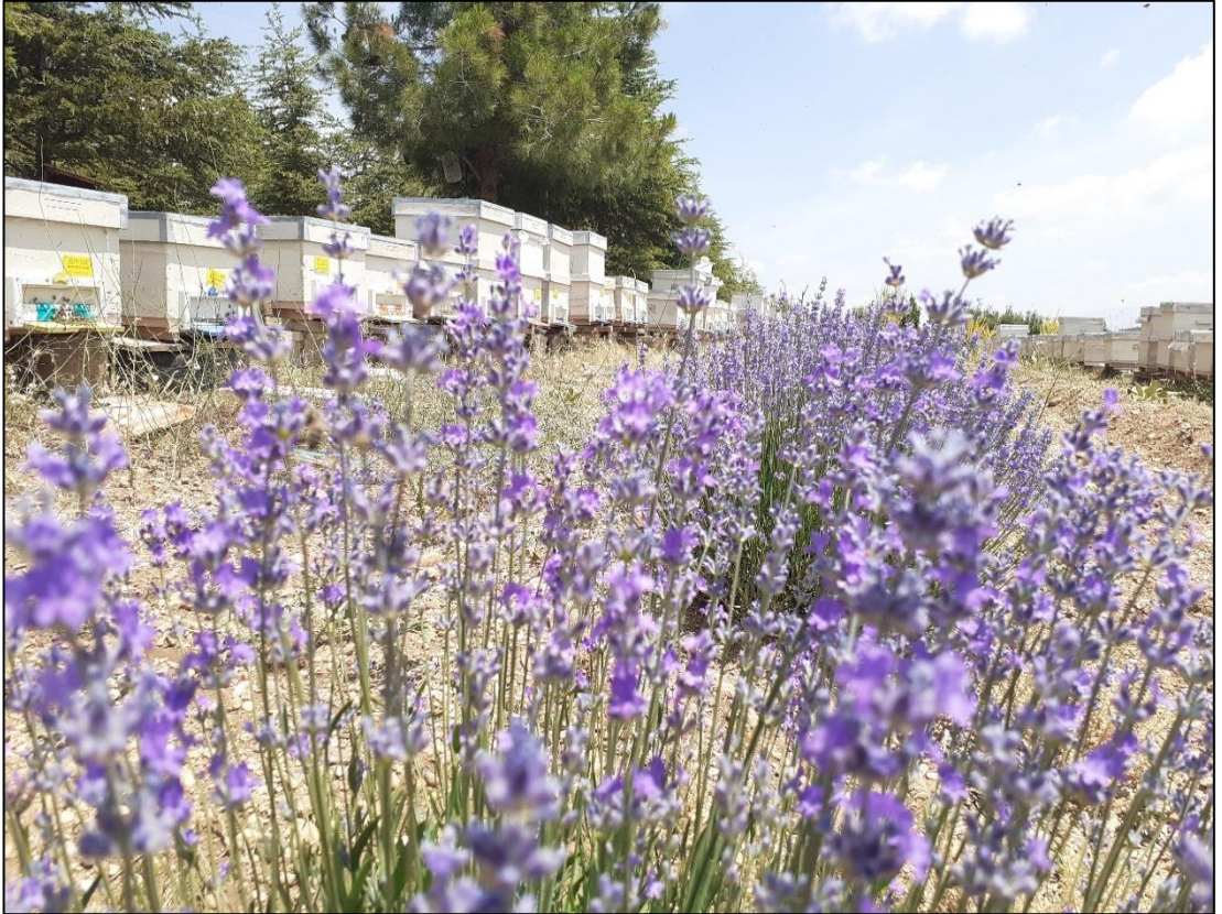
Şekil A.2. Lavanta balı üretim alanı (b)