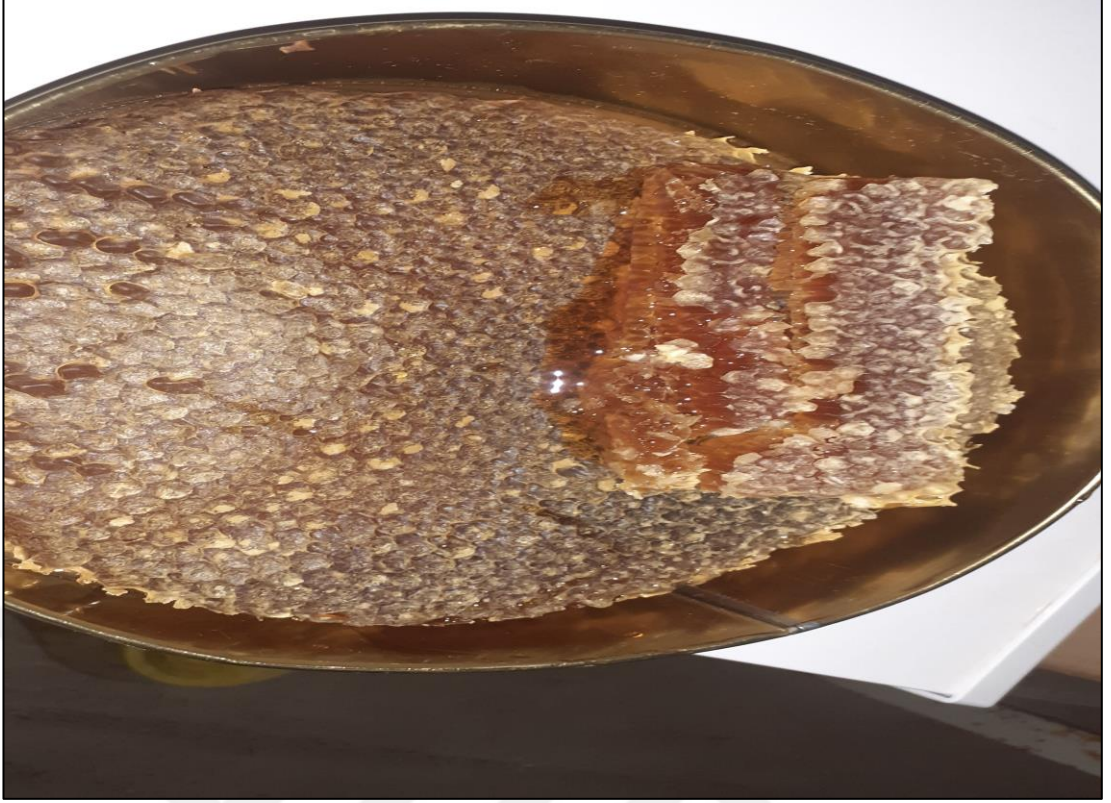
Şekil A.13. Karakovan lavanta balı