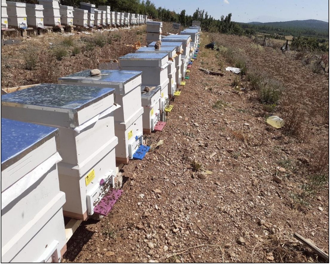
Şekil A.3. Arı kovanları (a)