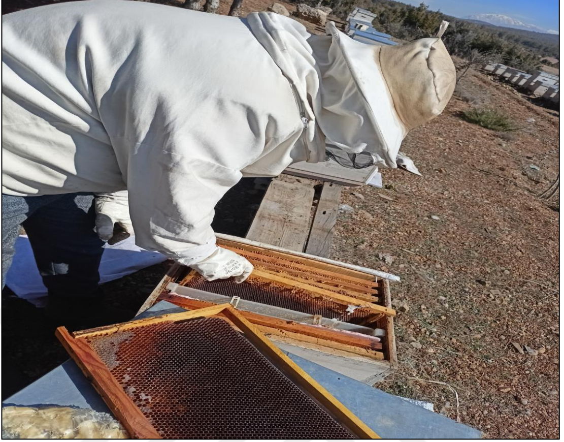
Şekil A.9. Arı kovanında bal takibi (a)