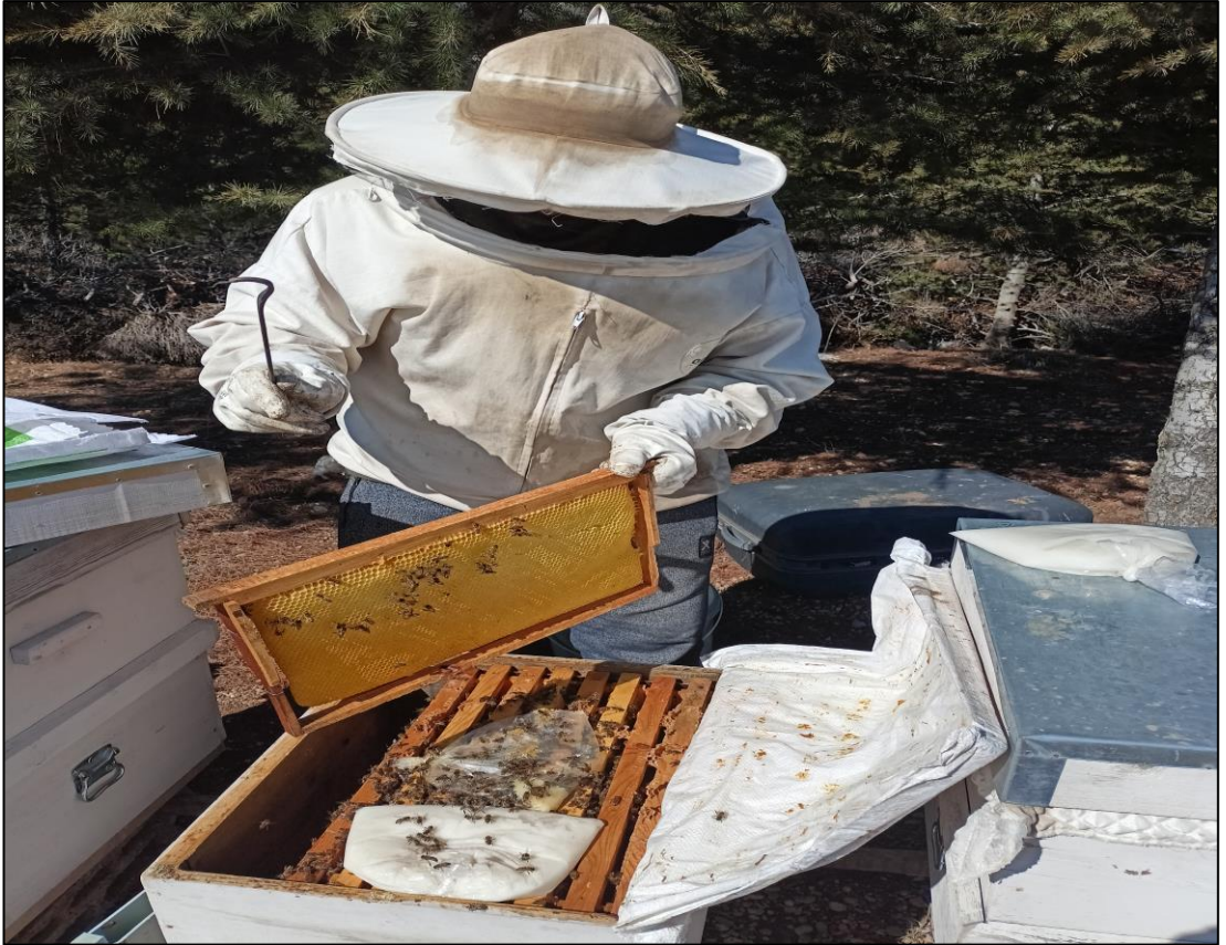
Şekil A.8. Arı kovani yavru kontrolü