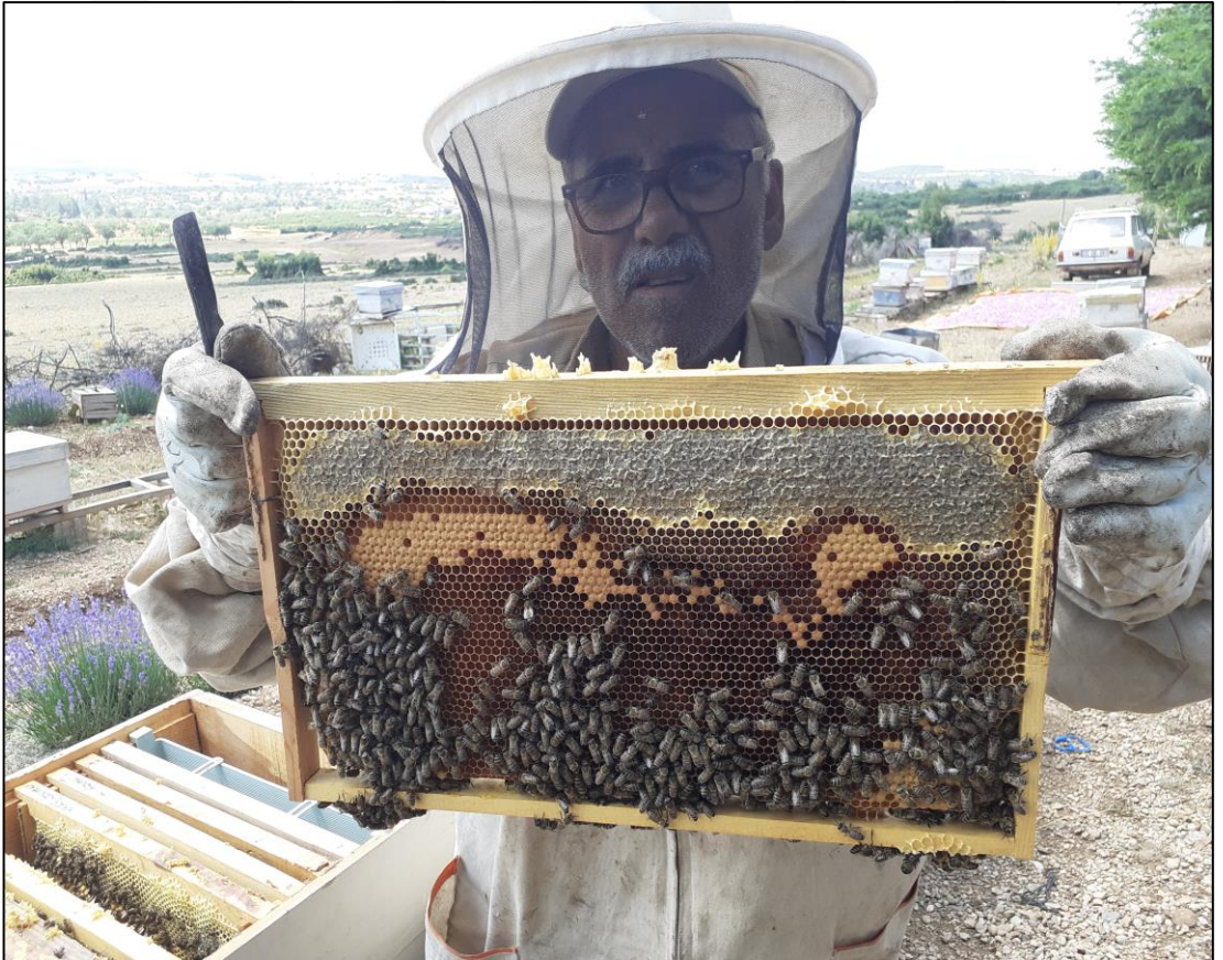
Şekil A.10. Arı kovanında bal takibi (b)