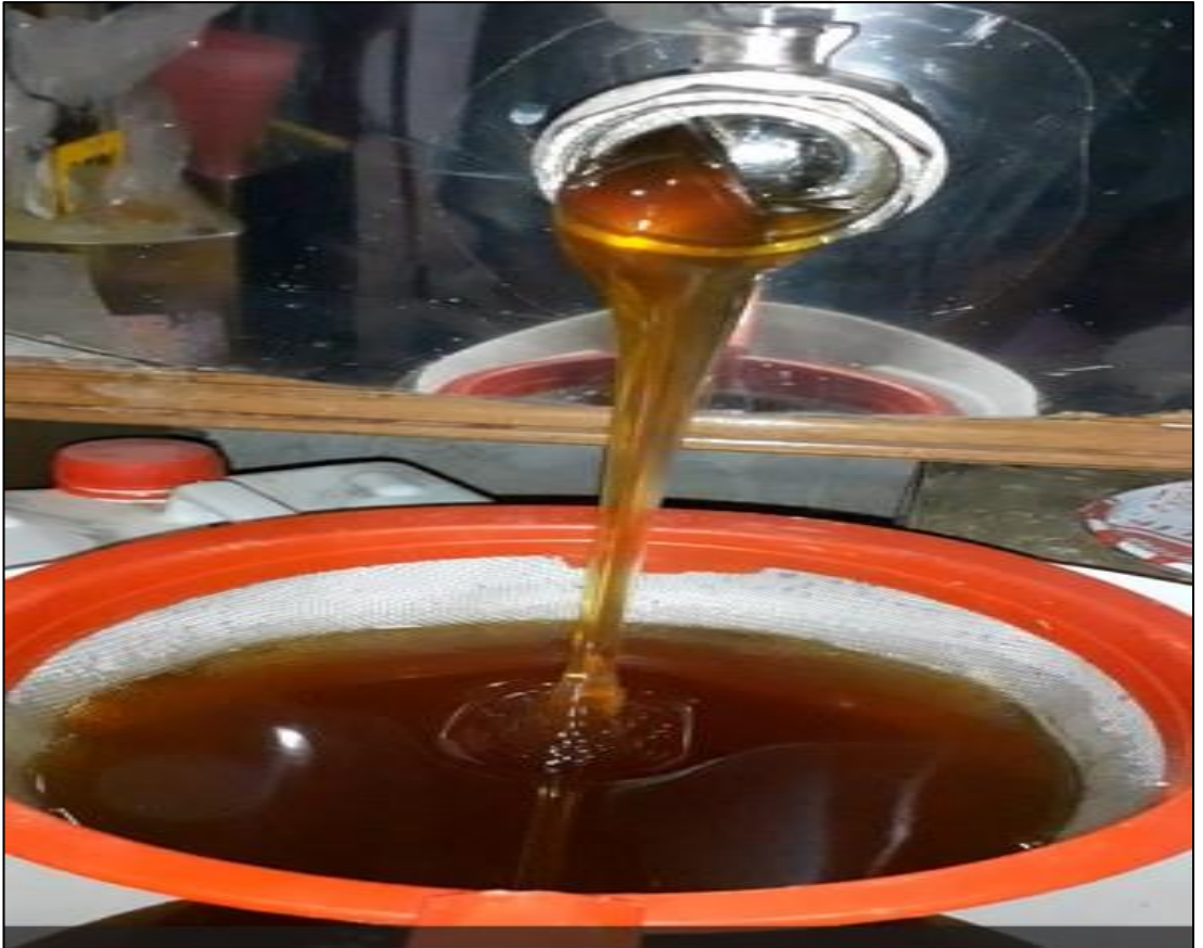
Şekil A.16. Lavanta balının süzme işlemi