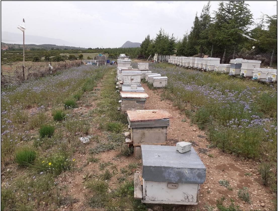
Şekil A.4. Arı kovanları (b)