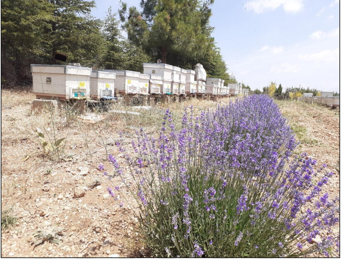
Şekil A.1. Lavanta balı üretim alanı (a)