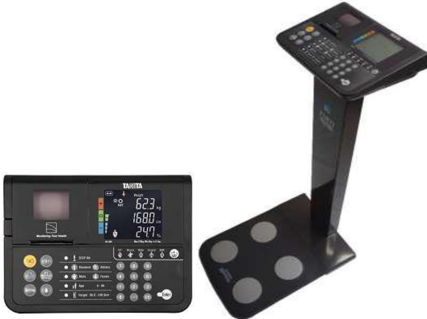
Resim 2. Tanita DC 360 ST vücut analizi cihazı