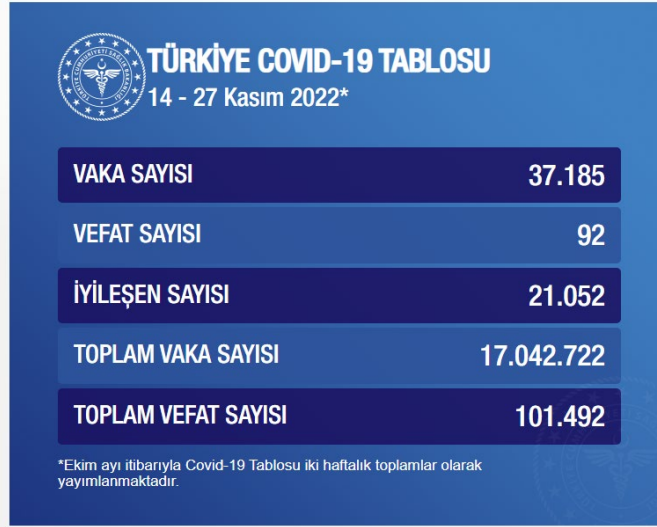
Tablo 1.1. Türkiye Covid-19 Tablosu