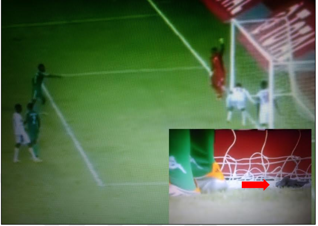
Şekil 3. 6: Senegalli futbolcu Ndiaye, muska benzeri nesneyi kaleye atarken.