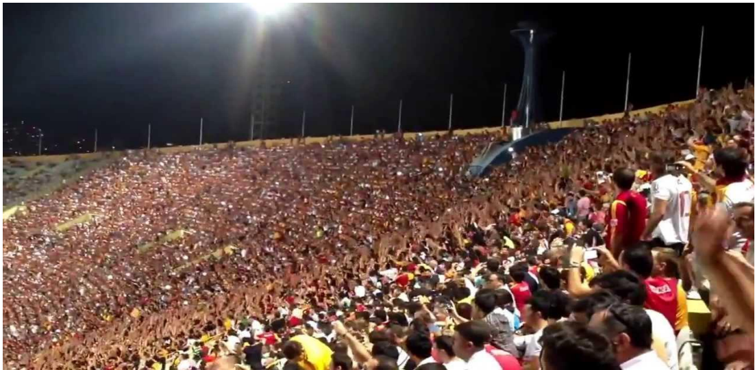
Şekil 3.11: Taraftarların ellerini havaya kaldırarak oluşturdukları Meksika Dalgası. ( https://i.ytimg.com/vi/pRAvs4CGO8g/maxresdefault.jpg ) Erişim: 15 Aralık 2018.

Futbol maçlarında taraftarların görsel olarak yaptıkları şovlardan biri olan Meksika Dalgası ise takım öndeyken tribünde sırası gelen kişilerin aynı anda ayağa kalkarak ellerini havaya kaldırarak oluşturduğu insan dalgasıdır. İlk olarak 1986 Meksika Dünya Kupasında yapılan Meksika Dalgası daha sonra tüm dünyaya yayılmıştır ( https://www.gzt.com ). Taraftarların yapmış olduğu bu uygulama alışkanlık halini alarak tüm statlara yayılan bir ayine benzemektedir.