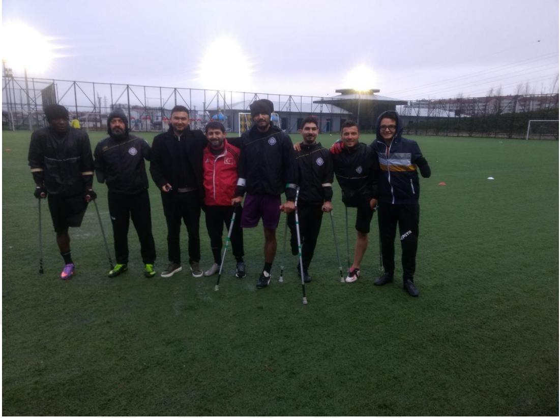
Şekil 2: Osmanlı Engelliler Spor Kulübü futbolcuları ile derleme sonrasında.