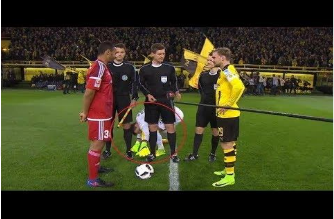
Şekil 3. 8: Borussia Dortmund takımının kalecisi Roman Bürki, topa dokunurken. ( https://img.youtube.com/vi/nyYTr8YNP30/0.jpg ) Erişim: 15 Aralık 2018.

Dortmund formasını terleten Roman Bürki, maç öncesi futbol topuna dokunmadan maça başlamamaktadır ( https://www.haberler.com ).