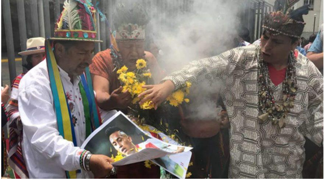
Şekil 3. 4: Peru-Yeni Zelanda maçı öncesi yerli büyücüler tarafından yapılan büyü ayini.