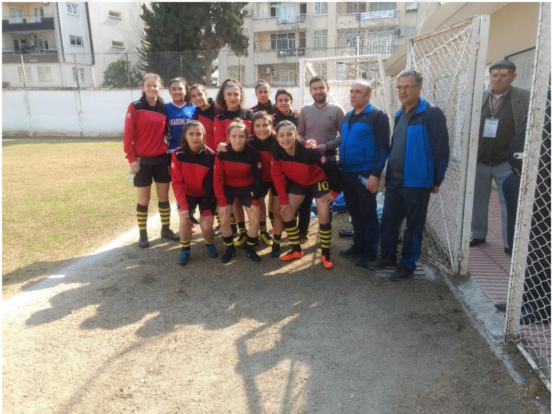
Şekil 3: Gazi Lisesi Spor Kulübü futbolcuları ile derleme sonrasında.