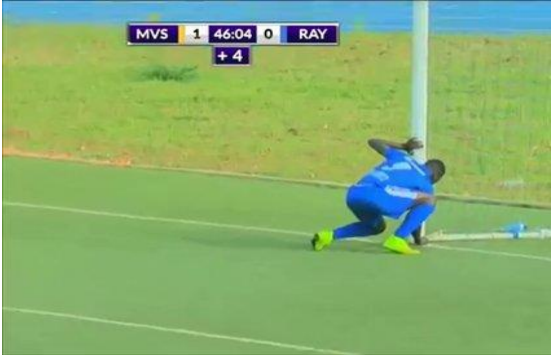
Şekil 3. 3: Rayon Sportslu futbolcu Moussa Camara, kale önündeki nesneyi alırken.

Afrika ülkesi olan Ruanda'da ise ligde Mukura Victory Sports ile Rayon Sports takımları arasında oynanan futbol maçında Mukura Victory Sports takımının büyü yaptığı iddia edilmiştir. Mukura Victory Sports takımı 1-0 öne geçtikten sonra Rayon Sports takımının yaptığı ataklarda mutlak gol pozisyonları kaçırmıştır. Rayon Sports takımında oynayan Moussa Camara, rakip kale direği dibindeki bir nesneyi alarak kendi yedek kulübesine götürmeye çalışmıştır. Bu esnada rakip takımın oyuncuları büyü nü nesneyi alan Moussa Camara'yı kovalamaya başlamıştır. Daha sonra hakem Moussa Camara'ya sarı kart göstermiştir. Büyü nü nesneyi alan Camara, yedi dakika sonra golünü atarak takımını beraberliğe taşımış ve maç bu sonuçla tamamlanmıştır ( http://www.milliyet.com.tr/Skorer-Tv/video-izle/Futbol-tarihi-bunu-da-gordu--Buyu-yaptilar----f1plCG7MvLxr.html ).