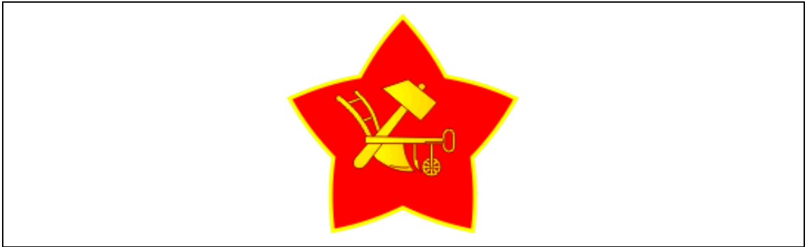
Şekil 3.8. Orak ve Pulluk

Orak ve çekiş sembolü SSCB devlet arması üzerinde kullanılmaya 1918 yılında başlanmıştır. Sovyetler Birliği armasında ve dünyanın farklı ülkelerindeki komünist parti amblemlerinde kullanılmaktadır. İşçi sınıfının “proletariat” sembolü olan çekiç ve Rus armacılığında hasat ve ürünün sembolü olan orak 1918 yılında bir araya getirilerek yeni bir düşünceyi temsil etmeye başlamış, böylece orak ve çekiç işçi sınıfının hâkimiyetinin ve köylü ve işçilerin birliğinin sembolü olmuştur. Orak ve çekiç sembolünü bir araya getiren kişi 1918 yılında İşçilerin Dayanışma günü kutlamaları için bir afiş hazırlamaya çalışan ressam Yevgeniy Kamzolkin'dir. Orak ve Çekiç sembolünü Moskova Şehir Konseyince (Mossovet) diğer seçenekler olan çekiç ve örs, kılıç ve pulluk, tırpan ve İngiliz anahtarı gibi farklı çalışmalar arasından seçilmiştir (Samıye vliyatelnıye simvolı v istorii çeloveçestva). Daha sonra bu sembol çok beğenilerek devlet armasında da kullanılmaya başlanmıştır. Orak ve çekiç armasından önce orak ve pulluğun bir dönem kullanıldığı da bilinmektedir ( Şekil 3.8).