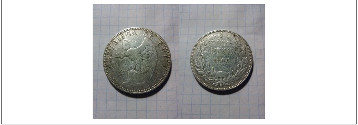
Şekil 3.7. 1895 yılına ait üzerinde orak ve çekiç bulunan 1 peso