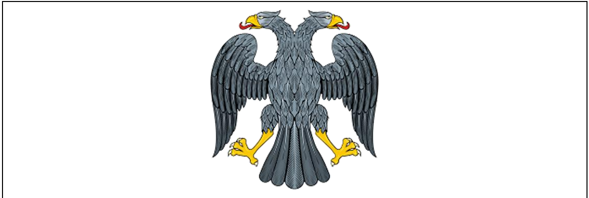
Şekil 3.2. SSCB geçici Devlet arması

Rus devlet arması olan çift başlı kartal değişik prensler ve çarlar döneminde küçük farklılıklara uğrayarak kullanılmaya devam etmiştir. Ancak 1917 yılında Şubat devriminden sonra Maksim Gorki'nin başkanlığında yapılan sanat konularıyla ilgili özel toplantıda yeni devlet armasının oluşturulması amacıyla çalışmalar başlatılmıştır. Komisyon içerisinde tanınmış A.N. Benua, N.K. Rerih, İ.Ya. Bilibin, V.K. Lukomski gibi ressam ve sanatçılar bulunmaktaydı. Bu heyet geçici hükümetin çift başlı kartalın mühür olarak kullanılabilmesine karar vermişlerdir. Ancak temel olarak II. İvan'ın mühründe bulunan şekilden yola çıkılarak İ.Ya. Bilibin tarafından hazırlanan bu mühürde tüm otoriter rejimin hâkimiyet göstergelerinin çıkartıldığı bir tasarım kullanılmıştır (Şekil 3.2). Çift başlı kartal tasviri Ekim devriminden sonrada yeni Sovyetler Birliği armasının kabulüne kadar kullanılmaya devam etmiştir (RİA Novosti). Çift başlı kartal işareti her üç Rus hanedan ailesi Rurikler, Godinovlar ve Romanovlar tarafından kullanılmış, ayrıca geçici sosyalist hükümetinde arması olmuştur (Dvuglavnıy orel-naslediye predkov).