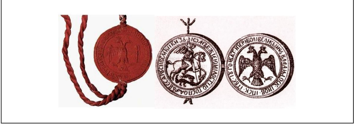
Şekil 3.1. III. İvanın mührü

Rus devlet arması olan çift başlı kartal değişik prensler ve çarlar döneminde küçük farklılıklara uğrayarak kullanılmaya devam etmiştir. Ancak 1917 yılında Şubat devriminden sonra Maksim Gorki'nin başkanlığında yapılan sanat konularıyla ilgili özel toplantıda yeni devlet armasının oluşturulması amacıyla çalışmalar başlatılmıştır. Komisyon içerisinde tanınmış A.N. Benua, N.K. Rerih, İ.Ya. Bilibin, V.K. Lukomski gibi ressam ve sanatçılar bulunmaktaydı. Bu heyet geçici hükümetin çift başlı kartalın mühür olarak kullanılabilmesine karar vermişlerdir. Ancak temel olarak II. İvan'ın mühründe bulunan şekilden yola çıkılarak İ.Ya. Bilibin tarafından hazırlanan bu mühürde tüm otoriter rejimin hâkimiyet göstergelerinin çıkartıldığı bir tasarım kullanılmıştır (Şekil 3.2). Çift başlı kartal tasviri Ekim devriminden sonrada yeni Sovyetler Birliği armasının kabulüne kadar kullanılmaya devam etmiştir (RİA Novosti). Çift başlı kartal işareti her üç Rus hanedan ailesi Rurikler, Godinovlar ve Romanovlar tarafından kullanılmış, ayrıca geçici sosyalist hükümetinde arması olmuştur (Dvuglavnıy orel-naslediye predkov).