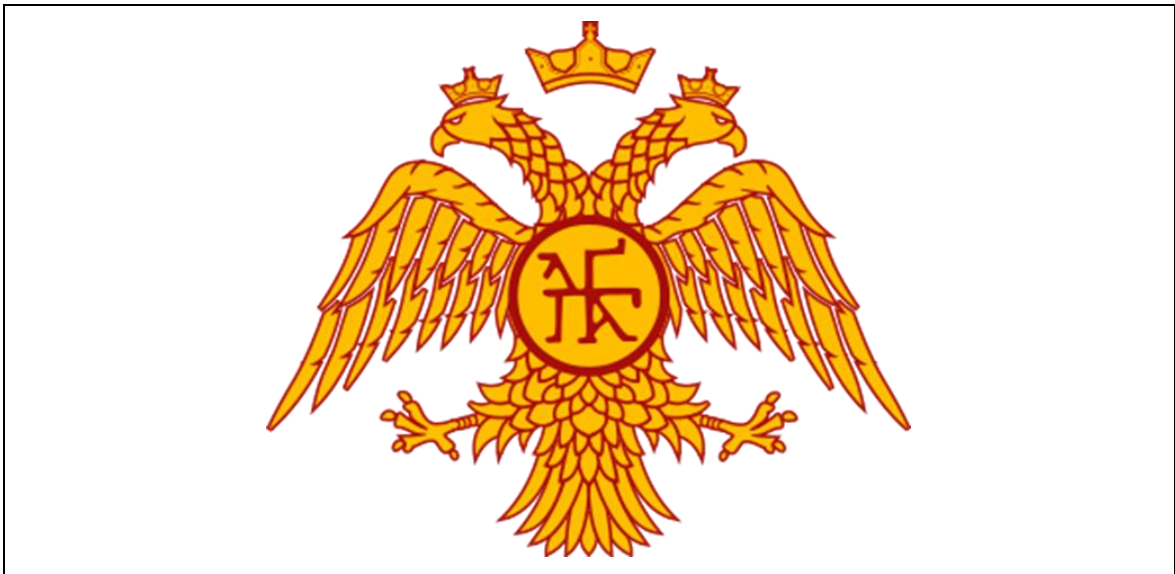
Şekil 3.4. Bizans Arması

Sovyet devrimi öncesinde Rus armasında bulunan çift başlı kartal Rusya tarihinin geçmişten geleceğe sürekliliğini temsil eder. Bilindiği gibi Rus devletinin batı topraklarında ve eski büyük Rus şehirlerinde kartal yaşamamaktadır, bu nedenle kartal Ruslar için geçmişte hiçbir zaman milli bir sembol olarak bir anlam ifade etmemiştir (Dvuglavnyy orel v gerbe Rossii). Çift başlı kartal arması Ruslara Bizans'tan geçmiştir. Bu arma ilk olarak Bizans imparatoru Konstantin tarafından 326 yılında kullanılmıştır. Çift başlı kartal Roma imparatorunun doğu ve batı toprakları üzerindeki hâkimiyetini sembolize etmektedir. Çift başlı kartal Bizans İmparatorluğunda 1453 yılına kadar kullanılmıştı (Şekil 3.3). Bizans'ın en uzun süreli hanedanı olan Paleologos'lara ait olan bu hanedan arması Anadolu ve Balkanlardaki tüm küçük Ortodoks devletler ve Bizans Türkler tarafından ele geçirildikten sonra Ortodoks Kilisesine bağlı tek askeri ve ekonomik güç olan Rus devletine geçmiştir. Bizans'ın yıkılmasından sonra Moskova Prensiğinde ortaya çıkan "Moskova - 3. Roma" düşüncesinin göstergesidir (Ranchugova). Son Bizans imparatorunun yeğeni olan Sofiya Fominiçna Paleolog III. İvan'ın eşi, III. Vasili'nin annesi ve IV. İvan Grozniy'nin büyük annesiydi (Gerb Rossii –Russkiy Ekspert).