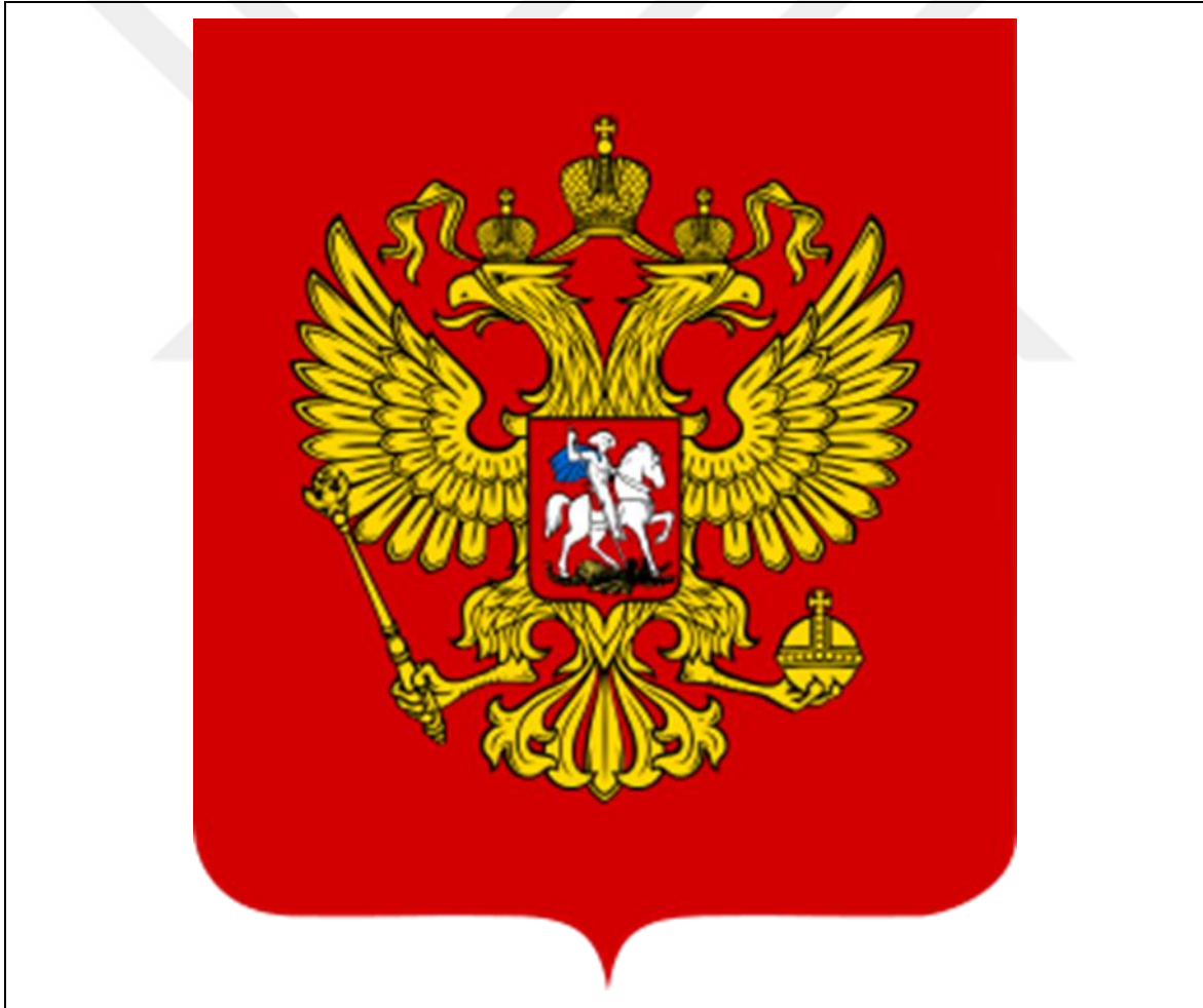
řekil 3.3. Rusya Federasyonu Devlet Arması (1993- )

SSCB (Sovyet Sosyalist Cumhuriyetler Birliđi) den sonra oluřturulan RSFSC (Rusya Sovyet Federal Sosyalist Cumhuriyeti) hıkümeti tarafından 5 Kasım 1990 tarihinde bir devlet arması ve bayrađının belirlenmesi iin karar alınmıř ve hayata geirilmesi iin hıkümet komisyonu kurulmuřtur. Yapılan ok ynl alıřmalardan sonra hıkumete beyaz-mavi-kırmızı renklerden oluřan bayrak ve kırmızı zemin üzerinde ift bařlı altın kartalın tasvir edildiđi devlet arması tavsiyesinde bulunulmuřtur. Kesin olarak bu devlet arması ve bayrađının kabul edilmesi 1993 yılında Boris Yeltsin'in kararnameyi imzalamasıyla gerekleřmiřtir (řekil 3.3).