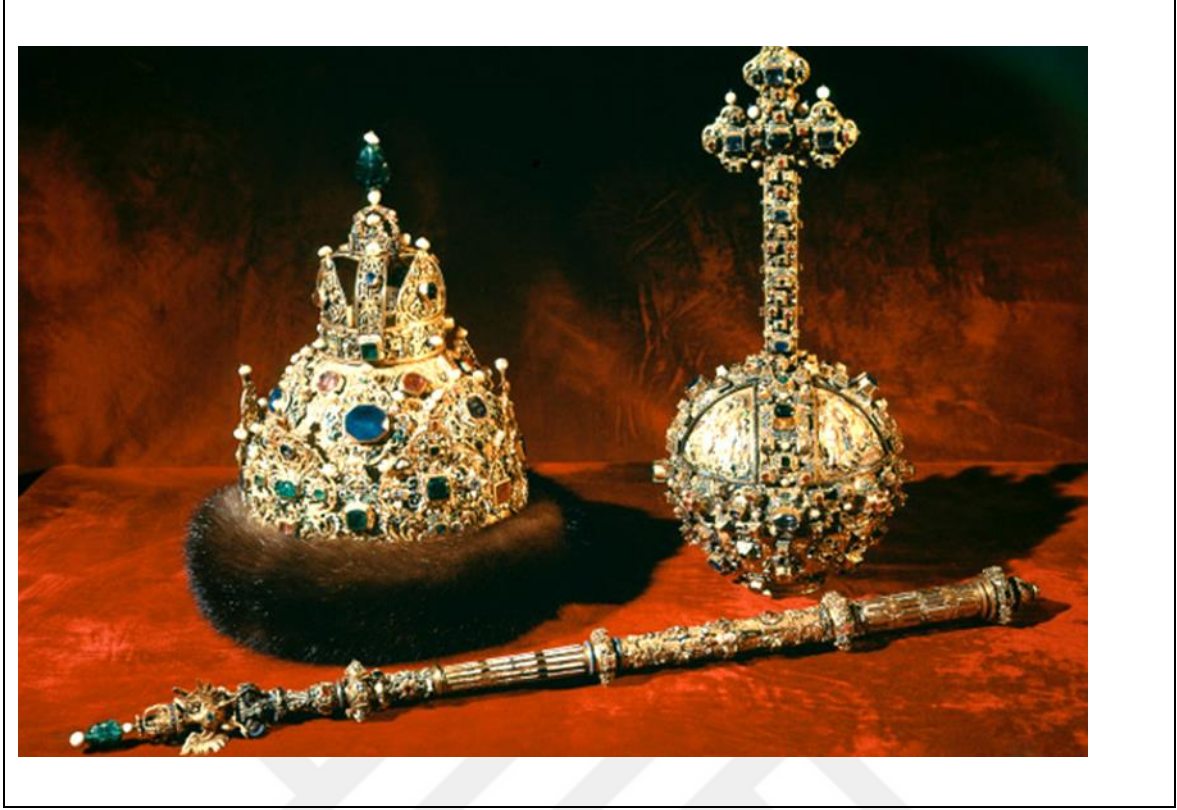
Şekil 3.5. Rus Çarlık tacı, asa ve derjava

Asa, Tanrının veya kralın hâkimiyetini, otoritesini, iktidarını, yaşam gücü bağışlamasını, sihirli değneği temsil eder. Cennetin tanrılarının, hükümdar ve büyücülerin gücünü taşır. Hristiyanlıkta otoriteyi temsil eder, baş melek Gabriel'in amblemidir (Kuper, 1995: 304).