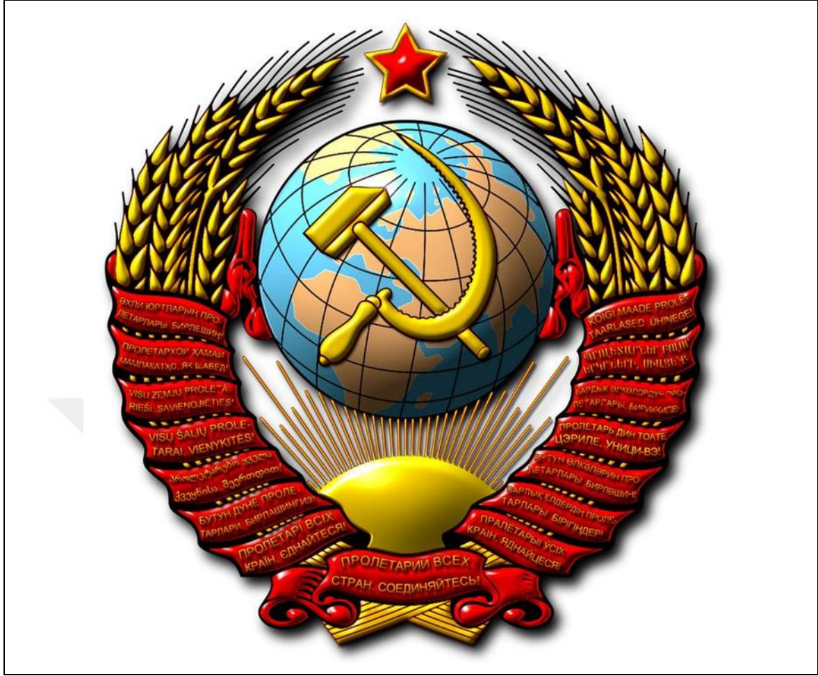
Şekil 3.6. SSCB Devlet arması