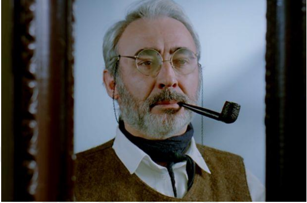
Şekil 4:11: Aşk Filmlerinin Unutulmaz Yönetmeni

Jeyan'ın sözlerinden de anlaşılacağı üzere, o ne yapsa “dışarıda” kalacaktır. Haşmet ise bu dışlanmaya tepkisini şöyle dile getirir: