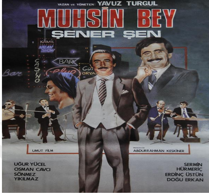
Şekil 4:13: Muhsin Bey Afışı

Muhsin Bey filmi afişinin Aşk Filmlerinin Unutulmaz yönetmeni kadar okunabilir olduğu söylenemez ancak hikâyenin temel unsurlarını da yansıtır. Muhsin'in ön planda kendinden emin duruşu yaşayacağı durumlarla zıtlık oluşturur. Arkada ona nazaran büyük bir gülümsemeye beliren Ali Nazik'in ya da Sevda Hanım'ın ise filmde önemli öğeler olduğu anlaşılır. Muhsin Bey'in dünyasını tanımlayan fasıl ekibi ve birlikte çalışmak zorunda olduğu ikinci sınıf mekânlar ise katmanlı olarak posterde yerini almıştır.