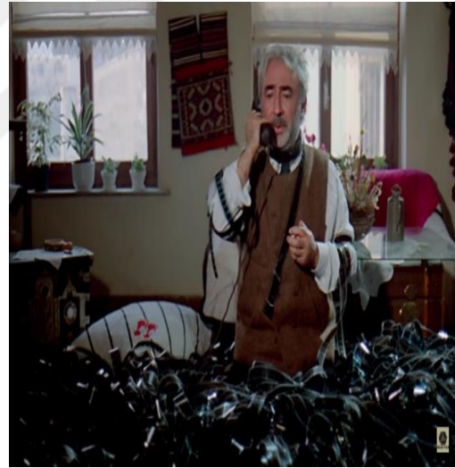
Şekil 4:5: Aşk Filmlerinin Unutulmaz Yönetmeni

Aşk Filmlerinin Unutulmaz Yönetmenin'deki Haşmet karakteri, Yeşilçam'ın klasik üretimler yapan, ortalama bir yönetmenken, entelektüel camiaya katılmak ister. Eğer zamanın kodlarına uygun, metforik bir film yaparsa kabul edileceğini ve geçmişinden sıyrılabileceğini düşünür. Oysa günün sonunda dertleşebileceği, onun zamanın hızı karşısında bir kaplumbağa gibi kaldığını hatırlatan bir sembol olarak,