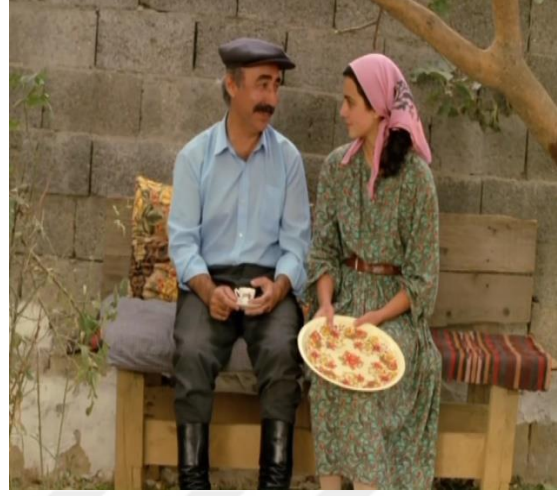
Şekil 3:2: Züğürt Ağa

Bir diğer dikkat çeken özellik, Yavuz Turgul filmlerinin “ masalsı” yanıdır. Masal burada bir kandırmadan ziyade kendi düzlemi içinde oldukça gerçek ancak gerçek dünyayla karşılaştığında fantastik kalabilen bir yaklaşımı ifade eder. Turgul’un yaşama farklı bir açıdan bakma ve yeni bir kurgusal düzenden hikâye anlatma isteği onu sıradanlıktan uzak tutmuştur. 113 Gerçekdışı kalabilen karakterler, filmde bir karikatür yanılgısı yaratır. Oysa istemedikleri, uyum sağlayamadıkları yapay bir hayatı yaşamak zorunda kalan karakterlerden çok diğerleri gariptir. 114 Gölge Oyunu’nda ise bahsedilen masalsı yapı yerini tam manasıyla bulur. Ana karakterler kendilerini bir gizem içinde bulur ve sadece onların gördüğü bir kadın sayesinde olgunlaşma hikâyeleri de başlar.