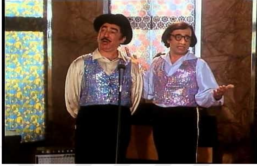
Şekil 3:3: Gölge Oyunu

Bilhassa, Türk sinemasında dışşal çatışmalara maruz kalan tek bir kahramanla ilerleyen klasik yapı, genellikle, gelişmede yenilgiler, mücadeleler ve çözüm bölümünde başarılarla tamamlanır. Yeşilçam düzeninden gelmiş bir yönetmen olarak klasik anlatıya bir yönüyle sadık kalan Turgul'un farklılaştığı noktalar özellikle karakter hususundadır. Karakterlerin toplum içinde savaştığı dış etkenlerin yanı sıra içsel çatışmaları da büyük önem taşır. 115 Bununla birlikte kahramanlar güçsüzlükleri, zayıf noktalarıyla daha insani yansıtılır ve filmin sonunda bilindik manada bir zafere ulaşmazlar. Değişen bir dünyada, her koşulda kazanmanın mümkün olmadığı ya da direnme sürecinin sonuçtan daha önemli olabileceği resmedilir. Kahramanlar hem sorunlarıyla tanıdık hem de Türk sineması açısından özgündürler. Acılar, umutlar, insani duygular evrenseldir ancak, karakterlerin içine düştüğü durumlar, bulunulan dönemle ilgili çelişkiler kaynağını yerel olandan alır. Eşkîya'daki Baran karakteri ya da Gönül Yarası'ndaki Nazım öğretmen Türkiye'de'n ve bu ülkedeki gelenek ya da modernleşme sürecinden çıkmış kahramanlardır. 116 Sinematografik olarak desteklenen karakterlerde dair ayrıntı ve yakın plan çekimler Turgul'u Yeşilçam'dan ayrı bir noktaya taşır. 117