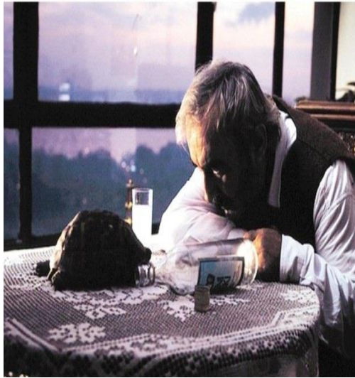
Şekil 4:4: Aşk Filmlerinin Unutulmaz Yönetmeni

Yeşilçam'ın yoğun bir üretimde olduğu 70'li yıllarda birlikte çalışan iki sinemacının karşılaştırılmasının sebebi, Turgul sinemasının oluşmasında geçmişten getirilen bazı geleneklerin de devam etmesidir. Tuluat geleneği, Karagöz, ortaoyununda iki karaktere dayanan yapıda, zıt karakterler çatışmalarla güldürü unsurunu oluşturur. Bu noktada Turgul trajikomik denebilecek detaylarla bu türü toplumsalın irdelendiği bir yordama dönüştürür. Mizah barındıran öğeler aynı zamanda hüznün de barındırır. Filmlerini Hacivat Karagöz'de olduğu gibi iki kahraman üzerinden işlemesi ise Muhsin Bey, Gölge Oyunu, Eşkîya gibi filmlerinin ortak özelliğidir. Bu iki karakter zıtlığa da, bir arada olmaya devam eder, bu anlamda da geleneksel orta oyunlarıyla benzer. 142