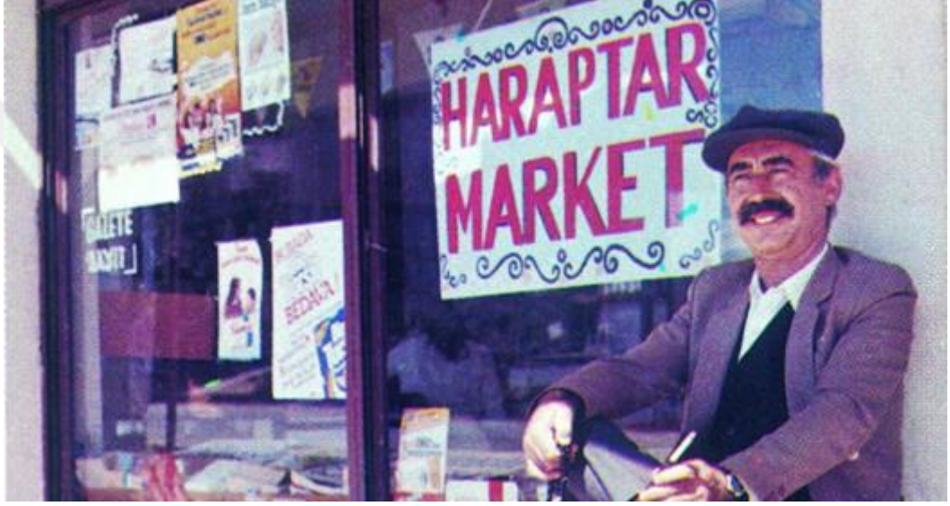
Şekil 4:1: Züğürt Ağa

Haraptar köyünü satmak zorunda kalır. İstanbul'a geldiğinde ise, ne ağalığı ne de köylüsünden gördüğü saygı kalır. Yardımcıyla girdiği her işte şehirde ticaret yapmaktan anlamadığı için batar. Ağalık çizmeleri dâhil, ağalığına dair her şeyi bırakmak zorunda kalır. İstanbul'da yaşamının nasıl bir zorluk olduğunu öğrendiğinde ve yeni yaşamını kabul ettiğinde ise küçük de olsa ümidine tutunur.