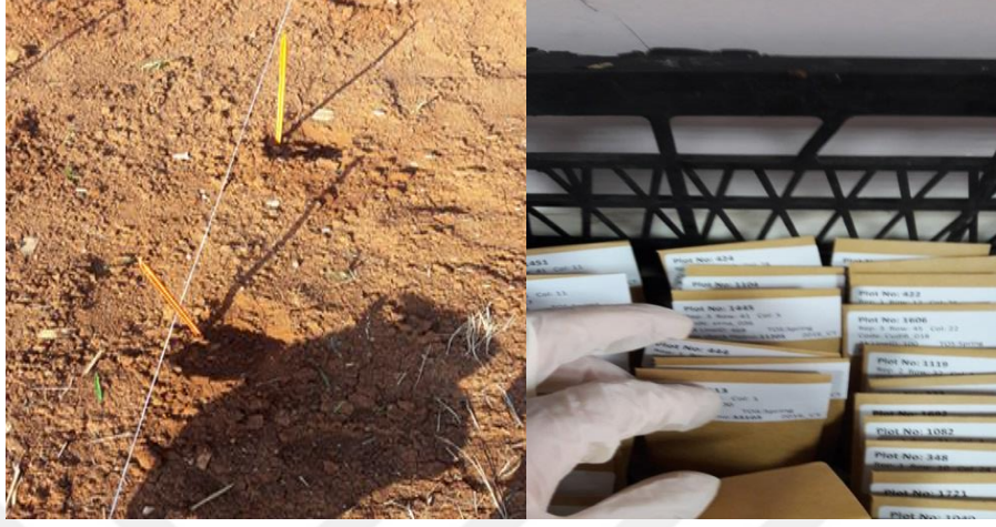
Şekil 3.2. Ekim hazırlığı

üzerine yapıştırıldı. Etiketler ekimden hasat sonrasına kadar elde edilen yeni bitkiden ayrılmadan bir arada tutulacak şekilde muhafaza edildi.