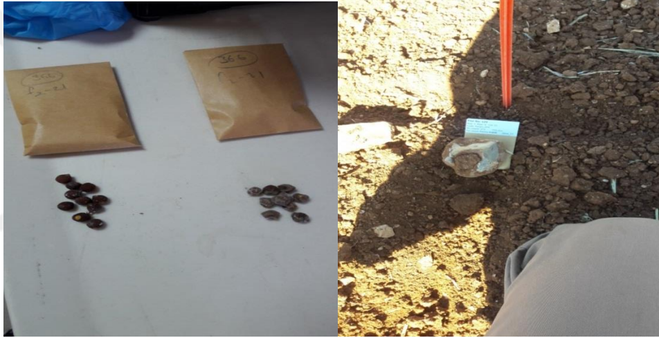
Şekil 3.1. Tohum Hazırlığı

Ekim öncesinde tohumları ekime hazırlamak için öncelikle tohumun daha erken çimlenmesi ve tohumun dormansisinin kırılması amacıyla tohum kabuğunda kesici bir alet (maket bıçağı, tırnak makası, zımpara, bıçak) yardımıyla çentik(nick) işlemi yapıldı. Ayrıca tohum çimlenmesini sağlayan ve zarar gördüğünde çimlenmeyi engelleyen kotiledonlara zarar verilmeden gerçekleştirildi.