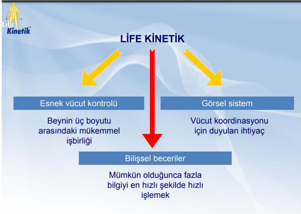
Şekil 2.1. Life kinetik bileşenleri.

Life kinetiği bir formül olarak açıklamak gerekirse; Görüş keskinliği kazanmak ve zihni uyararak harekete geçirmek olarak açıklanabilir. Sporcuların becerileri gelişim gösterdikçe zekâyı daha da geliştirmek için antrenman programına daha zorlayıcı egzersizler eklenilir. Life kinetik eğitiminin karmaşık ve benzersiz biçimi, yaşam boyu öğrenme ve fiziksel egzersiz arasındaki koordinasyonu sağlar. Dünya şampiyonlukları ve olimpiyat şampiyonlukları kazanan elit sporcular, life kinetik egzersizlerinin olumlu etkilerini görmüşler. Öte yandan, bilimsel araştırmalar, haftada sadece bir saatlik life kinetik antrenmanlarının, demans semptomlarını geciktirerek ve odaklanma becerisini artırarak zihinsel ve fiziksel sağlığı iyileştirdiğini gösteriyor (7).