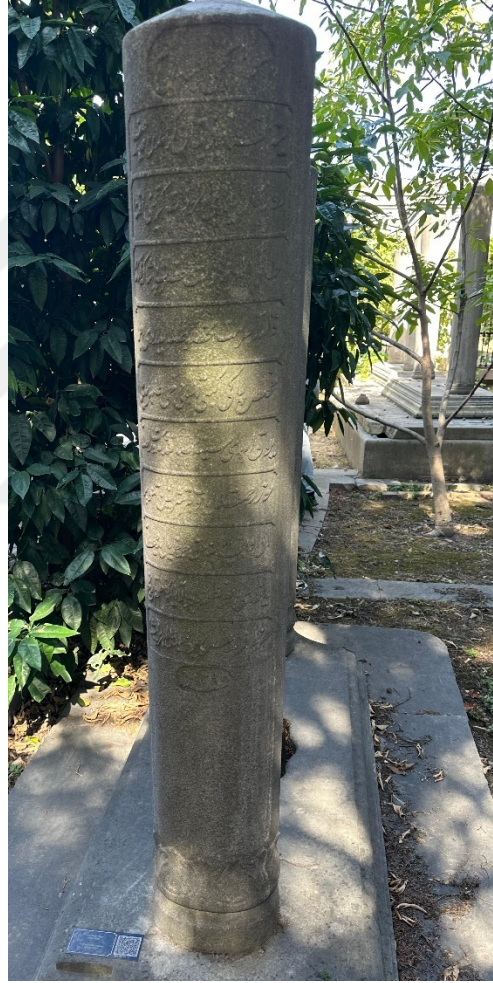
Tahir Paşa'nın Kabri Eyüp Sultan'da Sebil ile Hüsrev Paşa Kütüphanesi arasındaki Mihrişah Valide Sultan hazirsinde medfundur.

Bostanîzâde Tahir Paşa'nın ölümünden sonra dahi, onun eserleri ve öğretim metodları, Osmanlı eğitim sisteminde ve bilim dünyasında uzun yıllar etkili olmuştur. Osmanlı matematik tarihinde silinmez bir iz bırakan Paşa, Eyüpteki bir türbede son yolculuğuna uğurlanmıştır.