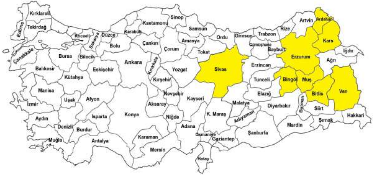
Şekil 2.1. Materyal sağlanan iller: Ardahan, Bingöl, Bitlis, Erzurum, Kars, Muş ve Van. Ayrıca Sivas ilinin Gürün ilçesi.)

Doğu Anadolu Bölgesi'nin Ardahan, Bingöl, Bitlis, Erzurum, Kars, Muş ve Van illerinin farklı habitatlarından (Şekil 2.1.1), Haziran-Ekim peyotlarında toplanan Aleiodes (Hymenoptera, Braconidae, Rogadinae) örnekleri bu çalışmada değerlendirilmiştir. Ayrıca Bitlis Eren Üniversitesi Fen Edebiyat Fakültesi Biyoloji Bölümü Zooloji Laboratuvarının koleksiyonunda bulunan Gürün (Sivas) ilçesine ait örnekler de değerlendirilmiştir. Materyal ince perdelik tülden yapılmış atrap, yardımıyla yaban otları, kültür bitkileri ve ağaçlar üzerinden toplanmıştır. Belirli yerlere de malasia tuzakları kurularak örnekler toplanmıştır. Ergin bireyler diğer materyalden aspiratör (emgi tüpü) yardımı ile ayrılmış ve sigara dumanı ile aspiratörde veya potasyum siyanür içeren öldürme şişelerinde derhal öldürülmüştür. Materyal depolama kapları içerisinde, %70'lik etil alkol ortamında laboratuara getirilmiş ve laboratuvarında korunmuştur.