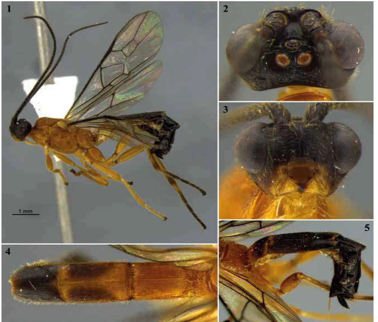
Şekil 1.1 -5. Aleiodes lamasi Sulca, Shimbori, Shaw, 2016)'ın vücudu. (1) vücudu (habitus), (2) baş (dorsal), (3) baş (frontal), (4) metasomal tergitler 1. – 3. (dorsal), (5) metasoma (lateral) (Sulca vd. 2016).

Bacaklar: Koksası, trochanter, femur, tibia ve tarsus segmentlerinden oluşur (Şek. 1, 5). Trochanter 2 ve tarsus 5 segmentlidir. Bacaklar orta büyüklükte olup nadiren iridirler. Ancak koksası az çok küçük, bazen geniş, dış yüzeyi değişik desenli veya düzdür (Tobias, 1986).