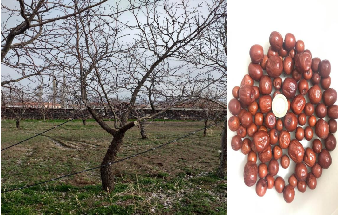
Şekil 2.1. Hünnap ağaç ve meyvesinin genel görünümü.

Hünnap ( Zizyphus jujuba Mill.) Çin kökenli bir bitki olup Hindistan, Rusya, Kuzey Afrika, Orta Doğu ve Anadolu'ya yayılmıştır. Ülkemizde Denizli, Aydın, Antalya gibi ılıman iklimin hakim olduğu yerlerde yaygın yetiştirilirken yağışa dayanıklı türleri Karadeniz'in Çoruh havzasında, soğuğa dayanıklı türleri Kayseri, Ankara, Aksaray gibi karasal iklimin hakim olduğu illerimizde yetiştirilebilmektedir. Hünnap bitkisi Rhamnaceae familyasına aittir. Morfolojik olarak ağaç veya çalı formda nadiren de otsu yapıdadır. Z.jujuba yaz aylarında sarı renkli çiçek açan, 4-11 metre yüksekliğinde bir ağaçta yetişen kırmızı kabuklu, sert çekirdekli bir meyvedir. Meyvenin en dış çeperi ince kabuklu ve olgunlaşmış safhası kahverengi, pulpası ise sarımsak ve tatlıdır (Kavas ve Dalkılıç, 2015). Şekil 2.1' de hünnap ağaç ve meyvesinin genel görünümü verilmiştir.