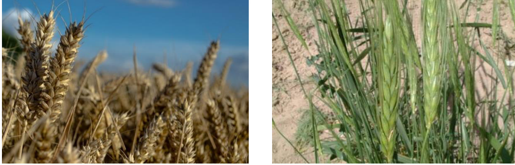
Şekil 1.1. Siyez Buğdayı ( Triticum monococcum L. )

Ülkemizde sadece Kastamonu ilinde 8000 dekar alanda yaklaşık olarak 2000 ton üretimi yapılan, bulguru yapılarak tüketime sunulan siyez buğdayının hasat sonrası kalan samanlarının ve ikinci ürün olarak ekilmesi durumunda da yeşil yem ya da silajlarının yapılarak hayvan beslemede kullanılabilirliğini belirlenmesi üzerine çalışmaya rastlanılmamıştır. Islah edilmemiş bir buğday çeşidi olması ve doğallığını koruması bakımından son zamanlarda ilgi odağı olan siyez buğdayı yetiştiriciliğinde oluşacak şartların uygun olması durumunda (ikinci ürün olarak ekilmesi, insan beslenmesinde kullanılmayacak şekilde sel vb. hasar görmesi, fiyatının çok ucuz olması vb.) özellikle kış aylarında hayvan beslemede kullanım amacıyla silajının yapılarak muhafaza edilmesi kaliteli kaba yem temini açısından önem arz etmektedir. Ayrıca hasat sonrası tarlada kalan sapları ile değirmencilik atıklarının (kepek vb.) da hayvan beslemede kullanılabilmesi mümkündür.