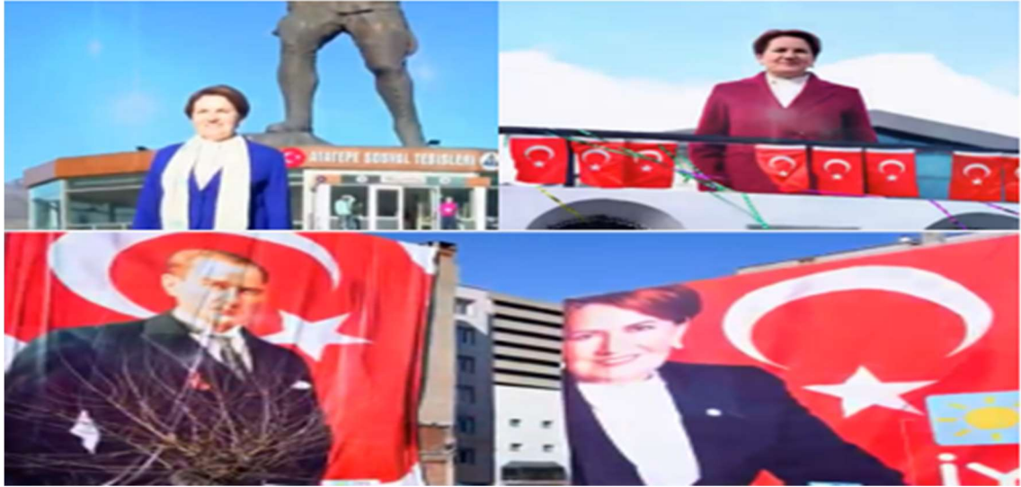
Resim 15. Reklam Filminde Yer Verilen Türk Benliği Kesitleri

Dış seste iletilmiş olan “Yüreğiyle Akşener Geliyor” sözlerinden kadın adayın tüm varlığını ve sevgisini “iyiler” yolunda “iyi” insanlara sunduğu anlaşılmaktadır. Başarısını kanıtlamak amacıyla karşısına çıkan engellere tüm yüreği ile karşı koymakta ve emektar hissi vermektedir. Reklam etkinliğinde yoğun olarak başarılı kadın temsili oluşturulmuş, bu temsil en çok miting konuşmalarında çekilen görseller ile desteklenmiştir. Reklam körlülüğü yaşanmaması adına seçmeni medyadan yani reklam filminden doğrudan etkileyecek görseller kullanılmıştır.