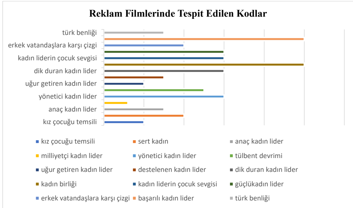
Tablo 7. Reklam Filmlerinde Tespit Edilen Kodlar

Çalışma sonucunda Meral Akşener'i temsil eden kodlar Tablo 7'de gösterilmiştir.