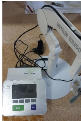
Şekil 2.2. Çalışmada kullanılan pH metre

Açılan silaj materyallerinden 25 g örnekleme yapılmıştır. Alınan örneklere 100 ml saf su eklenerek 5 dk süre ile karıştırılmıştır. Elde edilen karışımların pH değerleri Mettler Toledo marka pH metre (Şekil 2.2) kullanılarak ölçülmüştür.