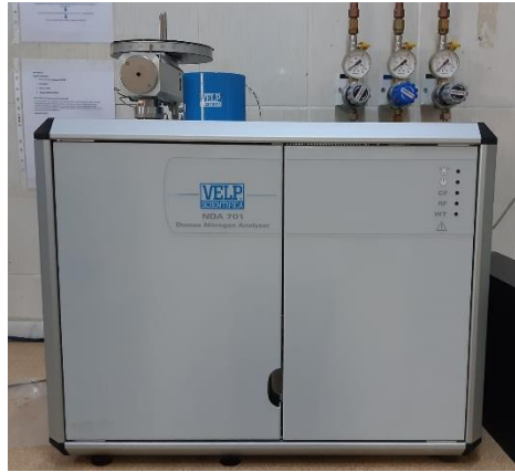
Şekil 2.3. Ham protein tayin cihazı