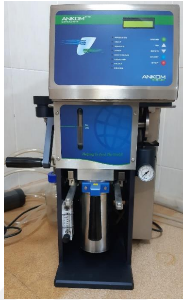
Şekil 2.4. Ham yağ analiz cihazı