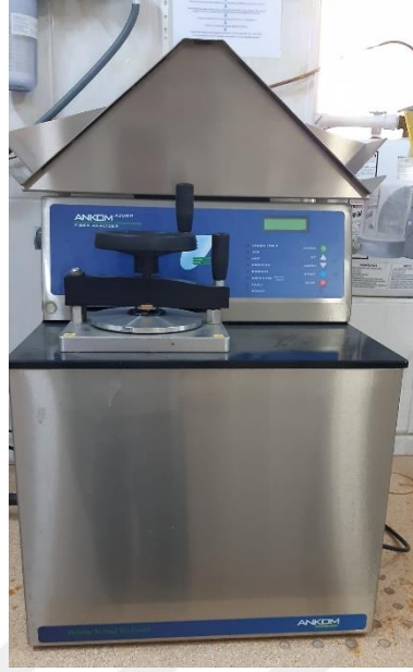
Şekil 2.5. ADF, NDF ve ham selüloz analiz cihazı