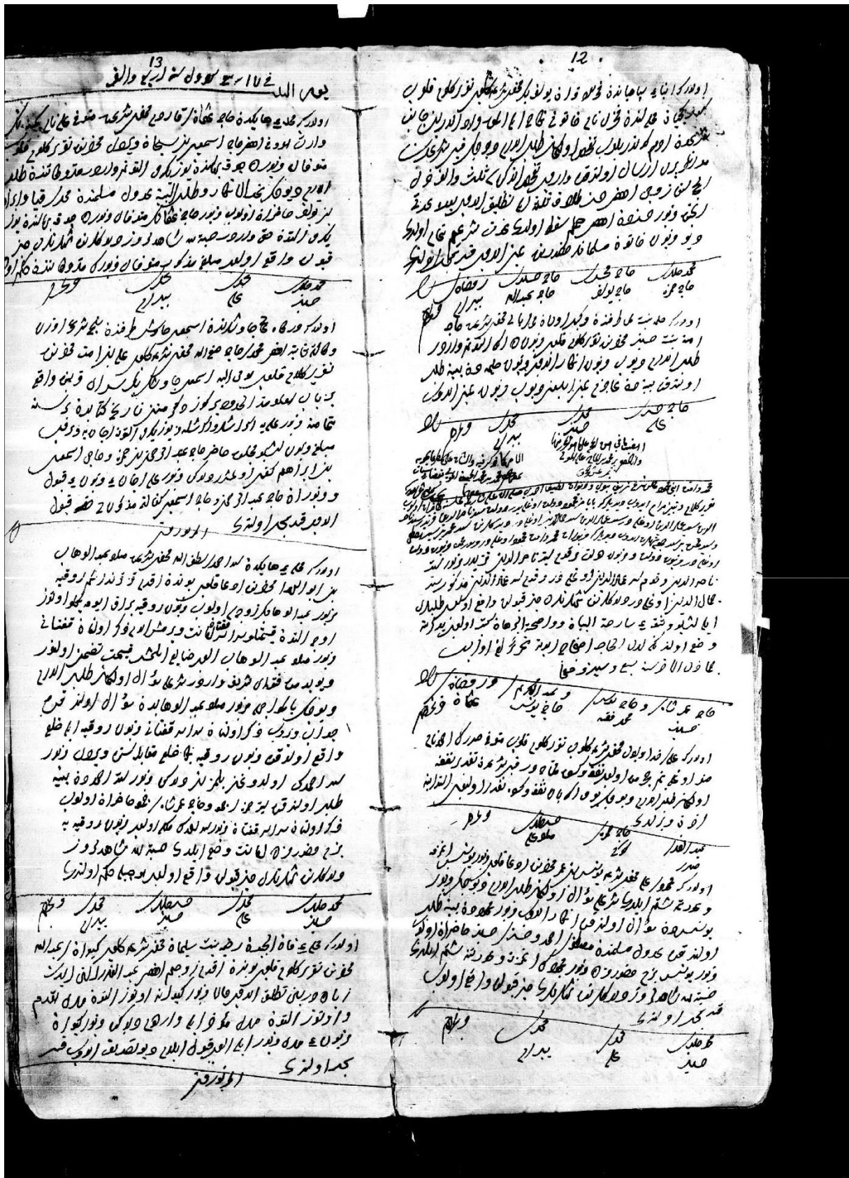
Ek 6: 42 Numaralı A.Ş.S, sayfa: 12-13.