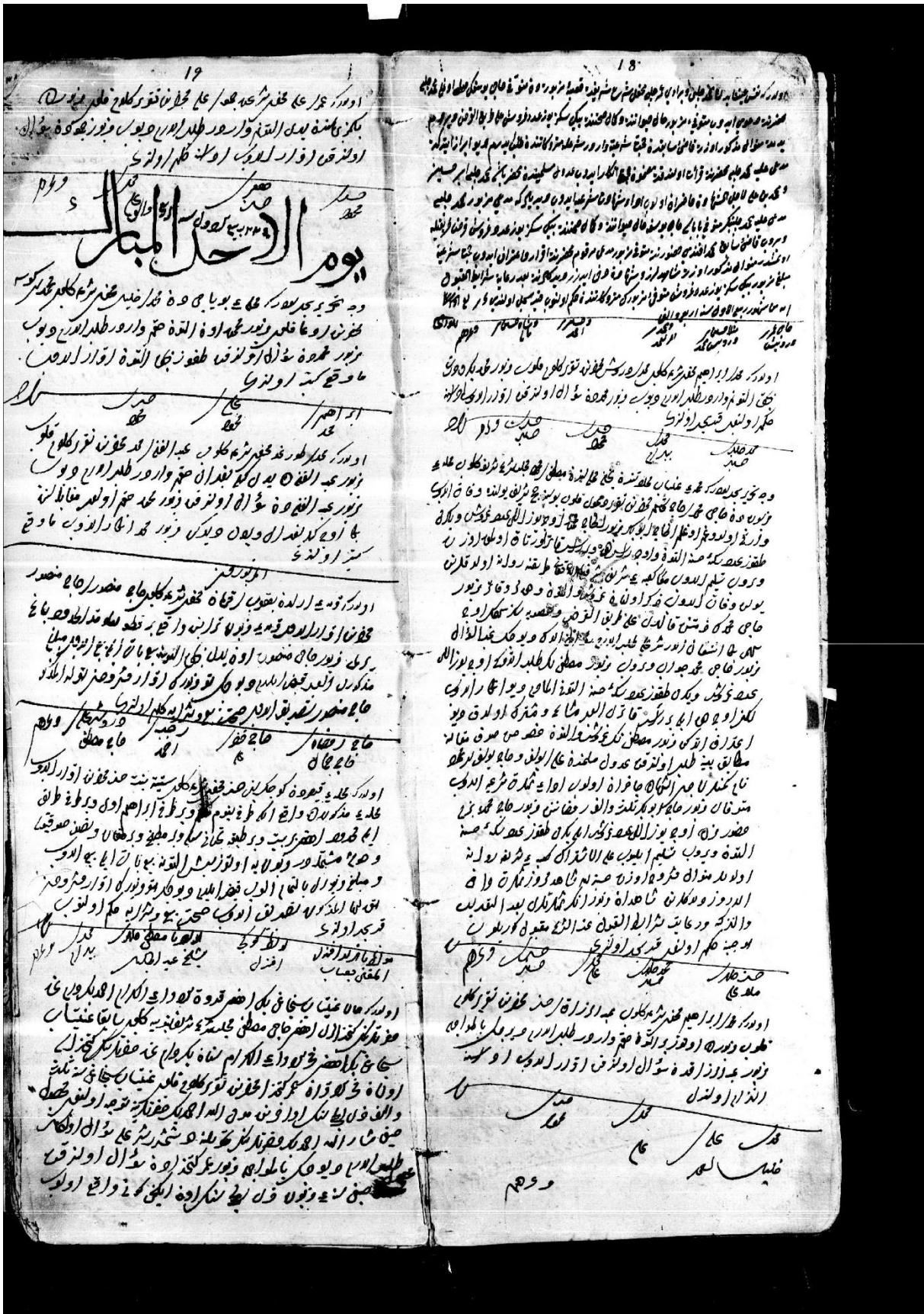
Ek 9: 42 Numaralı A.Ş.S, sayfa: 18-19.