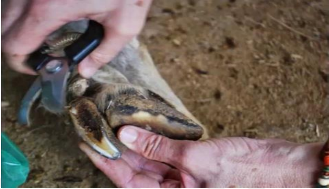
Şekil 2. Tırnak kesimi