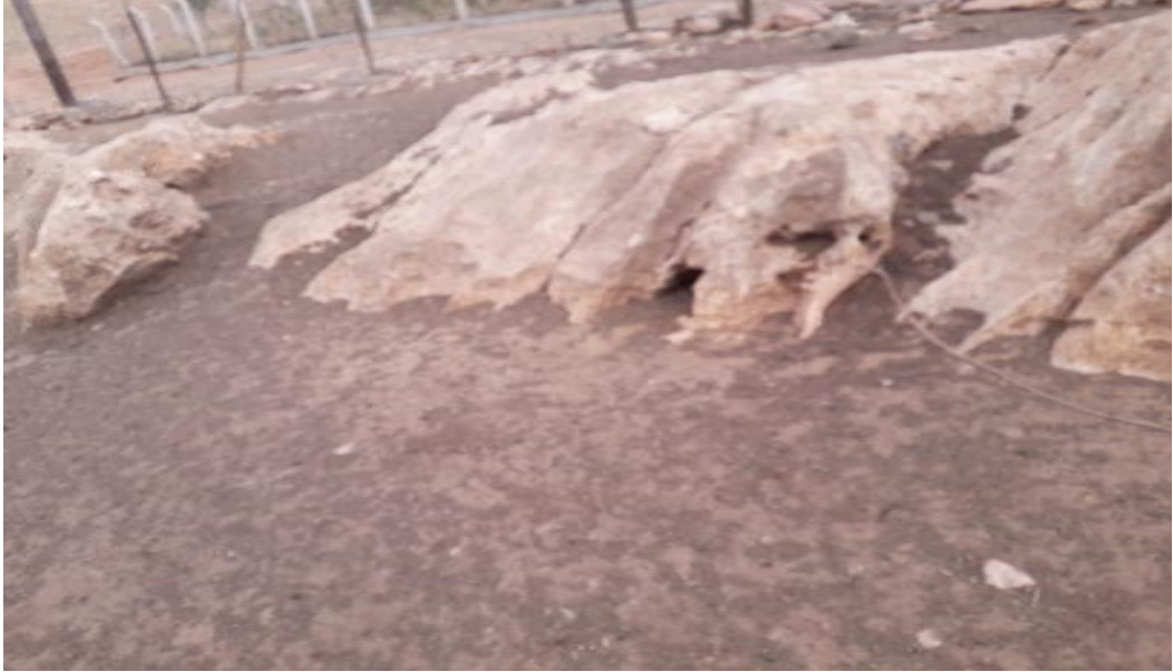
Şekil 18. Taşlık mera yapısı