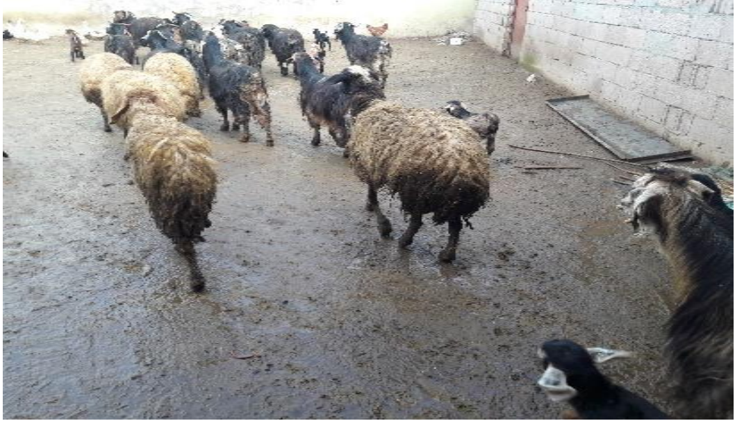
Şekil 42. Zemin yapısı beton olan bir işletmeden görünüm