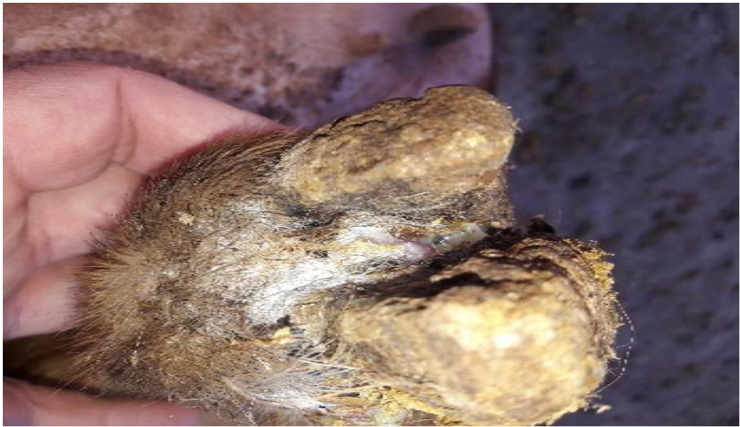
Şekil 30. Piyeten