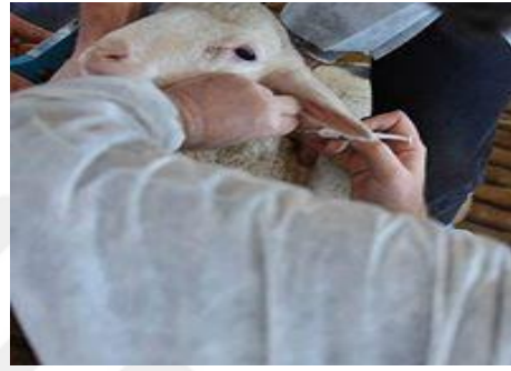
Şekil 5. Aşı Uygulama