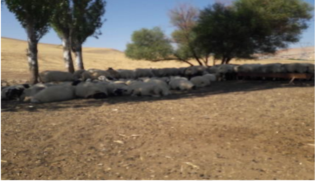
Şekil 33. Koyunların sonbaharda kaldığı bir yerden görünüm