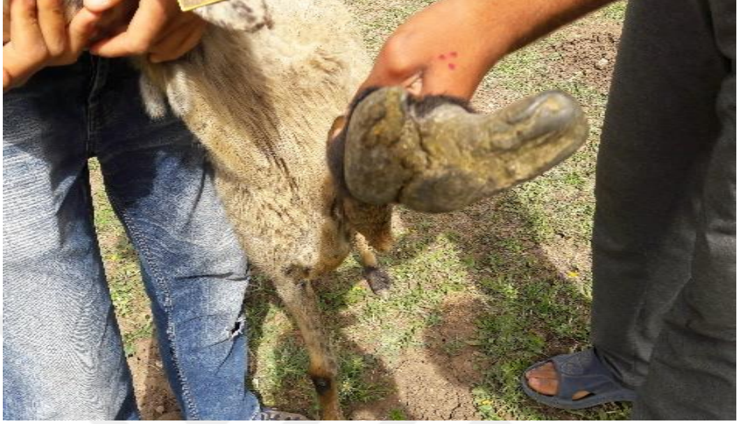
Şekil 19. Deforme olmuş tırnak yapısı