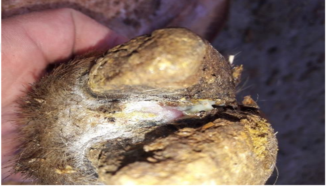
Şekil 6. Piyeten