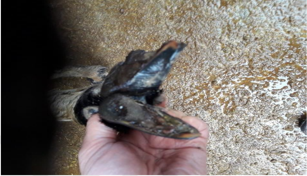
Şekil 10. Uzanmış tırnak yapısı