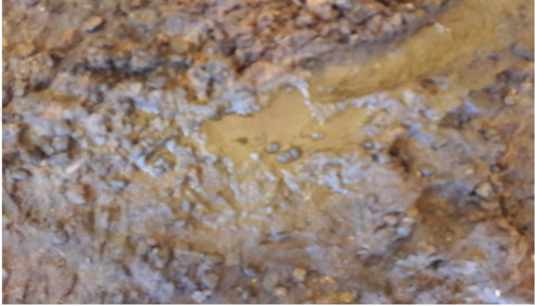
Şekil 37. Ağıl zemininden görünümü