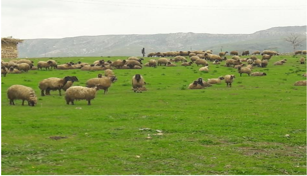
Şekil 39. Meraya çıkış döneminden bir kesit