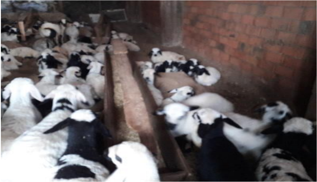
Şekil 22. Bir işletmeden görünüm