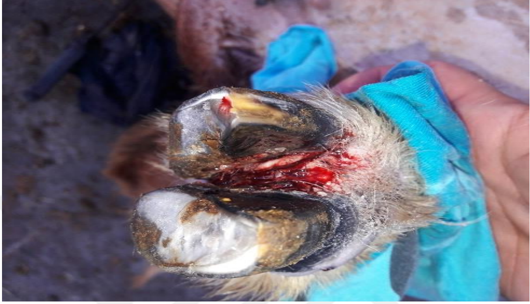
Şekil 31. Piyetenden temizlenmiş ayaktan görünüm