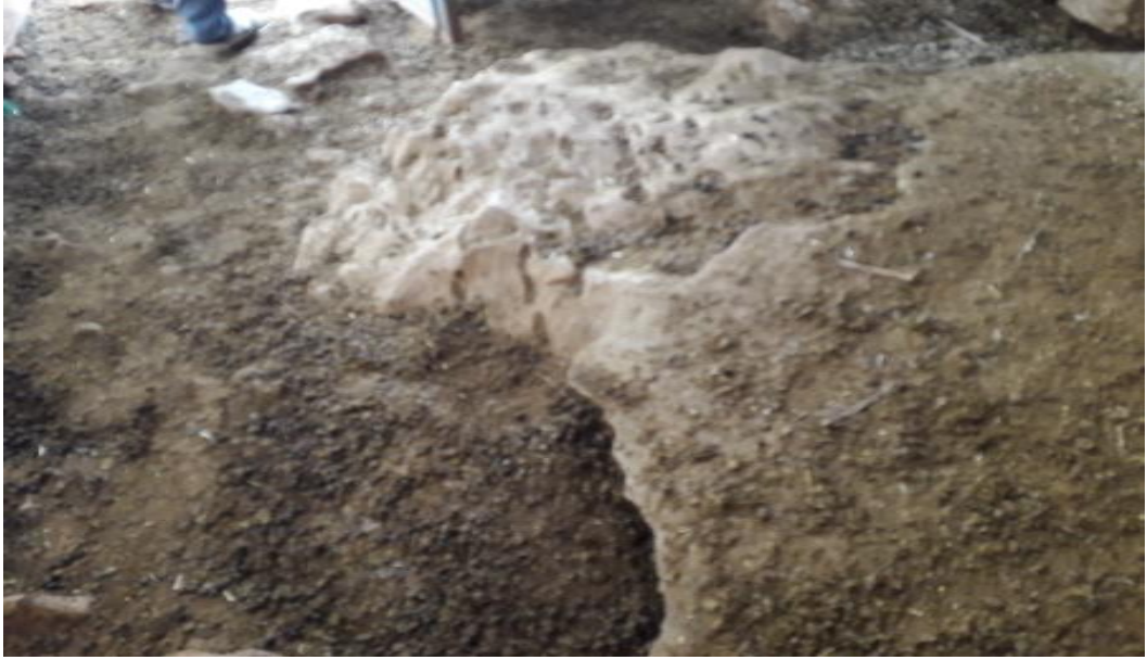
Şekil 14. Taş zeminli ağıl