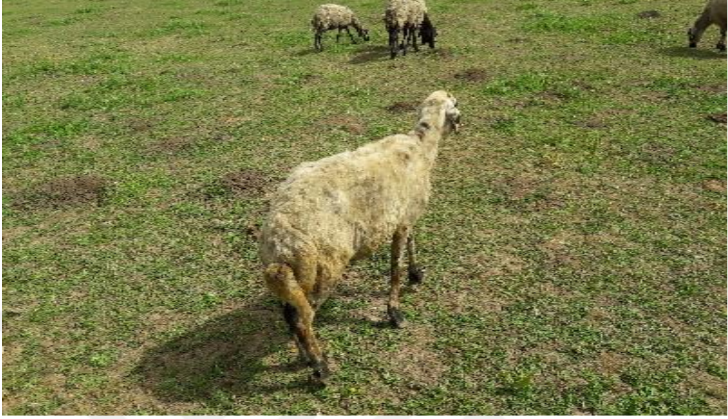
Şekil 21. Arka ayakları topallayan bir koyundan görünüm