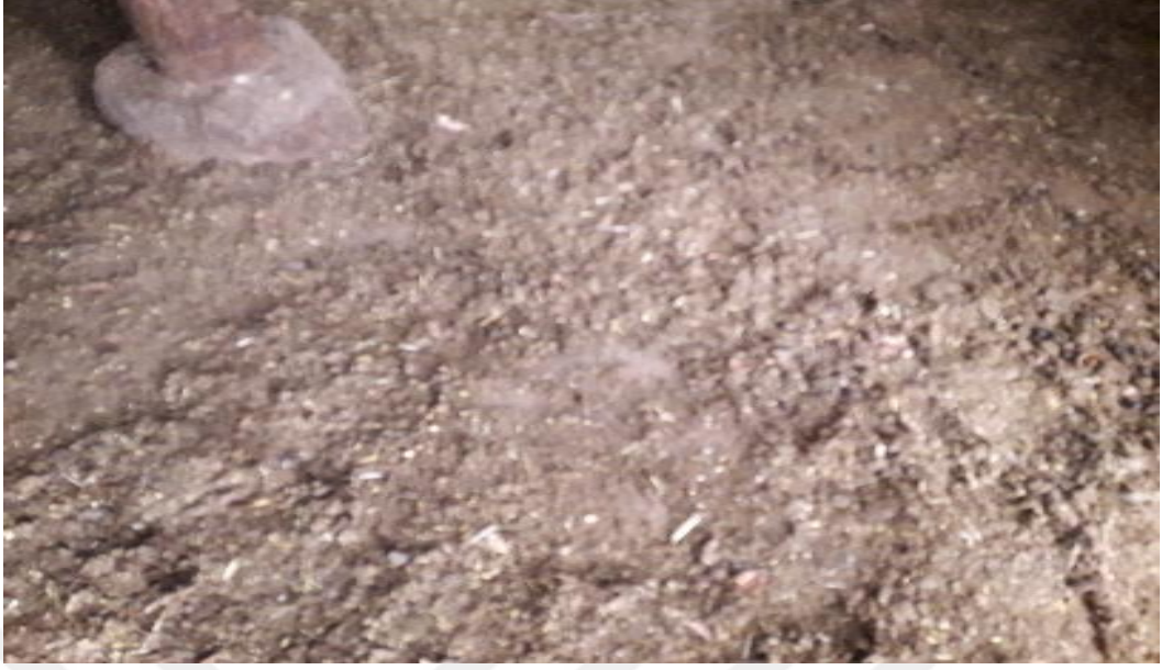
Şekil 13. Toprak zeminli ağıl