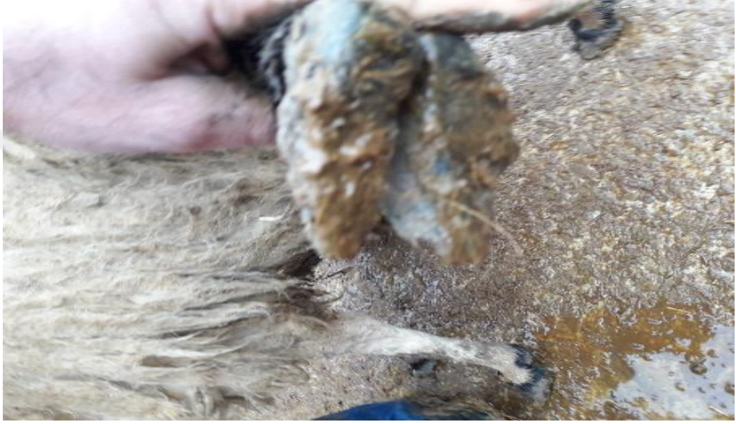
Şekil 41. Deforme olan tırnak