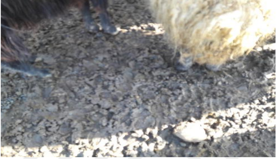
Şekil 35. Bir koyun işletmesinden bir görünüm