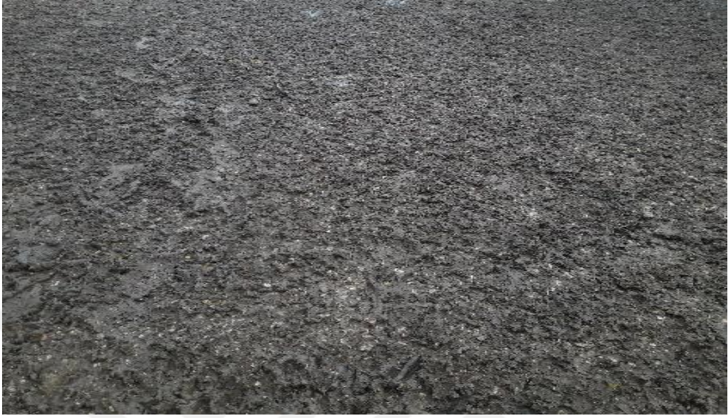
Şekil.25. İlkbaharda meradan bir görünüm