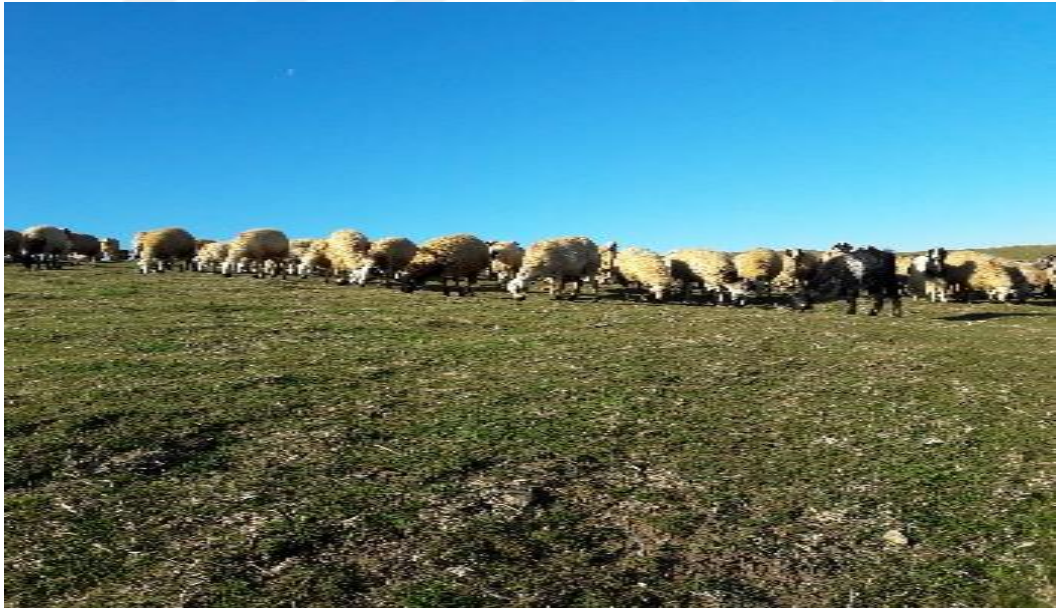
Şekil 24. Merada otlayan koyunlar