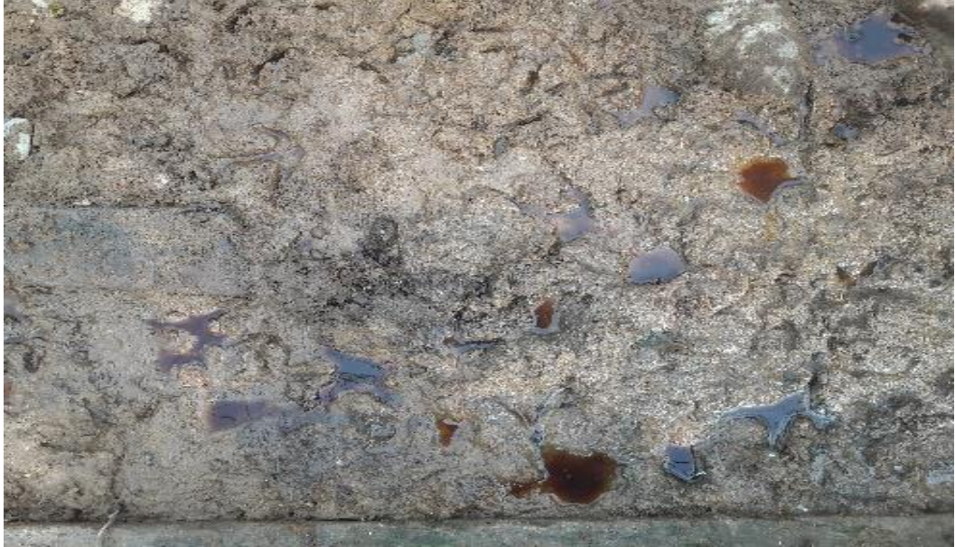
Şekil 28. Bir ağılın zemin yapısındaki görünüm