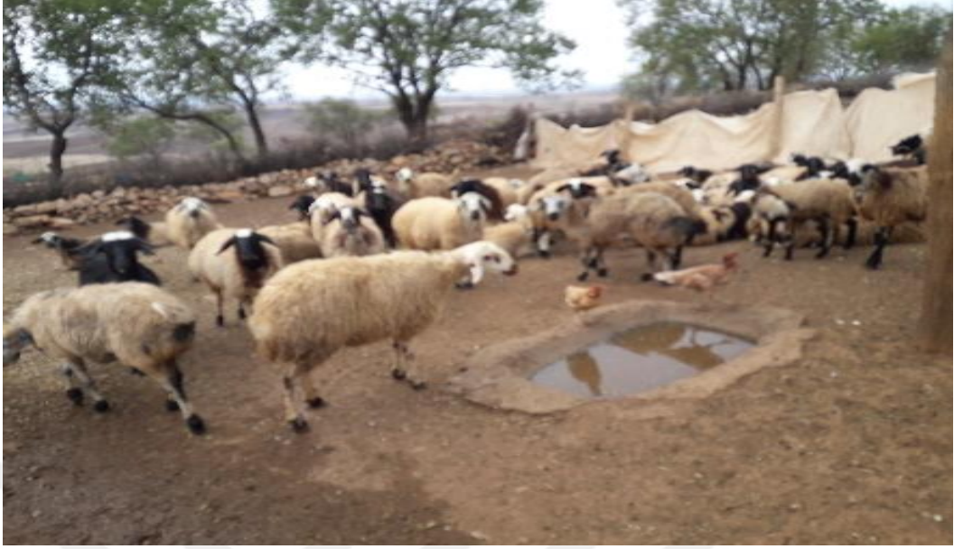
Şekil 15. Sonbaharda ziyaret edilen bir işletme