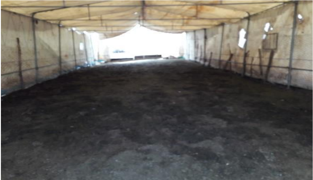
Şekil 34. Bir koyun işletmesinden bir görünüm