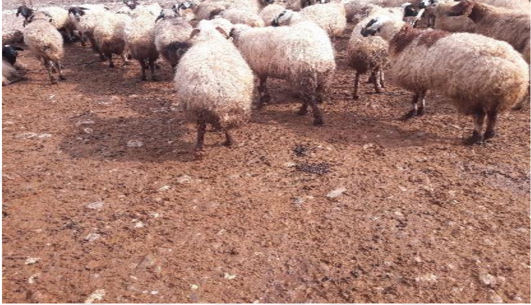
Şekil 29. Zemini taşlık mera yapısı