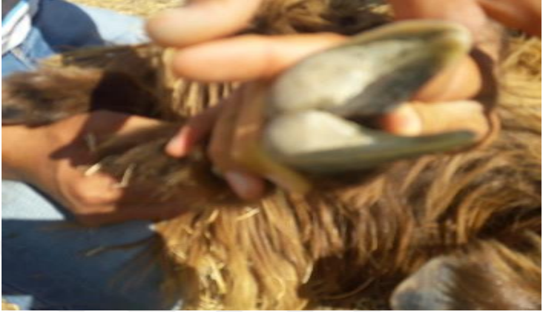
Şekil 12. Uzamış tırnak