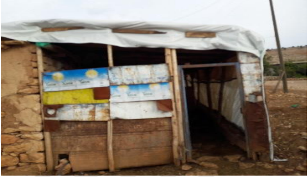
Şekil 17. Koyun işletmesi