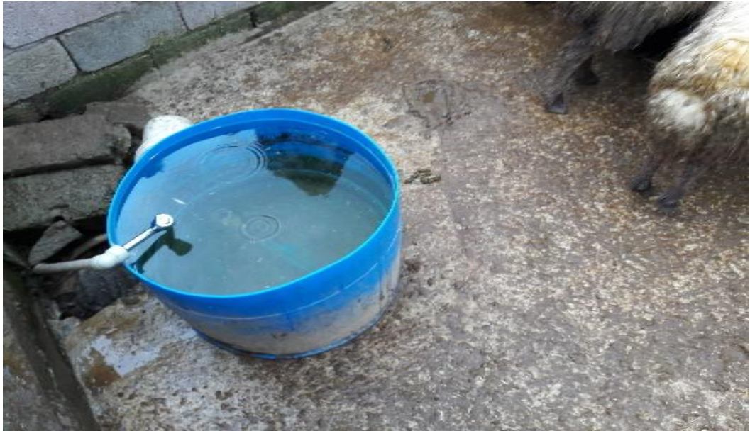
Şekil 40. Zemin yapısı beton olan bir işletmeden görünüm