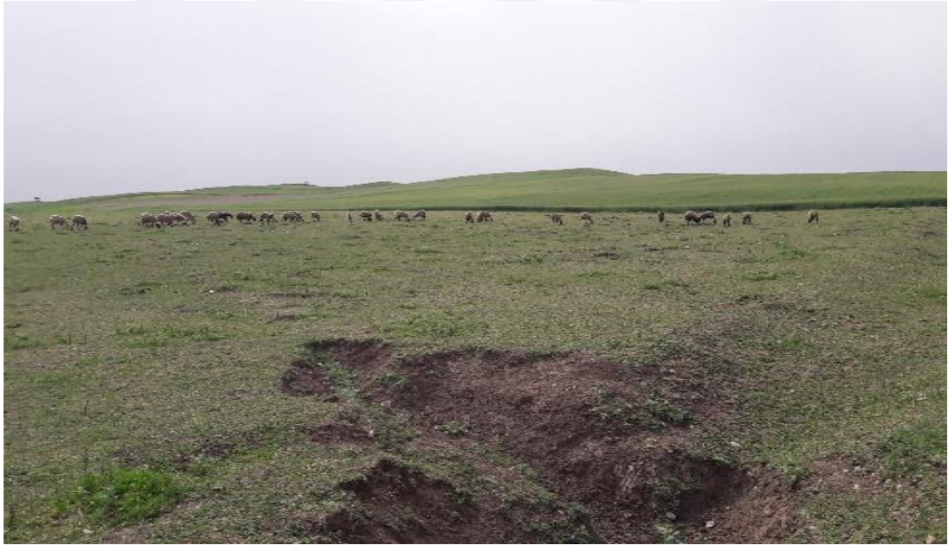
Şekil 20. Numune alınan toprak yapılı mera