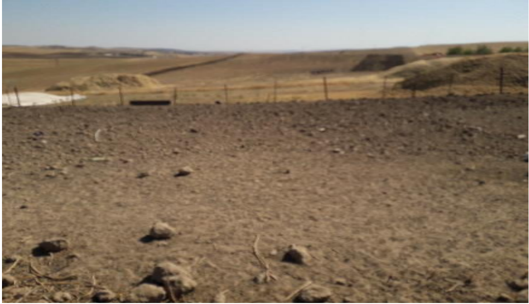
Şekil 32. Koyunların kaldığı bir yerden görünüm