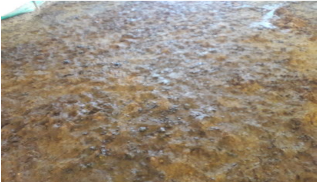
Şekil 38. Ağılın zemin yapısından görünüm