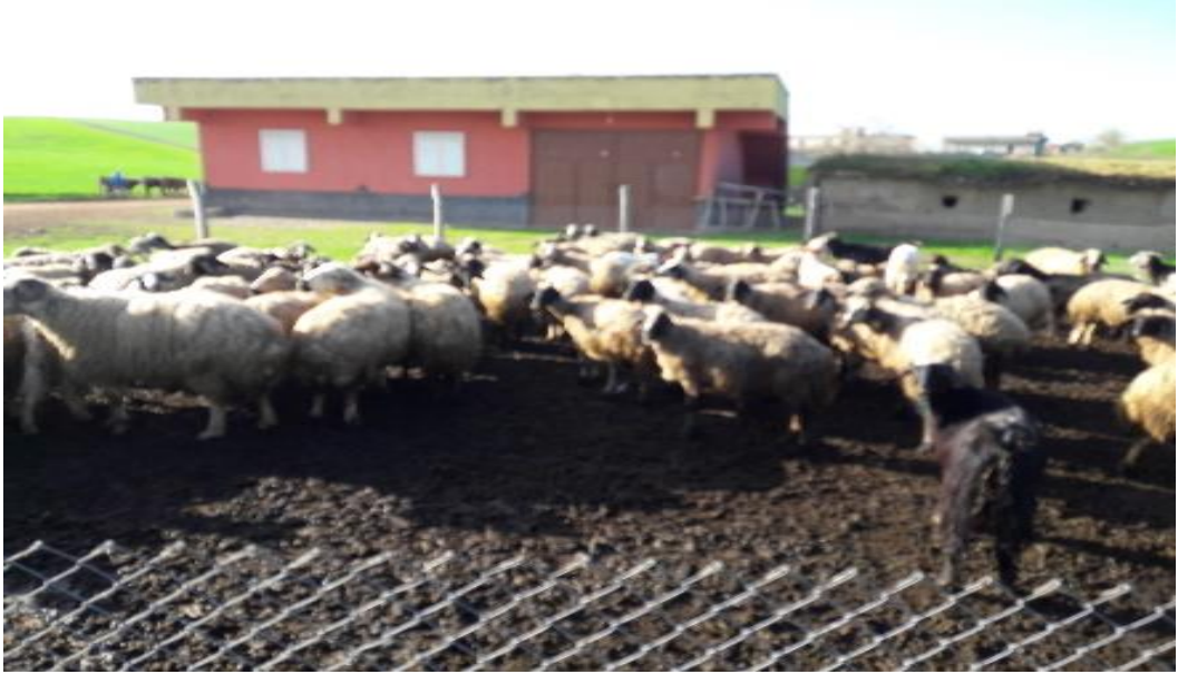
Şekil 36. İlkbahar döneminde bir işletmeden görünüm