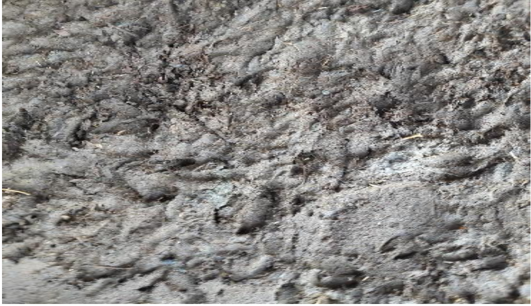
Şekil 43. Bir işletmeden görünüm