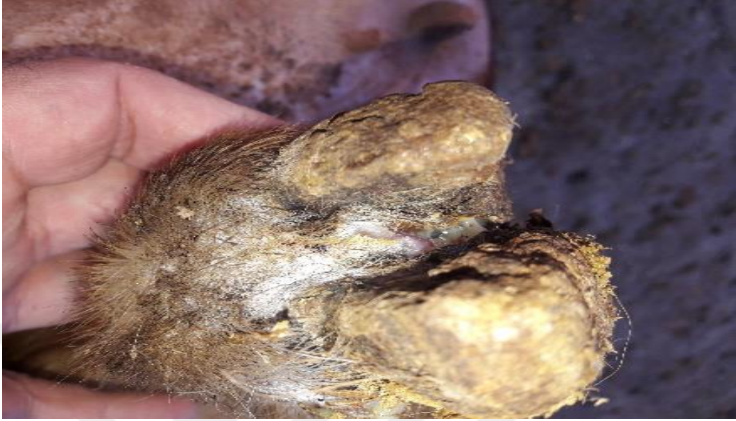
Şekil 8. İnterdigital alanda irinleşme