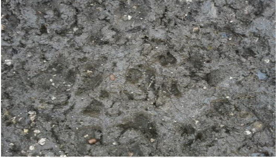
Şekil 27. Çamurlu bir zeminden görünüm