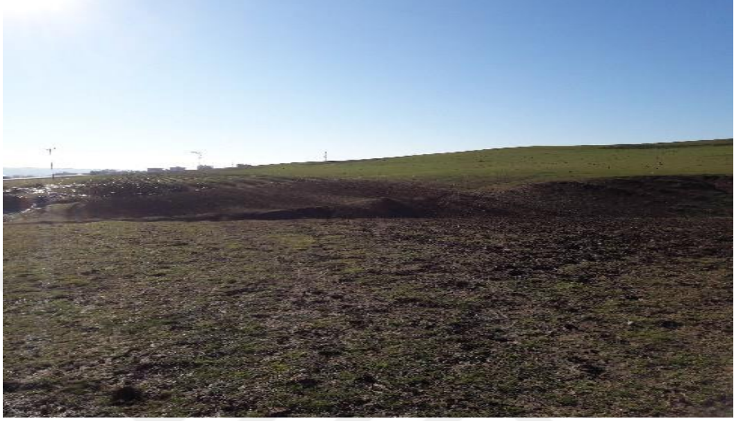
Şekil 23. İlkbahar ayında bir meradan görünüm