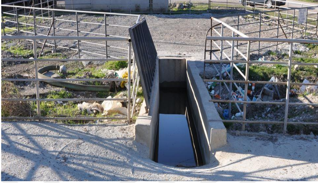
Şekil 3. Ayak banyosu