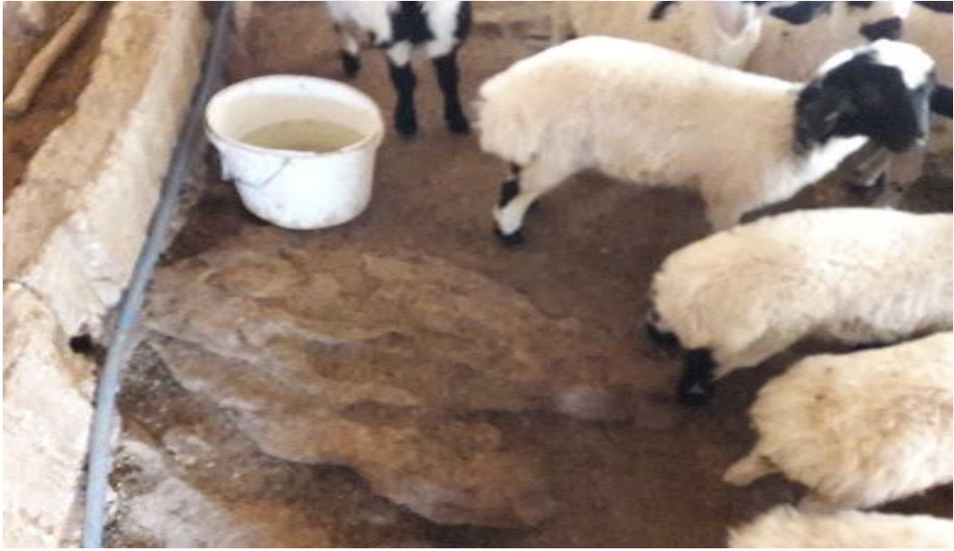
Şekil 16. Koyun işletmesi