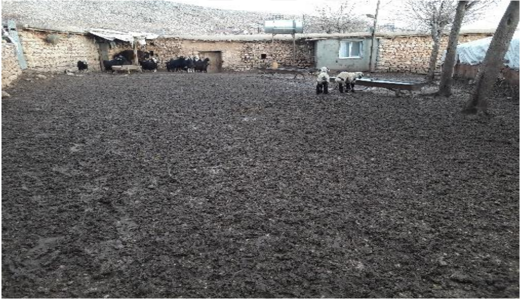
Şekil 26. Sonbahar döneminde bir işletmeden görünüm