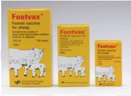
Şekil 4. Aşı preparatı

Aşılama programı, ayak çürüğü enfeksiyonu ilkbahar ve sonbahar dönemlerine göre değişiklik gösterir. Sürüden sürüye ve mevsimlere bağlı olarak değişmektedir. Şekil (4,1.4,2) aşı preparatı ve aşı uygulaması göstermiştir.