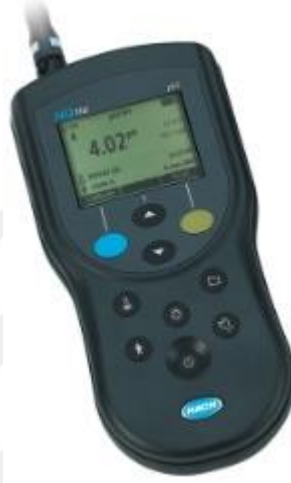
Şekil 3.1 Hach Lange HQ11D pH metre cihazı

Atıksu numunelerinin pH ölçümleri TS EN ISO 10523 standardına göre Hach Lange marka HQ11D model pH metre ile yapılmıştır (Şekil 2).