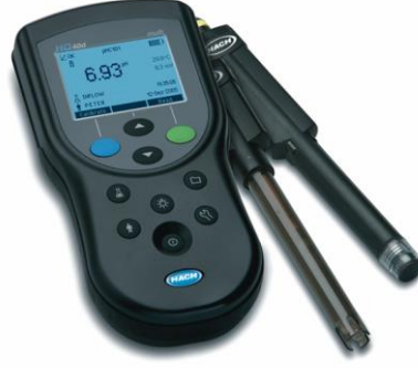
Şekil 2.2 Hach Lange HQ40D Dijital iki kanallı multimetre