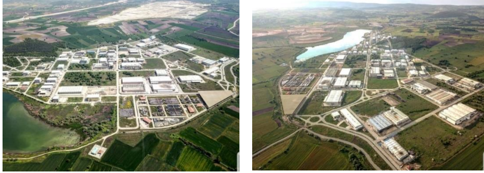
Şekil 1.1. Bursa İhtisas Deri Organize Sanayi Bölgesi

Bugün ülkemizin önemli deri üretim bölgelerinden biri olan Bursa İhtisas Deri Organize Sanayi Bölgesi (Şekil 1) de bu payda söz sahibidir.