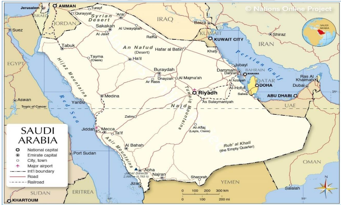
Şekil 4.4. Suudi Arabistan'ın Jeopolitik Konumu (Nations, 2023)

Suudi Arabistan, Körfez bölgesinde nüfusu ve coğrafi büyüklüğü ile doğal bir etki alanına sahiptir (Domazeti, 2021, 1). Suudi Arabistan'ın nüfusu yaklaşık 35 milyondur (Dünya Bankası, 2020). Suudi Arabistan Orta Doğu bölgesinde bulunan öteki ülkelerin aksine homojen bir nüfus yapısına sahip olan tek ülkedir. Tüm Suudi halkı Arap ve Müslümandır (Efegil, 2013, 108).