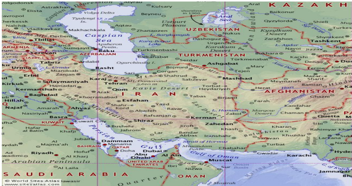
Şekil 4.1. İran'ın Jeopolitik Konumu (Atlas, 2018)

İran, nüfus bakımından dünyada 17. Sırada yer alan bir ülkedir. Ülkede yaklaşık 80 milyon insan yaşamını sürdürmektedir. İran'ın birçok önemli şehri bulunmakla beraber bu şehirleri Tahran, Meşhed, İsfahan, Şiraz, Tebriz, Karay, Kum, Ahvaz, Kirmanşah ve Orumiye olarak sıralamak mümkündür (Population, 2022). Nüfus bakımından oldukça kalabalık olan bu şehirler aynı zamanda stratejik olarak da önem arz etmektedir. İran için Tebriz şehri Kafkasya politikası bakımından, Meşhet şehri ise Orta Asya ve Afganistan politikası bakımından stratejik önem arz etmektedir (Ametbek, 2017, 24).