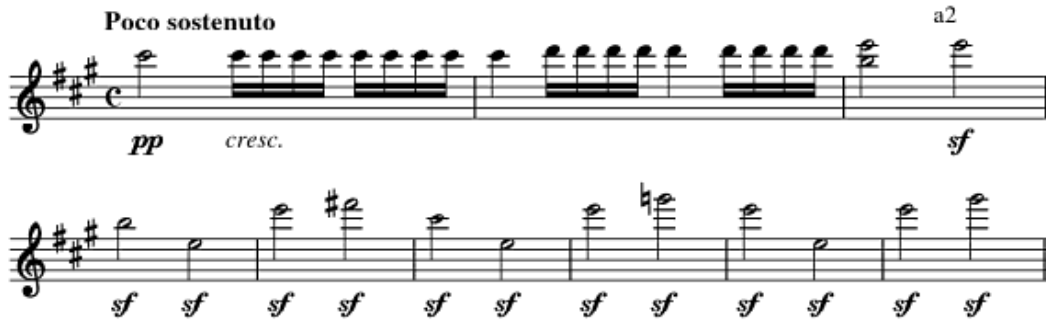
Şekil 2. Tek Dil Egzersiz Örneği