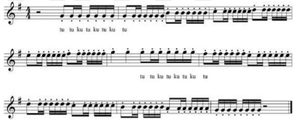
Şekil 4. Çift Dil Egzersiz Örneği