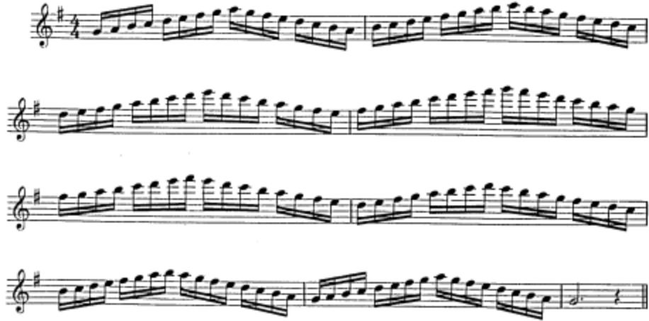
Şekil 3. Çift Dil Egzersiz Örneği