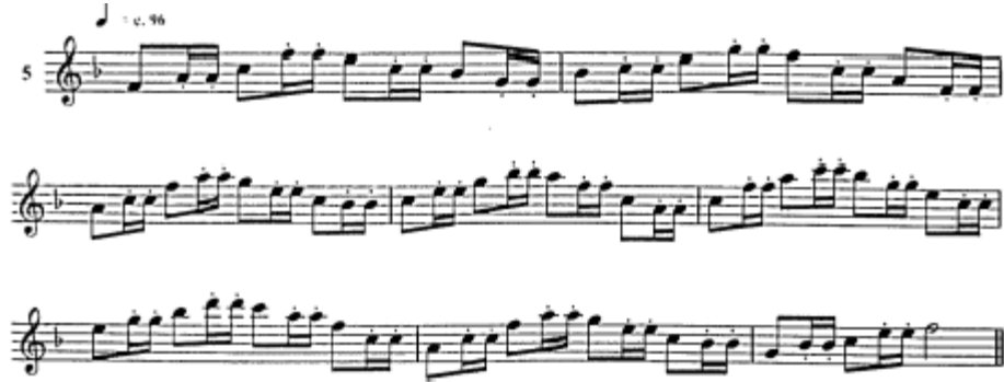
Şekil 1. Tek Dil Egzersiz Örneği

Wye (2014) tek dil tekniğinde, dilin çevikliğini daha da artırmak için aşağıda bulunan egzersize benzer çalışmaların dil kaslarını geliştireceğini ve böylece dil güçlendikçe ses kalitesinin artacağını söylemiştir.