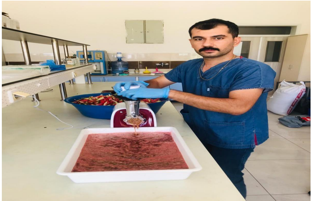
Şekil 3.1. Karpuz Püresi

Karpuzların püre işlemine getirilmeden önce laboratuvara getirilen karpuzlar musluk suyu altında yıkanarak ve çürük kısımları ayıklanmıştır. Kesme tahtasında küçük parçalara ayrıldıktan sonra kıyma makinasında çekirdekleri ve kabukları dâhil olmak üzere tamamı parçalanacak şekilde püre haline getirilmiştir (Şekil 3.1.)