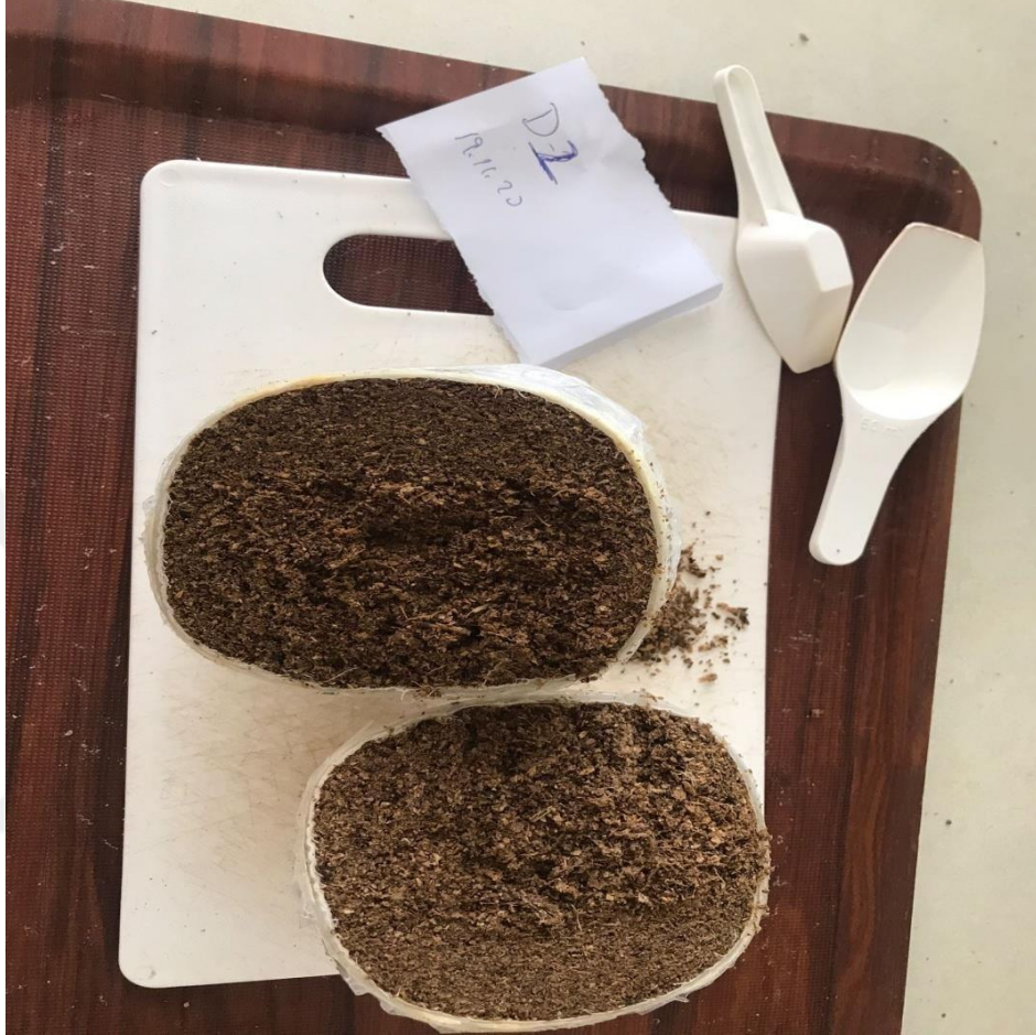
Şekil 3.5. Yer Fıstığı Kabuğu ve Karpuz Pürelisi Silaj/Haylajların Görünümü

Silo kapları silolamadan 60- 65 gün sonra paket silajlar kesilerek açılmıştır (Şekil 3.5).