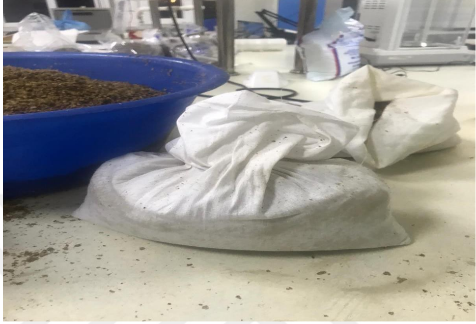
řekil 3.4. Yer Fıřtıęı Kabuęu ve Karpuz Presinden %40 ve %50 Kuru Maddeli Silaj/Haylaj Materyallerinin Bez Torbalara Doldurulması

Yukardaki gruplara gre oluřturulan karpuz presi silaj materyali, bez torbalara doldurulup bilek gc ile elle sıkıřtırılmıř, bez torbalar stre film ile hava almayacak řekilde sarılarak paketlenmiřtir (řekil 3.4). Her grup iin 4 tekerrr oluřturulmuřtur.