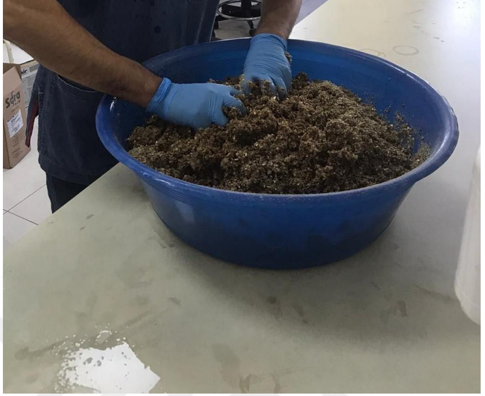
Şekil3.3. Asitli ve Asitsiz Karpuz Pürelerine Kuru Madde Seviyeleri %40 ve %50 Olması için Yer Fıstığı Kabuğu İlavesi

Elde edilen 4 farklı karpuz püresi-yer fıstığı kabuğu haylaj materyaline %1 oranında tuz ilavesi yapılmıştır. Yukarıda tanımlanan işlemler sırasında elde edilen haylaj materyallerinden mikrobiyolojik (steril poşetlere) ve mikotoksin (steril poşetlere) analizleri için numune alınmıştır. Yukarıdaki işlemlerin ardından araştırma grupları aşağıdaki gibi adlandırılmıştır.