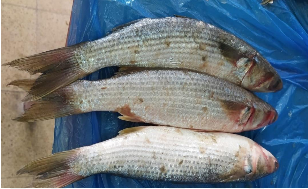
Şekil 3.3. Has Kefal ( Mugil cephalus Linneaus, 1758 )(Orijinal)