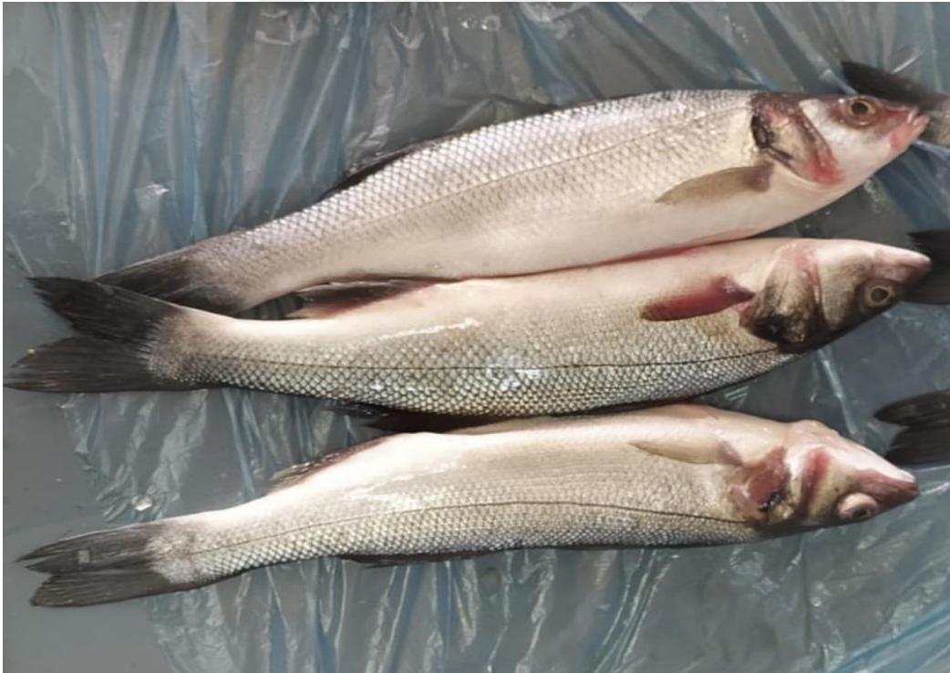
Şekil 3 4. Levrek ( Dicentrarchus labrax Linneaus, 1758)(Orijinal)

Moronidae familyasının üyelerinden olan levrek ( Dicentrarchus labrax Linneaus,1758) Osteichthyes sınıfının Perciformes takımına ait bir türdür (Şekil 3.4).