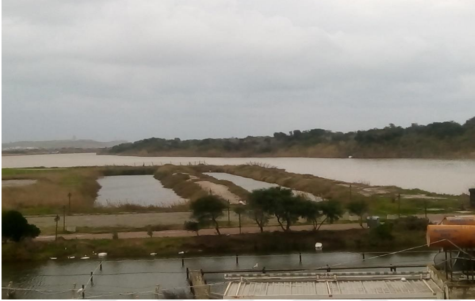
Şekil 3.2. Dalyan ile Deniz arasındaki bağlantı kanalından bir görüntü (Orijinal 2019).

mevsimlere göre deęişiklik göstermektedir. Kışın ve ilkbaharda, drenaj kanalları ile taşınan sular ve yağışların etkisi ile lagün suyu tatlılaşmakta, yazın ise yüksek buharlaşma ve denizden lagüne olan su girişi nedeniyle tuzluluk artmaktadır. Ayrıca, tuzluluk denize bağlantının olduğu ve batı kesimde daha yüksek, sızıntı ve drenaj sularının etkili olduğu kuzey kesimlerde ise daha düşük seviyelerdedir ( http://www.turkiyesulakalanlari.com/akyatan-lagunu-adana/ ).