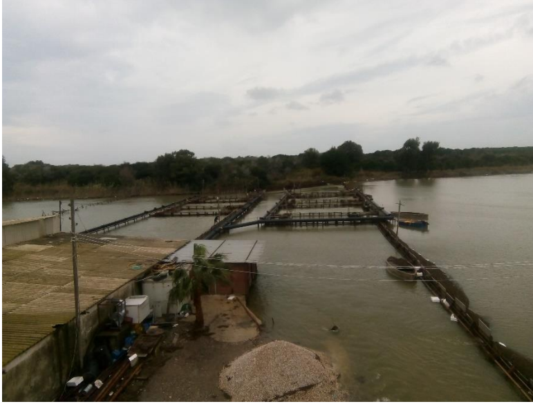
Şekil 1.2. Karataş Birlik Su Ürünleri Kooperatifi (Orijinal)

Akyatan Lagünü'ndeki en önemli ekonomik etkinliklerden biri geleneksel dalyan balıkçılığıdır. Lagünün denize açılan kısmında Karataşlı balıkçılara ait bir dalyan bulunmaktadır ve Karataş Birlik Su Ürünleri kooperatifi tarafından işletilmektedir (Şekil 1.2).