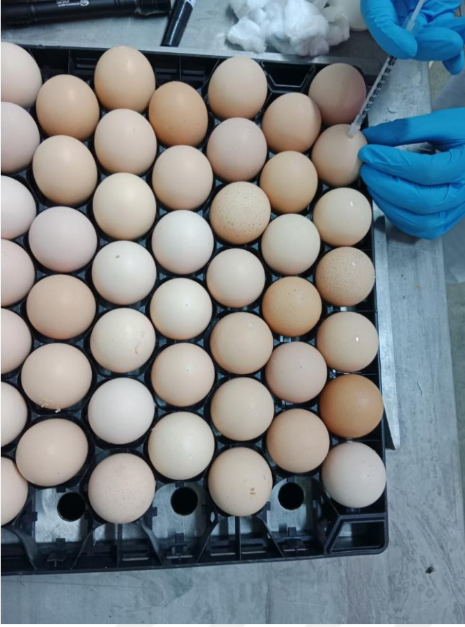
Resim 6.2: Yumurtalara in ovo uygulaması