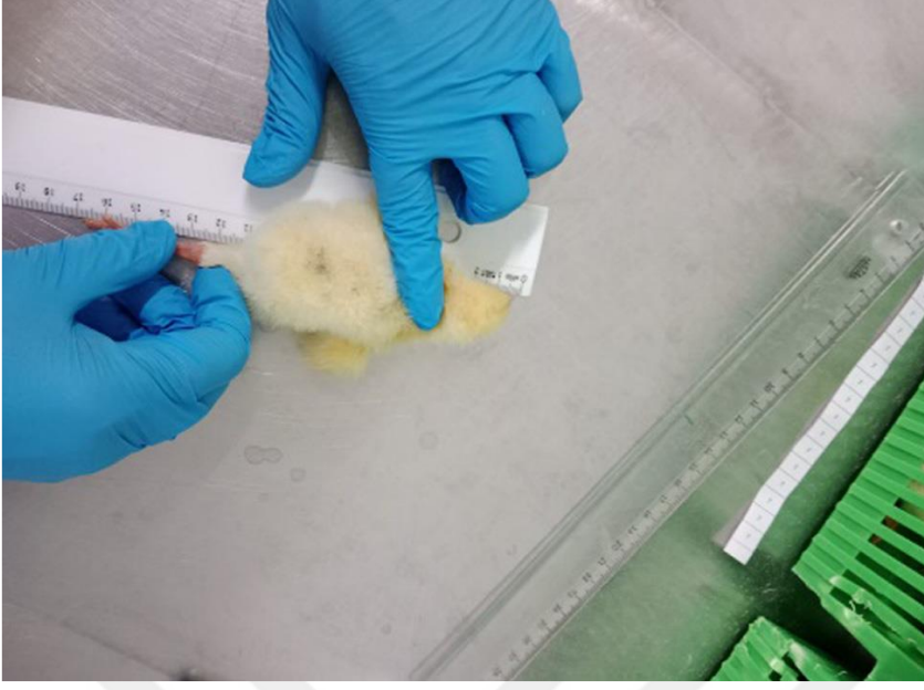
Resim 8.2: Cıvciv uzunluğunun ölçümü