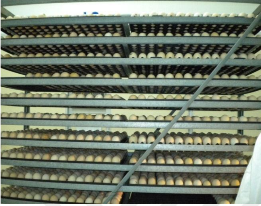
Resim 3.2: Etlik piliç (Cobb 500) kuluçkalık yumurtaları

Yumurtalar kuluçka makinesine konulmadan önce hassas terazide tartılarak yumurta tablalarına yerleştirilerek inkübe edilmiştir. Çalışmada kuluçka işlemi Gedik Piliç A.Ş. kuluçkahanesinde yapılmıştır. Kuluçkanın 18. gününde yumurtalara döllülük muayenesi yapılarak dölsüz yumurtalar tablolardan uzaklaştırılmıştır.