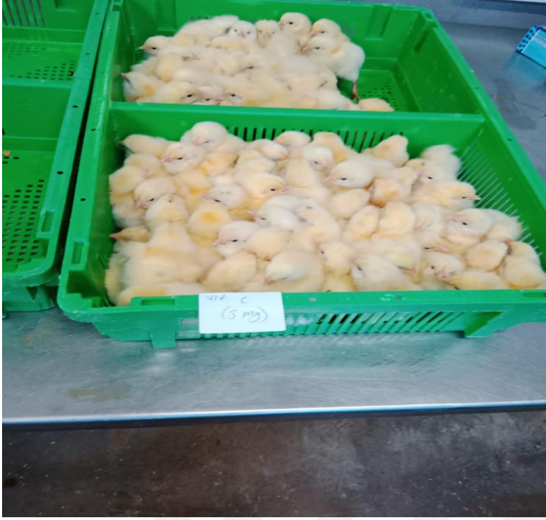
Resim 7.2: Yumurtadan çıkış sonrası civcivler