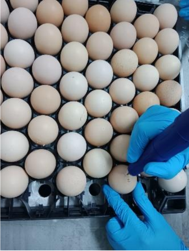
Resim 5.2: Yumurtalara mikro motor ile delik açılması

Kuluçkanın 18. gününde döllü olarak tespit edilmiş 600 adet yumurta tepsilere yerleştirilmiştir. Tablo 2’de yer alan deneme gruplarına göre in ovo enjeksiyon uygulanmıştır. Uygulamada ilk olarak yumurtaların hava boşluğunun olduğu tepe noktası % 70’lik alkolle dezenfekte edildikten sonra mikro motor yardımıyla Resim 5 deki gibi delik açılmıştır ve insülin iğnesi yardımıyla hava kesesine Resim 6 daki gibi 0.1 ml’lik çözelti enjekte edilmiştir. Enjeksiyon sonrasında açılan delik parafin bant ile kapatılarak yumurtalar çıkış tepsisine alınmış ve transfer bölümüne yerleştirilmiştir. İn ovo enjeksiyon uygulanmayan gruptaki yumurtalarda aynı sıcaklık ve süre ile dışarıda tutularak çevre şartlarının denemeye etkisi elemine edilmeye çalışılmıştır.