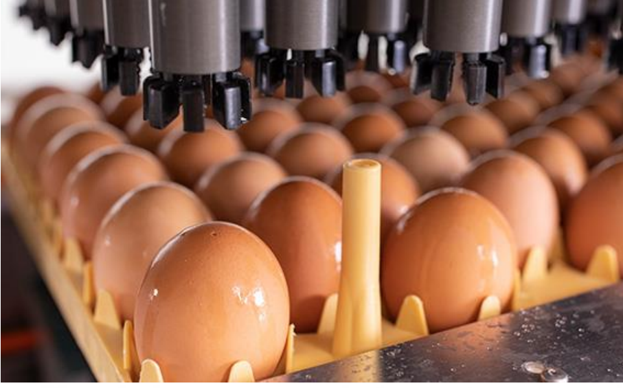
Resim 1.1: Inovoject sistemi