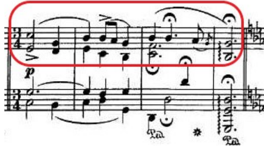
Şekil 4.10. Andante Spianato ve Grand Polonez, 111. Ölçü Tematik Yapılanma

İkinci bölüme geçmeden önce, onaltı ölçüden oluşan bir ara müzik vardır. Burada polonezin dans karakteri önceden gösterilerek, ikinci bölüme ritmik anlamda bir hazırlık yapılmıştır. Bunun yanı sıra, sol majörden mi bemol majöre ustalıkla bir şekilde geçerek Grand Polonez'in ana tonuna ulaşılmıştır.