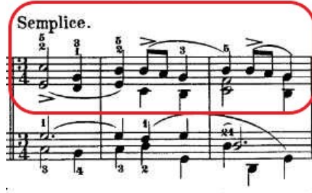
Şekil 4.8. Andante Spianato ve Grand Polonez , 67. Ölçü Tematik Yapılanma

Doksan yedinci ölçüden itibaren, tıpkı elli üçüncü ölçüde olduğu üzere yine sol majör eksenli uzun bir kadans görülür ve yüz on birinci ölçüye kadar devam eder: