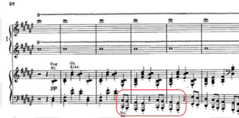
Şekil 3.30. Senfonik Varyasyonlar, 290. Ölçü 2. Tema

Bu varyasyonun ana motifi, iki yüz doksanınıcı ölçüde orkestra partisinde duyulan dört notalık bir yapıdır. Bu yapı, eserin ikinci temasından türetilerek oluşturulmuştur. Tek farkı, ana temadaki si diyezlin kullanılmamasıdır: