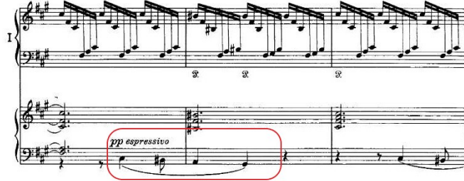
Şekil 3.26. Senfonik Varyasyonlar, 250. Ölçü Sonrası 2. Tema Dairesel Form

Ardından iki yüz ellinci ölçüde, eserin ikinci temasının birebir olmak üzere yine döngüsel bir şekilde getirildiği görülür. Dairesel form olarak bilinen bu özellik, Franck'ın neredeyse tüm eserlerinde başvurduğu en önemli besteleme tekniklerinden biridir.