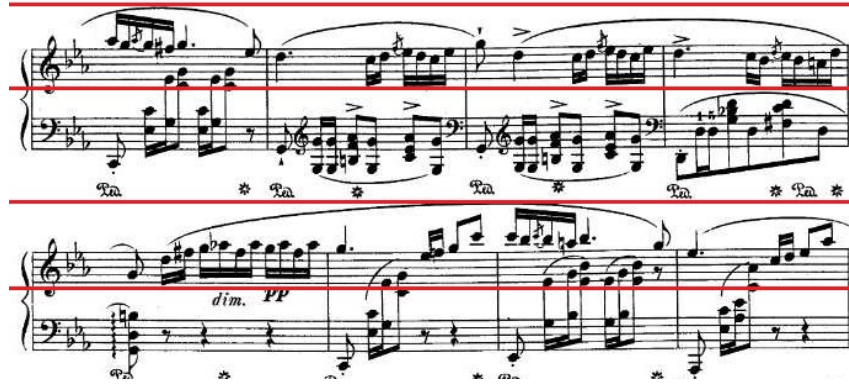
Şekil 4.21. Andante Spianato ve Grand Polonez , 221.-228. Ölçüler Arası Tema Yapılanması