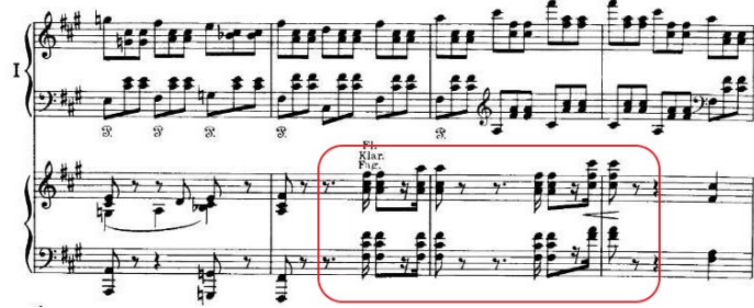
Şekil 3.22. Senfonik Varyasyonlar, 1. Tema Ritmik Yapı

Oktavlı pasajların bitmesinin ardından, iki yüz onuncu ölçüde yine birinci temanın ritmik yapısı ortaya çıkar ve müzik iki yüz otuzuncu ölçüye kadar aynı yapıda devam eder: