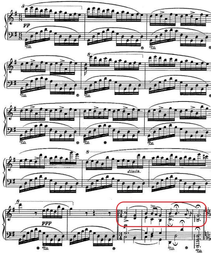
Şekil 4.9. Andante Spianato ve Grand Polonez , 97. ve 111. Ölçüler Arası Kadans

Doksan yedinci ölçüden itibaren, tıpkı elli üçüncü ölçüde olduğu üzere yine sol majör eksenli uzun bir kadans görülür ve yüz on birinci ölçüye kadar devam eder: