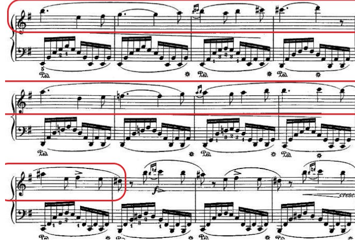
Şekil 4.4. Andante Spianato ve Grand Polonez, 21. Ölçü Ana Tema Armonik Yürüyüş

Otuz dördüncü ölçüden itibaren arpejlerle yapılan bir geçişin ardından, otuz yedinci ölçüde tekrar ana temaya dönülür: