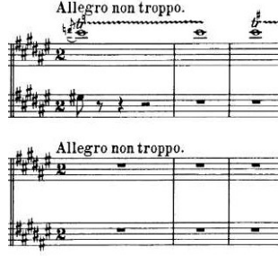
Şekil 3.29. Senfonik Varyasyonlar, 285. Ölçü 4. Varyasyon Girişi

İki yüz seksen beşinci ölçüde “Allegro non troppo” adı altında eserin dördüncü ve son varyasyonuna geçilir: