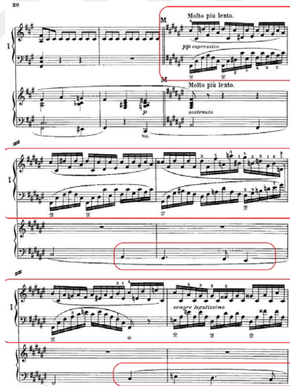
Şekil 3.23. Senfonik Varyasyonlar, 3. Varyasyon Girişi ve 2. Varyasyonun Cümle Yapısı Tekrarı

Üçüncü varyasyon, “Molto piu lento” başlığı altında farklı bir karakterle iki yüz otuzuncu ölçüde başlar. Franck yine bu varyasyonda da, hem piyano hem orkestra partisinde eserin iki ana temasını kullanmıştır. Ancak bu varyasyonda farklı bir özellik ortaya çıkar. Besteci iki yüz otuzuncu ölçüde, orkestra partisinde görülen ikinci varyasyonun cümle yapısını döngüsel bir şekilde kullanmıştır: