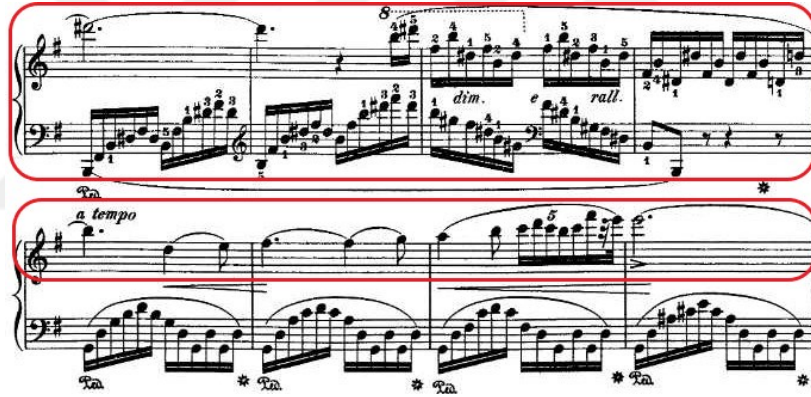
Şekil 4.5. Andante Spianato ve Grand Polonez, 34. Ölçü Ana Tema Tekrarı

Otuz dördüncü ölçüden itibaren arpejlerle yapılan bir geçişin ardından, otuz yedinci ölçüde tekrar ana temaya dönülür: