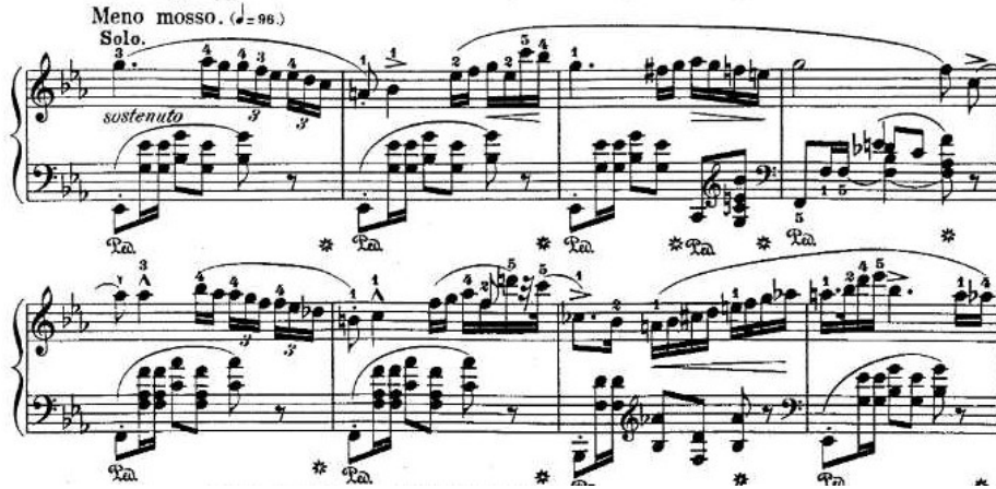
Şekil 4.11. Andante Spianato ve Grand Polonez, 131. Ölçü A Kesiti Ana Tema

Grand Polonez asıl olarak yüz otuz birinci ölçüde başlar. A kesiti olarak adlandırılabilen bu bölümün tematik yapılanması aşağıda görüldüğü üzeredir: