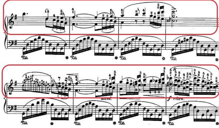
Şekil 4.6. Andante Spianato ve Grand Polonez, 45. Ölçü Ana Tema Tekrarı

Elli üçüncü ölçüden itibaren sol majör eksenli uzun bir köprünün ardından altmış yedinci ölçüde semplice isimli bir kesite geçilir: