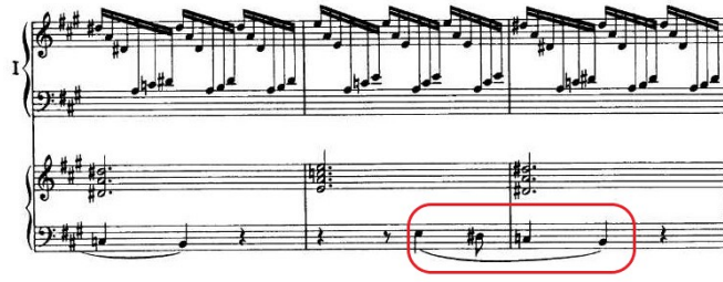
Şekil 3.27. Senfonik Varyasyonlar, 250. Ölçü Sonrası 2. Tema Dairesel Form