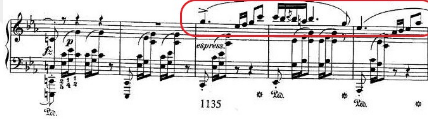
Şekil 4.20. Andante Spianato ve Grand Polonez , B Kesiti 219. Ölçü Sonrası Ana Tema

B kesiti iki yüz ondokuzuncu ölçüde başlar ve iki yüz yirminci ölçüden itibaren ana tema duyurulur: