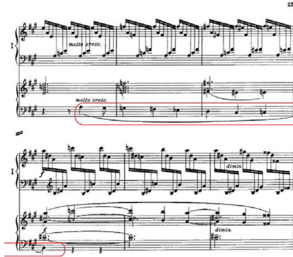
Şekil 3.28. Senfonik Varyasyonlar, 250. Ölçü Sonrası 2. Tema Dairesel Form