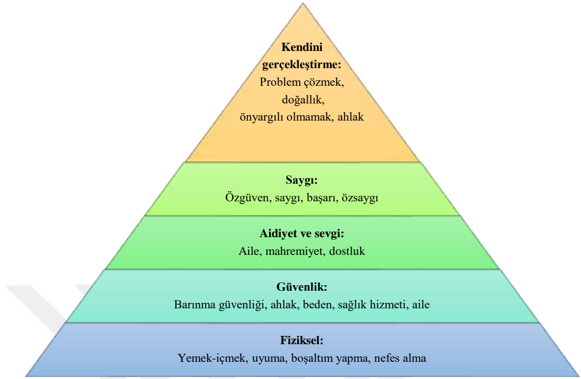
Şekil 1.1. Maslow'un ihtiyaçlar hiyerarşisi