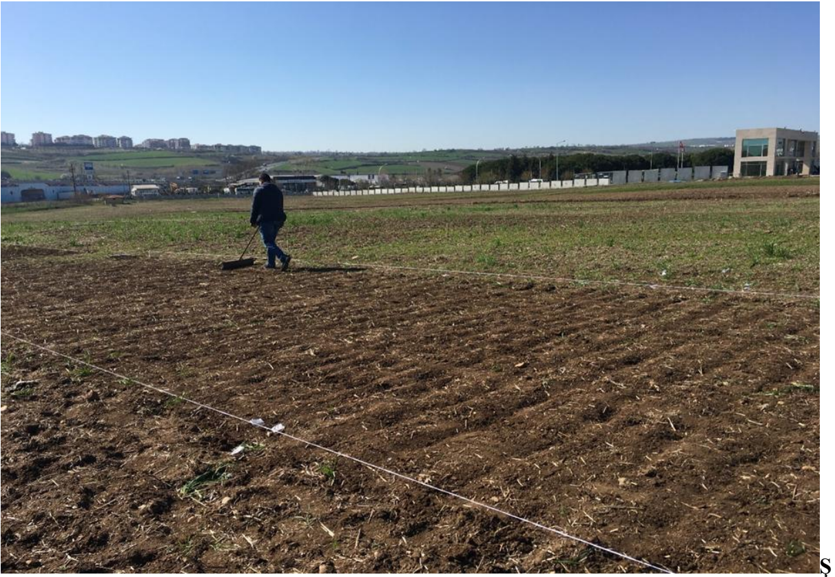
ekil 3.1. Deneme alanının görünüşü

Çalıřma, 2016-2017 yılı yetiřtirme döneminde Tekirdağ Namık Kemal Üniversitesi Ziraat Fakültesi Tarla Bitkileri Bölümü arařtırma deneme arazisinde kışlık ekim yapılarak yürütülmüřtür.