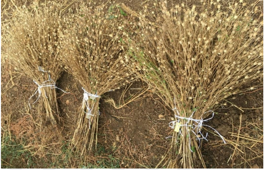
Şekil 3.9. Çörekotu hasadından görüntü