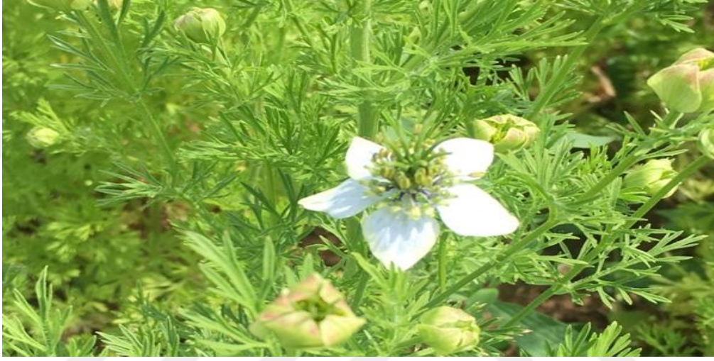
Şekil 3.4. Çörekotu çiçeğinin görünüşü

Ekimden itibaren bitkilerin % 80'inin çiçeklendiği süre olarak belirlenmiştir (Şekil 3.4.).