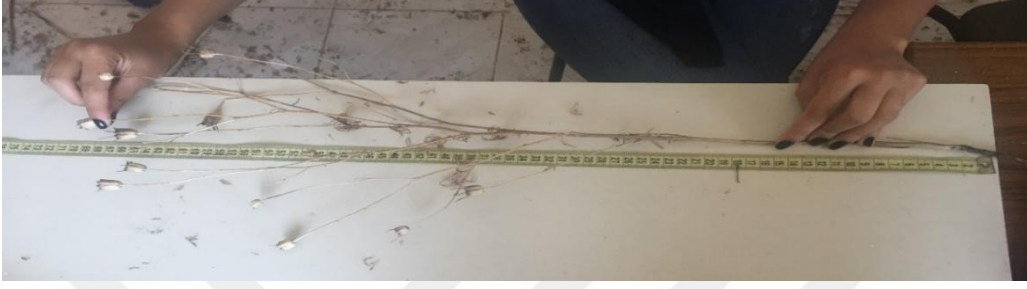
řekil 3.6. Bitki boyu ölçümünden bir görünüş

Bitkinin hasat olgunluđuna ulařtıđı devrede, her parselden tesadüfen seçilen 10 adet bitkinin boyu ölçülerek ortalaması alınmıřtır. Bitki boyu olarak ana gövde üzerinde en tepede bulunan kapsül ile kök bođazı (toprak yüzeyi) arasında kalan uzunluk ölçülmüřtür (řekil 3.6).