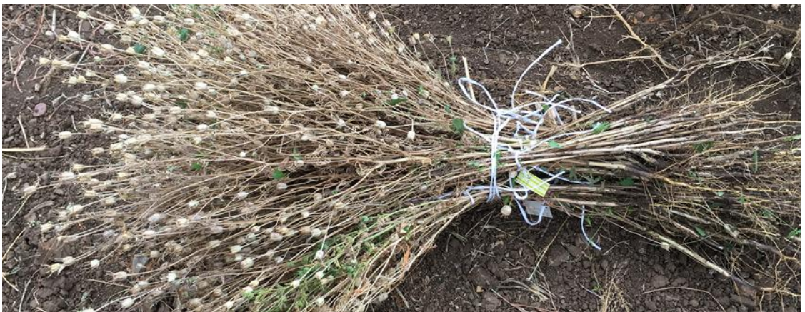
Şekil 3.5. Olgunlaşmasını tamamlamış hasat edilmiş çörekotu

Ekimin yapıldığı tarih ile hasadın yapıldığı tarih arasındaki süre olarak belirlenmiştir.