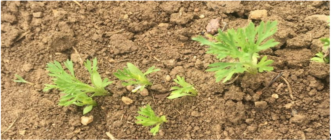
Şekil 3.3. Çörekotunun büyüme evresinden bir görünüş

Tohumların ekilmesinden itibaren bitkilerin % 50'sinin toprak yüzüne çıkmasına kadar geçen gün sayısı olarak belirlenmiştir (Şekil 3.3).