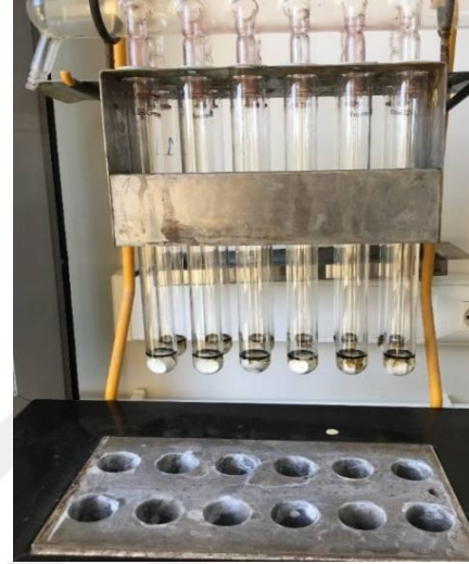
Şekil 3.11. Protein analizi yapılan Kjeldahl cihazının görüntüsü