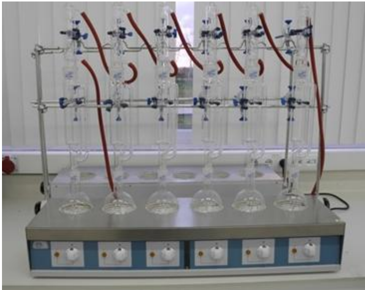
Şekil 3.10. Ham yağ oranı tayin etmede kullanılan cihaz

Her parselden alınan tohum örneklerinden 10'ar gram alınıp öğütülerek etüvde kurutulduktan sonra kuru ağırlığı hesaplanmıştır. Kuru ağırlığı tespit edilen örneklerden 5'er gram numune alınıp kartuşlara konulduktan sonra yağ oranları soxhelet methodu ile susuz hekzan ekstrasyonu ile 4 saat süreyle analiz edilmiş ve ham yağ oranı belirlenmiştir.