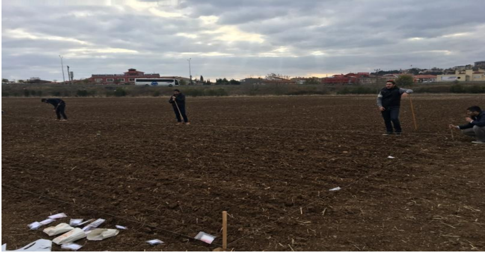
Şekil 3.2. Deneme kurulumundan bir görünüş