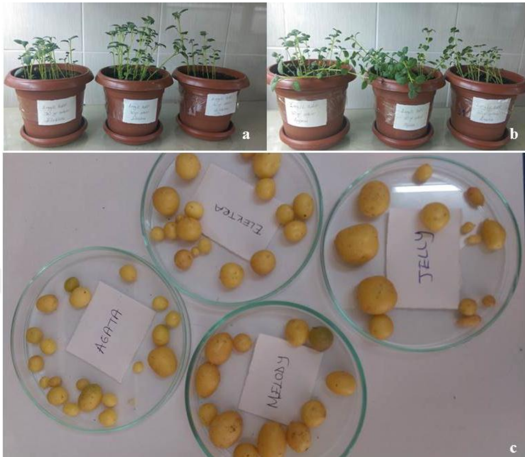
Şekil 2.3. Mikro yumruların saksılarda gelişimi ve mini yumru üretimi