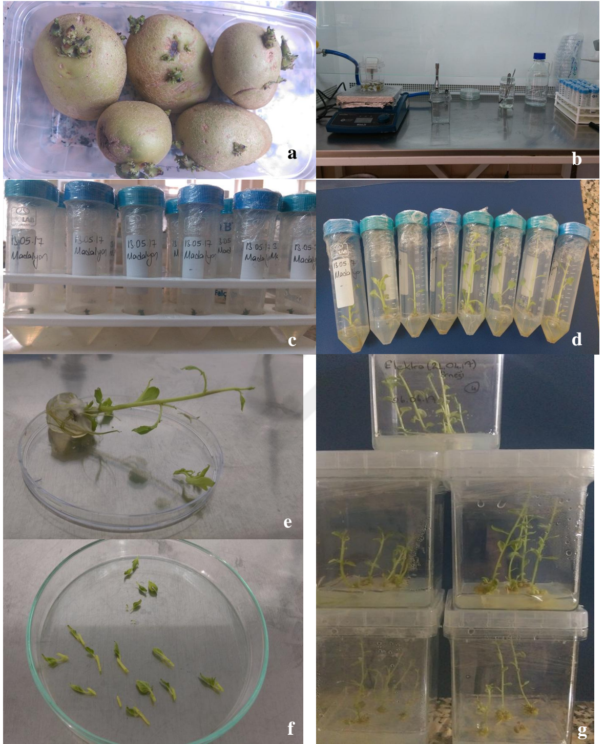
Şekil 2.1. Patateste in vivo sürgün gelişimi, sterilizasyonu ve in vitro mikroçoğaltım