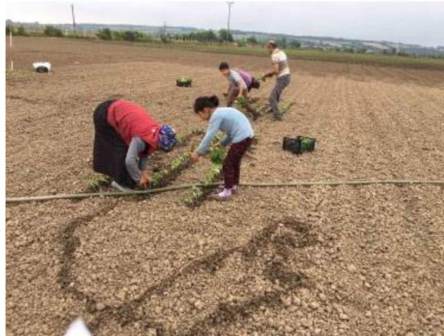
Şekil 3.8. Fidelerin araziye şaşırtılması ve can suyu verilmesi