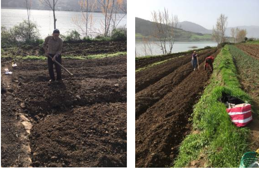
Şekil 3.3. Fideliklerin hazırlanması (28.03.2018)

Fide yastıkları yerden 10-15 cm yükseklikte, 1 metre genişlik ve 40 metre uzunluğunda hazırlanmış ve su tutmayacak şekilde tesviye edilmiştir. Yastıklarda toprak hazırlığı bittikten sonra tohumların sağlıklı gelişimi için taban gübresi olarak her bir yastığa 2.5 kg DAP gübresi uygulanmıştır. Yastıklara ekim 28.03.2018 tarihinde külle karıştırarak rüzgarsız bir havada elle yapılmıştır (Şekil 3.4).