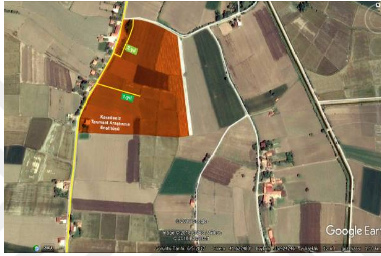
Şekil 3.1. Çalışma alanlarının haritada gösterim

Araştırma, 2017-2018 yıllarında Bafra ilçesi Türbe Mahallesi'nde bulunan Karadeniz Tarımsal Araştırma Enstitüsü Bafra istasyonunda yürütülmüştür. Çalışma alanlarının koordinat bilgileri Bafra 36°-41° kuzey enlemi ve 35°-55° doğu boylamları arasında bulunmaktadır (Şekil 3.1).