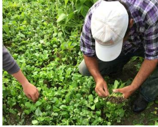
řekil 3.5. Fidelerin sökümü

büyükluęe eriřen olgun fideler çekilerek gölgeli ve nemli bir ortama alınmıřtır (řekil 3.5).