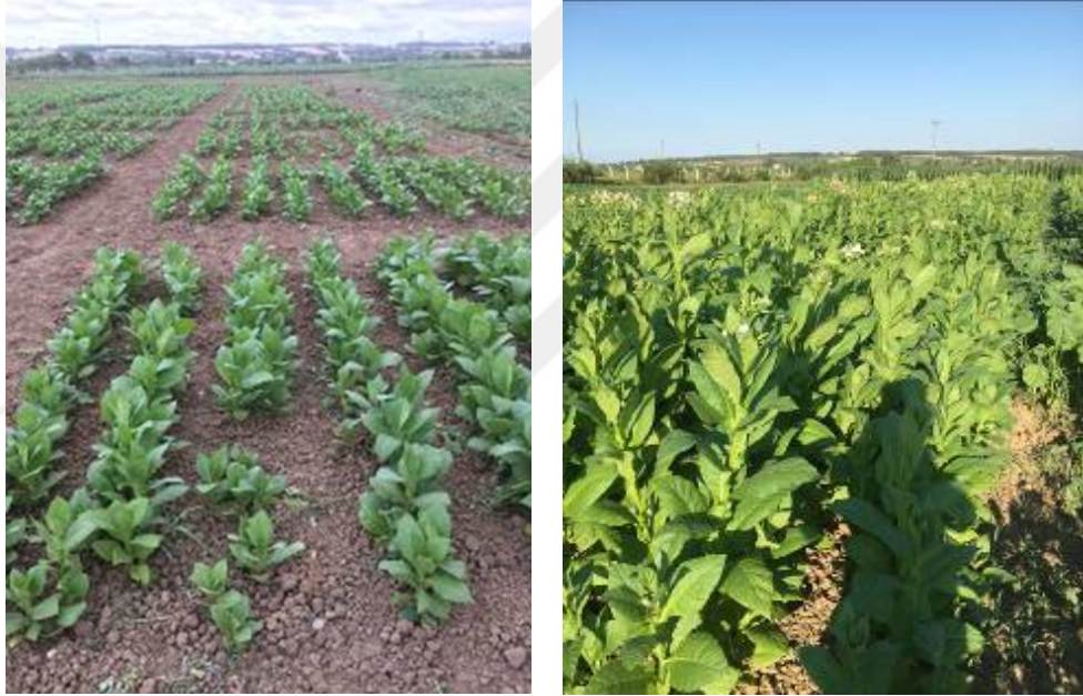
Şekil 3.9. Yabancı ot mücadelesi ve bitkilerin gelişimi

Dikimden 2 hafta sonra ilk çapa yapıldı. Çapalamada sıra arasındaki yabancı otlar çapa makinası (patpat) ile temizlenirken sıra üzerindeki yabancı otlar el ve çapa yardımı ile temizlenmiştir (Şekil 3.9). Tütünün gelişme döneminde 2 kere daha yabancı otlar çapa yardımı ile temizlendi.