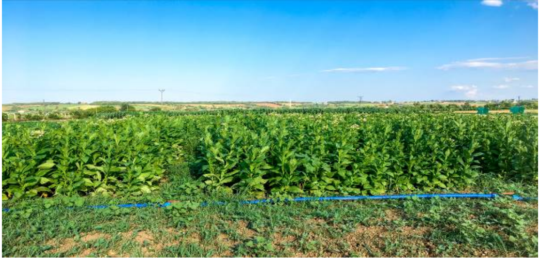
Şekil 3.11. Denemenin sulama sistemi