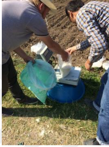
Şekil 3.7. Azotlu gübrenin tartılması

Denemede faktör olarak ele alınan azot dozlarını uygulayabilmek için amonyum sülfat gübresi 4 farklı dozda N (N1: 0 – N2: 5 – N3: 10 – N4:15 kg/da olacak şekilde) tartımları yapıldı. Tartımları yapılan amonyum sülfat gübresi, tütünlerin tarlaya dikiminden 1 gün önce deneme planına uygun şekilde ilgili parsellere uygulanmıştır (Şekil 3.7).