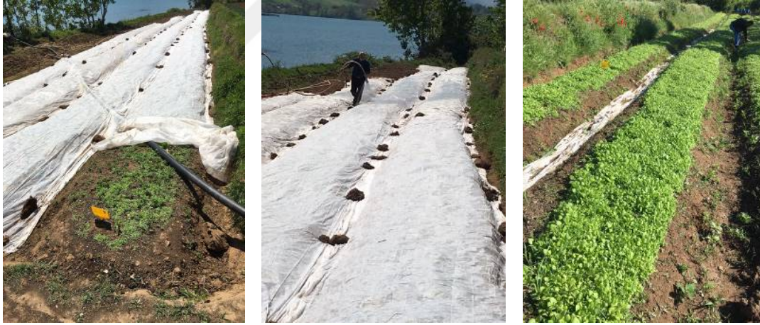
Şekil 3.4. Fideliklerin görünüşü

Fide yastıkları yerden 10-15 cm yükseklikte, 1 metre genişlik ve 40 metre uzunluğunda hazırlanmış ve su tutmayacak şekilde tesviye edilmiştir. Yastıklarda toprak hazırlığı bittikten sonra tohumların sağlıklı gelişimi için taban gübresi olarak her bir yastığa 2.5 kg DAP gübresi uygulanmıştır. Yastıklara ekim 28.03.2018 tarihinde külle karıştırarak rüzgarsız bir havada elle yapılmıştır (Şekil 3.4).