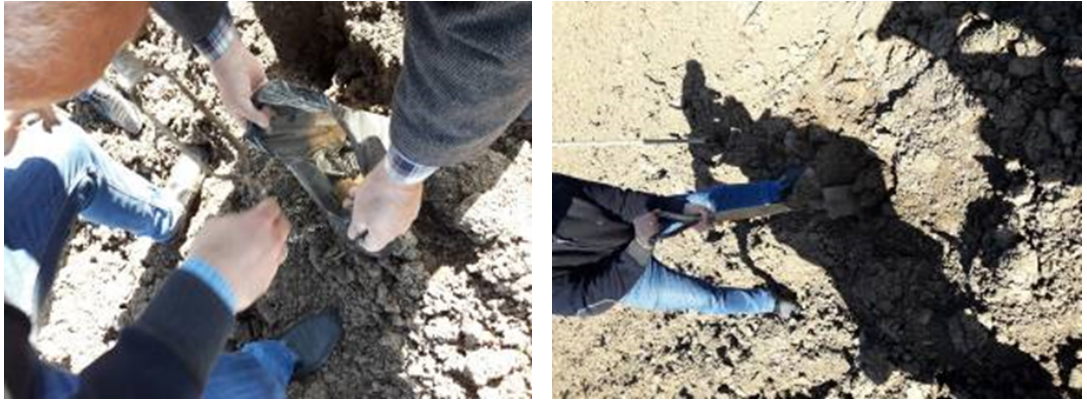
řekil 3.6. Toprak örneęinin alınması

Toprak hazırlığından önce arazinin üç ayrı bölgesinden toprak örneęi alındı. Üretilen tütünler toprak analizinde belirlenen deęerler neticesinde yapılmıřtır. Haricen topraęa herhangi bir iřlem uygulanmamıřtır. Birinci bölgeden 2 numune almak için ilk önce toprak yüzeyindeki bitki artıkları el veya kürekle hafifçe temizlendi ve takriben 3-4 cm kalınlığında 20 cm'lik toprak dilimi, üst toprak atılmadan alındı ve hemen naylon bir pořete konuldu. İkinci numune burgu yardımıyla 40 cm derinlikten alındı ve etiketiyle birlikte pořetlendi (řekil 3.6). Bu řekilde iki farklı derinlikten numuneler alınarak toprak analizi yapılmıřtır.