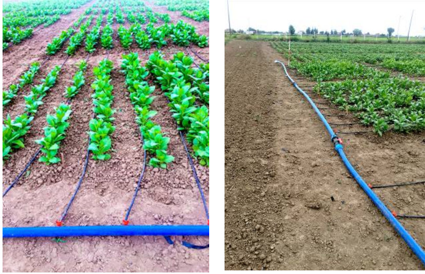
Şekil 3.10. Denemenin sulama sistemi