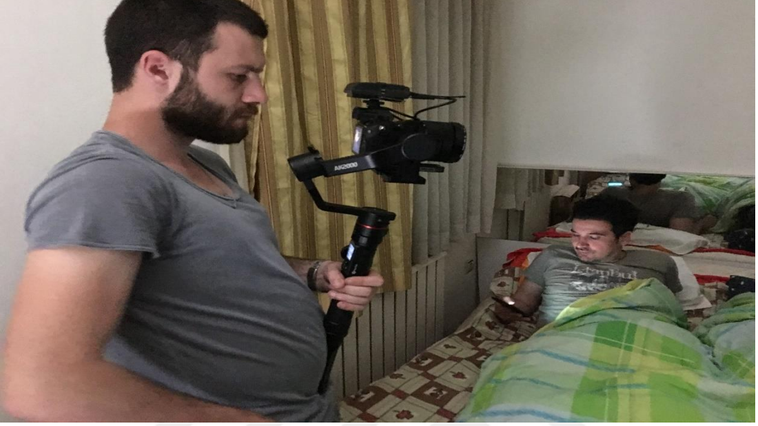
Resim 1 – Görüntü Yönetmeni ve Başrol Oyuncusunun Fotoğrafi