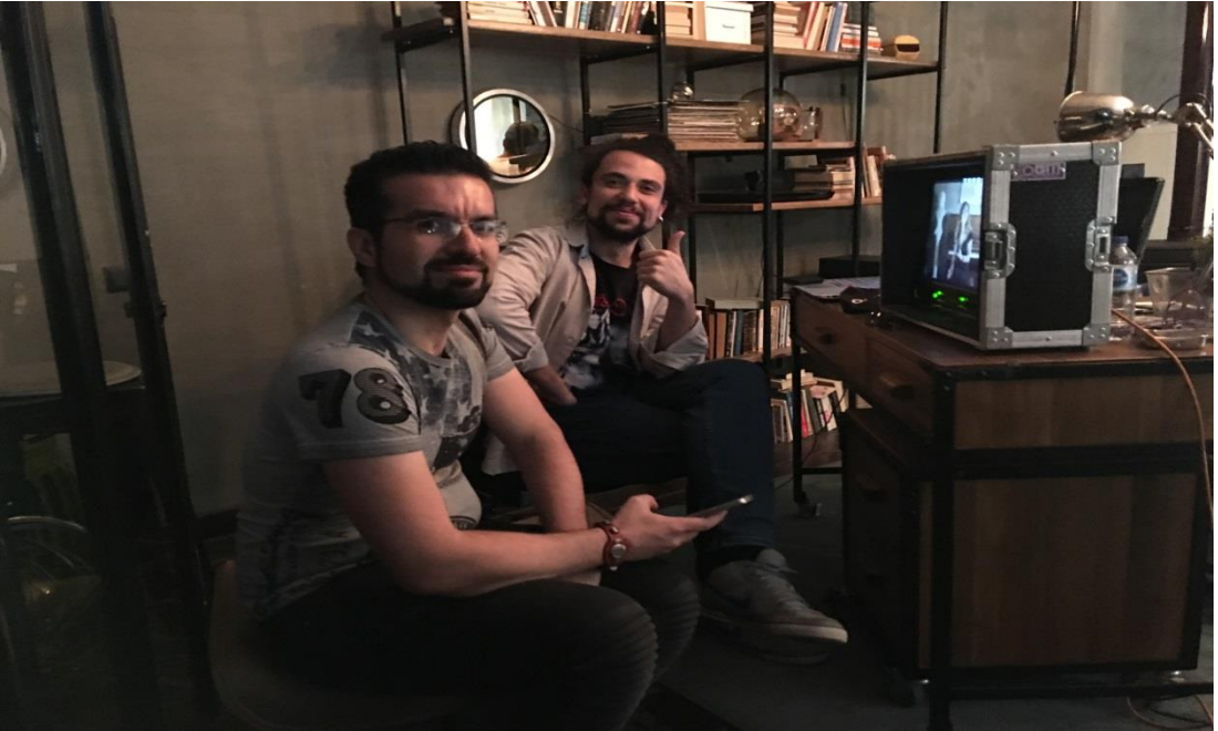
Resim 2 – Yardımcı Yönetmenin Set Fotoğrafi