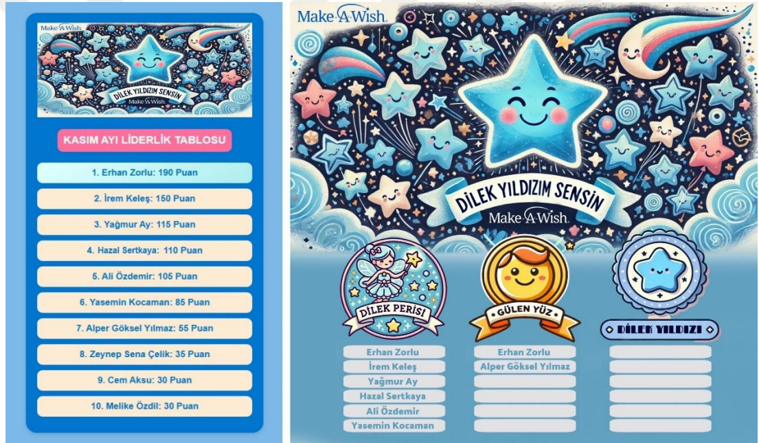
Şekil 1. Dilek Yıldızım Sensin Projesi kapsamında oluşan 2024 Kasım ayı sonu liderlik ve rozet tablosu.

2024 Yılı Kasım ayında dernek tarafından düzenlenen etkinliklerde, gönüllülerin katılım oranı ve toplam katılımcı sayısında analiz edilen verilerce, bir önceki aya göre belirgin bir artış gözlemlenmiştir. Bu husus, etkinliklerin daha fazla görünürlük kazandığını, katılımcıların bu organizasyonlara olan ilgisinin arttığını ve yaşanan etkileşimin gönüllüler arasında, olumlu bir kanı oluşturduğunu göstermektedir.