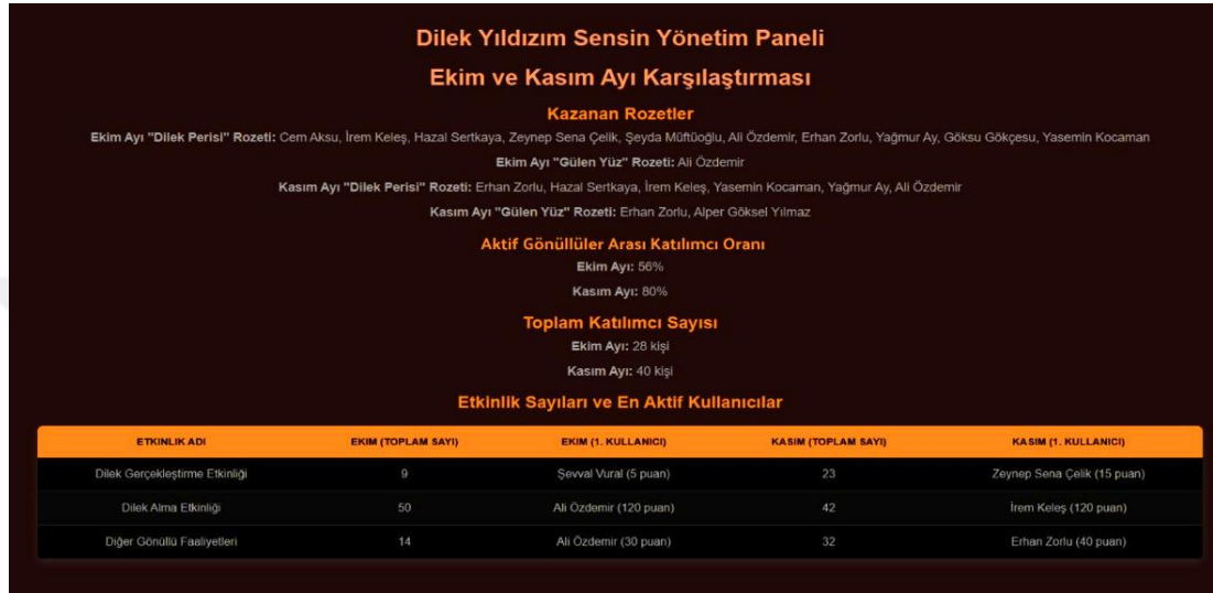
Şekil 3. 2024 Ekim ve Kasım ayları kıyaslaması, genel görünüm.

etkinliklerinin daha görünür olarak daha fazla kişiye ulaştığını, gönüllüler arasında güçlü bir iletişim ve etkileşim ortamı yaratıldığını bize düşündürmektedir. Gönüllüler arası bir etkileşimin olması oyunlaştırma projesinin iletişimsel boyutuna işaret etmektedir. Katılımcıların aralarında kurdukları bağ bize de oyunlaştırma projelerinin dernekler gibi alanlarda kullanılması hususunda gönüllüler arası iletişimi direkt etkileyen bir faktör olarak değerlendirebilme olanağı sunmuştur.