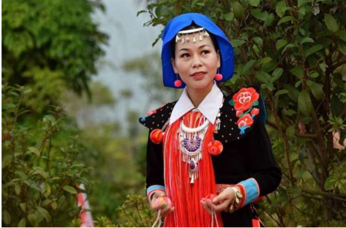
Şekil 4.3: Bir Landian Yao Kadını Uzun Kollu Siyah Bir Bluz, Beyaz Sivri Yaka ve Göğüste Sarkan İki Püskül Demetinden Oluşan Geleneksel Yao Kostümüyle Dans Ediyor (Yunnan Exploration, t.y.).

beyaz yakalardan ve göğüste sarkan iki püskül demetini sabitlemek için yakada bulunan bir çift gümüş düğmeden oluşur. Püskül esas olarak pembe, turuncu, sarı ve diğer renklerde de olabilir. Yan yırtmaçlı üst giysi dizine kadar gelir ve bele bir kemer takılır. Manşetler gök mavisidir ve dış kenarı kırmızı işlemelidir. Landian Yao kadınları yaklaşık 15 santimetre çapında bambudan yapılmış yuvarlak veya oval bir başlık takarlar (Guilin Holiday, 2014).