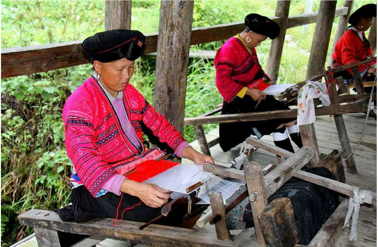
Şekil 3.2: Yao Kadınları Ahşap Tezgahlarda Dokuma Yapıyor (Guilin Holiday, 2014).

En önemli Çin kadın kahramanı Mulan'ın Ballad'ından da Çin kültüründe işleme yapmanın kadının önemli bir rolü olduğu anlaşılmaktadır. Ballad'da Mulan babasının zorunlu askerlik emrini aldığında dokuma tezgahında dokuma yapmaktadır. Hikayenin devamında ağabeyi olmadığı için Mulan babasının yerine askere gitmeye karar verir. Çok başarılı bir asker olur. Kendisine komutanlık teklif edilir fakat teklifi reddeder ve ailesinin yanına döner. Mulan evine dönüp erkek kıyafetlerini çıkardığında, asker arkadaşları onun bir kadın olduğunu fark edince çok şaşırırlar. Birlikte savaştıkları on iki yıl boyunca hiçbiri onun erkek olduğundan şüphelenmemiştir (Naudus, 2020).