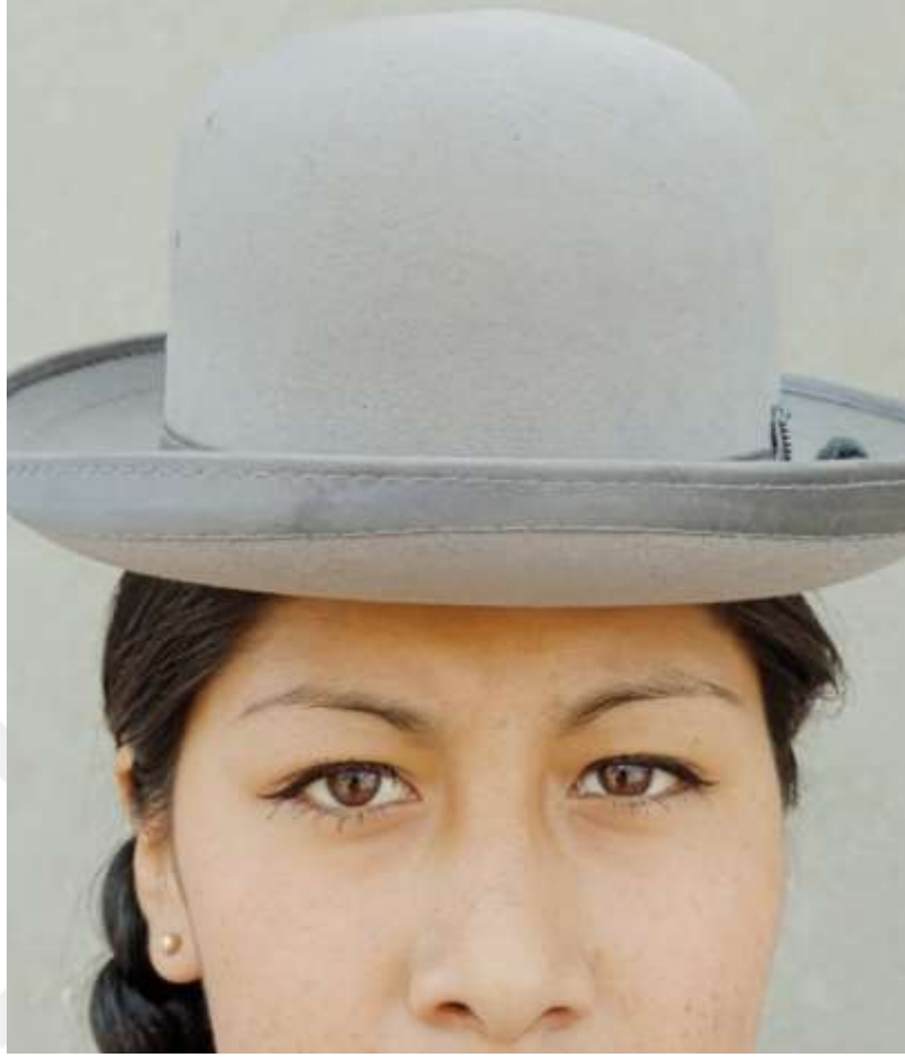
Şekil 4.20: Kolita Melon Şapkasıyla Poz Veriyor (Dörr, 2018).

Kolitraller arasında melon şapka takan kadınların doğurganlık sorunu yaşamadıklarına dair bir inanış yaygındır. Bu inanışın “Pachamama” yani “Toprak Ana” mitolojik figüründen geldiğine inanılmaktadır. Pachamama insanlarla toprak arasındaki bağlantıyı temsil eder. Dünya gibi bombeli olan bu şapkaların da kadına doğurganlık verdiğiğine inanılmaktadır.