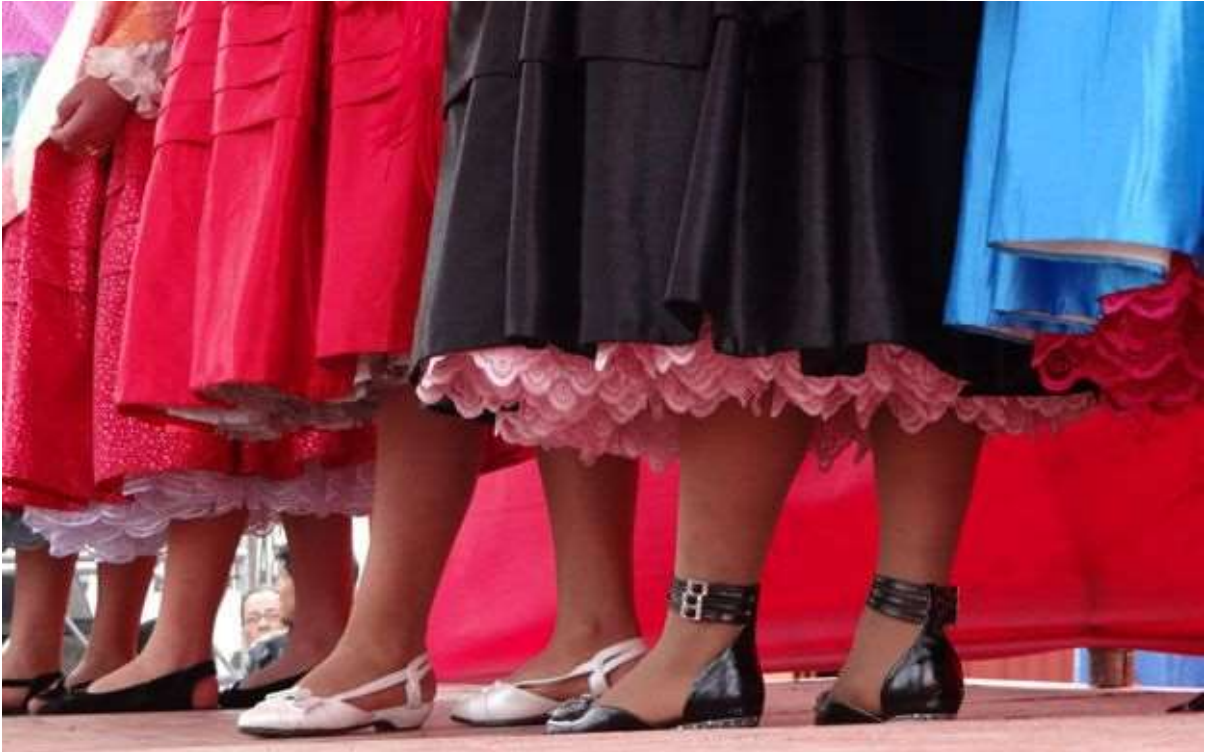
Şekil 4.19: Kolitalar Babetleri Ve Kabarık Etekleriyle Dans Ediyorlar (Dear, 2014).

Kadınlar eskiden Avrupa tarzı bilekte botlar giyerken şimdi babet gibi yuvarlak burunlu düz ayakkabılar giymektedirler.