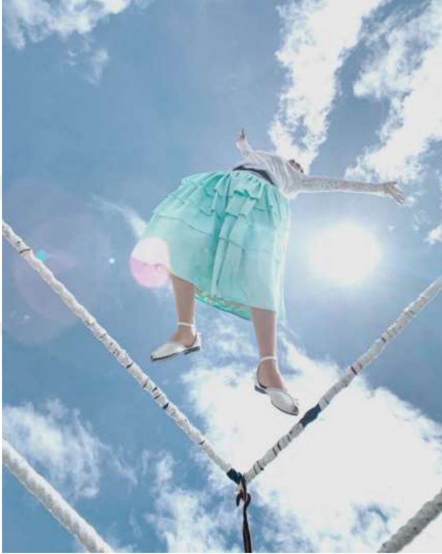
Şekil 3.11: Kolita Dövuşürken Adeta Uçuyor (Dörr, 2018).

Bolivya'nın Uçan Kolitaları modern güreşi topluluklarının aktivizm tarihi ile birleştirmişlerdir. Regarenk kıyafetleri, katmanlı etekleri, işlemeli şalları ve melon şapkalarıyla uçan Kolitalar olarak bilinen eşsiz bir kadın güreşçi grubunu oluştururlar.