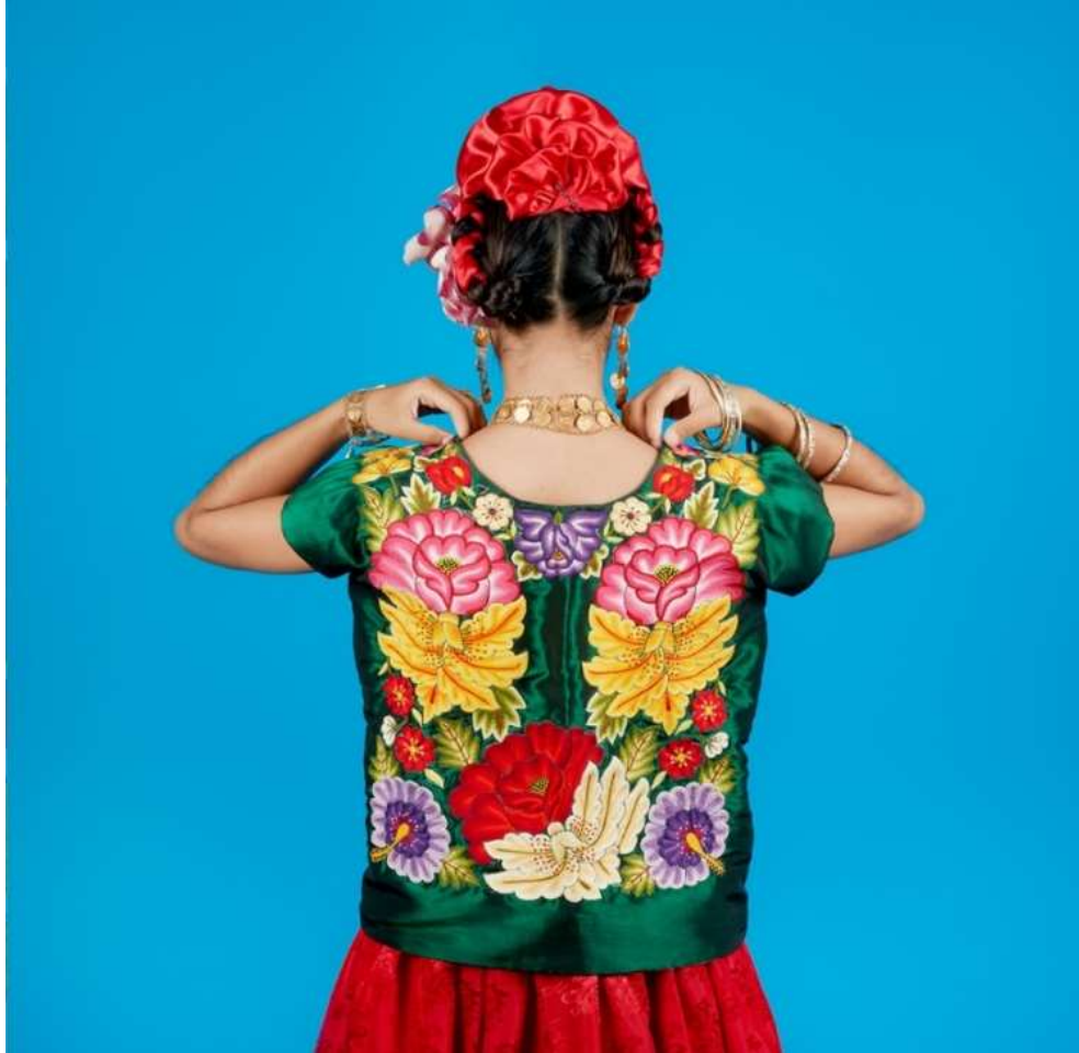
Şekil 4.21: Tehuana İşlemeli Bluzuyla Poz Veriyor (Blast, 2021).

Bluz Meksika'nın yerli bölgelerinde yaygın olarak benimsenmiştir. Meksika vadisi ve Puebla eyaletinden gelen bluzlar köşelidir, kutuya benzer bir görünüme sahiptir ve kare yakalarıyla karakterizedir. Yaka ve kollarında zengin işlemleri vardır.