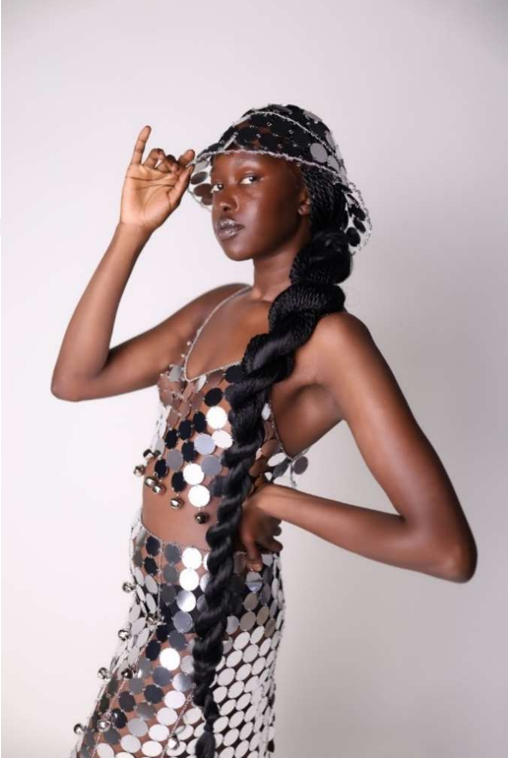
Şekil 5.1: Tasarımın Yakın Çekimi.