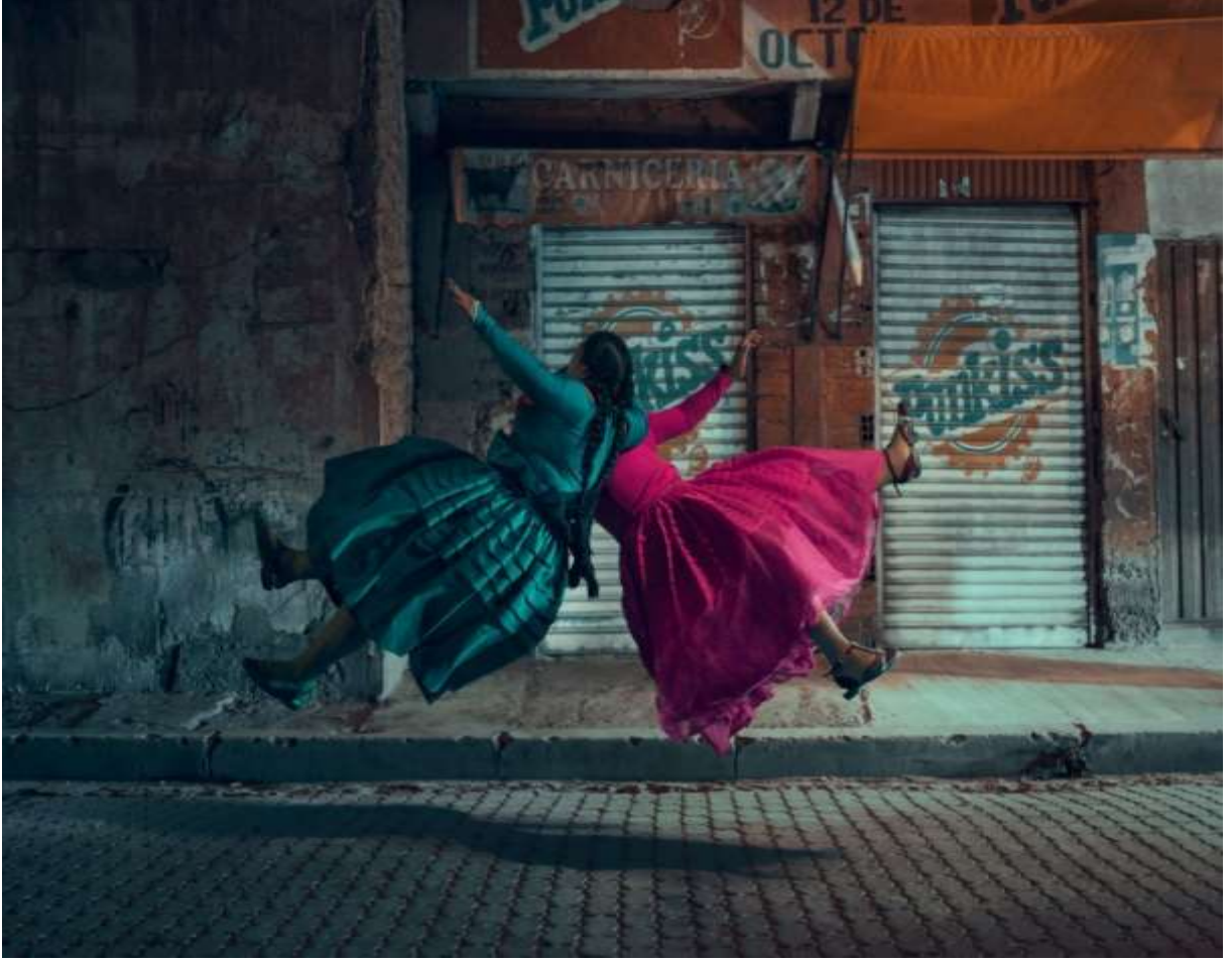
Şekil 2.1: Kolitalar Parlak Renkli Kıyafetleriyle Havada Güreşiyorlar (Antony, 2022).

İnsanlar kendi varoluşlarının kırılganlığının ve ölümlülüklerinin farkındadırlar. Bu varoluşsal belirsizliğin bir sonucu olarak dünyanın anlamı ve kişinin bu dünyadaki varlığına ilişkin soruların yanıtlarına temel bir ihtiyaç vardır. Bu bağlamda “anamlı varoluş” insanın temel bir ihtiyacıdır. İnsanlar hayatlarının bir anlamı ve amacı olduğuna inanmak isterler. Antropologlar etnik kimliğin yaşamın anlamı ile ilgili sorulara yanıt sağlayabileceğini savunurlar. Belirli kültürel dünya görüşleri ve inanç sistemleri, dünyaya değer ve amaç dayatan ortak bir gerçeklik anlayışı oluşturur. Kişisel çıkarların, ve zevklerin ötesine geçen bir amaç; ilkelere inanılmasını sağlar ve varlığı anlamlı kılar. Araştırmalar insanlara ölümlü oldukları hatırlatıldığında kültürel dünya görüşlerinin güçlendiğini göstermektedir. Kültürel veya dini dünya görüşüne yönelik bir saldırı, özellikle de kişinin anlamlı varoluşu buna bağlıysa çok tehditkardır. İnsanlar farklı davranarak kendi kültürel dünya görüşüne meydan okuyan bireyleri veya grupları reddetme ve dışlama eğilimindedir.