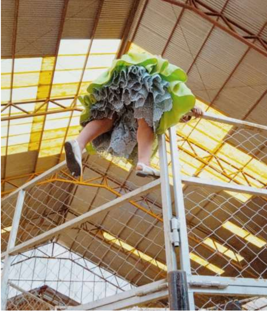
Şekil 3.13: Kolita Dövüşten Kaçıyor (Dörr, 2018).

Dolores de El Alto Spor Merkezi'ndeki ring, bir çitle çevrilidir ve maçlar her zaman tezahürat yapan, taraftarlarla doludur. Yılda bir kere toplu bir dövüş yapılır. Bu dövüşlerde kaçmak isteyen herkes çitlerden atlar ve içerideki son kişi dövüşü kazanır (Butet Roch, 2018).