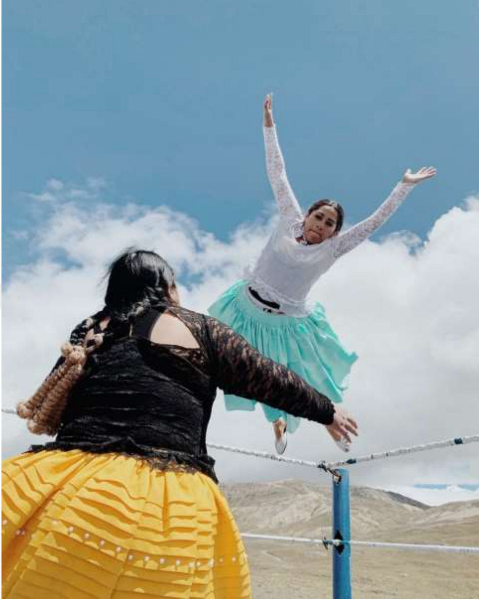
Şekil 3.17: Kolita Benita Dövüşüyor (Dörr,2018).

El Alto’da kadınların güvenliği ihlal edildiğinde, kızların eğitimi aksadığında veya kadınlar yeterince iyi sağlık hizmeti alamadığında, Uçan Kolitalar dövüşe hazırdır. Herkes dövüşü izlemeye gider, çünkü bu dövüş özünde Aymara kadınının drammatizasyonudur (Butet Roch, 2018).