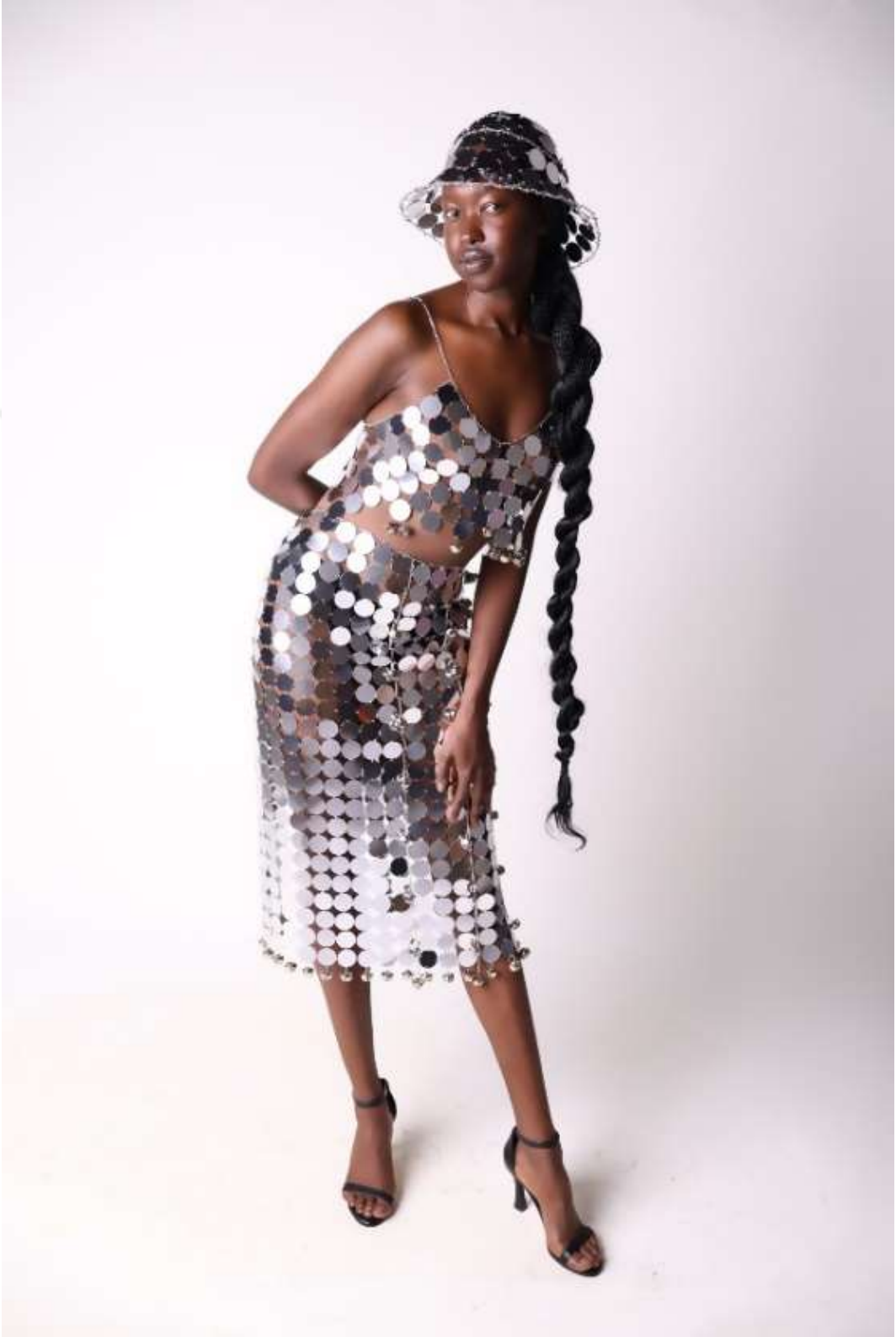
Şekil 5.4: Tasarımın sağ profilden çekimi.