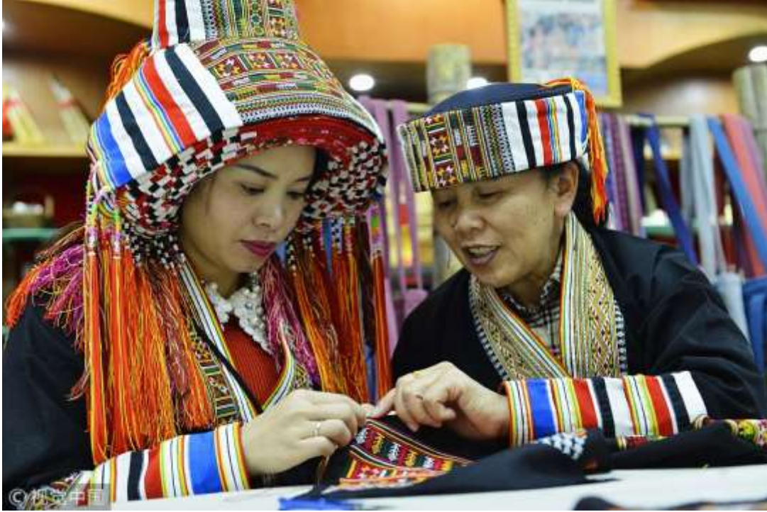
Şekil 4.4: Güney Çin'in Guangxi Zhuang Özerk Bölgesi'nin Hezhou Şehrinde Geleneksel Kostümlü İki Kadın, Yao Kostüm Yapma Tekniklerini Tartışıyor (Chinadaily, 2017).

Guangxi, Longsheng ilçesindeki Panyao kadınları her zaman koni şapka takarlar. Bu şapka etrafı ince işlemeli bir kumaşla kaplanmış bambu ve kenevir kamışlarıyla örülmüş bir çerçeveden oluşmaktadır (Science Museums of China, t.y.).