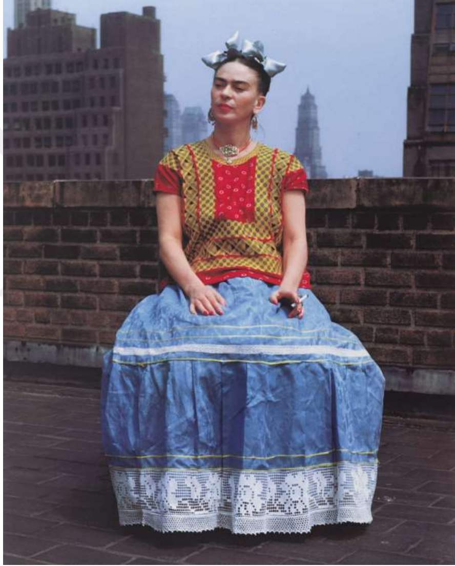
Şekil 3.18: Frida Kahlo Tehuana Kıyafetiyle Poz Veriyor (Nickolas Muray, 1946).