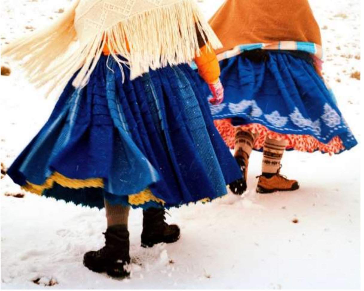
Şekil 3.6: Kolitalar Katmanlı Etekleri Ve Tırmanma Botlarıyla Dağa Tırmanıyorlar (Yumna Al-Arashi, 2019).

Tırmanma Kolitaları dağların zirvesine çıkarken geleneksel pollera eteklerini giyerler ve yün şallarını takarlar. Tırmanış ipleri ve kemeri gibi tırmanma ekipmanlarını, sırtlarında aguayo olarak adlandırılan renkli dokuma battaniyelere sarılı olarak taşırlar. Onları soğuktan koruyan katmanlı giysileri ve tırmanma botlarıyla karlı dağlara cesurca tırmanırlar.