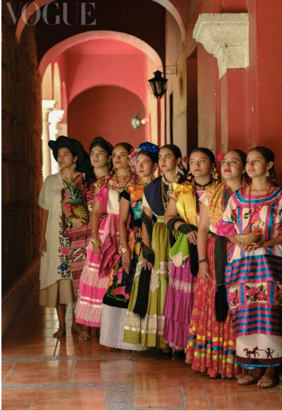
Şekil 3.29: Guelaguetza Festivali'nde Oaxaca Kadınları Geleneksel Kostümleriyle Poz Veriyorlar (Lazo, 2022).