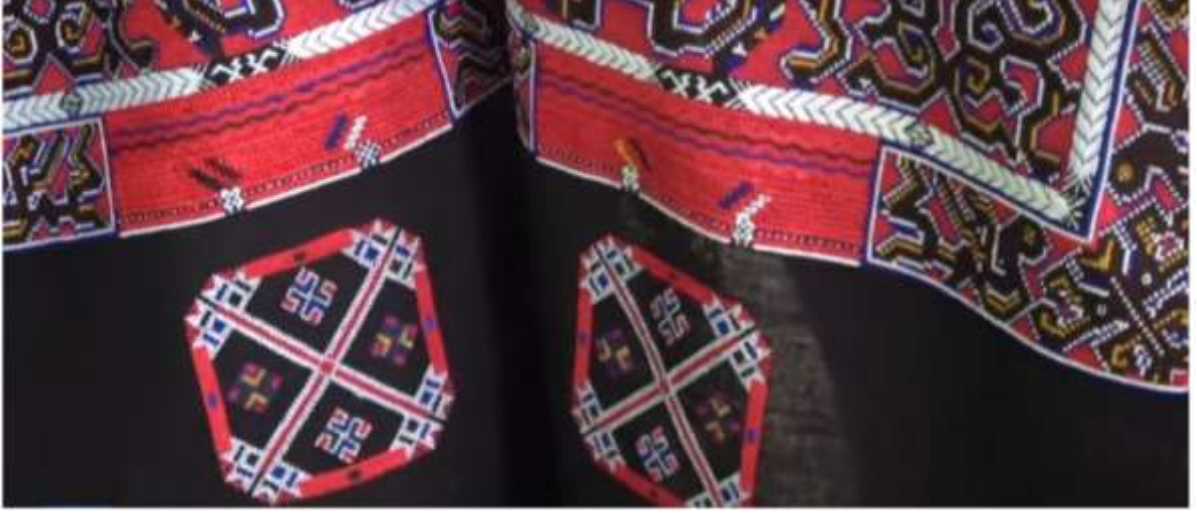
Şekil 4.6: Kaplan Pençesi İşleme (The Kindcraft, t.y.).