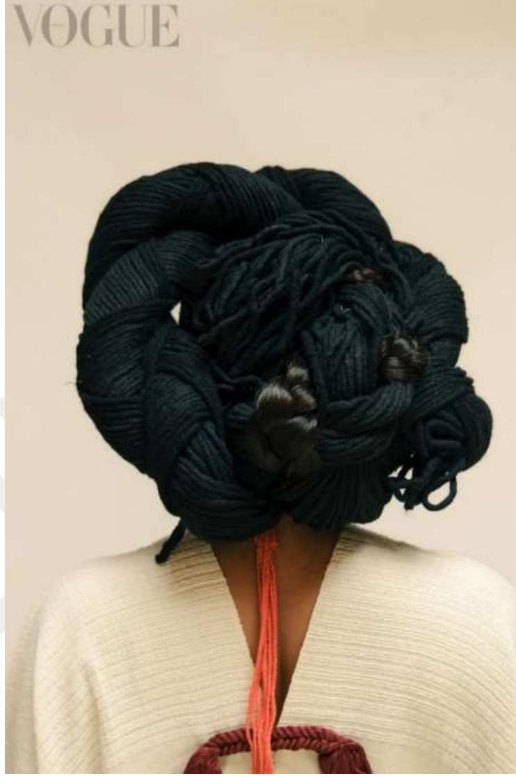
Şekil 3.26: Mestas Yılan Topuzuyla Poz Veriyor (Lazo, 2022).

Huautla de Jiménez, dokumacılar tarafından yapılan bluzlerde temsil edilen mistik hikayelere sahne olan dağ manzaralarıyla ünlüdür. Kadınlar çıplak ayakla yaptıkları son de flor de naranjo dansını yaparken geleneksel kıyafetlerini giyerler. Huautla de Jiménez'in kadınları saçlarını örerler ve uzun örgülerine bölgede yetişen kahveyi simgeleyen pembe kurdeleler ve gökyüzünü simgeleyen mavi kurdeleler takarlar.