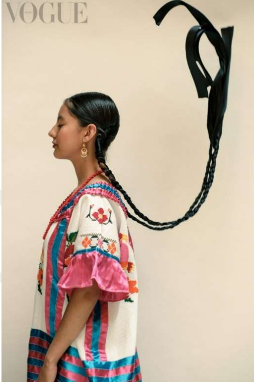
Şekil 3.27: Oaxaca Kadını La Canada Geleneksel Kostümüyle Poz Veriyor (Lazo, 2022).

Guelaguetza performansı için giyilen Solteca kostümü “Poplin kumaş üzerine bölgeye özgü çiçek veya hayvan motifleriyle işlenmiş bir bluz, bir adet göğüsleri desteklemek için kullanılan ipek eşarp ve bir chilena dansını yaparken teri kurutmak için kullanılan bir eşarptan oluşur.” diye açıklıyor Guelaguetze Festivali’nde chilena dansını yapan Huerta (Sánchez, 2022). Etekler, çiçek desenli ham pamuktan yapılmıştır ve çok renklidir. Altına beyaz bir iç etek giyilir. Kostüm, bölgede yaygın olan yılanlardan koruma sağladığına inanılan botlarla tamamlanır.