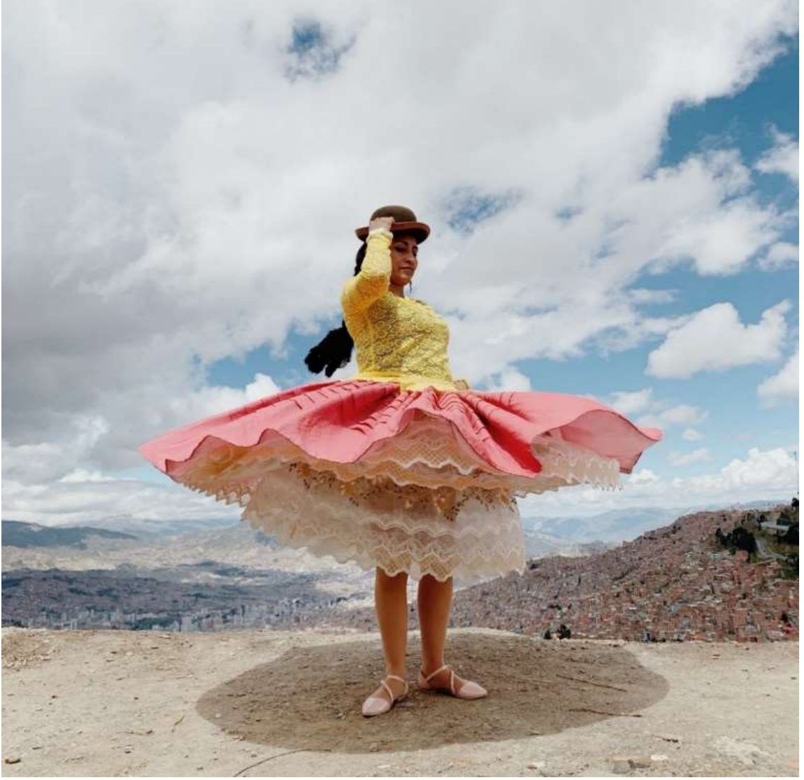
Şekil 4.16: Kolita Eteğinin Altına Giydiği Kabarıklık Veren Dantelli İç Eteğiyle Poz Veriyor (Dörr, 2018).

Bluz, genellikle dantelli olup iklim şartlarına göre kısa veya uzun kollu olarak tercih edilir. Estetik mevsimlere göre değişse kostümün geleneksel ana bileşenleri her zaman aynı kalır (Keefe, 2016).