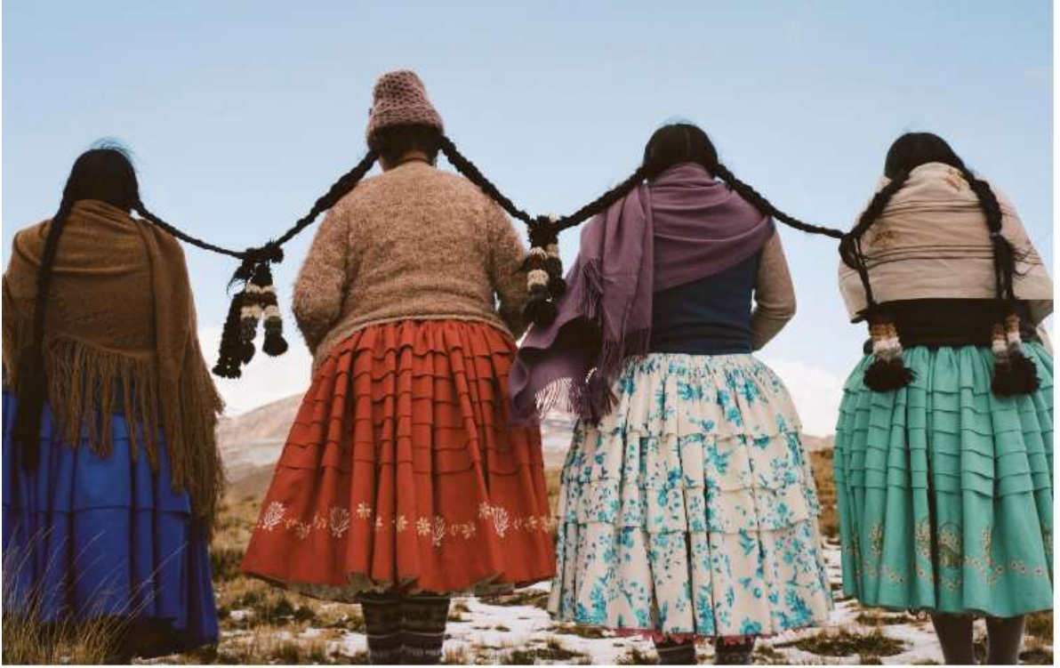
Şekil 4.13: Kolitalar Birbirlerine Bağlı Örgüleriyle Poz Veriyorlar (Yumna Al-Arashi, 2019).

Bugünün Kolita kostümü, İspanyolların 18. yüzyılın sonlarında yerli halka geleneksel kostümlerini giymeyi yasakladıkları katı kuralların uygulanması sonucu ortaya çıkmıştır. Avrupa kıyafetlerini benimsemeye zorlanan yerli kadınlar, kendi geleneksel renk ve desenlerini Avrupa kesimleri ile buluşturmışlardır. Bolivya'da kadınların yüzyıllar boyunca İspanyol yerleşimciler tarafından giymeye zorlandıkları bu katmanlı etekler, şimdi onların kimlik ve gurur sembolü haline gelmiştir. Bolivya'da güçlü batı moda trendinin etkisine rağmen Kolitalar geleneksel kıyafetlerini korumuşlardır. Kolitalar geleneksel kıyafetlerini gurur ve özgüvenle giymektedirler.