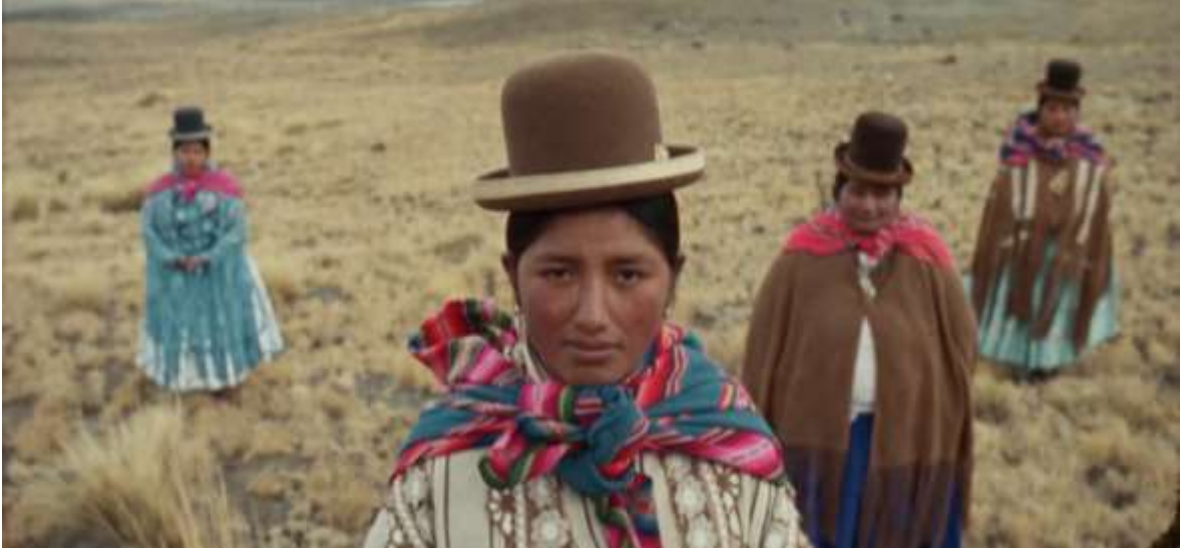
Şekil 4.18: Kolitalar şalları ve aguayo battaniyeleriyle poz veriyorlar (Yumna Al-arashi, 2019).

Kadınlar eskiden Avrupa tarzı bilekte botlar giyerken şimdi babet gibi yuvarlak burunlu düz ayakkabılar giymektedirler.