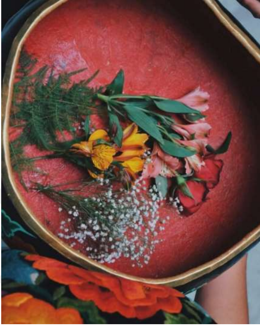
Şekil 4.25: Tehuana'nın Sepetindeki Çiçekler (Lazo, 2022).