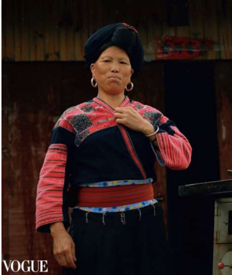
Şekil 4.1: Kırmızı Yao Kadını Geleneksel Kıyafetiyle Poz Veriyor (McQuay, 2023).

Beyaz Panotlon Yao kadınlarının elbisesi omuzlardan birleştirilen önü siyah, arkası boyalı ve işlemeli iki parça kumaştan oluşur. Altına ağaç özüyle boyanmış dairesel desenlerin yer aldığı mavi pilili bir etek giyerler.