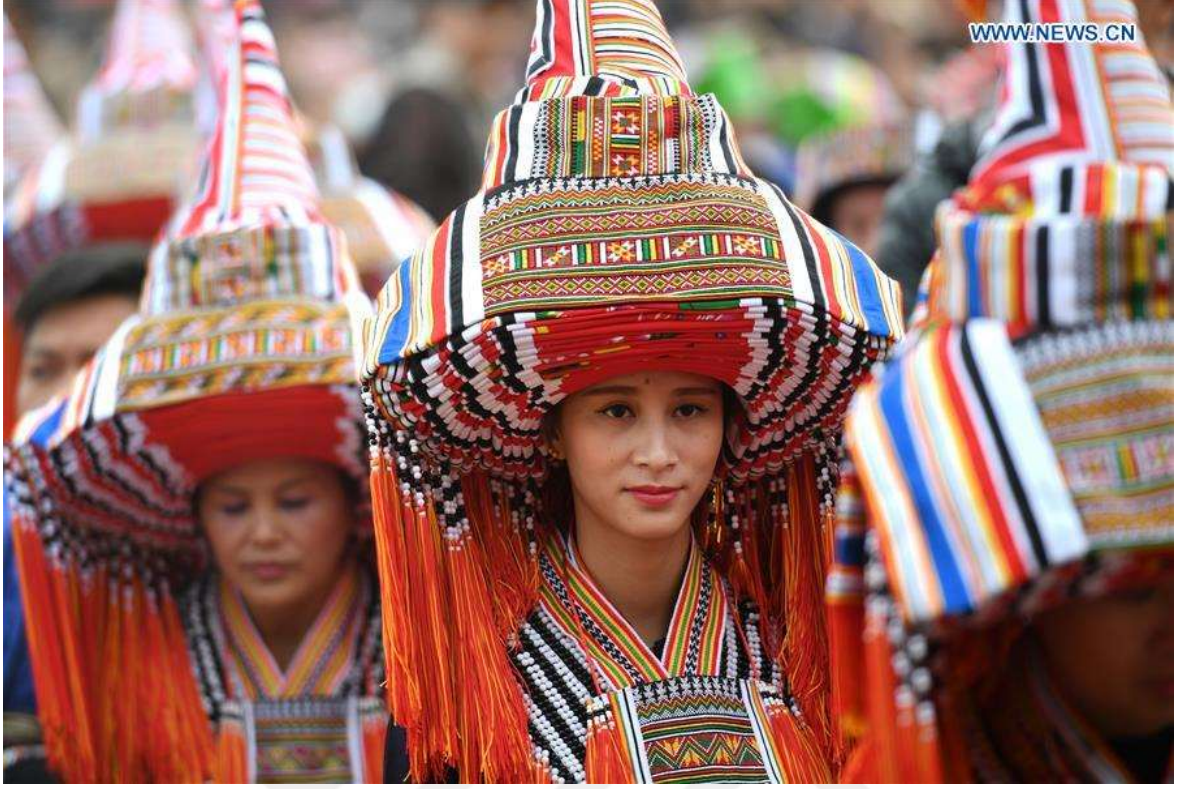
Şekil 4.5: Pan Yao Kadını Koni Şapkasıyla Poz Veriyor (Ailin, t.y.).