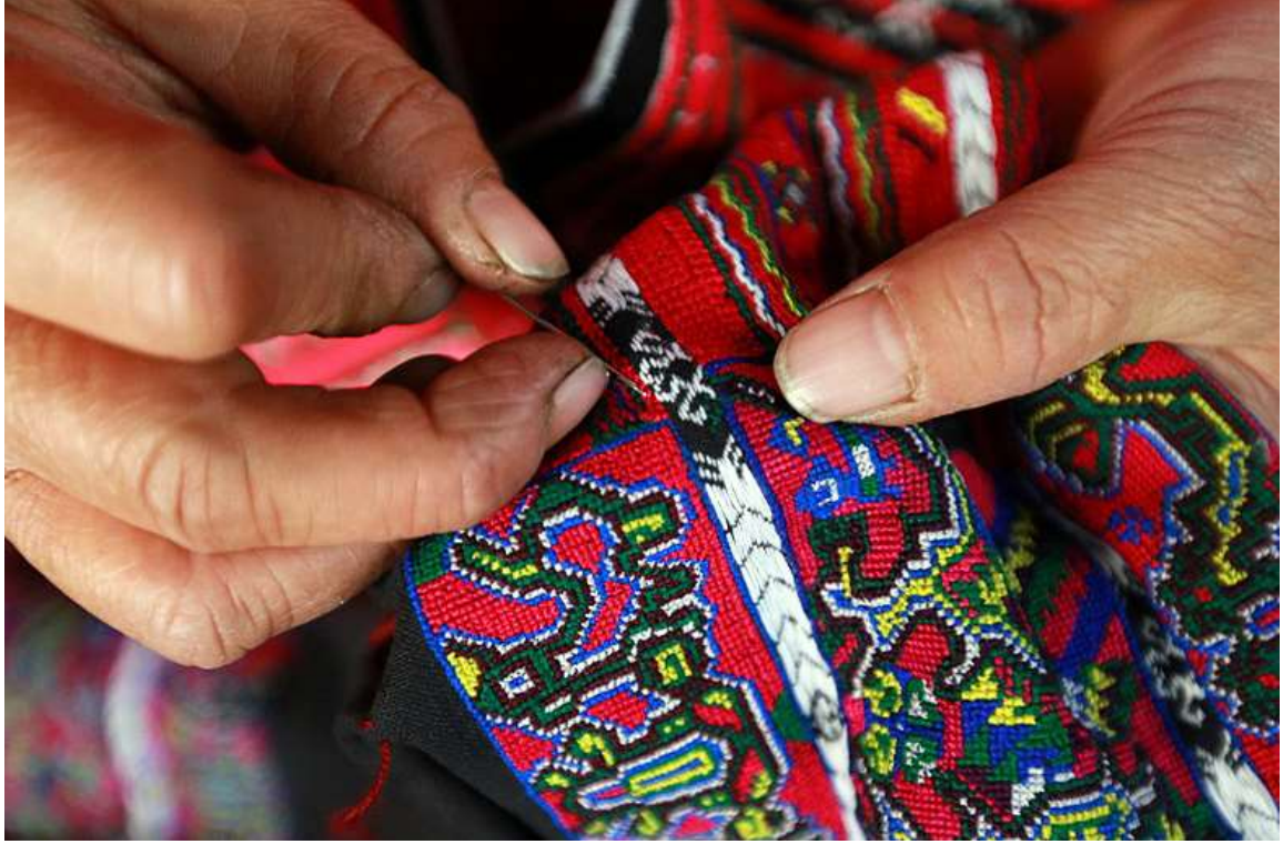
Şekil 3.1: Yao Kadını İşleme Yapıyor.

hazırlamaya başlarlar. Bu özel günlere yakışır bir kıyafetin elde işlenmesi üç yıl sürer. Ahşap dokuma tezgahı kullanmak süreci önemli ölçüde hızlandırır ancak kadınlar genellikle bu kıyafetleri elde işleyerek, geleneklerini ve nakış becerilerini korumayı tercih ederler. Güzel işlemeli kıyafetler yapmak ve giymek Yao kadınlarının gurur kaynağıdır.