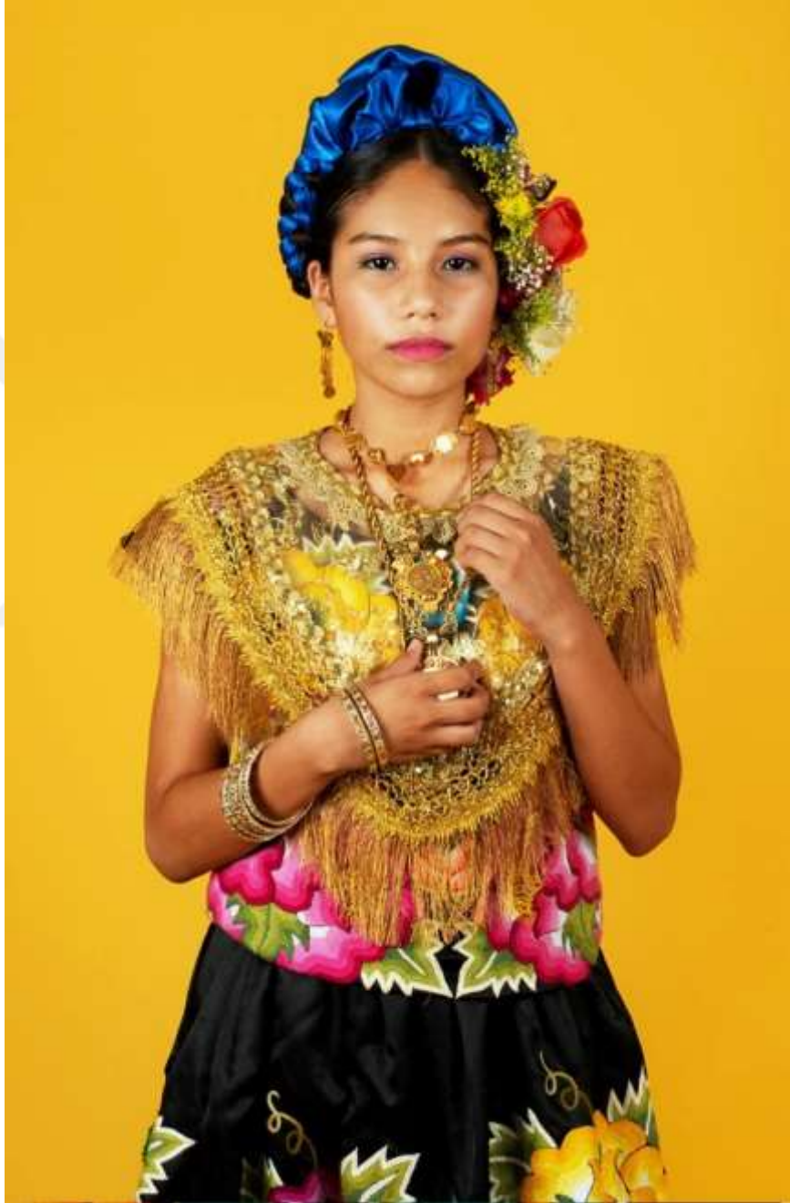
Şekil 4.26: Tehuana Altın Takılarıyla Poz Veriyor (Blast, 2021)

Amerika Birleşik Devletleri ve Guatemala madeni paralarından oluşan altın sikkelerden oluşan kolyeler onlar için özgürlük anlamına gelmektedir. Bu sebeple Tehuanalar tüm servetlerini bu ağır altın kolyelere dönüştürürler (King, 2002). Bir Tehuana altın takıları olmadan tam olarak hazırlanmış sayılmaz.