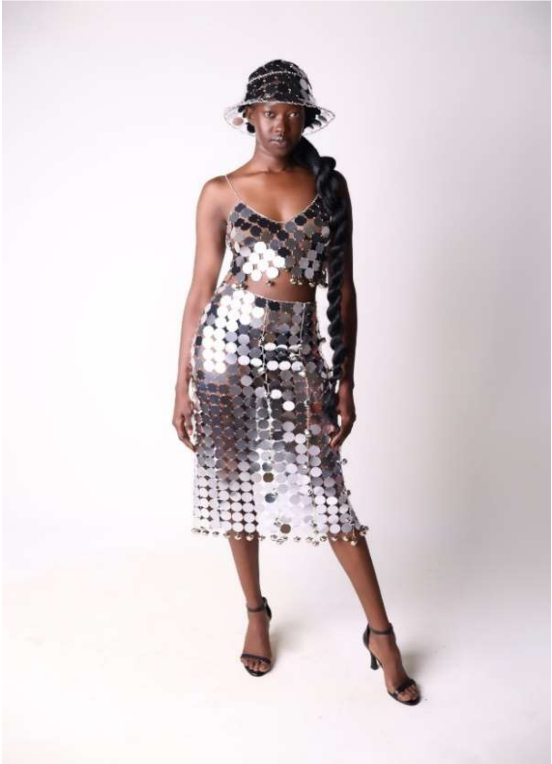
Şekil 5.3: Tasarımın Önden Çekimi.