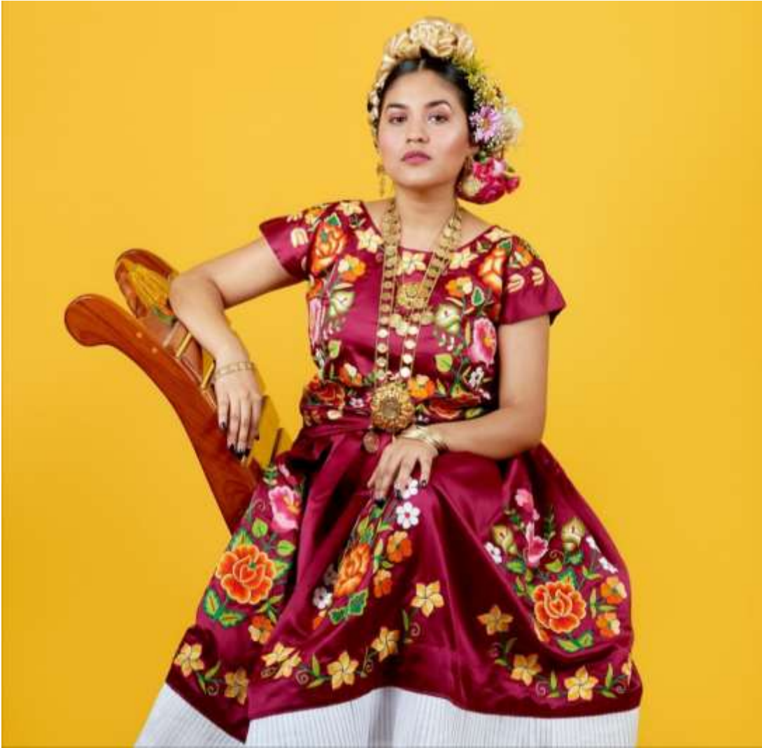
Şekil 4.22: Kolita İşlemeli Etek Ve Bluzuyla Poz Veriyor (Blast, 2021).

Pollera olarak adlandırılan etek, geleneksel Kolita kıyafetinin vazgeçilmez bir parçasıdır. Renkli, uzun örme bir etektir. Yuvarlak ve kabarık bir etki oluşturmak için altına işlemeli iç etek giyilmektedir.