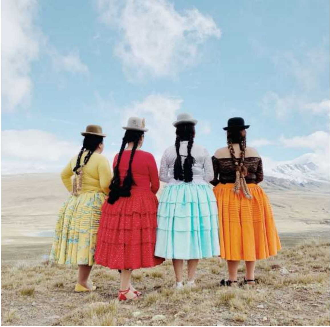
Şekil 4.15: Bir Grup Kolita Kabarık Etekleriyle Poz Veriyor (Dörr, 2018).

Büzgülü etek yani “pollera” bileklere kadar uzanır, renkli ve kabarıktır. Bolivyalılar tarafından kalçaları büyük gösterdiği için kadının en çekici kıyafeti olarak kabul edilir.