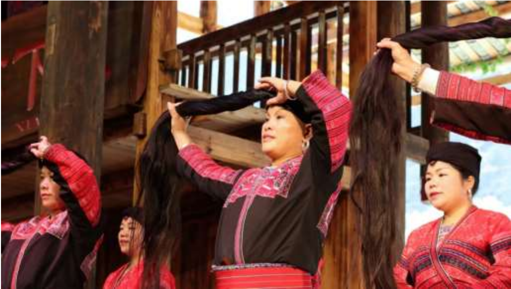
Şekil 3.3: Yao Kadınları Uzun Saç Festivali’nde Saçlarını Topluyorlar (Yao Secret, 2023).

Tören Guangxi eyaletindeki Longji’de üçüncü ayın üçüncü günü Zincir Köprü’de saat 10’da davulların çalınmasıyla başlar. Misafirler yerel olarak üretilen pirinç şarabı ile tatlı ve yapışkan pirinç ile karşılanır. Törende genç kıza özel bir ağaca kadar eşlik edilir. Burada annesi kızının başörtüsünü açar ve kızının saçını tarar. Kız kardeşleri, annelerine teşekkür eden eski bir şarkıyı söylerlerken annesi kutudan makası çıkarır ve yıllar boyunca koruyuculuğu için ona teşekkür etmek amacıyla bir tütsü yakar. Bu işlem tamamlandıktan sonra makas saygın büyükannenin eline verilir ve torununun saçını, hayatı boyunca bir kere olmak üzere keser. Anne kesilmiş saçı dikkatlice bir beze sarar ve saklamak için bir kutuya koyar (Yao Secret, 2023).