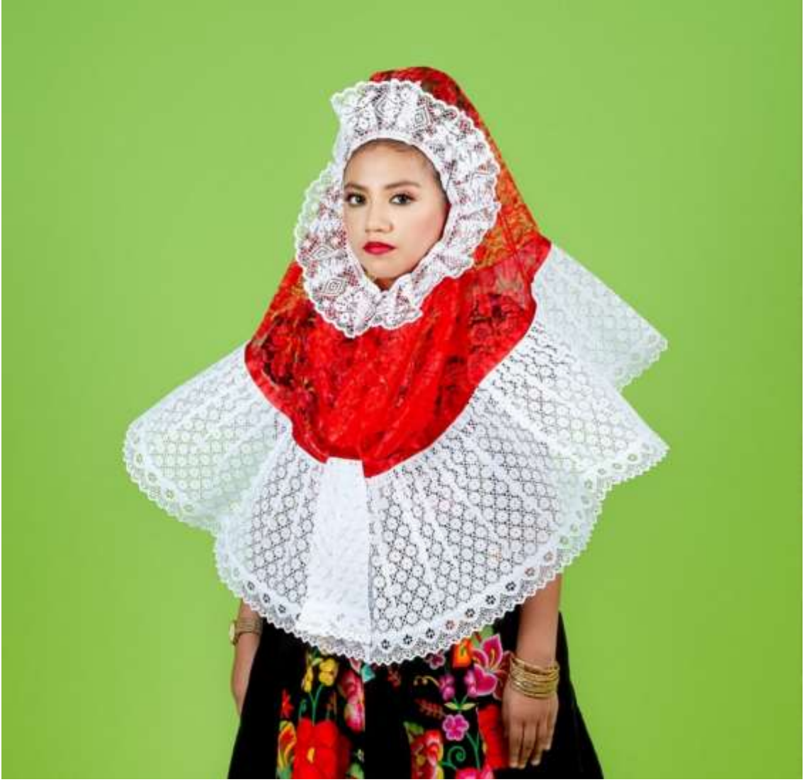
Şekil 4.23: Kolita Resplandor Başlık İle Poz Veriyor (Blast, 2021).