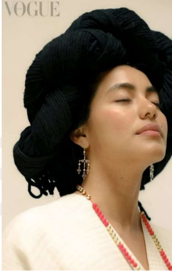
Şekil 3.25: Mestas Geleneksel Bluzu ile Poz Veriyor (Lazo, 2022).

Mitoloji adeta Yalalag geleneksel bluzunun ipliklerine işelenmiştir. Bir Yalalag kadını bu bluzu giydiğinde, İspanyol fatihlerin San Juan Bautista kilisesini inşa etmek için Yalalag'da bir kopal ağacını kestiklerinde doğduğu söylenen 13 Yılan Tanrıçası efsanesini canlandırır. Zapotek kültüründe bu tanrıça, verimlilik ve bereket ile ilişkilendirilir.