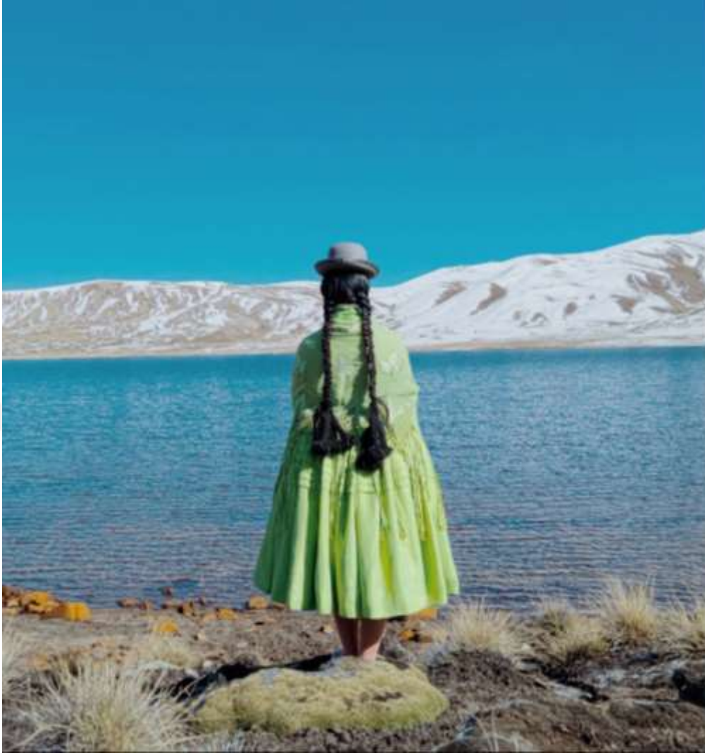
Şekil 3.5: Kolita Juanita El Alto'da Manzarayı İzliyor (Dörr, 2018).

İspanyol yerli halkı Kolitaları Avrupa kıyafetlerini benimsemeye zorlamıştır. Kolitalar da bu kıyafetleri güçlendirip kendi kültürlerine göre şekillendirmişlerdir. Kolitaların mücadelesi o kadar ses uyandırmıştır ki, Kolita giyimi düşük sosyal statünün bir göstergesi iken şimdi bir moda sembolü haline gelmiştir. Günümüzde tasarımcılar, bu kadınların renkli geleneksel kıyafetlerden ilham almaktadır (Babinski, 2022).