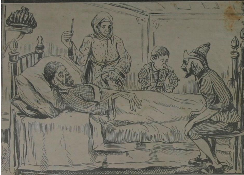
Görsel 4.3.3 Anonim, Karikatür 1919, Karagöz Gazetesi. Erişim: 15.09.2024