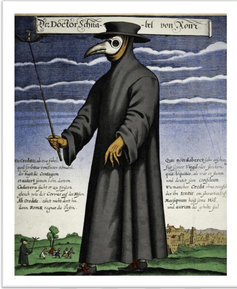
Görsel 4.1.2 Paulus Fürst, Doctor Schanabel Von Rom, 1656, Gravür, British Museum. Erişim:

23.04.2024 https://course-exhibits.library.dartmouth.edu/s/anthro7/item/1100