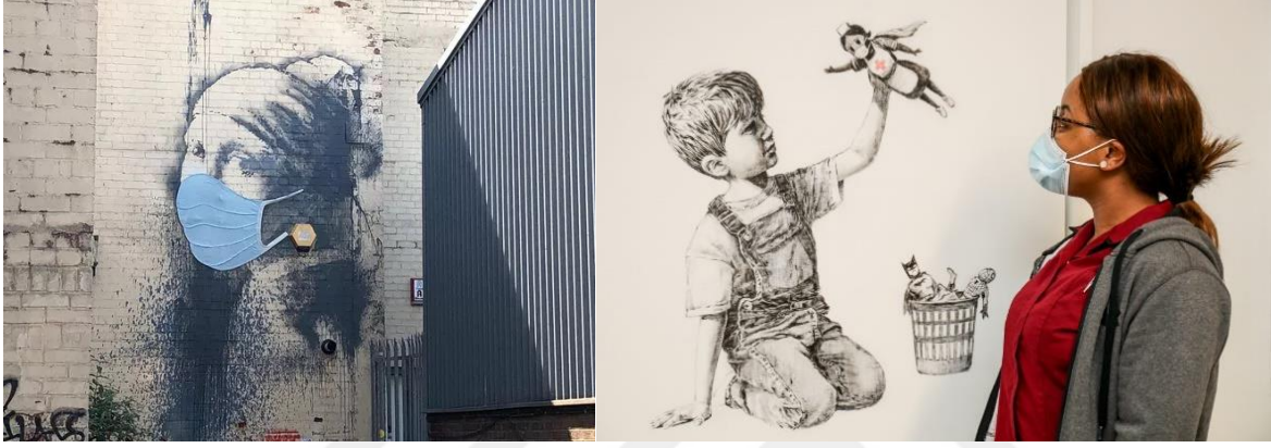
Görsel 5.7 Banksy, Vermeer's Girl with a Pearl Earring, 2020. Erişim: 29.10.2024 https://www.bbc.com/news/uk-england-bristol-52382500