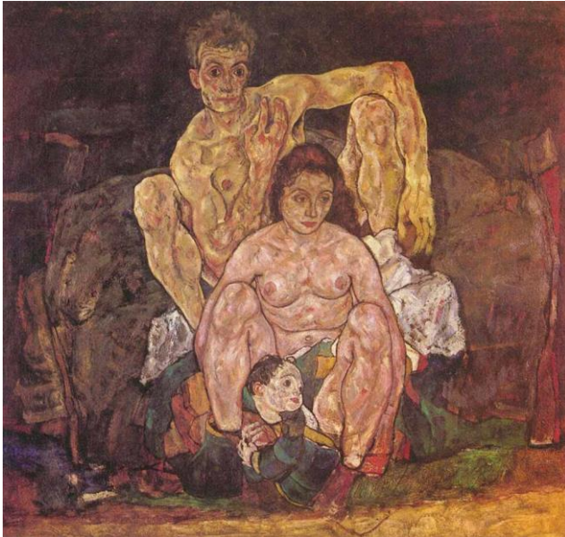
Görsel 4.3.1 Egon Schiele, The Family, 1918, tuval üzerine yağlı boya. Erişim: 30.08.2024