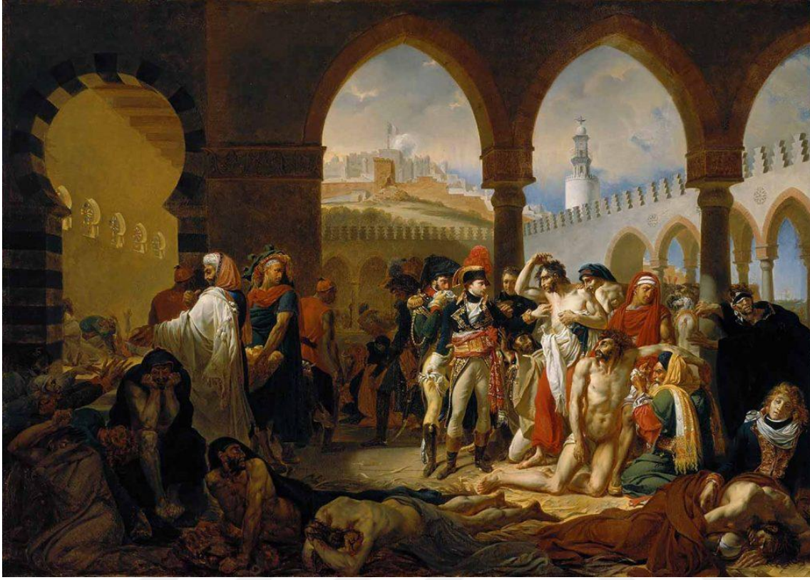
Görsel 4.1.5 Antoine-Jean Gros, Napolyon'un Vebalı Hastaları Ziyareti, 1799, tuval üzerine yağlı boya, Louvre Müzesi, Paris. Erişim: 29.04.2024 https://www.wga.hu/support/viewer/z.html

eserlerde, sanatçılar salgınlar karşısında yaşadıkları çaresizliği, korku ve dehşet halini eserlerine doğrudan ya da dolaylı olarak aktarmaktadır.