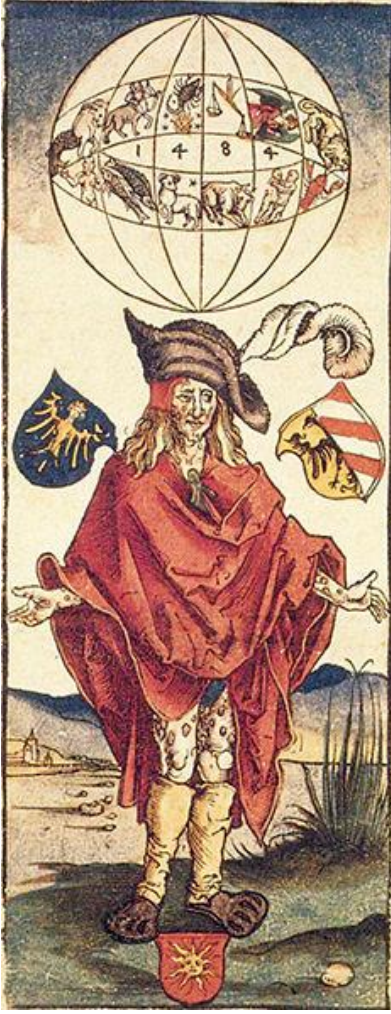
Görsel 3.4.1 Albrecht Dürer, Frengili Adam, 1496, renkli ahşap baskı. Erişim tarihi: 28.03.2024 https://commons.wikimedia.org/wiki/File:D%C3%BCrerSyphilis1496.jpg