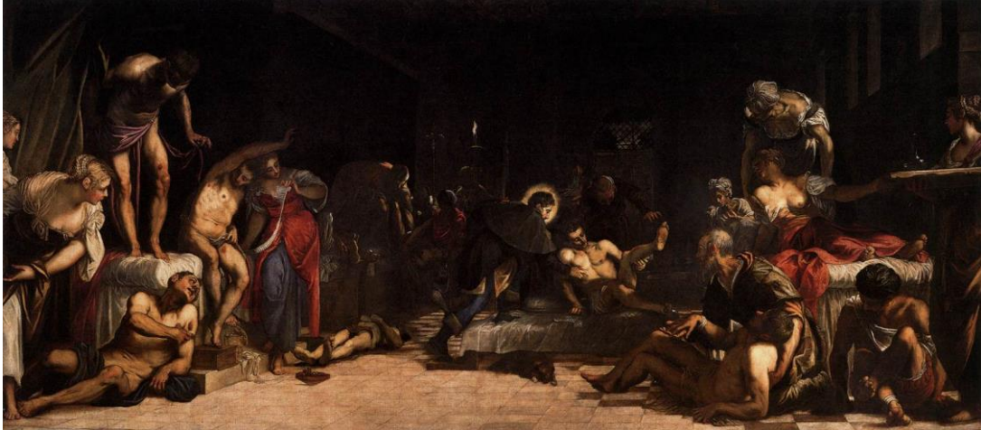
Görsel 4.1.1 Jacopo Tintoretto, Saint Roch Hastanesinde Vebalılar, 1549, tuval üzerine yağlı boya.