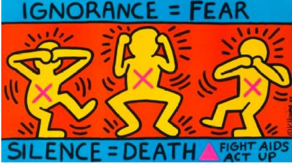
Görsel 4.4.1 Keith Haring, Sessizlik Ölüme Eşittir, 1989, Ofset litografi, Erişim: 22.09.2024

https://howtotalkaboutarthistory.co.uk/art-history-101/the-art-history-of-pandemics/