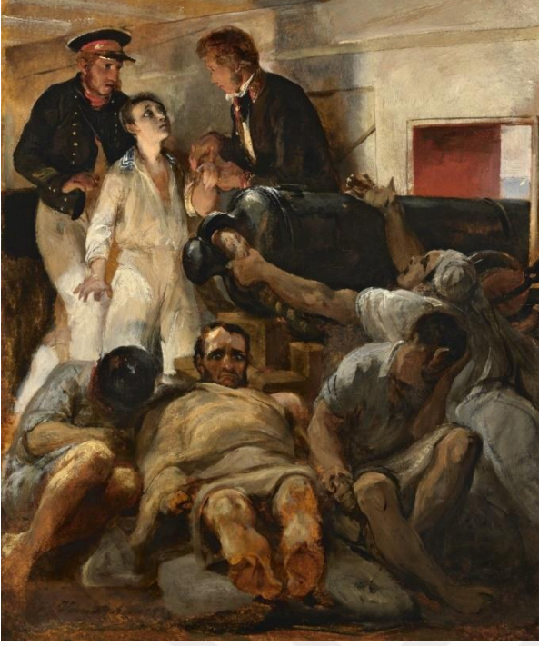
Görsel 4.2.3 Horace Vernet, Melpomene de Kolera, 1833-34, kağıt üzerine yağlı boya. Erişim: 02.05.2024 https://www.mutualart.com/Artwork/Study-for--the-cholera-on-board-the-melp/FD8517EDC89DF2AD