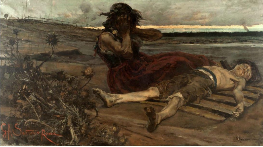
Görsel 3.3.1 Giulio Aristide Sartorio, Sıtma, 1883, tuval üzerine yağlı boya. Erişim: 06.02.2024 https://www.ranker.com/list/cause-of-death-ancient-greece-rome/philgibbons