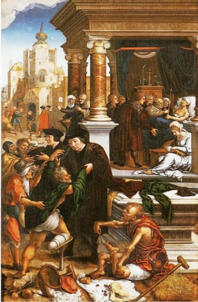
Görsel 3.1.2 Bernard Von Orley, Cüzzamlılar, 1530, tuval üzerine yağlı boya. Erişim: 23.01.2024

(Nıkıforuk, 1996, s. 57). Bu bağlamda Bernard Von Orley'e ait bir sonraki eserde çan takan cüzzamlı bir figür görülmektedir.