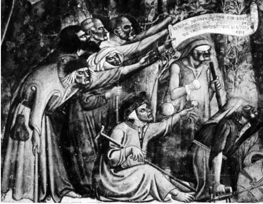
Görsel 3.1.1 Francesco Traini, Ölümün Zaferi, 1355, fresk. Erişim: 23.01.2024.

simgesi olmuştur. Ortaçağ toplumları, cüzzamlıları sadece dinsel nedenlerden dolayı dışlamadı. Fiziksel olarak buruşan suratları, çürüyen kolları ve bacakları, insanları korkutuyordu. Cüzzama yakalananlar On ya da on beş yıl kadar yaşayabiliyorlardı ama fiziksel olarak çürüyen korkutucu bir insan olarak yaşamlarını sürdürebiliyorlardı tabi buna yaşamak denirse.