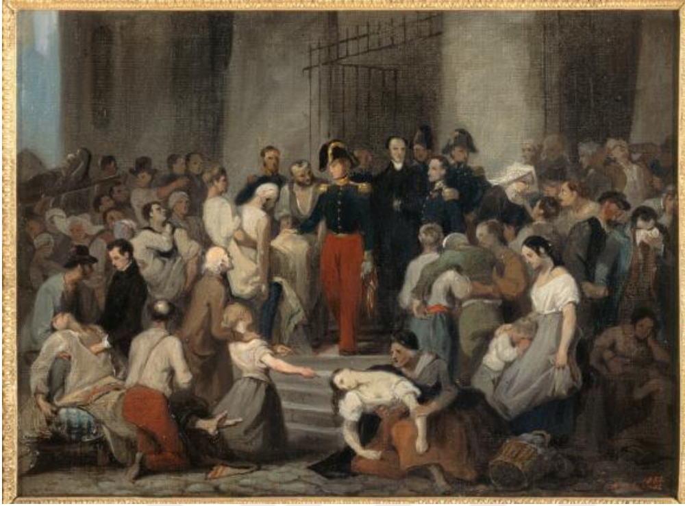
Görsel 4.2.1 Alfred Johannot, Orleans Dükü Kolera Salgını Sırasında Hotel-Dieu'da Hasta Ziyaretinde, 1832, tuval üzerine yağlı boya. Erişim: 29.04.2024 https://www.art-prints-on-demand.com/a/johannot-alfred/the-duke-of-orleans-visit.html