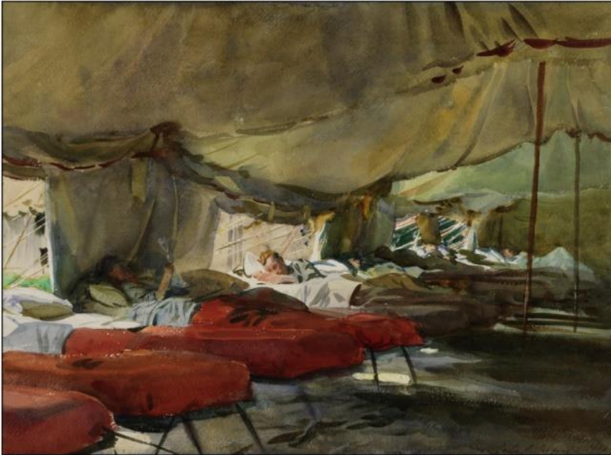
Görsel 4.3.2 John Singer Sargent , Hastane Çadırının İçi, 1918, Kağıt üzerine suluboya, İmparatorluk Savaş Müzesi, Londra. Erişim: 10.09.2024