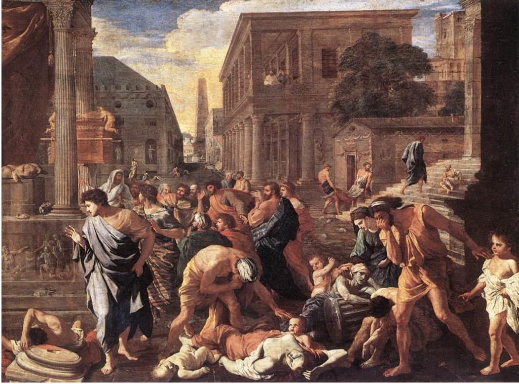
Görsel 4.1.3 Nicolas Poussin, Ashdod Salgını, 1630-1631, Tuval üzerine yağlı boya, Louvre Müzesi, Paris. Erişim: 25.04.2024 https://www.nationalgallery.org.uk/paintings/angelo-caroselli-the-plague-at-ashdod-after-poussin