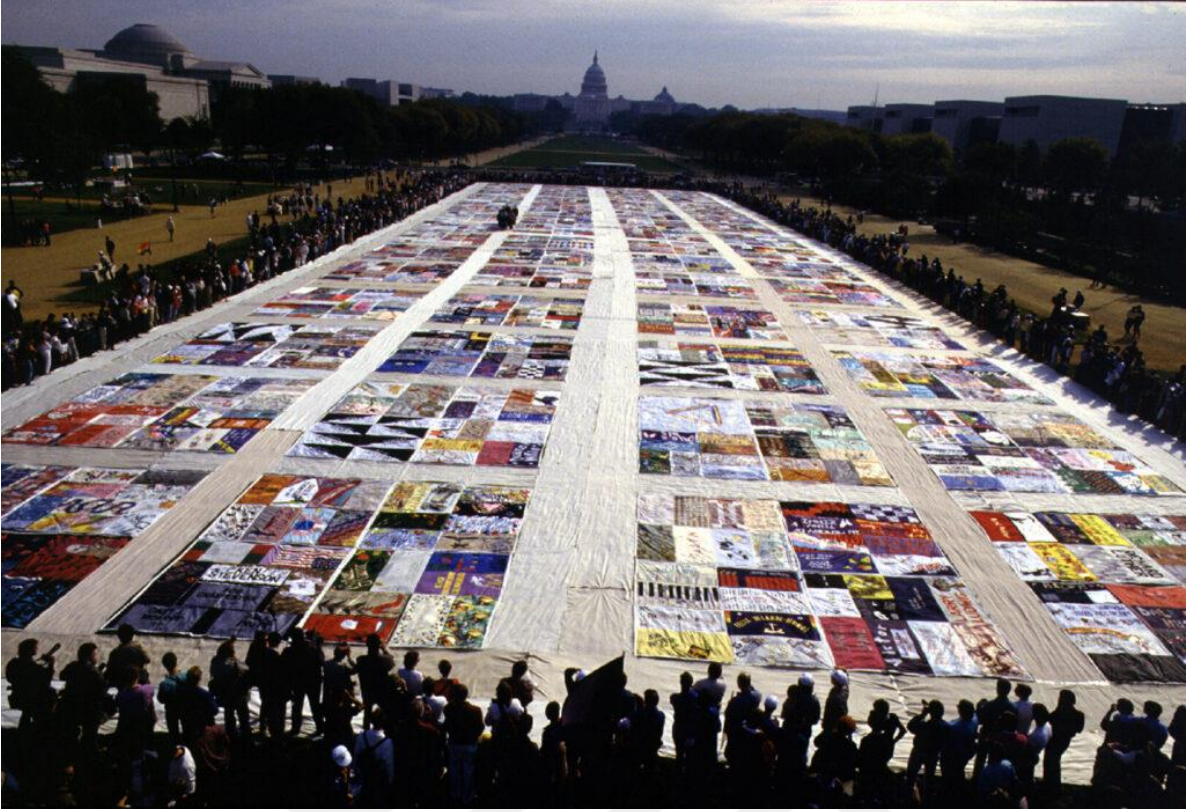
Görsel 4.4.3 NAMES Project AIDS Memorial Quilt'in (İSİMLER Projesi AIDS Anıtı Yorgan Yapımı) (AIDS anısına battaniye) 94.000'den fazla kişiyi anmak için tasarlandı. Erişim: 27.09.2024 https://argonotlar.com/aids-aktivizmi-ve-sanat-80lerde-salginin-seyrini-degistiren-uc-sanatci/

1987 yılında San Francisco'da AIDS hakları savunucusu aktivist Cleve Jones'un fikrinden doğan NAMES Project AIDS Memorial Quilt'in isimli bu devasa battaniye AIDS'ten hayatını kaybeden 94.000'den fazla kişinin anısına yapılan bir eylemdir. Ölen kişilerin isimlerinin yazıldığı bu eser, parça parça olan battaniyelerin birbirine dikilmesiyle devasa boyutlarda yapılmıştır. Hatta İsimler Projesi olarak da adlandırılan bu çalışmanın 1989'da Nobel Barış Ödülü'ne aday gösterilmiştir. O dönemlerde pek çok AIDS mağdurunun toplumsal damgalanma ve dışlanma nedeni ile cenazeleri dahi yapılamadığı bilinmektedir. Partnerini bu hastalıktan kaybeden Jones, AIDS'ten sevdiklerini kaybedince bu hastalığa yakalanmış kişileri ortak bir projeye davet ederek bu çalışmanın ortaya çıkmasına öncülük etmiştir. Bu çalışma salgından etkilenen şehirlerin farklı yerlerinde parçalar halinde sergilenmiştir. Dünyanın en büyük kolektif sanat eseri sayılan battaniye, San Francisco'dan New York'a ve oradan Los Angeles'a yayılarak (Görsel,4.4.3) ilk kez 1987 yılında Washington DC'de eşcinsel hakları ulusal yürüyüşünde Beyaz Saray'ın önünde sergilendi. 1980'lerde hastalık pandemiye dönüşerek sanatçıların üzüntülerini, endişelerini ve kızgınlıklarını aktivist enstalasyon çalışmalarına yönlendirmişti. Bu yöntem sanatçıları; ayrımcılık, eşitsizlik ve zayıflık konularını