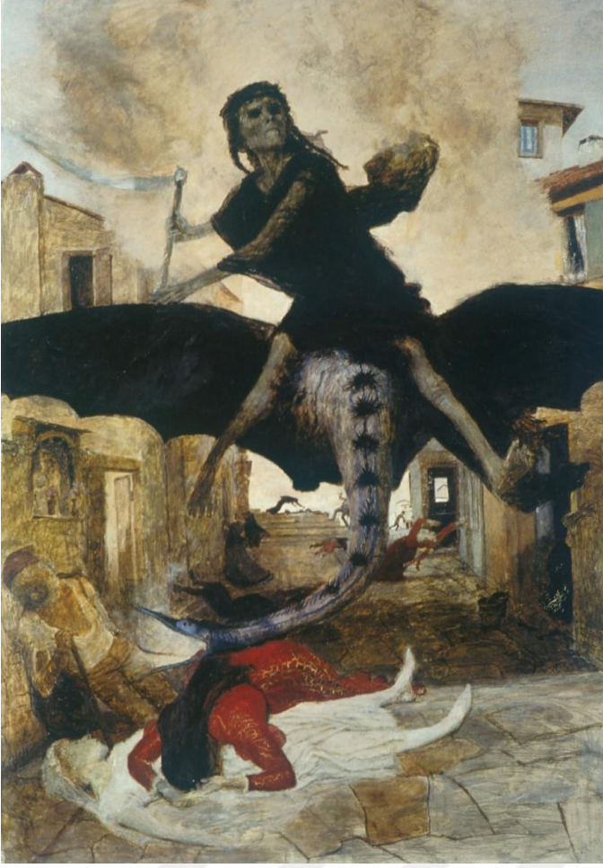
Görsel 4.1.4 Arnold Böcklin, Plague Veba, 1898, ahşap üzerine tempera, İsviçre sanat müzesi.

Erişim: 28.04.2024: https://www.artchive.com/artwork/the-plague-1898-by-arnold-boecklin/