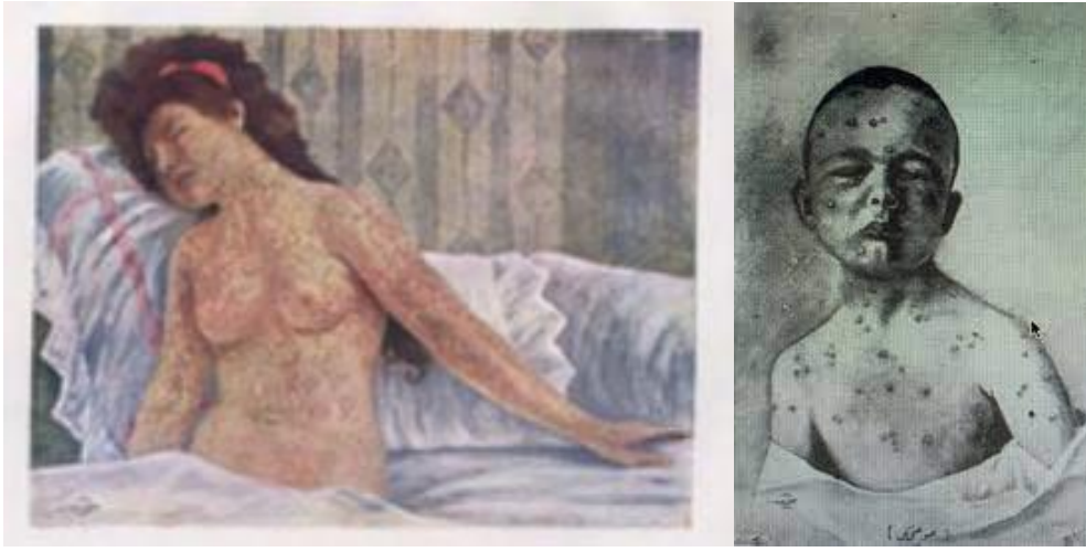
Görsel 3.2.2 - Görsel 3.2.3 Ressam Alaeddin, Çiçek hastalığının yaralarını gösteren tablolar.

1796 yılında yapılan ressam Ernest Board tarafından yapılan Doktor Jenner'in ilk çiçek aşısını yaptığı bu tabloda tarihi kayıtlarda yerini almıştır. Board bu eserinde İngiliz Dr. Edward Jenner'in yukarıda da bahsedilen bu aşı yöntemini kullanarak çocuğa çiçek aşısı yaptığı anı resmetmektedir. (Görsel 3.2.1) Eserde sol tarafta arkası dönük bir figür çocuğu tutmaktadır. Sağ kolunu doktora uzatan çocuk, doktorun koluna çizik attığını izlemektedir. Bunun üzerine yukarıda bahsedilen teknikten de bildiğimiz üzere daha önce çiçek hastalığı geçiren bir kişinin yaralı derisinden alınan irini süreceği biliniyor doktorun sağ tarafındaki masada beyaz örtünün üzerinde içi irin dolu bir şırınga temizleme mendilleri ve temizleme suyu yer almaktadır.