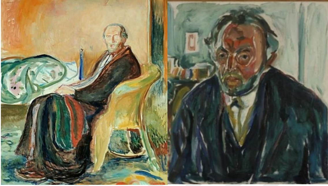
Görsel 4.3.4 Edvard Munch, 1919: İspanyol Gribi ile Otoportre (sol)131x150 - Edvard Munch, 1919: Görsel 4.3.5 İspanyol Gribinden Sonra Otoportre (sağ), tuval üzerine yağlı boya. Erişim: 19.09.2024 https://medyascope.tv/2020/05/13/ispanyol-gribinin-sanattaki-izdusumleri-umutsuzluk-husran-ve-bosluk-icinde-yeni-bir-dunya-hayali/