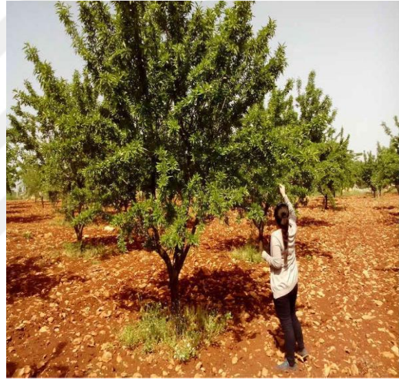
Şekil 4.14. OFD4 çeşidinin ağaç ve meyve resmi