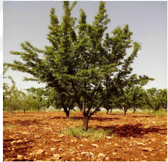
Şekil 4.12. OFD2 çeşidinin ağaç ve meyve resmi