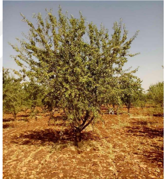
Şekil 4.6. GFG1 çeşidin ağaç ve meyve resmi