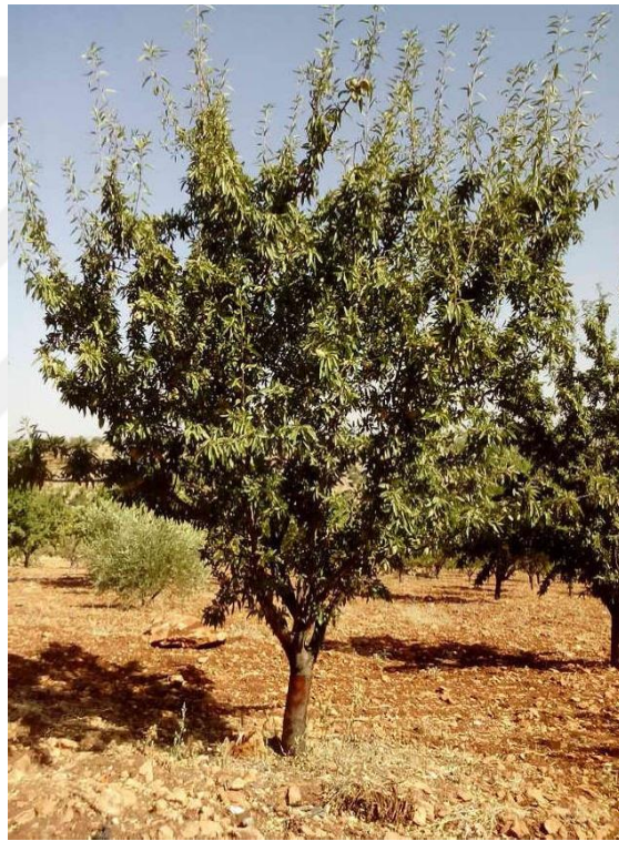
Şekil 4.17. OFG2 çeşidinin ağaç ve meyve resmi