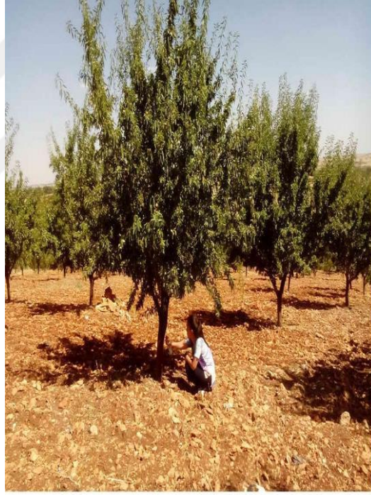
Şekil 4.5. GFD5 çeşidinin ağaç ve meyve resmi