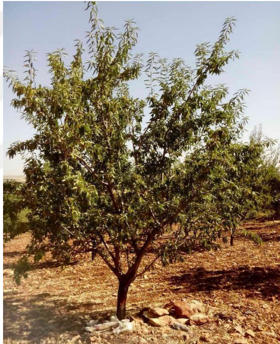
Şekil 4.11. OFD1 çeşidinin ağaç ve meyve resmi