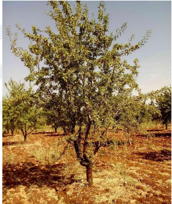
Şekil 4.7. GFG2 Çeşidin ağaç ve meyve resmi