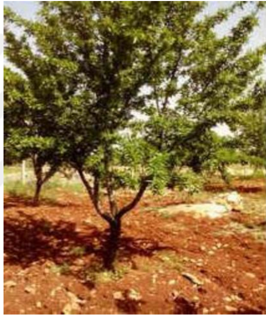
Şekil 4.15. OFD5 çeşidinin ağaç ve meyve resmi