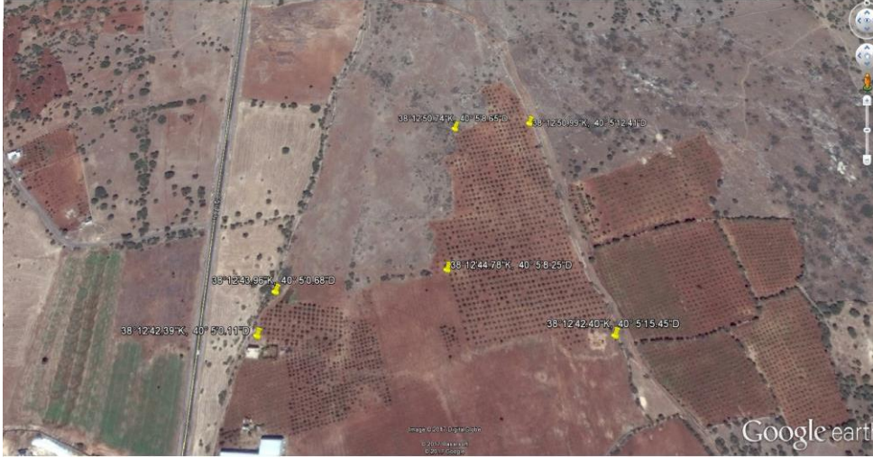
Şekil 3.2. Geleneksel badem bahçesinin görüntüsü