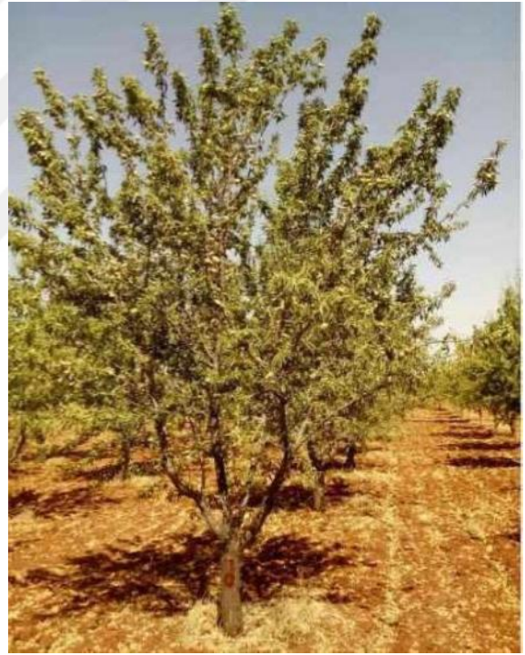
Şekil 4.2. GFD2 çeşidinin ağaç ve meyve resmi