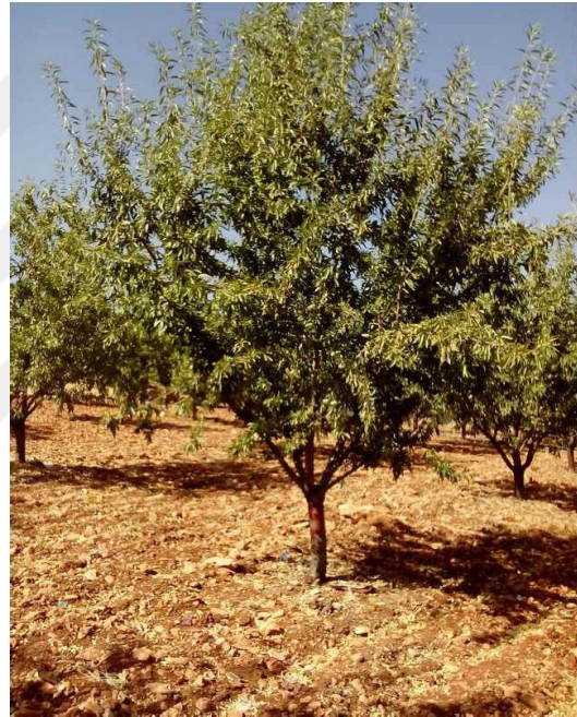
Şekil 4.18. OFG3 çeşidinin ağaç ve meyve resmi