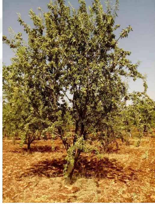
Şekil 4.3. GFD3 çeşidinin ağaç ve meyve resmi