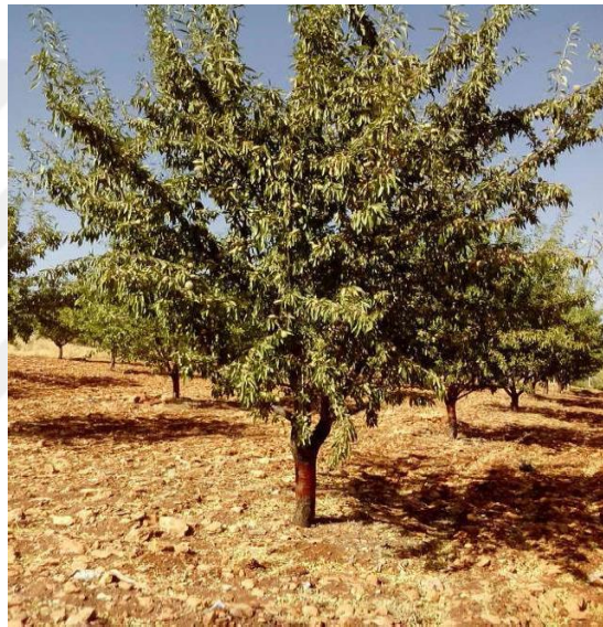
Şekil 4.19. OFG4 çeşidin ağaç ve meyve resmi