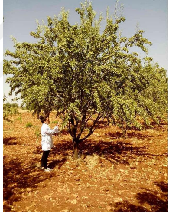
Şekil 4.4. GFD4 çeşidin ağaç ve meyve resmi