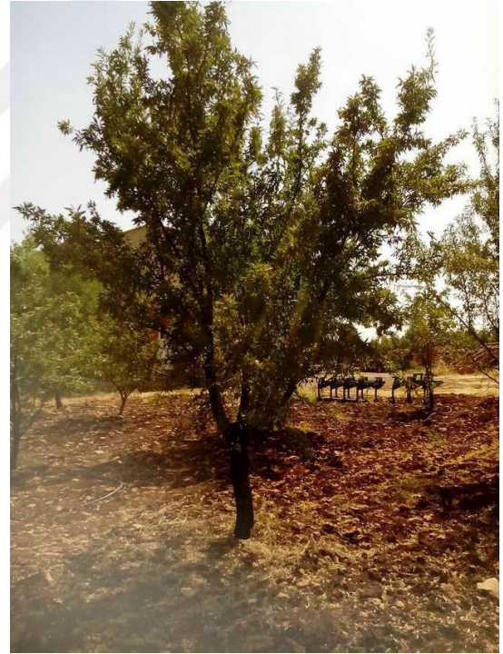
Şekil 4.8. GFG3 çeşidinin ağaç ve meyve resmi