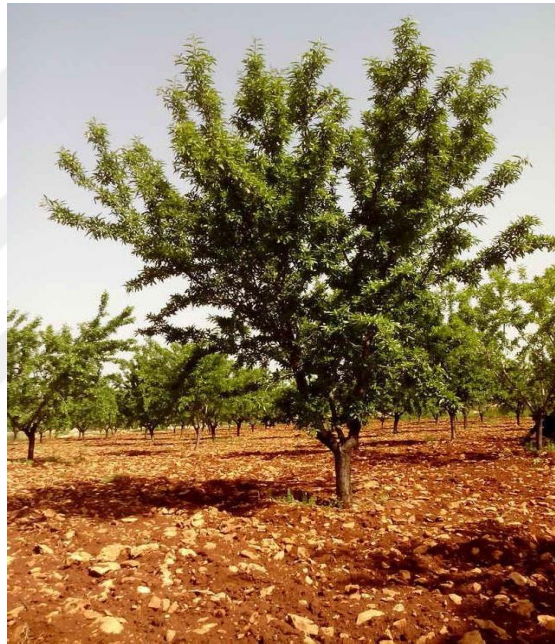
Şekil 4.13. OFD3 çeşidin ağaç ve meyve resmi