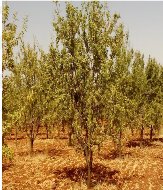
Şekil 4.9. GFG4 çeşidin ağaç ve meyve resmi