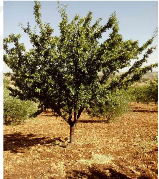
Şekil 4.16. OFG1 çeşidinin ağaç ve meyve resmi