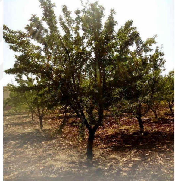
Şekil 4.10. GFG5 çeşidin ağaç ve meyve resmi