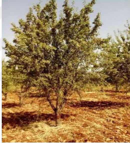
Şekil 4.1. GFD1 çeşidin ağaç ve meyve resmi