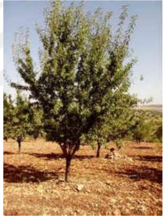
Şekil 4.20. OFG5 çeşidinin ağaç ve meyve resmi