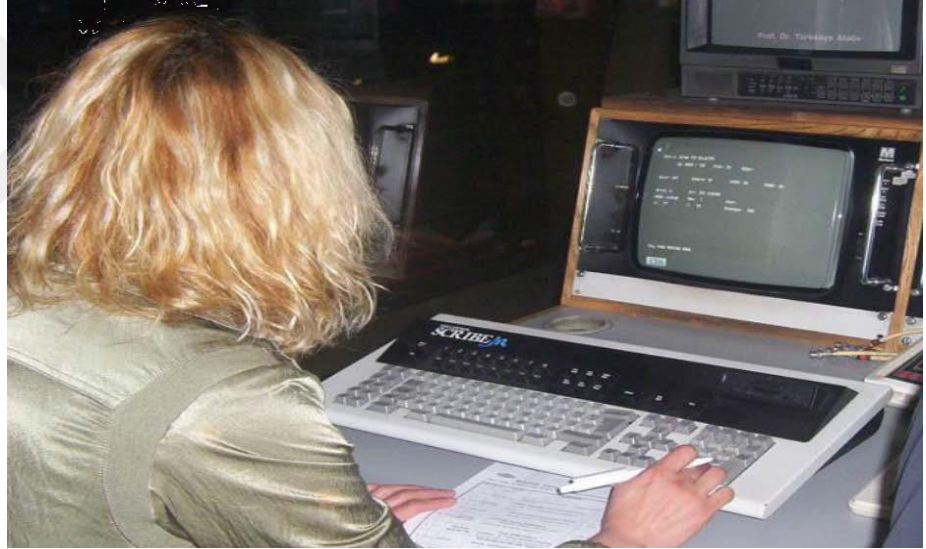
Şekil 1f: KJ operatörlüğü yapan personel (T.C. MİLLİ EĞİTİM BAKANLIĞI-213GIM103, 2011: 15).

KJ operatörü, altyazıları perfore, konu değişikliği ya da görüntüye göre senkronize biçimde ekrana aktarmaktadır. Ses-görüntü-içerik üçlemesine alt yazı olarak dördüncü kuvvet olarak katılarak haber içeriğini desteklemektedir. KJ operatörleri daha çok haber yönetmeni ve editörle uyum içinde çalışmaktadır. Editörlerin yazdığı alt yazıları kontrol edilme görevi de KJ operatörüne düşmektedir. Zaman zaman haber bültenlerinde yazım hataları da yapıldığı görülmektedir. Bundan dolayı alt yazı kontrollerin birkaç kere ve dikkatle yapılması gerekmektedir. Çünkü canlı yayında yapılan hatanın telafisi olmadığından dolayı KJ operatörleri, konstrasyon ve çok dikkatli bir biçimde çalışmaktadırlar (T.C. MİLLİ EĞİTİM BAKANLIĞI-213GIM103, 2011: 14).