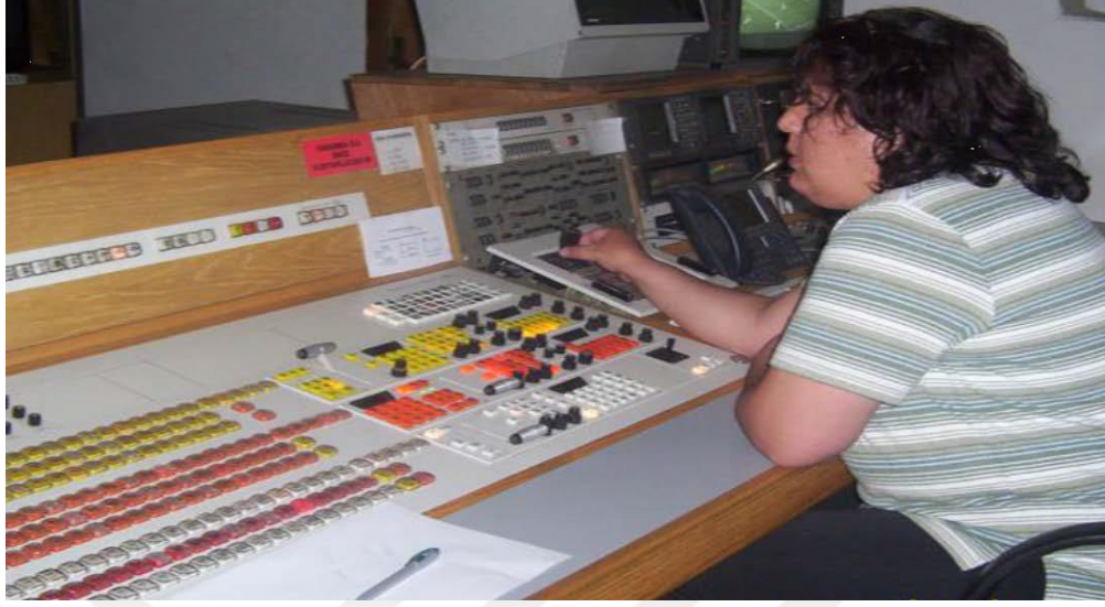
Şekil 1h: Resim Seçicilik yapan personel (T.C. MİLLİ EĞİTİM BAKANLIĞI-213GİM103, 2011: 14)