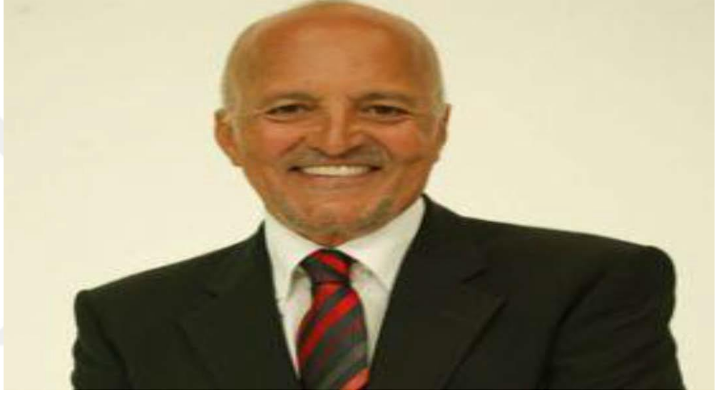
Şekil 1c: Haber Spikeri Mehmet Ali Birand (T.C. MİLLİ EĞİTİM BAKANLIĞI-321GM0020, 2011: 23).

Haber spikeri, prompter camında haberleri okuyarak izleyiciye haberi aktarır. Haber vtr'si yayınlanırken haber spikerleri, bir sonraki haberlerin metinlerini okumaktadır. Haberi okurken vurgunun nerede yapılması gerektiğini anlamaktadır. Türkiye’de ana haber bültenlerini sunan kişilere “anchor” da denilmektedir. Haber spikerleri gündemi sürekli takip etmelidir (T.C. MİLLİ EĞİTİM BAKANLIĞI-321GM0020, 2011: 19-22).