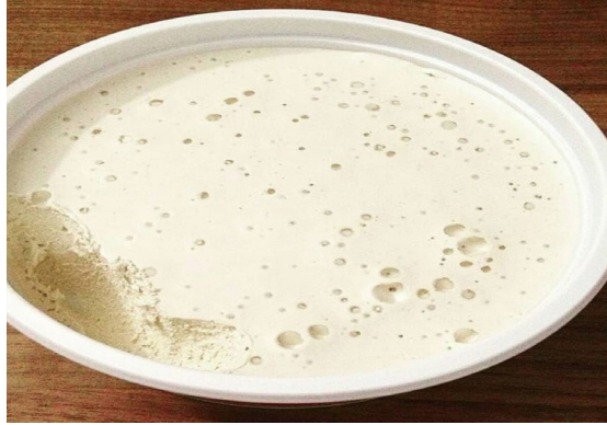
Şekil 2.13: Zile Pekmezi (Coğrafi İşaretler, 2023)

Zile yöresinde yetiştirilen kırk dört farklı üzüm çeşidi içerisinde en yaygın olarak kullanılan Narince türü üzümünden elde edilen Zile pekmezi, yörede halk arasında "çalma" olarak adlandırılan pekmez türü sınıfında yer almaktadır. Bunun yanı sıra, bölgede pestil, köme ve tatlı tarhana gibi geleneksel ürünler de önemli ölçüde üretilmekte olup, yerel halk tarafından büyük bir ilgi ve beğeniyle tüketilmektedir (Tokat İl Kültür ve Turizm Müdürlüğü, 2023).