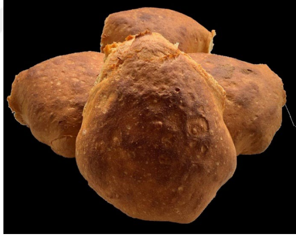
řekil 2.6: Tokat Bez Sucuk (Cođrafi İřaretler, 2023)

Tokat Ekmeđi; tam buđday unu, ekři maya, su ve tuz kullanılarak hazırlanan geleneksel bir ekmek türüdür. Ürün, iyi kabarmıř ve homojen řekilde kızarmıř dıř kabuđuyla dikkat çeker. Dilimlendiđinde iç dokusu süngerimsi özellik gösterir ve gözenek yapısı olabildiđince eřit dađılmıřtır. Ekmeđin iç kısmı ne hamur kıvamında ne de yapıřkandır; kabuk ile iç yapı arasında belirgin bir ayırım bulunmaz. Tokat Ekmeđi'nin piřirildiđi fırınlar, yalnızca bu cođrafyaya özđü teknik özellikler taşımaktadır. Bu fırınların tabanı yaklaşık 1 metre kalınlıđında kumla kaplanmış olup, üzerine yaklaşık 3 ton fırınlanmış kaya tuzu yerleřtirilmekte ve en üste ateř tuđlaları döřenmektedir; yan duvarlar ise tam tuđladan inřa edilmiřtir. Isıtma sürecinde genellikle pelit ve gürgen gibi yüksek ısı ve alev sađlayan odun türleri kullanılmakta, bu odunların yanmasıyla oluřan tütsü ve reçineli bileřikler ise Tokat Ekmeđi'ne karakteristik aromasını kazandırmaktadır (Türkiye/Tokat Patent No. 896, 2021).