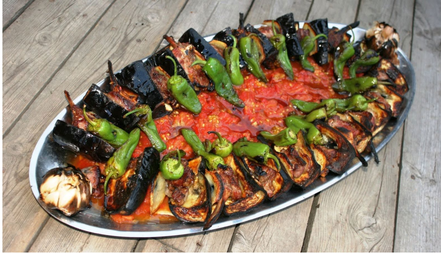
Şekil 2.7: Tokat Kebabı (Coğrafi İşaretler, 2023)

Tokat Kebabı'nı özgün kılan temel unsurlar; kullanılan etin ve kuyruk yağının, bölgeye has doğal koşullarda ya da yayla ortamında yetiştirilen Karayaka ırkı koyunların 6 ila 9 aylık erkek kuzularından temin edilmesi, sebzelerin (Tokat biberi, patlıcanı ve domatesi) Tokat ilinde üretilmesi ve bu kebabın yalnızca Tokat'a özgü tasarlanmış geleneksel kebab ocağında hazırlanmasıdır. Altı ana bileşenden oluşan bu özel kebab ocağı; ateşlik bölümü, baca sistemi, şişlerin yerleştirildiği metal mil, pişirme tavası, yağ toplama haznesi (yağdanlık) ve kebabın servisi için kullanılan çıkarma şişinden meydana gelmektedir. Bu teknik donanım, Tokat Kebabı'nın yöresel kimliğini ve pişirme yöntemini belirginleştiren önemli bir yapısal özelliktir (Tokat İl Kültür ve Turizm Müdürlüğü, 2023)