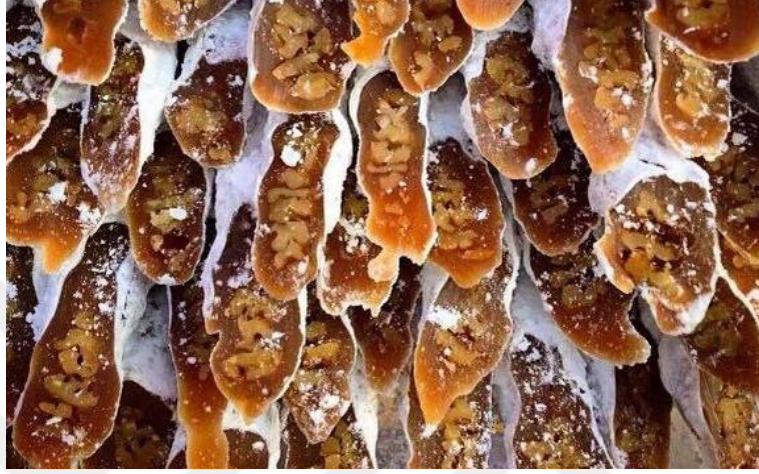
Şekil 2.12: Zile Kömesi (Coğrafi İşaretler, 2023)

açısından yoğun emek, dikkat ve ustalık gerektiren zahmetli bir işlemdir (Zile Belediyesi Tanıtım Kitapçığı, 2016).