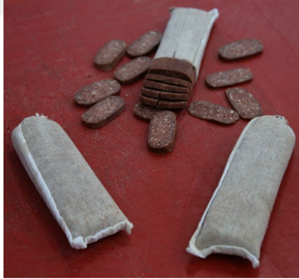
Şekil 2.5: Tokat Bez Sucuk (Coğrafi İşaretler, 2023)

Coğrafi İşaret Sicil Belgesi'nde yer alan tanıma göre Tokat Bez Sucuğu; kıyma makinesinden geçirilmiş et ve iç yağının, tuz, sarımsak ve çeşitli baharatlarla harmanlanmasının ardından özel bez kılıflara doldurulması, askılarda belirli bir süre olgunlaştırılması ve merdaneleme işlemiyle düzleştirilmesi yoluyla üretilen geleneksel bir fermente sucuk çeşididir. Tokat Bez Sucuğu'nu benzer ürünlerden ayıran temel nitelikler arasında; doğal fermantasyon yönteminin tercih edilmesi, üretim sürecinde sağlığa zararlı kimyasal katkıların yer almaması, "Mermerşahi" olarak adlandırılan özel bez malzemelere doldurulması, içerisindeki havanın merdane ile giderilerek yassı form kazandırılması ve ürünün ısı işlem görmemesi bulunmaktadır. Bu geleneksel üretim yöntemi, ürünün kendine özgü tat ve aroma karakteristiklerinin daha belirgin şekilde hissedilmesine olanak sağlamaktadır (Yücel, Kaya ve Bayram, 2022).