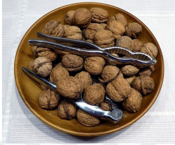
Şekil 2.3: Niksar Cevizi (Coğrafi İşaretler, 2023)