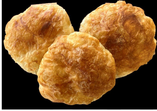
Şekil 2.9: Tokat Yağlısı (Coğrafi İşaretler, 2023)