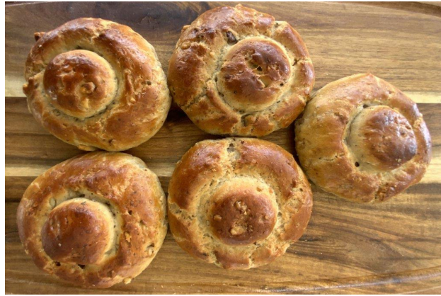
Şekil 2.10: Tokat Çöreği (Coğrafi İşaretler, 2023)

Tokat Çöreği; özel amaçlı buğday unu, nohut mayası ve su kullanılarak hazırlanan, gürgen ve/veya pelit odunu ile ısıtılan fırınlarda pişirilen geleneksel bir çörek türüdür. Sade, cevizli, üzüm-cevizli, şeker-cevizli ve bal-cevizli gibi çeşitli versiyonları bulunmaktadır. Sade formu yalnızca temel bileşenlerle hazırlanırken, diğer türlerinde ilave olarak coğrafi işaret tescili 177 numarayla koruma altına alınmış Niksar Cevizi, çekirdeksiz kuru üzüm, şeker ve bal gibi yöresel ürünler de kullanılmaktadır. Bu çeşitlilik, Tokat Çöreği'nin hem geleneksel hem de yöreye özgü niteliklerini ortaya koymaktadır (Türkiye/Tokat Patent No. 895, 2021).