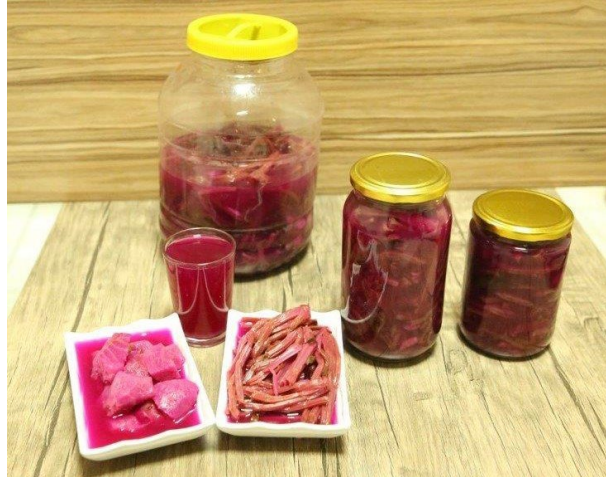
Şekil 2.4: Reşadiye Kırmızı Pezik Turşusu (Coğrafi İşaretler, 2023)

Reşadiye Kırmızı Pezik Turşusu, Tokat ilinin Reşadiye ilçesinde üretilen, kırmızı pancar bitkisinin ( Beta vulgaris L. var. condivita ) dal, gövde ve kök-yumru bölümlerinin haşlanıp soğutulduktan sonra salamura işlemine tabi tutulmasıyla elde edilen geleneksel bir turşu çeşididir (Türkiye/Reşadiye Patent No. 1455, 2023).