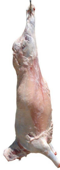
Şekil 2.14: Tokat Karayaka Kuzu Eti (Coğrafi İşaretler, 2023)

Karayaka koyun ırkının kökeni yaklaşık 300 yıl öncesine uzanmakta olup adını Tokat'ın Erbaa ilçesine bağlı Karayaka kasabasından almaktadır. Osmanlı İmparatorluğu döneminde bu ırktan elde edilen etin "saray eti" olarak anıldığı bilinmektedir. Tokat Karayaka Kuzu eti üretiminde yalnızca safkan Karayaka ırkı kuzular kullanılmakta, melez ırklar ise tercih edilmemektedir. Bölgedeki Karayaka koyunlarının yetiştiriciliği geleneksel yöntemlere dayalıdır; bu kapsamda hazır yemlere yalnızca zorunlu durumlarda başvurulmakta, temel beslenme meralardaki doğal otlatma yoluyla sağlanmaktadır. Tokat yöresinde yetiştirilen kuzuların etleri yüksek mermerleşme oranıyla öne çıkmaktadır. Ayrıca, bölgenin çayır, mera ve yaylalarında doğal olarak yetişen aromatik bitkiler (özellikle sumak, yabani kekik ve nane) etin kendine özgü tat ve aroma karakterini şekillendirmektedir. Bu doğal beslenme koşulları ile Karayaka ırkının genetik özelliklerinin (et renginin kırmızılığı, parlaklığı, pH değeri, su tutma kapasitesi ve kuru madde oranı gibi) birleşmesi sonucunda Tokat Karayaka Kuzu Eti ayırt edici niteliklere sahip olmaktadır.