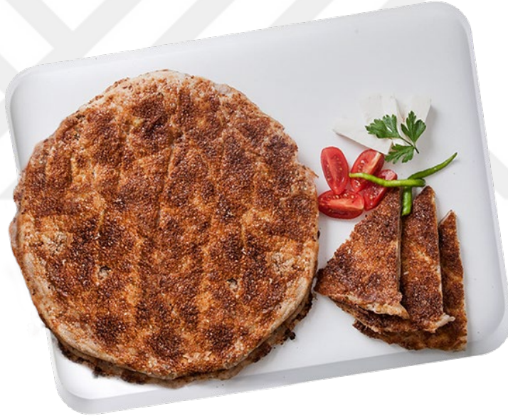
Şekil 2.11: Turhal Yoğurtmacı (Coğrafi İşaretler, 2023)

Turhal ve çevresinde üretilen geleneksel bir hamur işi olan “Yoğurtmaç”, adını yoğurma ve katlama işlemlerine dayanan hazırlama yönteminden almaktadır. Ticarileşmeden önce, özellikle dini bayramlar ve özel günlerde konuklara ikram edilmek amacıyla hazırlanan bu ürün, özgün hamur yapısı ve içeriğinde kullanılan malzemelerin geleneksel yöntemlerle bir araya getirilip şekillendirilmesiyle ortaya çıkmaktadır. Taş fırınlarda pişirilen Yoğurtmaç, sade, cevizli veya haşhaşlı olmak üzere farklı çeşitlerde üretilmekte olup, bölgenin kültürel mutfak mirasının önemli bir parçasını oluşturmaktadır (Mertol ve Yaylacı, 2021).