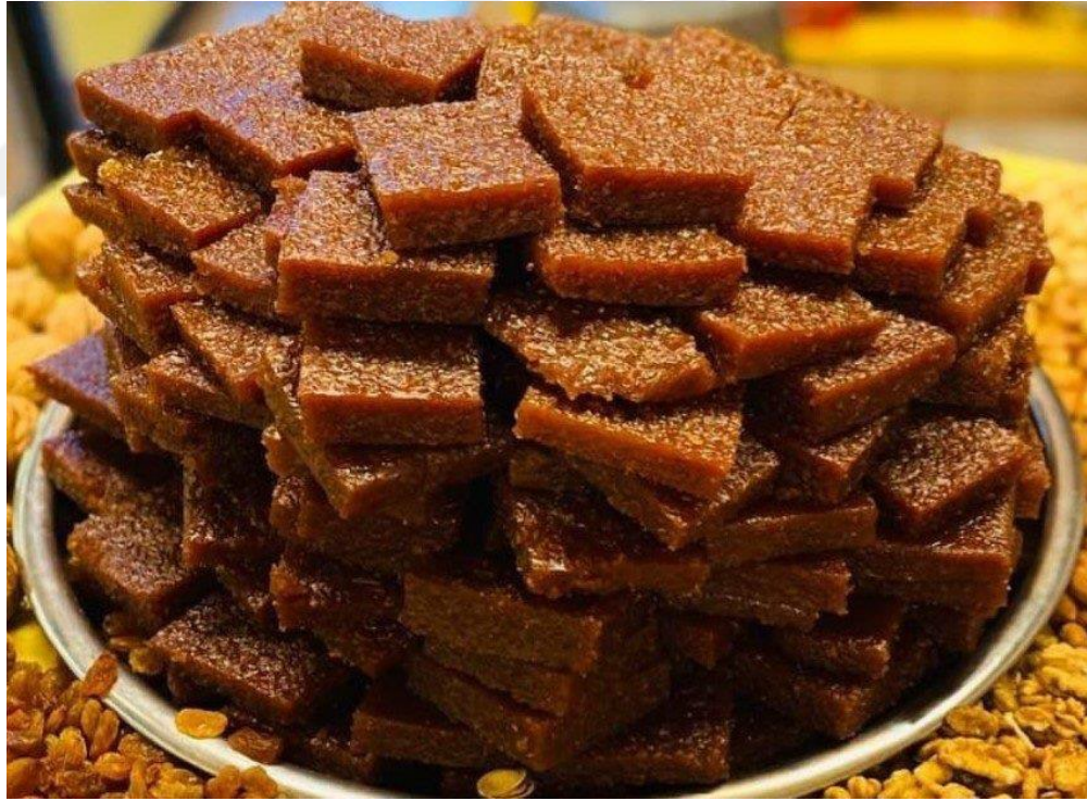
Şekil 2.15: Tokat Üzüm Tarhanası (Coğrafi işaretler, 2024)

Tokat Üzüm Tarhanasının üretiminde, coğrafi sınırda yetişen Narince üzüm çeşidinden üretilen şıra, Tokat veya başka bir alanda yetiştirilen buğdaylardan elde edilen ince buğday kırması (düğü) ve pekmez toprağı olarak adlandırılan kalsiyum karbonat kullanılır.