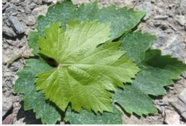
Şekil 2.2: Erbaa Narince Bağ Yapağı (Coğrafi İşaretler, 2023)

dolaşımının yaygınlaşmasında, büyük ölçüde bu bölgeden temin edilen yaprakların etkili olduğu bilinmektedir (Cangi ve Yağcı, 2017).