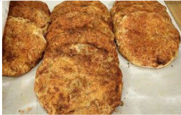
Şekil 2.1: Erbaa Katmeri ( Coğrafi İşaretler, 2023 )

Tokat ilinin geleneksel mutfak kültürü içerisinde önemli bir yere sahip olan Erbaa katmeri, yalnızca günlük tüketimde değil; bayramlar, düğünler, festivaller gibi anlam ve önemi yüksek günlerde de sıklıkla hazırlanarak tüketilmektedir. Hazırlık sürecinde kullanılan malzemeler ile katlama teknikleri açısından benzer ürünlerden ayrılan Erbaa katmeri, taş tabanlı fırınlarda pişirilmektedir. Sade, haşhaşlı ya da cevizli çeşitleri bulunan bu ürün, yöre halkı tarafından büyük beğeni görmekte ve yaygın olarak tüketilmektedir. Erbaa katmeri, Erbaa Belediyesi'nin girişimiyle 06 Haziran 2023 tarihinde coğrafi işaret tescili olarak resmîyet kazanmıştır (Pala, 2023).