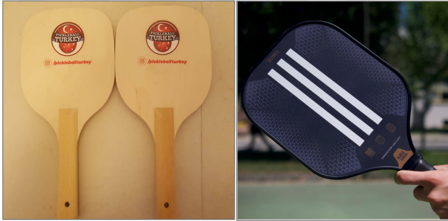
Şekil 2. Pickleball raketi

Pickleball kortu ortadan iki eşit parçaya ayıran bir file ile bölünmektedir. File ip veya örgü kumaş malzemeden yapılabilmektedir. File direkleri, direklerin iç kısmından ölçülmek üzere 6.71 metre aralıklarla yerleştirilmelidir. Filenin üst kısmında, file uzunluğu boyunca içinden geçen bir ip veya kablo üzerine tutturulmuş 5 cm'lik beyaz bir şerit bant bulunmaktadır. Filenin yan çizgideki yüksekliği yerden 91.4 cm ve filenin orta yüksekliği 86.4 cm'dir. Filenin orta yüksekliğini destekleyecek, orta noktasına yerleştirilen bir orta şerit eklenmesi tavsiye edilmektedir (Derwent ve ark., 2024).