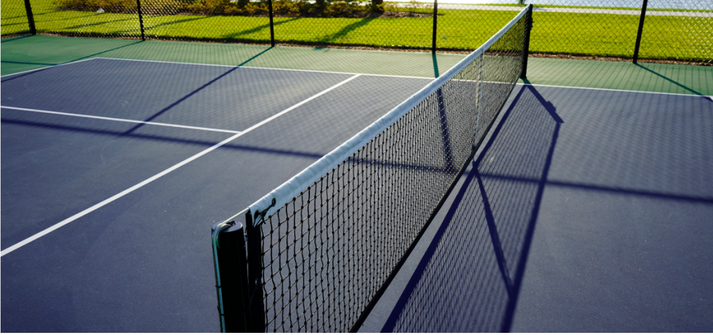
Şekil 4. Pickleball filesi

Pickleball’u diğer raket sporlarından farklı ve eğlenceli kılan kurallar aşağıda sıralanmıştır.