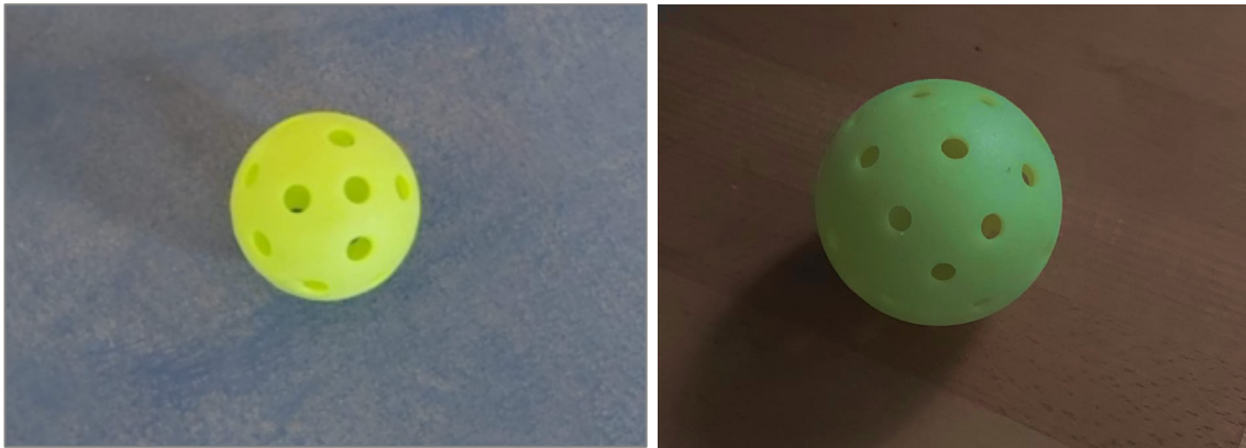
Şekil 3. Pickleball kapalı alan ve açık alan topu