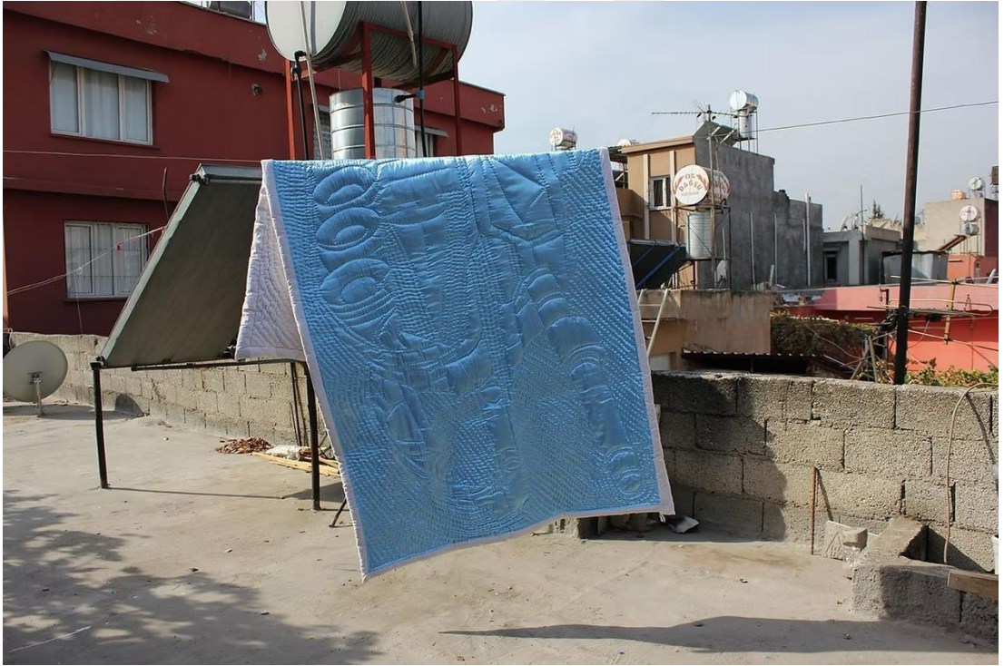
Şekil 16: Boğa, M. (2017). Savaş Yadigarları – Silahlı Mavi Yorgan [Tekstil üzerine kapitone işleme, pamuk kumaş, el yapımı dikiş, değişken boyutlar]. The War Heirlooms serisi kapsamında.

Yorgan metaforu hem fiziksel korunmayı hem de kültürel aidiyeti temsil ederken, militarist imgelerin narin bir kumaş üzerinde sunulması, Jean Baudrillard'ın (1981) simülasyon kuramı çerçevesinde gerçeklik ve temsil arasındaki sınırların nasıl bulanıklaştığını düşündürür.