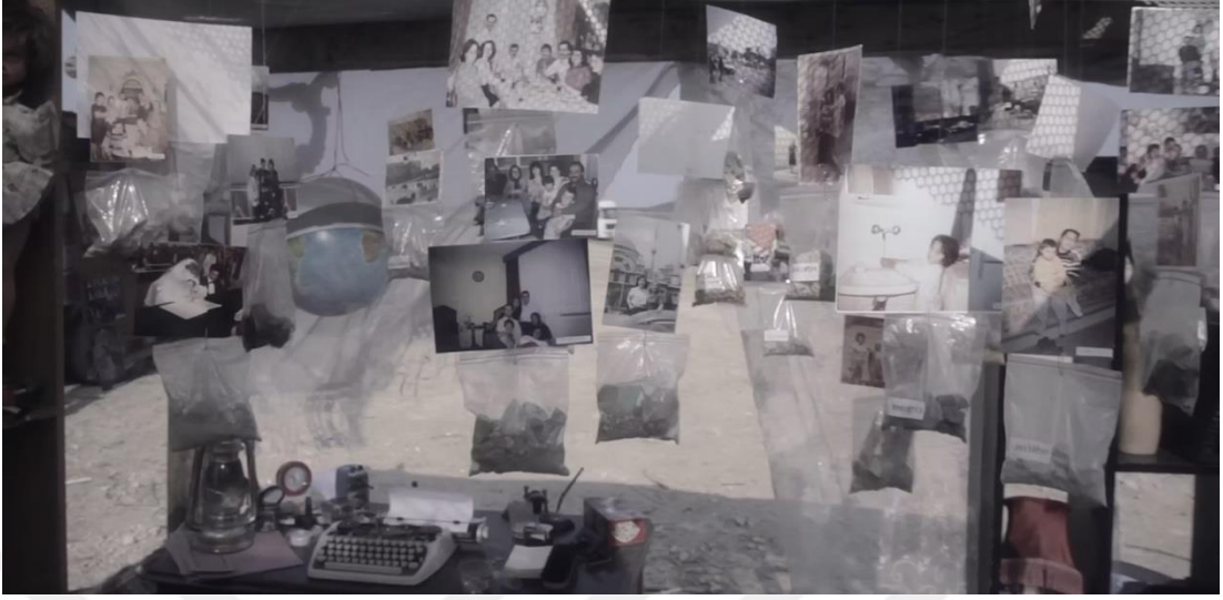
Şekil 19: Demir, Ö. (2012). Net17950 [Deneysel video, HD, renkli, 9']. Videodan kare.

Bu bağlamda Net17950 , yalnızca bir kentsel dönüşüm eleştirisi değil; aynı zamanda hafıza, görünürlük ve kimlik politikaları üzerine düşünsel bir davet sunar. Video yerleştirme formundaki bu üretim, mekânla ilişki kurma biçimini dönüştürürken, geçmişin izlerini arşivleyen bir araç görevi görür. Görsel öğeler ile sözlü anlatımın harmanlandığı yapıtta, estetik deneyim ile sosyopolitik sorgulama dengeli bir biçimde harmanlanır (Demir, 2023c)