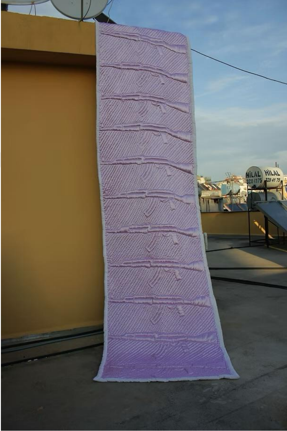
Şekil 15: Boğa, M. (2017). Savaş Yadigarları – Tüfek Desenli Pembe Yorgan [Tekstil üzerine kapitoneel işleme, pamuk kumaş, el yapımı dikiş, değişken boyutlar]. The War Heirlooms serisi kapsamında.

Mustafa Boğa'nın The War Heirlooms serisi kapsamında ürettiği bu iş, savaşın bireysel ve kolektif hafıza üzerindeki etkilerini gündelik hayat nesnelere üzerinden sorgular. Geleneksel pembe kapitone, çocukluk, koruma ve ev sıcaklığı çağrışımları yaparken, yüzeyine