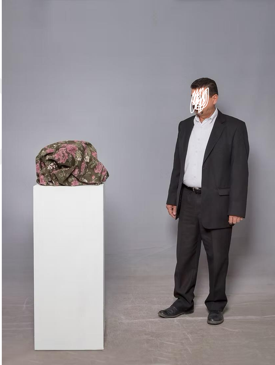
Şekil 12: Boğa, M. (2017). Battaniye [Desenli battaniye, kaide üzerinde yerleştirme, değişken boyutlar]. Yabancı Nesnelere serisi kapsamında.

sanat mekânında bir nesne-özne ilişkisini tetikleyen kültürel bir araca dönüşür. Pierre Bourdieu'nun (1977) habitus kavramı çerçevesinde değerlendirildiğinde, bu nesne bireyin mekânla ve nesnelere kurduğu tarihsel ve kültürel ilişkilerin bir temsilidir. İzleyici ve nesne arasındaki mesafe, gündelik olanın görünürlük kazanması ve yeniden anlamlandırılması sürecini başlatır. Sanatçı, estetik normların dışında kalan endüstriyel nesne aracılığıyla kültürel kodları ve gündelik algı kalıplarını sorgular.