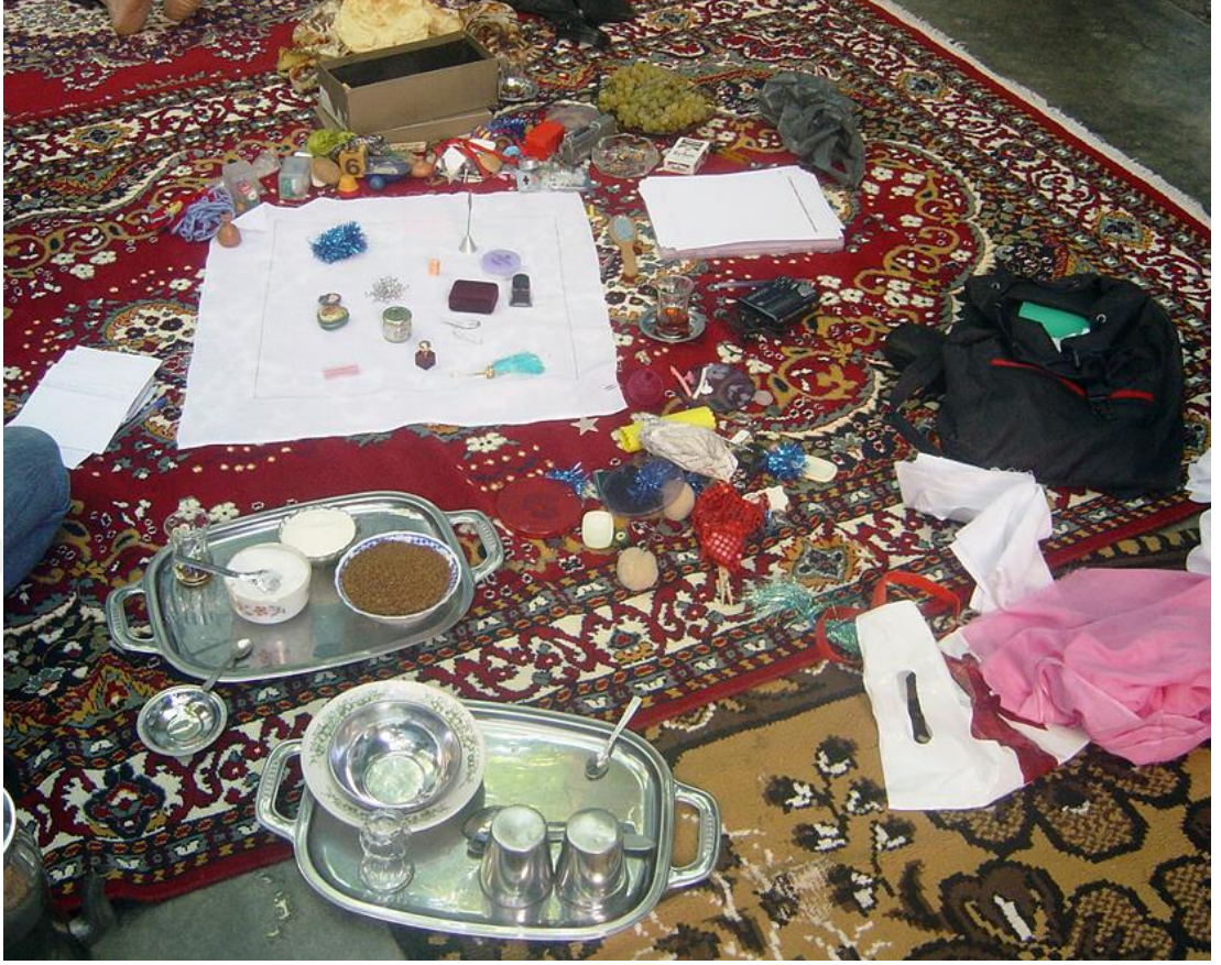
Şekil 2: Winchester, D. (2005). Çay, Çekirdek, Çoluk Çocuk . [Görsel, oyun sırasında obje yerleşimi]. Dilek Winchester Resmî Web Sitesi.

Projenin amacı, bireysel deneyimlerin, toplumsal normlar ve kültürel hafızalarla nasıl kesiştiğini ve bu kesişimin dil aracılığıyla nasıl yapılandırıldığını anlamaktır. Sanatçılar, ev ortamlarında gerçekleştirdikleri oyunlarla, katılımcıların deneyimlerini serbestçe ifade etmelerini sağlamışlardır. Bu süreç hem sanat üretiminin hem de kültürel araştırmanın bir aracı olarak işlev görmüştür (Mirzoeff, 1999). Bireysel anlatılar, yalnızca kişisel öyküler değil, aynı zamanda sosyal ağların ve kültürel normların da bir temsili olarak işlenmiştir.