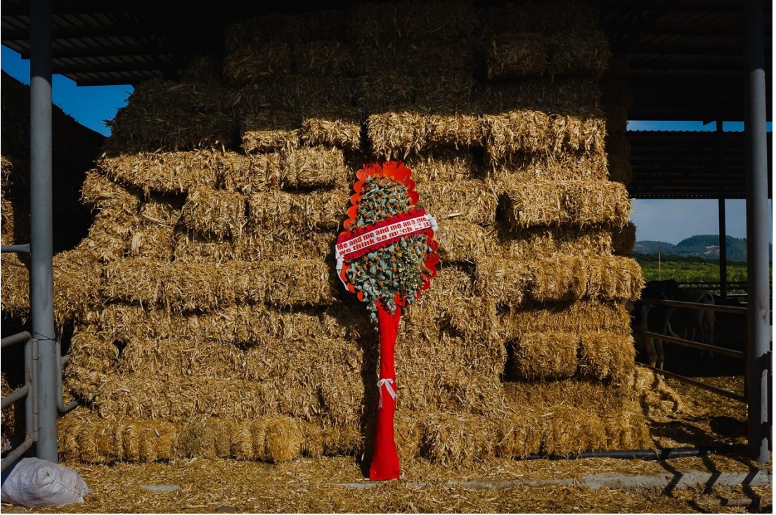
Şekil 9: Boğa, M. (2017). Me and Me and Me and Me. We Think So Much (Ben ve ben ve ben ve ben. Biz çok düşünmüyoruz) [Çiçek çelenği, kurutulmuş bitkiler, kumaş, yazılı şerit, değişik boyutlar]. Süslü Diyaloglar serisi kapsamında.

Seride yer alan bir diğerk çalışmada ise Boğa, bir saman yığını önünde parlak kırmızı bir çelenk yerleştirmiş ve çelenk şeridine “Me and me and me and me. We think so much” yazmıştır. Bu ifade, modern bireyin içine kapanışını, bireyselleşmenin getirdiği yalnızlığı ve toplumsal ilişkilerdeki çözülmeyi vurgular. Arka plandaki saman balyaları, doğallık ve kırsallıkla ilişkilendirilen bir yaşam pratiğini temsil ederken; yapay bir nesne olan çelenk, bu ortamda yabancı ve kırılğan bir müdahale olarak belirir.