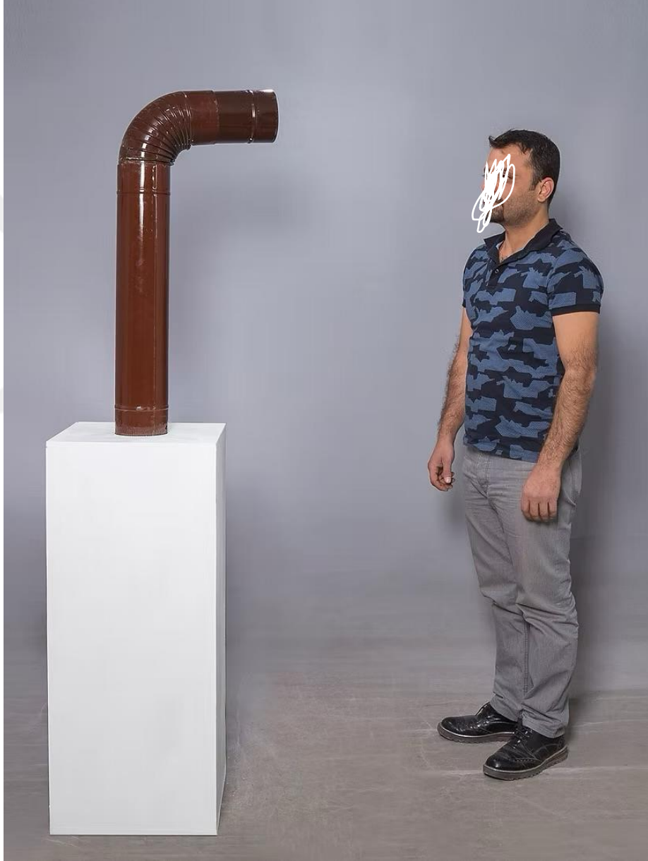
Şekil 11: Boğa, M. (2017). Boru [Metal boru, kaide üzerinde yerleştirme, değişken boyutlar]. Yabancı Nesnelere serisi kapsamında.

Nesnelerin anıtsal bir sunumla estetikleştirilmesi, Roland Barthes'ın (1977) göstergebilim kuramı ışığında değerlendirildiğinde, gündelik nesnelerin taşıdığı kültürel anlamların yeniden üretildiği bir süreç olarak okunabilir. Boğa, burada bireysel hafızayı kamusal bir anlatıya dönüştürerek, izleyiciyi kişisel ve kolektif aidiyet kavramları üzerine düşünmeye davet eder.