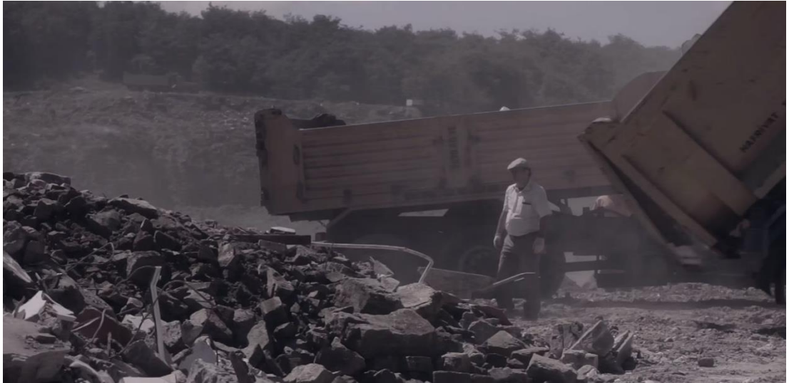
Şekil 20: Demir, Ö. (2012). Net17950 [Deneysel video, HD, renkli, 9']. Videodan kare.

Bu bağlamda Net17950 , yalnızca bir kentsel dönüşüm eleştirisi değil; aynı zamanda hafıza, görünürlük ve kimlik politikaları üzerine düşünsel bir davet sunar. Video yerleştirme formundaki bu üretim, mekânla ilişki kurma biçimini dönüştürürken, geçmişin izlerini arşivleyen bir araç görevi görür. Görsel öğeler ile sözlü anlatımın harmanlandığı yapıtta, estetik deneyim ile sosyopolitik sorgulama dengeli bir biçimde harmanlanır (Demir, 2023c)