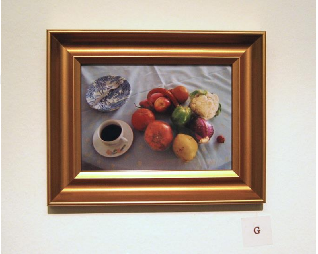
Şekil 5: Winchester, D. (2006). Likör ve Çikolata [Görsel, sergiden meyve ve kahve fotoğrafı çerçevesi]. Dilek Winchester Resmî Web Sitesi.

Sanatçılar, İstanbul'daki sosyal ağlarda, gündelik yaşam pratikleri üzerinden bireysel anlatılar toplayarak, kültürel normlar ve kimlik oluşum süreçlerine dair önemli ipuçları elde etmişlerdir. Bu anlatılar, belirli temalar etrafında yoğunlaşarak, kültür sosyolojisinin ve güncel sanatın kesişiminde zengin bir çözümleme alanı sunmaktadır.