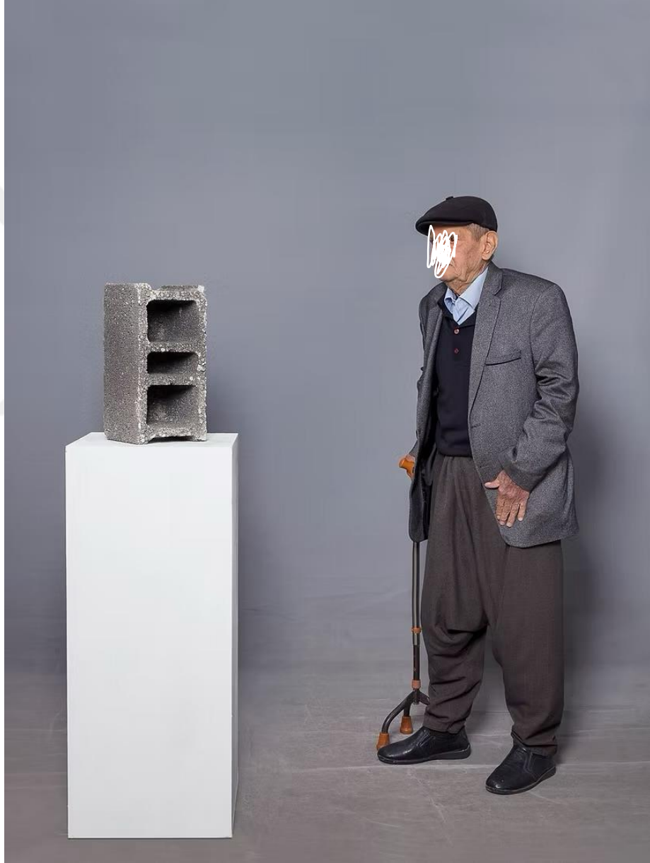
Şekil 13: Boğa, M. (2017). Beton Blok [Beton blok, kaide üzerinde yerleştirme, değişken boyutlar]. Yabancı Nesnelere serisi kapsamında.

duygusunun temsiline dönüşür. Roland Barthes'ın (1977) gösteregilim çözümlenmeleri doğrultusunda, battaniye hem sıcaklık ve koruma anlamlarını hem de ev içi aidiyet hissini işaret eden bir gösteregeye dönüşür. Battaniyenin rastlantısal ve düzensiz yerleştirilişi, bireysel hafıza ile kolektif hafıza arasındaki dağınık ilişkiye işaret eder. Böylece Boğa, ev içi nesnelere üzerinden kültürel bellek ve kimlik meselelerini görünür kılar.