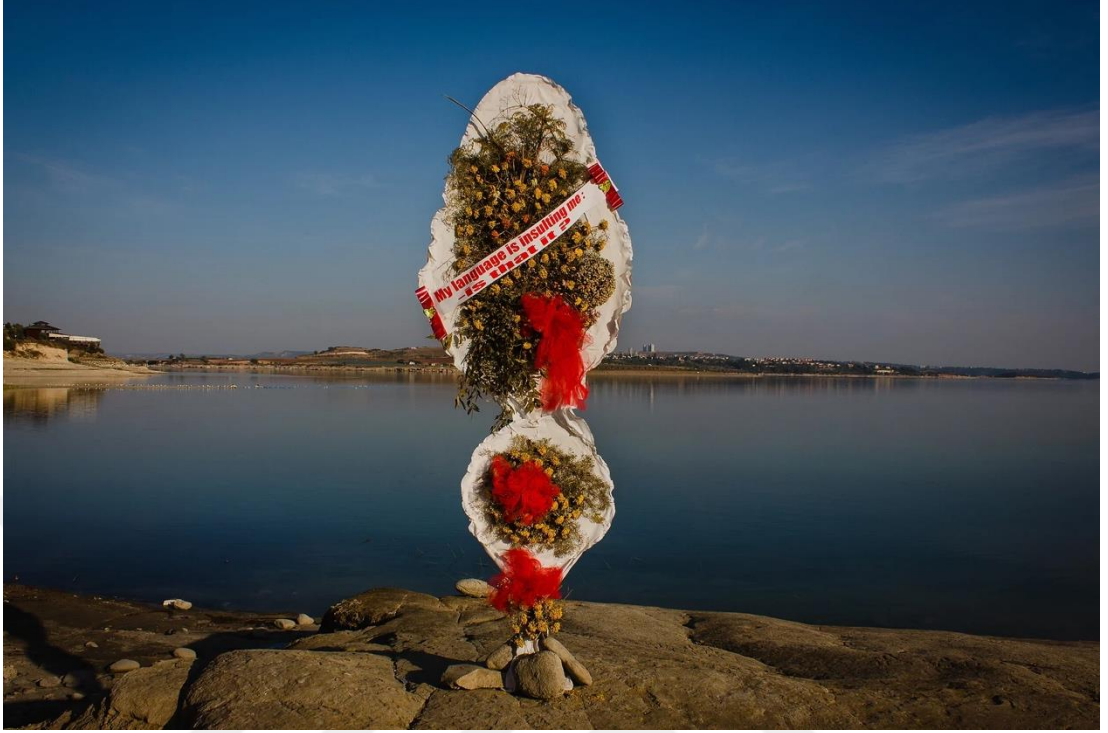
Şekil 8: Boğa, M. (2017). My Language is Insulting Me (Dilim bana hakaret mi ediyor? Yani mesele bu mu?) [Çiçek çelengi, kurutulmuş bitkiler, kumaş, yazılı şerit, değişken boyutlar]. Süslü Diyaloglar serisi kapsamında.

Mustafa Boğa'nın Süslü Diyaloglar serisi kapsamında ürettiği çalışmalardan biri, açık bir göl kenarında konumlandırılmış iki katmanlı çelenk yerleştirmesidir. Çelenklerin ortasında, "My language is insulting me" ifadesi yer almaktadır. Bu cümle, bireyin dil üzerinden maruz kaldığı kültürel baskıyı ve kimlik çatışmasını işaret eder. Göl kenarındaki doğal arka plan, kültürel kimliğin aidiyetle kurduğu ilişkiyi simgelerken, çelenğin steril, törensel formu bireysel hafızanın toplumsal baskılarla nasıl biçimlendiğini gösterir.