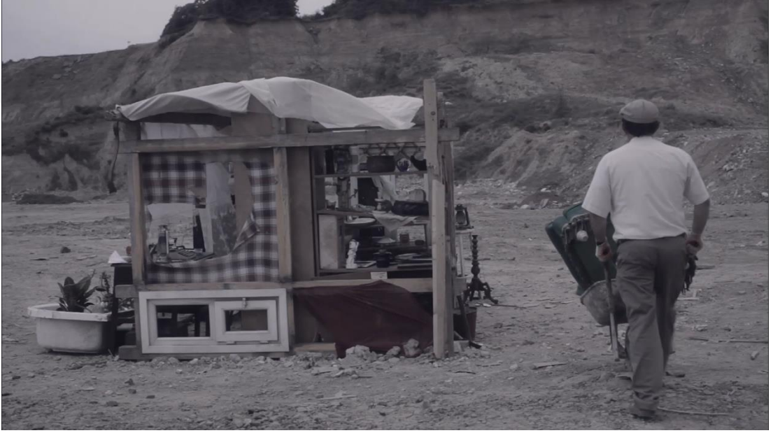
Şekil 17: Demir, Ö. (2012). Net17950 [Deneysel video, HD, renkli, 9']. Videodan kare.

Özden Demir'in Net17950 başlıklı video çalışması, 2012 yılında üretilmiş; belgesel video ile güncel sanat anlatısını bir araya getiren melez bir formda kurgulanmıştır. Yaklaşık 11 dakika uzunluğundaki bu video yerleştirme, sanatçının ilk kısa filmi olma özelliğini taşımaktadır. Yapıt, İstanbul Tasarım Bienali (2012), ZKM Karlsruhe (2014), Akbank Kısa Film Festivali (2013), Adana Altın Koza Film Festivali (2013), Ankara Uluslararası Film Festivali (2013) ve Avustralya Uluslararası Deneysel Film Festivali (2014) gibi önemli etkinliklerde gösterilmiş ve çeşitli ödüller almıştır (Demir, 2023a).