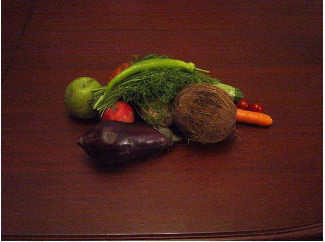
Şekil 7: Winchester, D. (2006). Likör ve Çikolata [Görsel, sebze ve meyve düzenlemesi detay]. Dilek Winchester Resmî Web Sitesi.

Gündelik hayatın sosyal kodları da projenin önemli odaklarından biridir. Katılımcılardan biri, günlük yaşam rutinlerini aktarırken şunları söyler: ‘Sabahları komşuya uğramadan işe gitmemek ayıp sayılır bizim buralarda. Bir kahve içmeden sokağa çıkmak garip karşılanır’ (Winchester & Soysal, 2006, s. 58). Bu ifade, gündelik hayat pratiklerinin nasıl belirli sosyal beklentiler ve kültürel normlar tarafından şekillendirildiğini göstermektedir. Giddens’in (2006) vurguladığı gibi, bireylerin gündelik rutinleri, toplumsal yapıların yeniden üretildiği temel alanlardır. Winchester ve Soysal’ın yöntemi, bu rutinlerin estetik belgelenmesine ve sosyolojik çözümlemesine olanak sağlar.