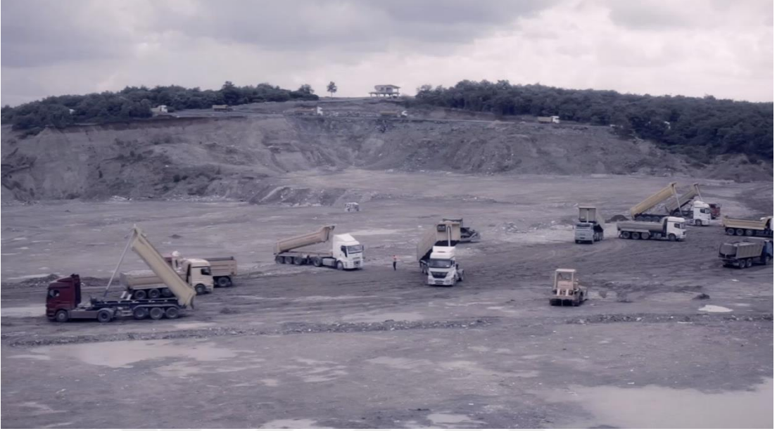
Şekil 18: Demir, Ö. (2012). Net17950 [Deneysel video, HD, renkli, 9’]. Videodan kare.

Sanatçının bu yapıttaki temel amacı, görünmeyen ve kayıt altına alınmayan hafıza biçimlerini görünür kılmaktır. Videoda, Ali isimli bir karakterin monoloğu eşliğinde izleyici, yıkılmış bir evin kalıntıları arasında dolanır. Ali, mekâna dair kişisel anılarını anlatırken, aslında çok sayıda bireyin paylaştığı kolektif bir belleğin sesine dönüşür. Mekân, yalnızca fiziksel bir yapı olmaktan çıkar; geçmişin, ilişkilerin, izlerin ve kimliklerin taşıyıcısı haline gelir (Güzel Sanatlar Dergisi, 2022)