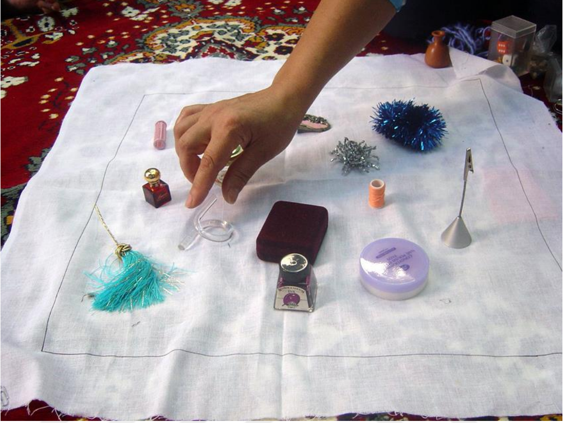
Şekil 3: Winchester, D. (2005). Çay, Çekirdek, Çoluk Çocuk . [Görsel, katılımcı oyun etkileşimi]. Dilek Winchester Resmî Web Sitesi.

Ayrıca, Tea, Sunflowerseeds, Kids, Et Al. projesi, sanat ve antropoloji arasındaki sınırları bulanıklaştıran bir örnek olarak da literatürde yer almıştır. Özkaracalar'ın (2020) çalışmasında da vurgulandığı gibi, Winchester'ın pratiği, sahaya dayalı nitel veri toplama tekniklerini estetik bir form içinde yeniden üretir. Sanatçı, oyun aracılığıyla hem veri üretmekte hem de katılımcılarla birlikte anlam inşa etmektedir.