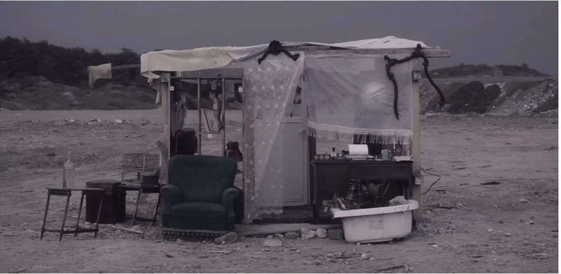
Şekil 21: Demir, Ö. (2012). Net17950 [Deneysel video, HD, renkli, 9']. Videodan kare.

Ali karakteri, kamusal belleğin bastırılmış anlatılarını taşıyan simgesel bir figür olarak yapılandırılır. Yıkıntıların arasında dolaşan, nesnelere toplayan ve yeniden bir araya getiren bu karakter, modern şehirleşmenin geride bıraktığı ‘atıkları’ sadece fiziksel değil, duygusal olarak da sahiplenir. Bu anlamda Ali, yalnızca bir tanık değil; geçmişin yeniden kurulmasında aktif rol alan bir özneye dönüşür. Bu yaklaşım, Walter Benjamin’in tarih anlayışına paralel olarak ‘enkazlar’ üzerinden yeni bir anlatı kurma çabasını yansıtır (Benjamin, 1940/2018).