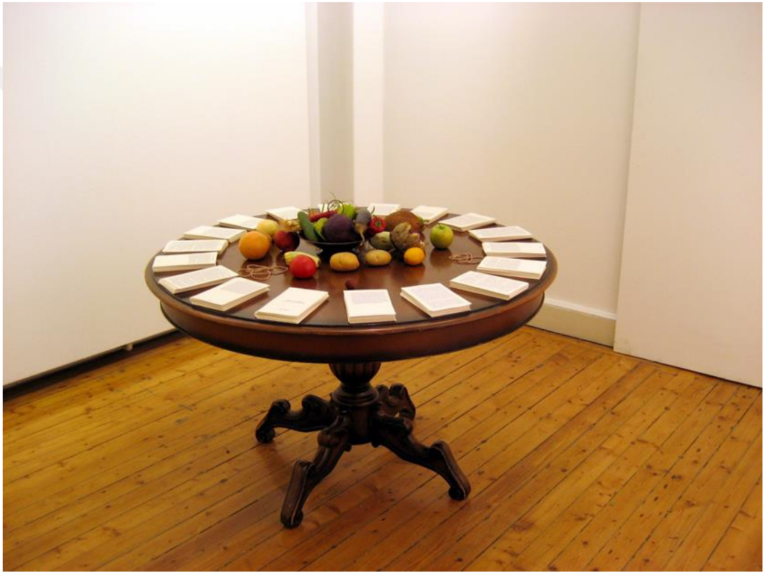
Şekil 4: Winchester, D. (2006). Likör ve Çikolata [Görsel, sergi yerleřtirmesi masa üstü kitaplar ve meyveler]. Dilek Winchester Resmî Web Sitesi.

Dilek Winchester ve Arzu Soysal'ın Likör ve Çikolata (2006) projesi, bireysel deneyimlerin kültürel ve toplumsal yapıların görünür hale gelmesinde nasıl işlev gördüğünü sorgulayan özgün bir çalışmadır.