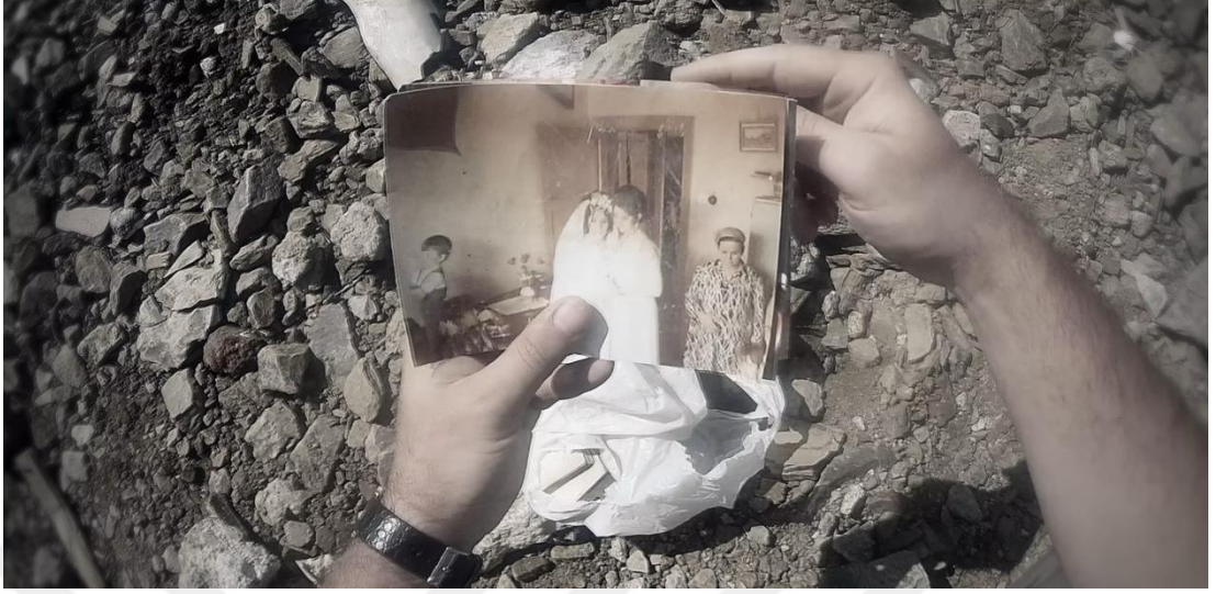
Şekil 22: Demir, Ö. (2012). Net17950 [Deneysel video, HD, renkli, 9']. Videodan kare.

Filmdeki anlatı yapısı, seyirciyi zamansal bir belirsizlik içinde tutarken, mekânın 'hafızalı' yapısını ön plana çıkarır. Giorgio Agamben'in (1998) tanımsız alan (zone of indistinction) olarak tarif ettiği bu tür liminal sahneler, Net17950 'de yıkımla birlikte ortaya çıkan travmatik boşlukları temsil eder. Burada mekân, bir temsil düzlemi olarak yalnızca fiziksel değil; toplumsal, politik ve duygusal kodlarla örülü bir yapıdır. Bu nedenle film, mekânın dönüşümünü salt bir mimari mesele olarak değil; hafızanın silinişiyle bağlantılı, kültürel bir felaket olarak işler.