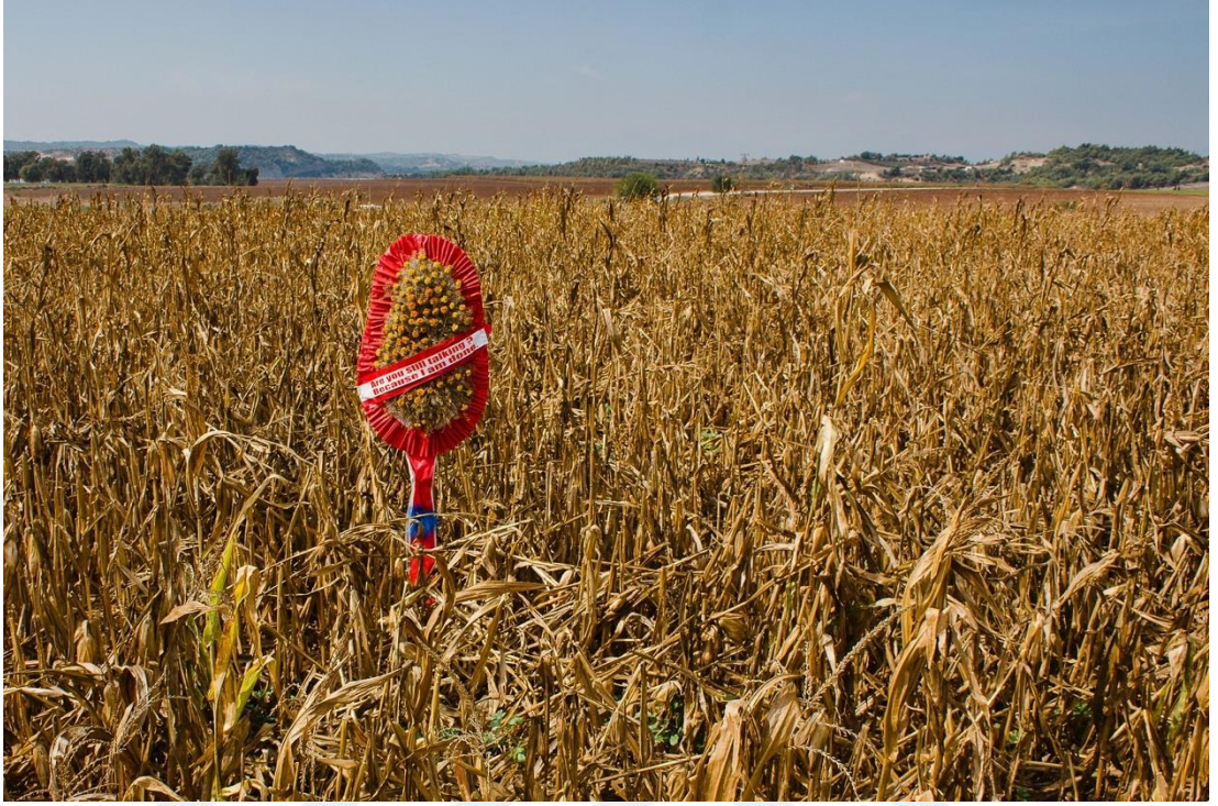
Şekil 10: Boğa, M. (2017). Are You Still Talking? Because I Am Tired (Hâlâ konuşuyor musun? Çünkü yoruludum.) [Çiçek çelengi, kurutulmuş bitkiler, kumaş, yazılı şerit, değişken boyutlar]. Süslü Diyaloglar serisi kapsamında.

Çelenk şeridinde “Are you still talking? Because I am tired” ifadesi yazılıdır. Kurumuş mısır bitkileri, verimliliğin sona erdiği bir doğa döngüsünü simgelerken, çelenk üzerindeki sözler iletişim yorgunluğunu ve toplumsal ilişkilerde yaşanan tükenmeyi metaforlaştırır. Berger’in (1972) görme ve algı kuramı çerçevesinde, bu sahne yalnızca bir manzara temsili değil, aynı zamanda bireyin toplumsal yapılar karşısında hissettiği yorgunluğun görsel bir anlatımıdır. Mustafa Boğa, burada doğanın döngüsel tükenişini bireysel duygusal tükenişle özdeşleştirerek, görsel kültürde zamansallık ve hafıza ilişkilerini poetik bir biçimde ortaya koymaktadır. Sanatçının mekân seçimi ve dil kullanımı, kültürel kodlar ve bireysel psikolojinin nasıl iç içe geçtiğini derinlemesine sorgular (SEAS-UK, 2022).