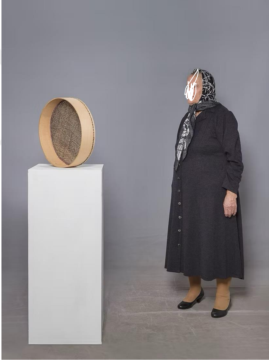
Şekil 14: Boğa, M. (2017). Elek [Ahşap elek, kaide üzerinde yerleştirme, değişken boyutlar]. Yabancı Nesnelere serisi kapsamında.

Burada sanatçı, yapı malzemesi olan sıradan bir beton bloğu estetik bir nesne gibi sunar. Beton blok, dayanıklılık, ağırlık ve işlevsellik çağrışımlarıyla izleyici karşısına çıkar. Ancak bu sert, ham nesnenin sanat mekânında sergilenmesi, modern toplumun endüstriyelmiş yaşam tarzına ve yapısal şiddete dair eleştirel bir okumayı mümkün kılar. Jean Baudrillard'ın (1981) simülasyon kuramı bağlamında, beton blok artık yalnızca bir inşaat malzemesi değil; modernitenin izlerini taşıyan kültürel bir simgeye dönüşür. İzleyici, bu sıradan nesne karşısında kendi gündelik hayatıyla ve kent kültürüyle yüzleşir.