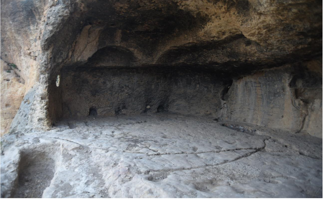
Resim 32: Kaya Kilisesi