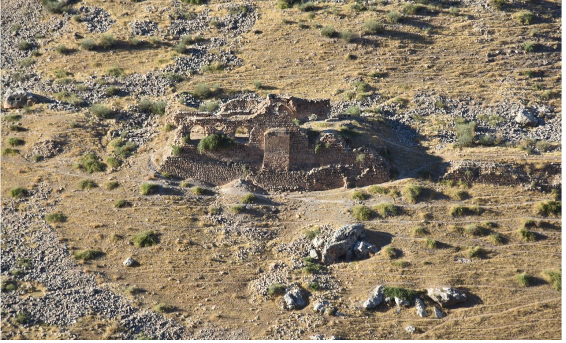
Resim 24: Taciyan Cami