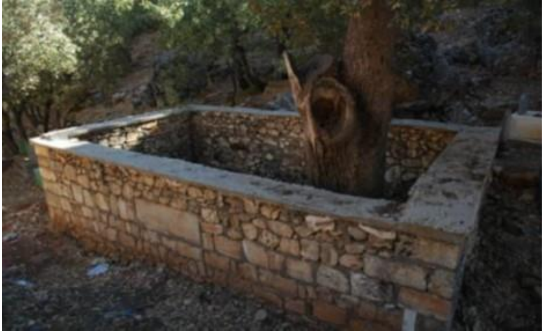
Resim 47: Nebi Hallak