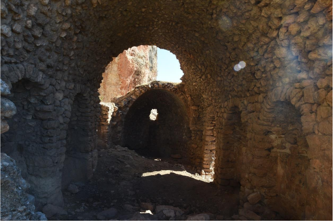
Resim 30: Yatır (Şahveliyan) Köyü Kilisesi