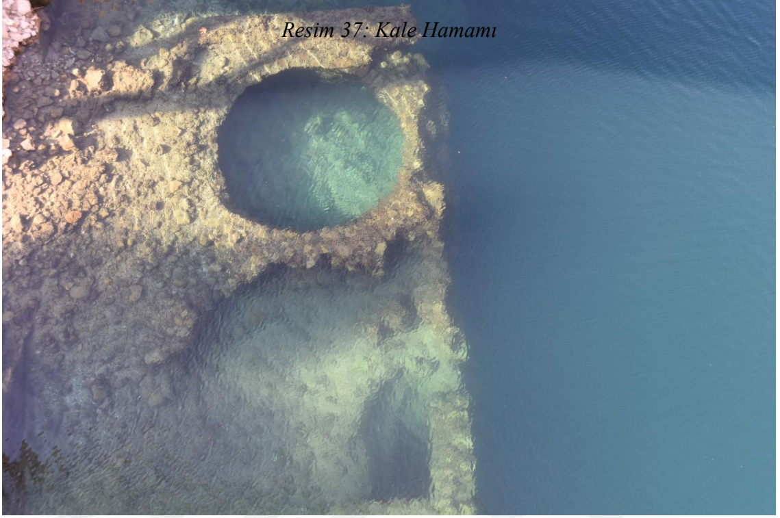
Resim 37: Kale Hamamı