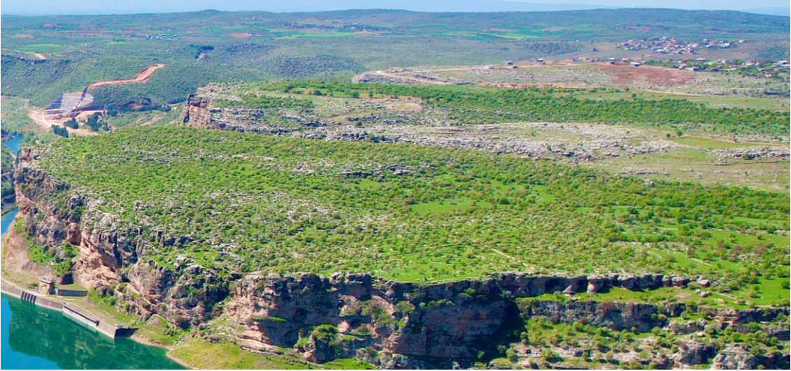
Resim 20: Amini Kalesi Doğu Kaya Mezarı