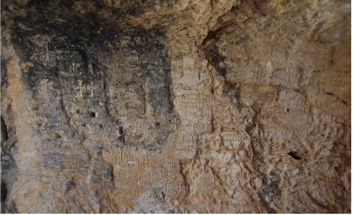
Resim 34: Kaya Kilisesi