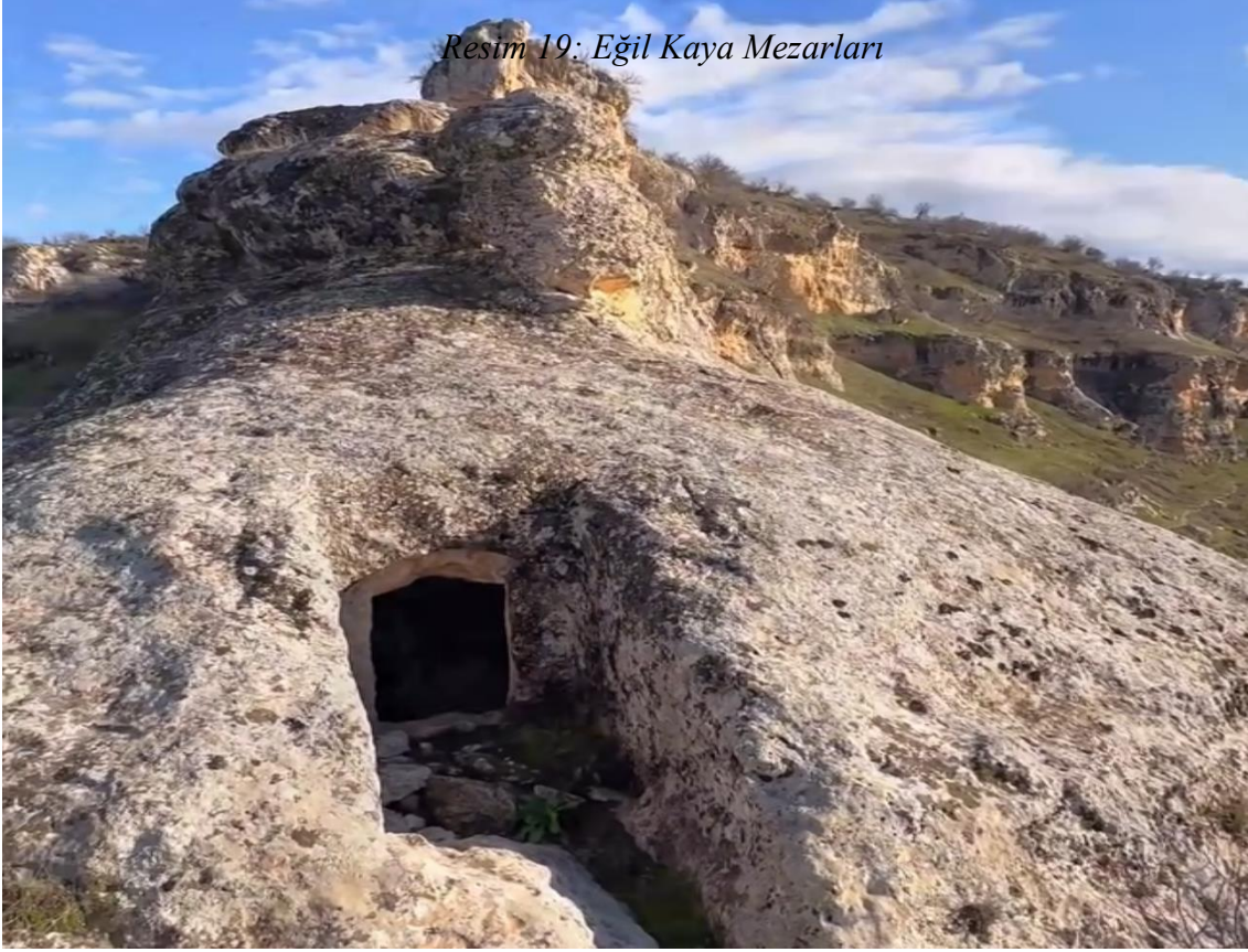
Resim 19: Eğil Kaya Mezarları