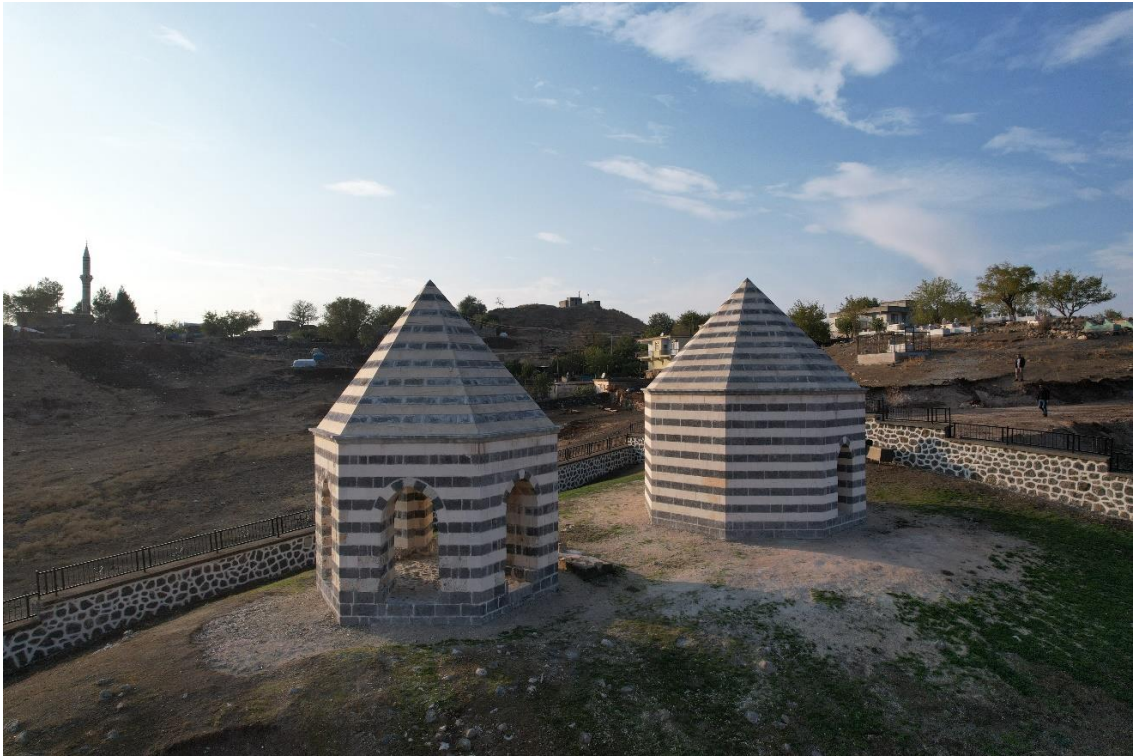
Resim 38: Deran Hamamı