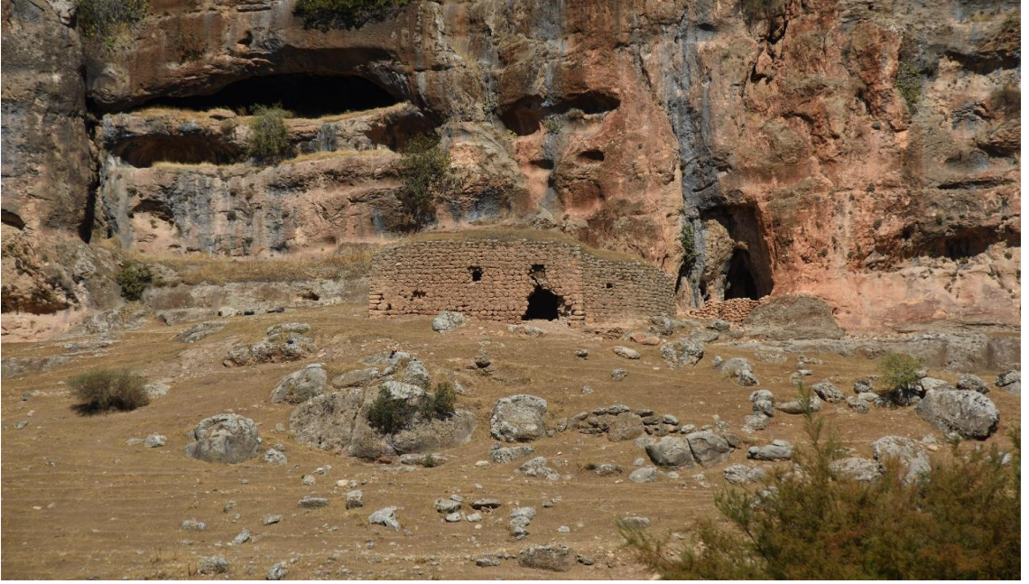
Resim 28: Yatır (Şahveliyan) Köyü Kilisesi