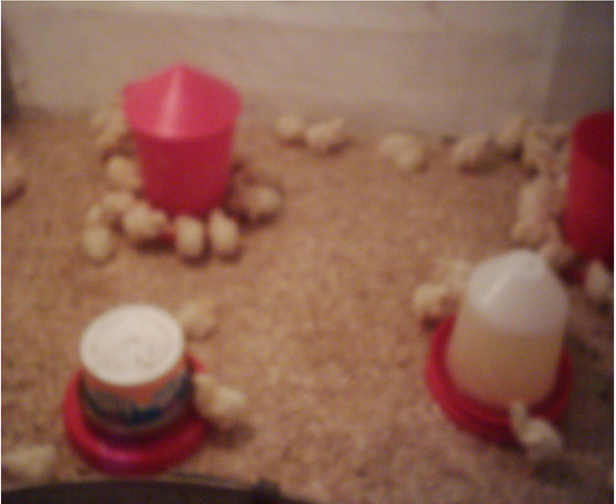
ekil 3. 1. Büyüme ünitelerinin genel görünümü.

Bu deneme Y.Y.Ü Ziraat Fakültesi Döner Sermaye letmesi Tavukçuluk Ünitesinde yürütülmü tür. Kümes içerisi tümüyle pulvizatör yardımıyla önce kireçlenmi daha sonra yine kümes, bölmeler, altlıklar ve tüm ekipmanlar uygun bir dezenfektanla dezenfekte edilmi , kümes giri -çıkı larına kireç tablaları bırakılmı tır. Kümes iki ayrı kısma bölünmü bölmelerden biri kontrol gruplarına di eri muamele gruplarına ayrılmı tır. Her iki tarafta da 4' er bölme hazırlanmı tır. Hayvanlar teslim alınmadan önce kümes ısıtıcılar yardımıyla iyice ısıtılarak bölmelerde sıcaklık 36 °C olarak sabitlenmi , altlıklar serilmı ve büyütme üniteleri hazırlanmı tır ( ekil 3.1.) Kontrol ve muamele gruplarındaki 4'er bölmenin 2'si saman altlıklı di er ikisi ise tala altlıklı olarak hazırlanmı tır.