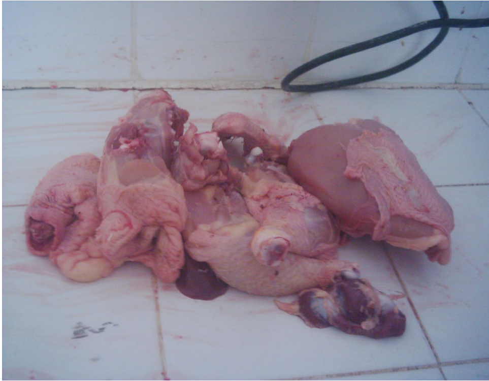
ekil 3. 8. Etlik piliçlerde karkas parçalama.