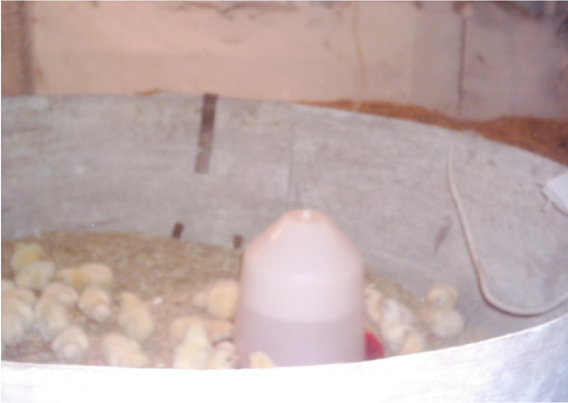
ekil 3. 3. Büyütme ünitesi.

Hayvan materyali olarak Malatya – Öznesil Tavukçuluk ve Yem Sanayi Ticaret Limitet irketi' nden 645 adet günlük Ross 308 etçi hibrit civcivler temin edilmi tir. Getirilen civcivlerin hassas terazide C.A tartımları yapılmı , metal kanat numaraları takılarak e it sayılarda 2 saman, 2 tala altlıklı büyütme ünitelerine yerle tirilmi lerdir ( ekil 3.3.). Yakla ık üç saat sonra manuel yemlikler içerisinde broiler standart ba langıç yemleri verilmeye ba lanmı tir. Deneme süresince haftalık canlı a ırlık tartımları yapılmaya devam edilmi , ölen hayvanlar belirlenerek grupları tespit edilmi tir.