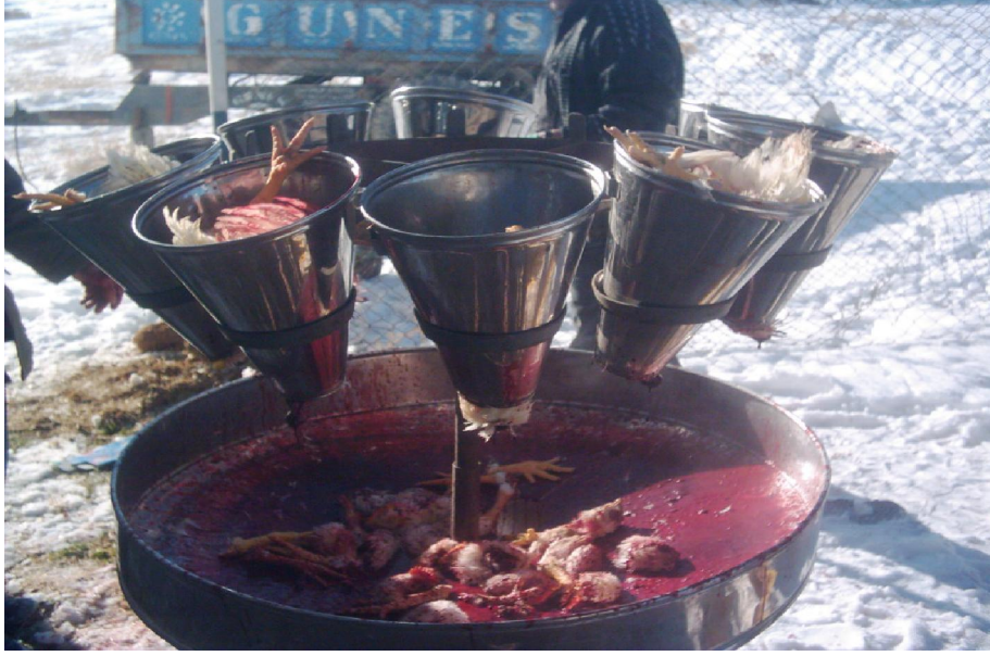
ekil 3. 7. Etlik piliçlerin kesim i lemi