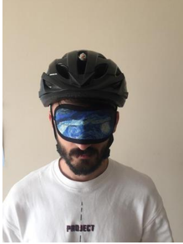
Hastanın Değerlendirme Öncesi Lazer Sabitlenmiş Kaskı Giymesi ve Gözlerinin Kapatılması

fleksiyon hareketleri açısından değerlendirildi. Ölçüm için bir kask üzerine sabitlenmiş bir lazer pointer kullanıldı (Resim 1). Ölçüm hasta bir sandalyede kalça ve diz 90 derece olacak şekilde otururken gerçekleştirildi. Sandalyeden 1 metre uzakta bulunan duvara koordinat düzlemi çizilmiş bir platform sabitlendi. Ölçüm, hastanın boynunu rahat hissettiği nötral pozisyonu belirlemesi ile başladı. Bu esnada hastanın başındaki lazerin koordinat düzlemi üzerine düşen ışığının koordinatları kaydedildi. Daha sonra hastadan istenen hareketi (boyun fleksiyonu, boyun ekstansiyonu vb.) ağrı oluşturmadan, rahat şekilde yapabildiği yere kadar yapması ve tekrar nötral pozisyona dönmesi istendi. Hastanın döndüğü noktanın koordinatları da kaydedildi. Hastanın kendi belirlediği nötral pozisyonu ile hareketi yaptıktan sonra nötral pozisyona geldiğini düşündüğü nokta arasındaki fark cm cinsinden belirlendi. Ölçümlere başlanmadan önce uygulanacak değerlendirme prosedürü hastaya anlatıldı ve ölçüm bir kez denettirildi. Ardından üç tekrarlı olacak şekilde ölçümler yapıldı. Tüm değerlendirme boyunca hastanın gözleri kapalı tutuldu. Bu üç ölçümden elde edilen sonuçların ortalaması istatistiksel analizlerde kullanıldı. Servikal eklem pozisyonlama hatası: \text{açı} = \tan^{-1} (\text{hata komponenti}/100 \text{ cm}) formülü kullanılarak hesaplandı. Hata komponenti x ve y eksenlerindeki ortalama hatanın karelerinin toplamının karekökü olarak belirlendi (77).