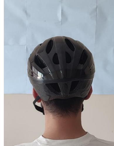
Hastanın Servikal Nötral Pozisyonu