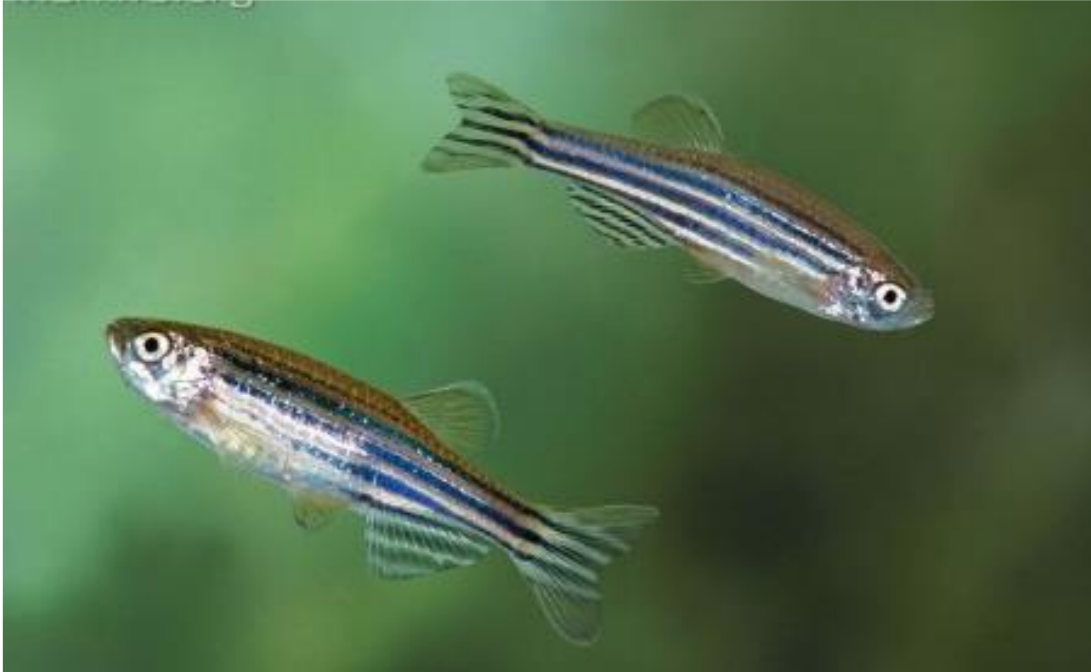
řekil 2.1. Danio rerio (Alpbaz, 2010).

Bu özellikler, zebra balıklarının mikrobiyoloji, genetik, embriyoloji, biyomedikal arařtırmalar ve ilaç testleri gibi birçok farklı arařtırma alanında kullanılmasını sağlamıřtır. Bu nedenle, zebra balığı, bilimsel topluluk içinde önemli bir model organizma olarak kabul edilmektedir (Monteiro vd., 2015).