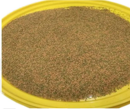
Şekil 3.4. Spirulina Garlic yemi.

Bu yemin bileşiminde kullanılan hammaddeler, LT balık unu, omega 3 balık yağı, deniz algi, spirulina, lestine, taurine, (A2704-12/ACS-GM005-3), MON403-2(MON-04032-6) ve MON89788(MON89788-) ayırt edici kimlik kodlu genleri ihtiva etmektedir. Buğday unu, vitaminler, mineraller, fosfolipidler, karbonhidratlar, bağışıklık ve sindirim sistemi düzenleyici, toksin bağlayıcılar (MOS&beta-Glucan) ve doğal antioksidanlar yem içerik bileşeninde bulunmaktadır. Ayrıca temel besin değerlerinde; ham protein %44.0, sıvı ve katı ham yağlar %4.0, ham selüloz %3.0, ham kül oranı %7.0 oranlarında bulunmaktadır (Şekil 3.4).