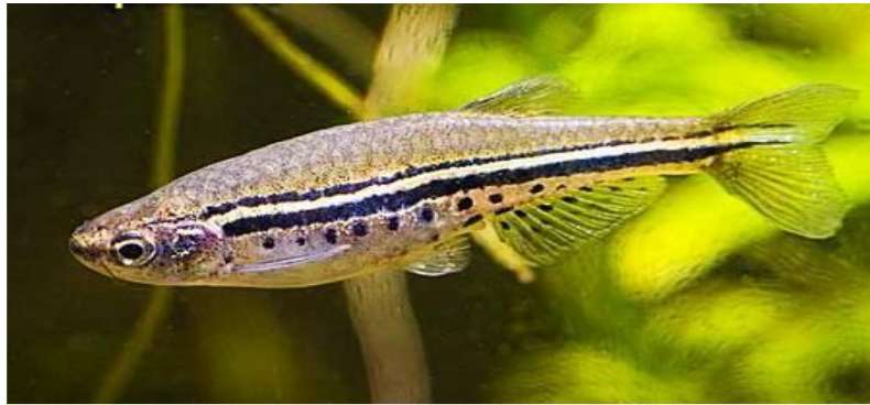
Şekil 2.4. Brachidanio nigrofasciatus (Alpbaz, 2010).

Bu balıkların doğal yaşam alanı Burma’dır. Büyüklükleri en fazla 5 cm’ye ulaşabilmektedir. Bu balıklar diğer zebra balıkları gibi barışçıl ve hareketli bir yapıya sahiptirler. Gövdelerinin ana rengi kahverengidir. Mevcut bu ana renk üzerinde gövdelerini baştan kuyruğa geçen parlak mavi iki çizgi görülür. Çizginin altında bulunan sarı renk baskındır. Bu bölgede yer alan koyu benekler bu balıklara “benekli danio” adını kazandırmıştır. Bu yapıları ve özelliklerinden dolayı zebra balığı ile leopar balığının meleziymiş gibi bir görünüme sahiptirler (Şekil 2.4).