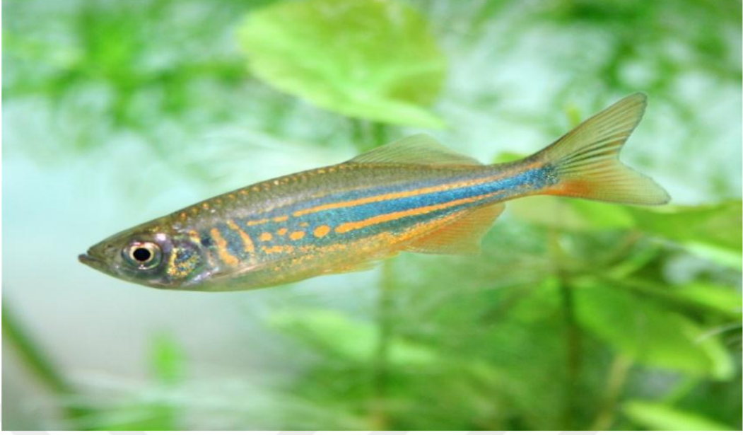
Şekil 2.6. Danio devario (Alpbaz, 2010).