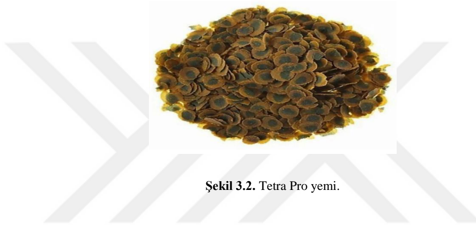
Şekil 3.2. Tetra Pro yemi.

Ayrıca yemin içeriğinde katkı maddeleri olarak; vitaminler, provitaminler ve benzer etkiye sahip D3 vitamini 1860 IE/kg bulunmaktadır. Mikrobesein bağlantıları olarak da; E5 manganiz 68 mg/kg., E6 Çinko 40mg/kg., E1 demir 26 mg/kg., renklendiriciler, koruyucular, antioksidan maddeler bulunmaktadır (Şekil 3.2).