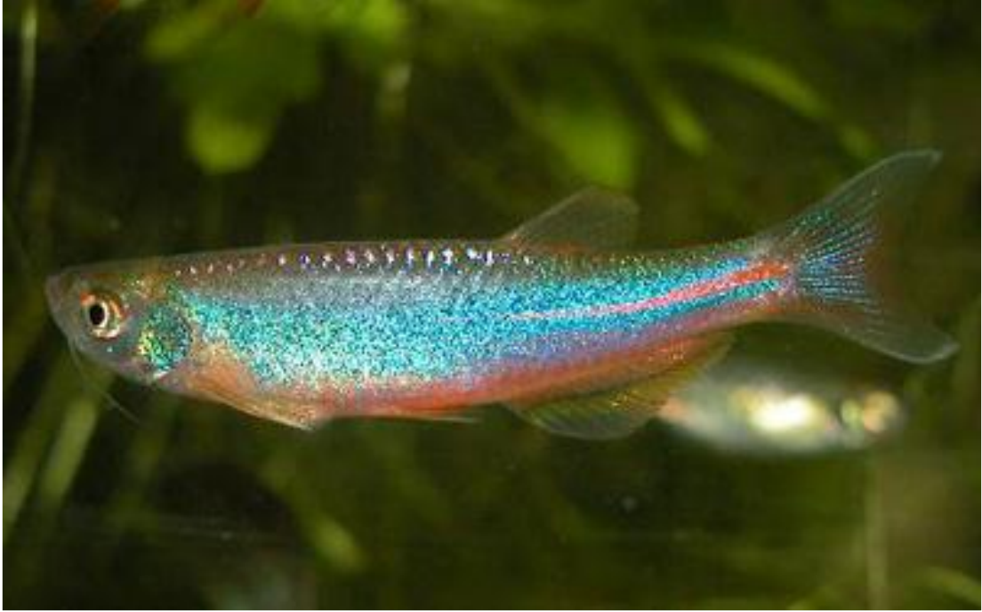
Şekil 2.2. Brachidanio albolineatus (Alpbaz, 2010).

Doğal yaşam alanları, Güneydoğu Hindistan, Burma ve Malaya' dır. Karma balıklar ile akvaryumlarda yaşamalarında bir sıkıntı yoktur. Boyları yaklaşık 5 cm'ye ulaşabilmektedir. Bu balıkların gövde yanlarını tam ortadan bölen yatay şekilde portakal renginde bir çizgi vardır. Daha çok "İnci danio" adıyla tanınan bir türdür. Bu balığın temel rengi, genellikle yeşille canlı mavi karışımıdır (Şekil 2.2). Bu balıkların su sıcaklık istekleri 22-28 °C'dir. Üretilmeleri için istenilen sıcaklık 28 °C seviyesindedir.