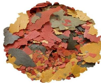
Şekil 3.3. Tetra Min pul yemi.

Katkı maddeler olarak; vitaminler, pro vitaminler ve benzer etkiye sahip maddeler bulunmaktadır. İçeriğindeki kimyasal maddelerden D3 vitamini 1990 IE/kg bulunmaktadır. Yem içeriğindeki mikro besin bağlantıları E5 manganiz 96 mg/kg., E6 çinko 57 mg/kg., E1 demir 37 mg/kg., E3 kobalt 0,7 mg/kg. olup, ayrıca renklendiriciler, antioksidan maddeler bulunmaktadır (Şekil 3.3)