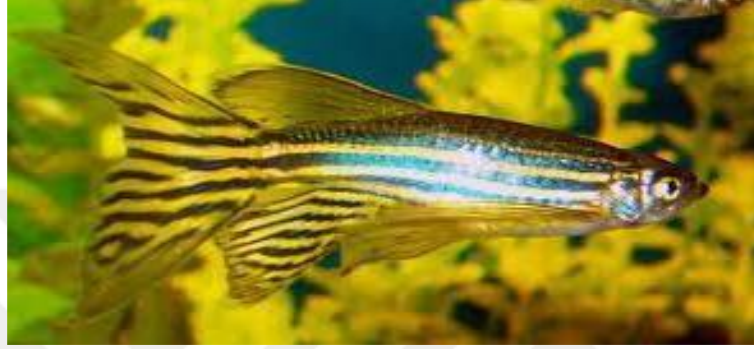
Şekil 2.5. Brachydanio rerio ( Danio rerio ) (Alpbaz, 2010).

Bu balık Hindistan orijinlidir. Doğal yaşam alanları Bengal’de bulunmaktadır. Bu balıkların renklerine göre sarı ve gümüşü iki türü ayırt edilir. Bu ana renklerin üzerinde bulunan ve baştan kuyruk sonuna kadar uzanan lacivert yeşil metalik ışıltılı çizgiler bu balığa çok farklı bir görünüm kazandırır. Var olan bu renk deseniyle bilimsel adından çok “zebra balığı” olarak adlandırılır (Şekil 2.5).