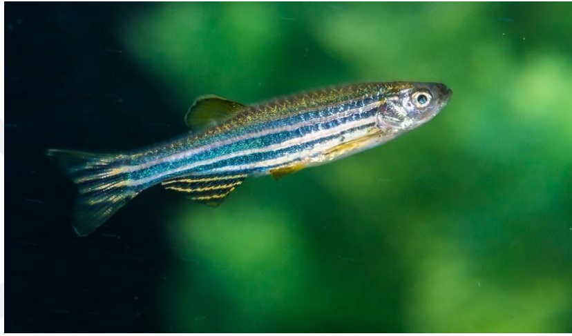
Şekil 2.8. Danio rerio (Alpbaz, 2010).

Bu balıklara Bangladeş ve Hindistan sularında rastlanmakla beraber, bu balığın akvaryumda yetiştirilmesi 1960'lı yıllardan sonra olmuştur. Değişik görünümünden dolayı bazı ülkelerde bu balık "kadın çorabı" diye de adlandırılmıştır. Bu balıklar akvaryum şartlarında nadir olarak 5 cm'ye ulaşabilmektedir. Doğada bulunan türleri ise 6-8 cm boyutlarına ulaşabilmektedir. Dişiler erkek balıklara göre daha büyük ve daha yuvarlak bir karna sahiptirler. Vücut renkleri altın veya gümüş renk tonu ile zeytin mavisidir. 4 adet mavi ve siyah çizgi başlarından kuyruklarına doğru uzanmaktadır (Şekil 2.8). Bu türün bireyleri diğer zebra balıkları gibi sürü halinde yaşamaktadırlar.