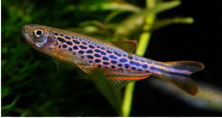
Şekil 2.3. Brachidanio frankei (Alpbaz, 2010).

Hindistan’da bulunan bir tür olup üretimi yaygınlaşmıştır. Üzerinde bulunan renklerden dolayı daha çok “leopar danio” veya “leopar balığı” diye bilinir. Bu balığın gövdesinin ana rengi kirli sarıdır. Bu gövdenin üzerinde balığa leopar deseni özelliği kazandıran lacivert-siyah benekler bulunmaktadır (Şekil 2.3). Bu türün büyüklükleri yaklaşık 5-7,5 cm arasında değişmektedir.