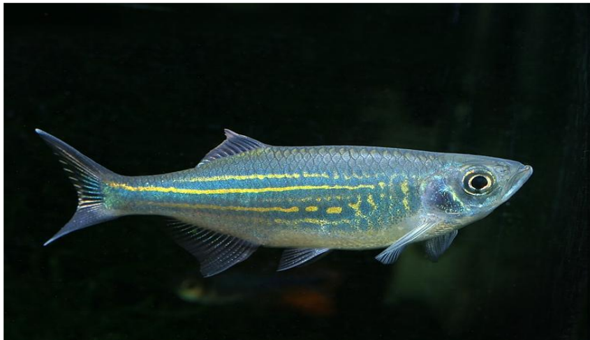
Şekil 2.7. Danio malabaricus (Alpbaz, 2010)

Bu balıkların doğal yaşam alanları, Malabar ve Seylan'ın tatlı sularıdır. Malabaricus adını Malabar kökenli olmaları sebebiyle alırlar. Bu balığın başka bir adı da Dev zebra olarak bilinmektedir. Boyları genellikle 11-12 cm, bazen de 14 cm'ye ulaşanlara rastlanmaktadır. Bununla birlikte akvaryumlarda büyüklükleri nadiren 10 cm'yi aştığı görülmektedir. Bu balığın sırtı gri yeşil renkte ve metaliktir (Şekil 2.7).