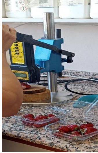
Şekil 3.5. 'Albion' çilek çeşidinde meyve sertliği ölçümü