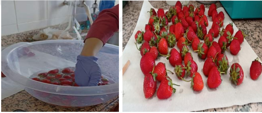
Şekil 3.2. Depolama öncesi meyvelere yapılan uygulamalar ve kurutma işlemi

Son grup meyveler 0.1 mM melatonin ve %1 kitosan çözeltilerinin karıştırılması ile hazırlanan çözeltiliye 5 dakika süreyle batırılarak ve kurutma işlemi yapılarak kaselere yerleştirilmiştir (Şekil 3.2).