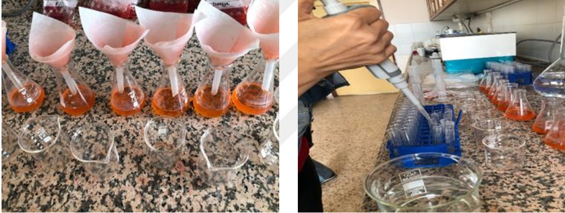
Şekil 3.7. Çilek meyvelerinde Askorbik asit (C vitamini) miktarı ölçüm öncesi hazırlanması

C vitamini miktarı Pearson ve ark. (1970)'e göre boya çözeltisi kullanılarak spektrofotometrik yöntem ile belirlenmiştir. Çilekler blender ile püre haline getirildikten sonra 5 g meyve örneği tartılıp üzerlerine 45 mL %0.4 oksalik asit eklenerek filtre kağıdından süzümüştür. Elde edilen süzüntüden 1 mL alınarak üzerine 9 mL boya çözeltisi ( \text{C}_{12}\text{H}_6\text{C}_{12}\text{NO}_2\text{-Na} ) eklenip 520 nm dalga boyunda okuma yapılmıştır (Şekil 3.7). Standart olarak 1 ml süzüntü üzerine 9 mL saf su eklenerek elde edilen çözelti kullanılmıştır (Küçükbasmaci Sabir, 2008).