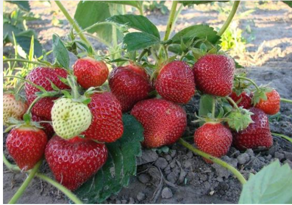
Şekil 3.1. Bitkisel materyal 'Albion' çilek çeşidinin hasat öncesi görünümü

Çalışmada 'Albion' çilek çeşidi kullanılmıştır. 'Albion' serin ve ılıman bölgelere uyum sağlamış, nötr gün çeşididir. En önemli özellikleri meyveleri kalitelidir, meyve tadı açısından diğer çeşitler arasında en iyisidir ve bunu bütün sezona yayar. Meyve büyüklüğünde tüm sezon boyunca aynıdır. 'Albion' meyvesi tipik olarak uzun, konik ve çok simetrik. 'Albion', Diamante ve Aromas çeşitlerinin iyi özelliklerinden oluşan bir karışımdır. Meyve toplamaya çok elverişli bir bitki yapısı vardır (Şekil 3.1). Hasat sonrası meyvelerin dayanıklılığı diğer çeşitlerden daha uzundur (Ağaoğlu ve Gerçekçiöğlü, 2013).