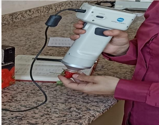
Şekil 3.4. 'Albion' çilek çeşidinde renk ölçümü

Depolama süresince çileklerde meydana gelen renk değişimlerini belirlemek amacıyla depodan çıkartılan örneklerde ekvator bölgesinde karşılıklı yüzeylerinde renk ölçüm cihazı kullanılarak (CR 400, MinoltaCo, Japonya) CIE L* a* ve b* değerleri okunacak, C* (kroma) ve hue açısı (h°) değerleri hesaplanmıştır (Şekil 3.4) (McGuire, 1992).