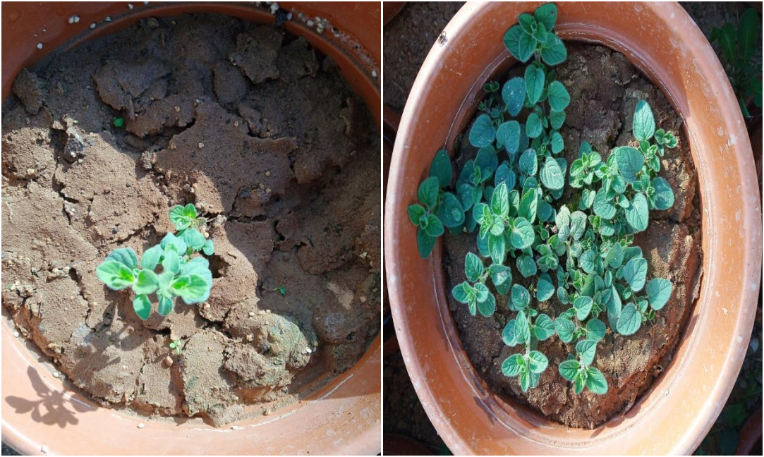
Şekil 3.3. Köklenmiş kekik çeliklerinin saksıya aktarılması