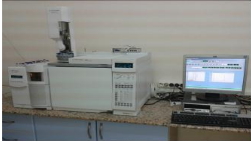
Şekil 3.9. GC-MS