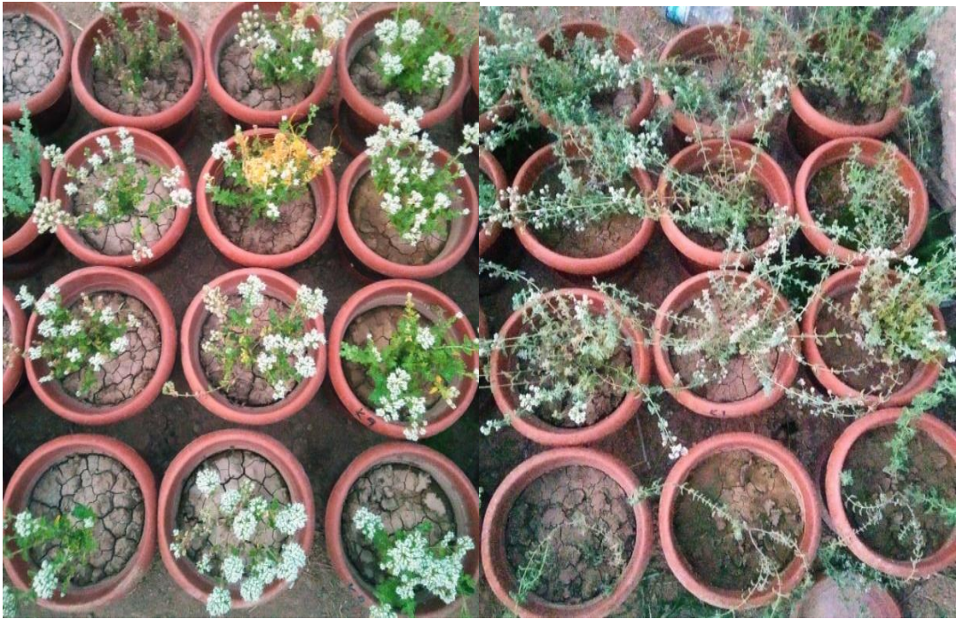
Şekil 3.5. Hasat dönemdeki çiçeklenmiş genotipler