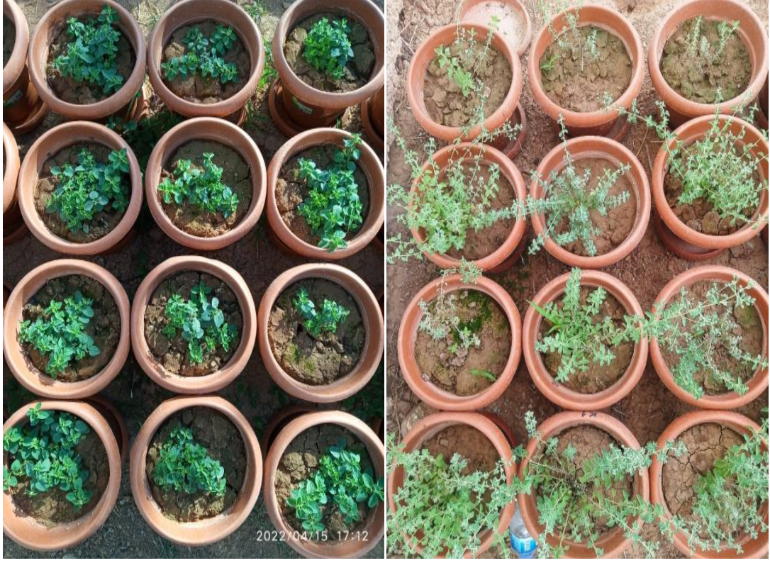
Şekil 3.4. Saksıda gelişim gösteren bitkiler