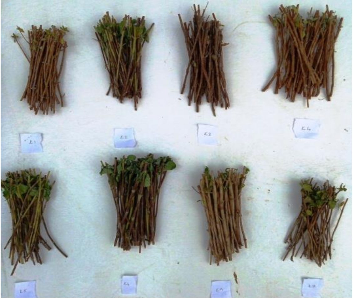
Şekil 3.2. Köklendirmeye alınan kekik çelikleri