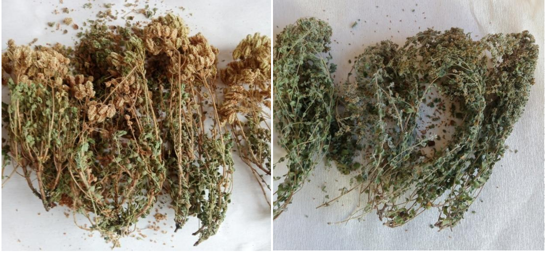
Şekil 3.6. Gölgede kurutulmuş bitki numuneleri