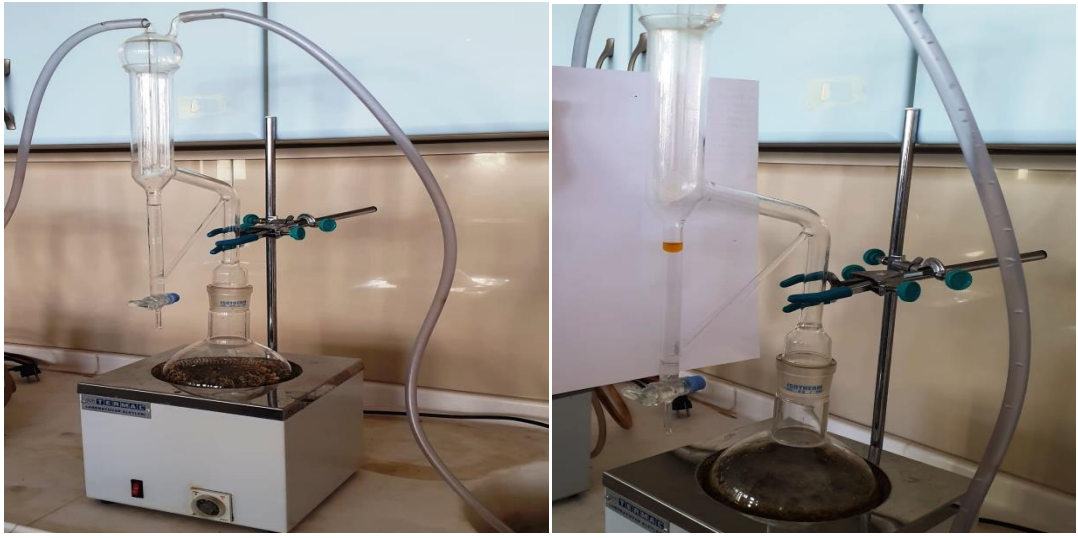
Şekil 3.7. Distilasyon sistemi (Clevenger cihazı)