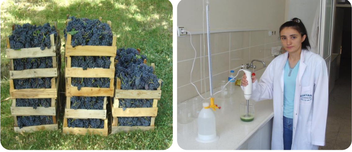
Şekil 3. 6. Hasat edilen üzüm ve laboratuvar çalışmaları.