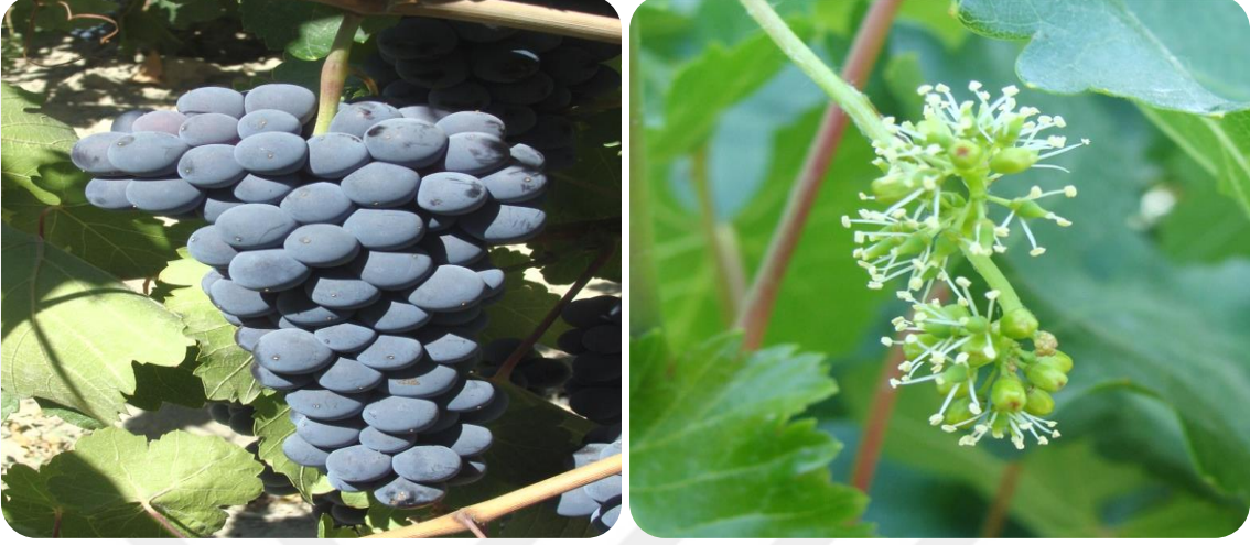
Şekil 3. 1. Erciř üzüm çeşidine ait salkım ve çiçek fotoğrafları.

klorofil miktarı Lichtenthaler ve Wellburn (1983) tarafından verilen formüllere göre hesaplanmıştır.