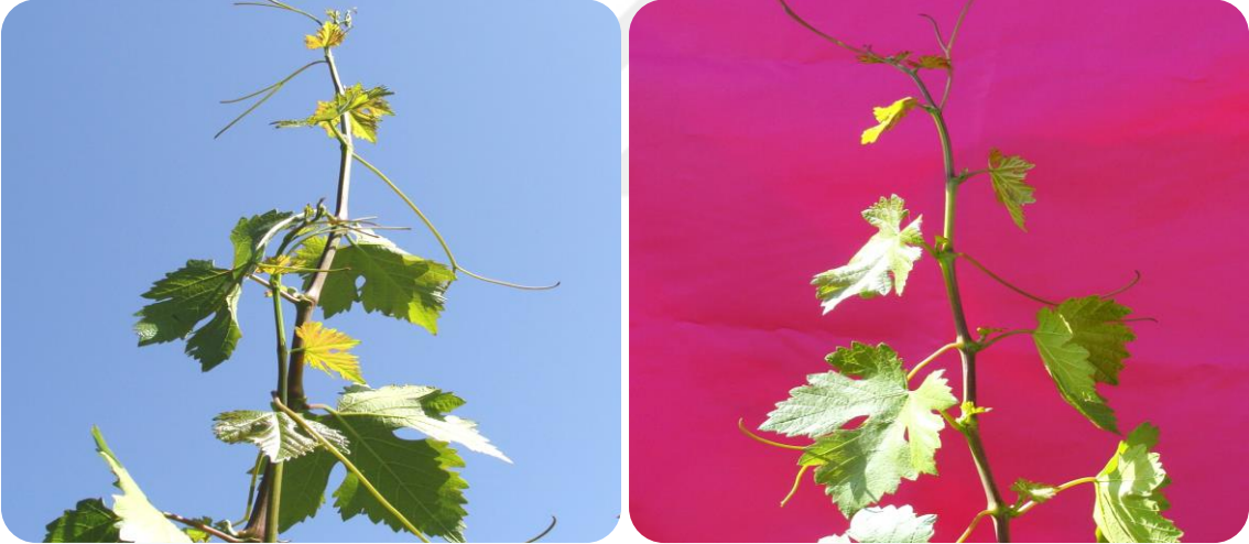
Şekil 3. 2. Salamuralık yaprakların toplandıđı sürgünler.