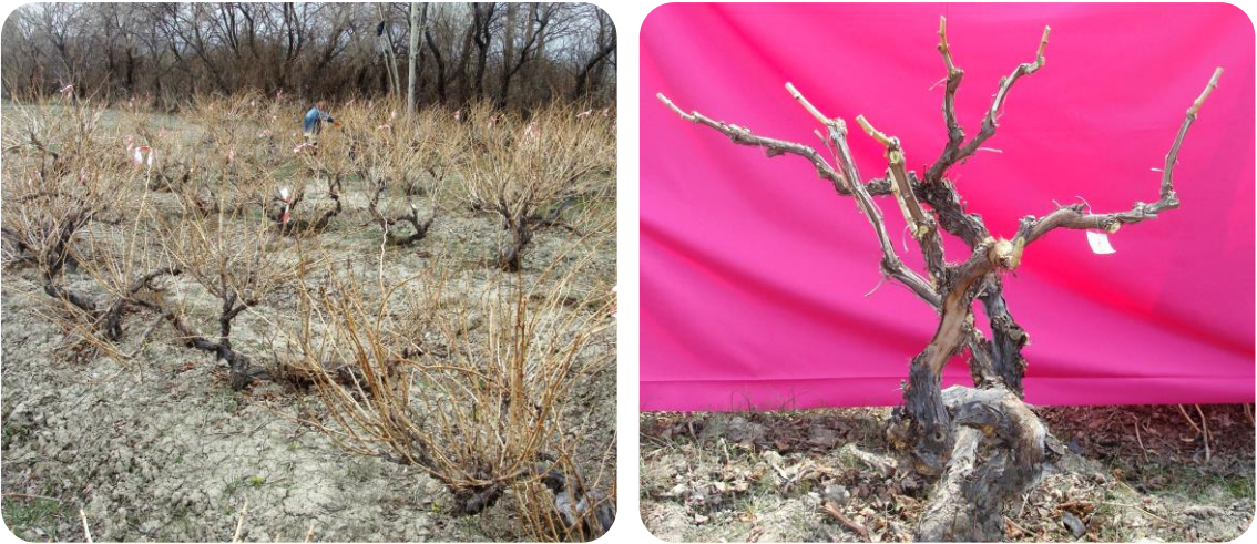
Şekil 3. 5. Omcaların budama öncesi ve budama sonrası görüntüleri.