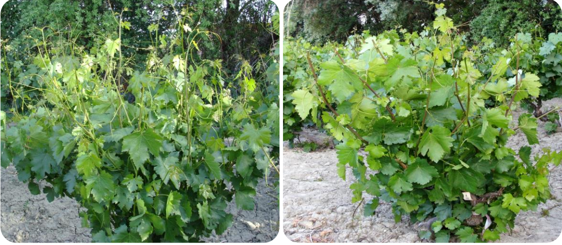
Şekil 3. 3. Salamuralık yaprak toplanmış ve sürgün ucu alınmış omcalar.