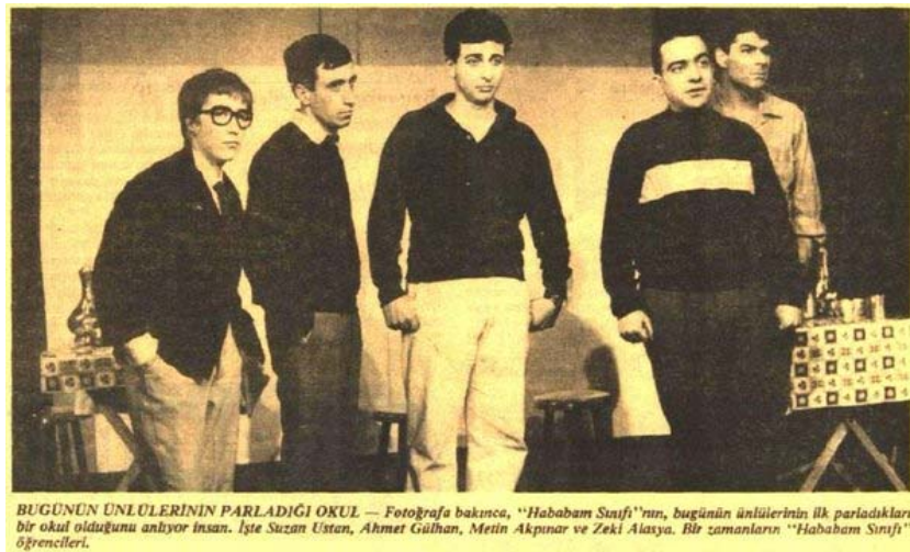
Resim 4.3: Hababam Sınıfı oyunundan bir gazete haberi