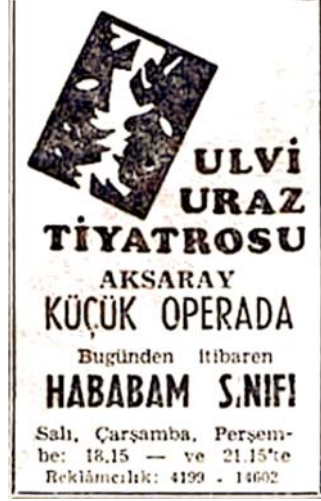
Resim 4.5: Hababam Sınıfı oyununun yeni sahnesindeki duyurusu