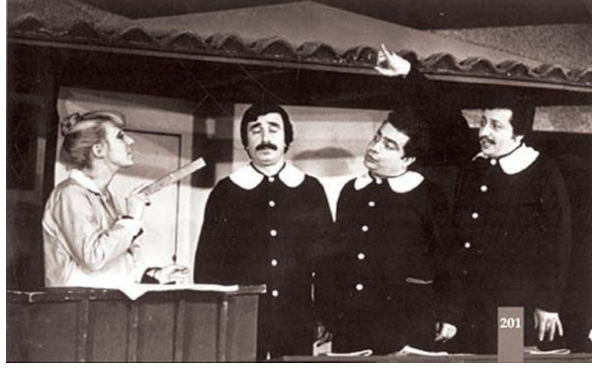
Resim 4.4: ‘Hababam Sınıfı’ 1 oyunundan bir fotoğraf