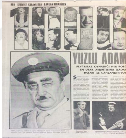
Resim 4.21: Ulvi Uraz'ın oyunculuğu ile ilgili gazete haberi