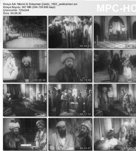
Resim 4.15: Mevlid adlı filmde kamera görüntü kareleri