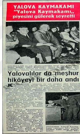
Resim 4.6: 08 Temmuz 1968 'Yalova Kaymakamı' adlı oyunun Hürriyet Gazetesi haberi

Bir piyes vardır ki, en büyük aktörler bile onu oynayamazlar, tökezlerler. Bir piyes vardır ki, onu en acemiler bile büyük ustalar gibi oynayabilirler. Orhan Kemal'in piyesi ikincilerden. Ulvi Uraz tiyatrosunun güçlü sanatçıları bu sözlerimle küçümsemek istemiyorum. Ama diyorum ki, onların güzel oyunlarında piyesin güzelliğinin de büyük bir payı vardı. Piyeste baştan ayağa kadar herkes güzel oynuyordu ve aksayan bir yan yoktu. (Kemal,1968)