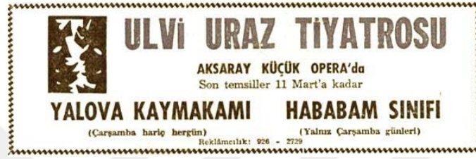
Resim 4.7: Yalova Kaymakamı ve Hababam Sınıfı oyunlarının duyurusu

Oyunlar buradaki sahnelenişin ardından Anadolu turnesine çıkmıştır (Yılmaz,2012).