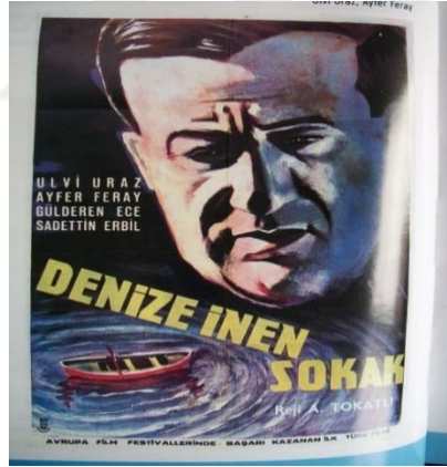
Resim 4.11: Denize İnen Sokak film afişi