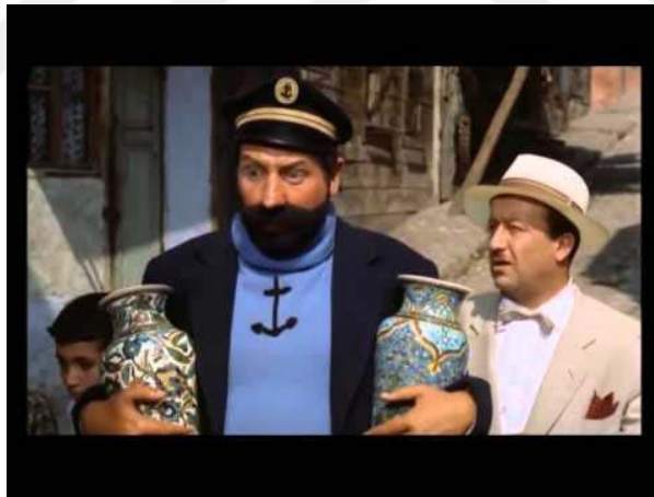
Resim 4.13: Tenten ve Altın Post Filmi

Kaynak: https://www.google.com.tr/search?q=ulvi+uraz+ten+ten+istanbulda+.2015 Yükleleyen: Sonya Mcguire