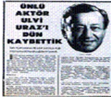
Resim 4.17: Ulvi Uraz'ın gazetede yer alan ölüm ilanı

Usta sanatçı Ulvi Uraz, 25 Mayıs 1974 tarihi sabahında saat 7.00 de kalp krizi sonucu vefat etmiştir (Ulvi Uraz'ı Kaybettik, 1974;1).