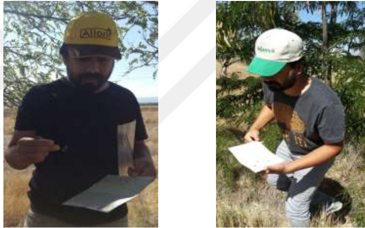
Şekil 3.2. Tuzaklara yakalanan erginlerin sayılması

yapılarak popülasyonun yoğun olduğu ilçeler ve bu ilçelerdeki bahçeler tespit edilmiştir. 1.yıl verileri sonucunda popülasyon yoğunluğunun en yüksek olduğu Kayseri ili Yeşilhisar ve Yahyalı ilçelerindeki popülasyon yoğunluğunun en yüksek olduğu bahçelerde kitlesel tuzaklamanın popülasyon yoğunluğu üzerindeki etkisini araştırmak amacıyla belirlenen biri Yahyalı ilçesinde, diğeri ise Yeşilhisar olmak üzere iki elma bahçesinde her biri 1000 m 2 'den oluşan dört parselde toplamda 36 adet tuzak asılmıştır. Bu parsellerden iki tanesine bir tekerrürlü onbeşer adet, diğeri iki parselde de yine bir tekerrürlü olmak üzere üçer adet tuzak asılmıştır. Tuzakların asılı olduğu ağaçlardaki enfekteli meyve ve zarar görmemiş meyve oranı sayım yapılarak kitlesel tuzaklamanın popülasyon yoğunluğu üzerine etkisi belirlenmiştir. Tuzaklar ilk kelebek uçuşunu takiben 15 gün aralıklarla sayılmıştır. (Şekil 3.1)