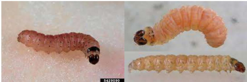
Şekil 2.2. Elma iç kurdu ( Cydia pomonella ) larvası

Yumurtadan çıkan larvalar başı siyah, 2-3 mm boyunda, krem-beyaz renktedirler. Olgunlaşan larvalar ise genellikle 12-20 mm büyüklüğünde, hafifçe pembemsi bir renktedirler (Beers ve ark.1993). Olgunlaşmaya başlayan larvalar pupa dönemine geçmek için eliptik şekilde ve kirli beyaz renkte kokon örerler. Pupa, açık kahverengi, genellikle 10 mm boyunda ve 2.5-3 mm enindedir (Anonim 1995). Ergin, gri renkte, yaklaşık 10 mm uzunluğunda ve ön kanatlarının uçlarında üçgen biçiminde kahverengi birer lekeye sahiptir (Anonim 1995). Ayrıca kanatlara dikkatle bakıldığında, gri ve beyaz renkli çapraz çizgiler görülür (Beers ve ark. 1993) .