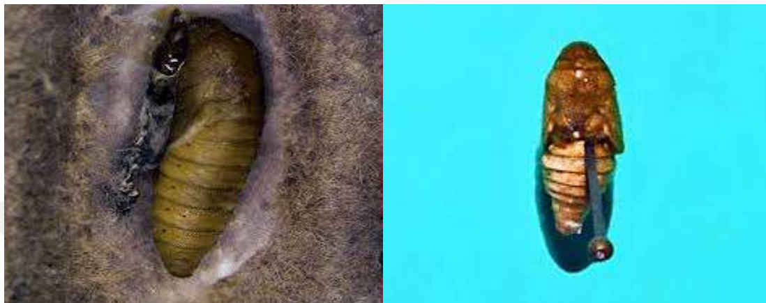
Şekil 2.3. Elma iç kurdu ( Cydia pomonella ) pupası

Larvalar meyve içinde 30-40 gün beslenirler ve olgunlaşan larvalar kokon içinde kışı geçirmek için meyveyi terk etmektedirler. Daha sonra pupa olarak, ya daha sonraki döl olarak aynı yıl veya pupa olmayıp da diyapozaya geçmeleri halinde ertesi ilkbaharda ilkbahar erginlerinin bir bölümü olarak çıkmaktadırlar (Anonim 1995).