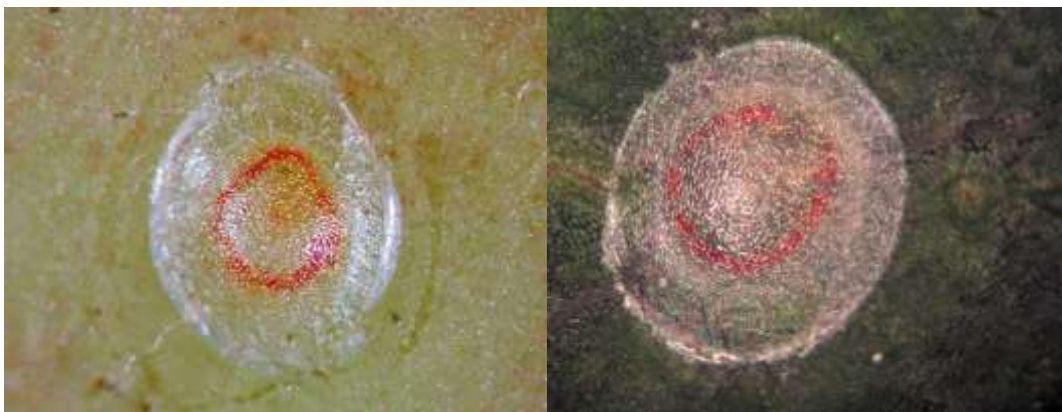
Şekil 2.1. Elma İç Kurdu ( Cydia pomonella ) Yumurtası

Elma iç kurdu yumurtasının řekli elips ve 1.0-1.2 mm çapında, beyaz renkte ve mumsu görünümdedir. Yumurta gelişimini tamamlarken kırmızımsı bir halka oluşur. Larva yumurtadan çıkmadan önce saydam bir řekilde gözlemlenebilmektedir. Yumurta açıldıktan sonra kabuđu güneş ışığında sedef gibi görülür. (Anonim 1995).