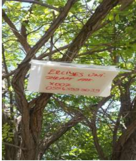
Şekil 3.1. Delta tipi feromon tuzak

Bu çalışmada elma iç kurdu popülasyonunu izlemek amacıyla elma iç kurdu feromon tuzaklarından Delta tipi tuzaklar kullanılmıştır. Feromon kapsülleri, 1 miligram (E,E)-8,10-Dodacadien-1-ol, Codlemone içermektedir. Feromon tuzakları, VİT-Verim, Beyoğlu - İstanbul isim ve adresli firmadan temin edilmiştir (Şekil 3.1).