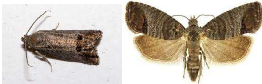
Şekil 2.4. Elma iç kurdu ( Cydia pomonella ) ergini

Erkek erginlerde abdomen ucunda dıştan üreme organlarını kapatan iki kapakçık ve bu kapakçıklarda pulcuklar bulunurken; dişilerde abdomenin ucunda, ventralde kenarları ince tüylerle çevrili bir çukur bulunur. Erginlerde kanatlar açıldığında mesafe 18-20 mm'yi bulmaktadır. (Anonim 1995).