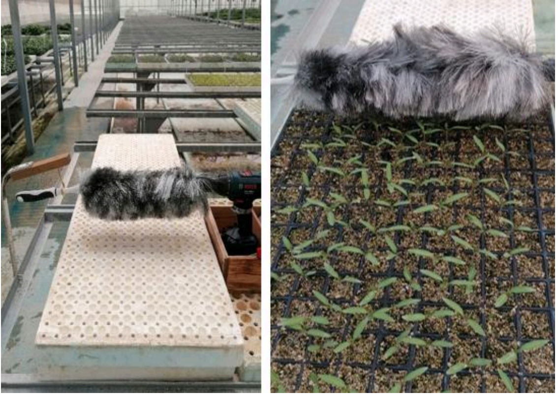
Şekil 3.6. Fırça uygulaması yapılan düzenek

Domates, hıyar ve kıvırcık yapraklı baş salata fidelerinde fırçalama uygulaması bitkilerde ilk gerçek yapraklar tam oluştuğunda başlanmıştır. Fırça uygulamasında 3 farklı uygulama şeklinde yapılmış birinci uygulama saat 08:00 ve 18:00'da 2 dakika süreyle fırçalama yapmıştır. İkinci uygulama saat 08:00, 13:00 ve 18:00'da 2 dakika süreyle, üçüncü uygulama 08:00-18:00 saatleri arasında 2 saat aralıklarla her defasında 2 dakika fırçalama yapılmıştır. Fırçalama fırça hızı 30 devir/dakika olan düzenekle İlk fırçalama önden arkaya yapılmışsa ikinci fırçalama önceki fırçalamanın ters istikametinde yapılacak şekilde uygulanmıştır. Kontrol bitkilerinde, kuraklık stresi çalışılan bitkilerinde ve paklobutrazol uygulanan bitkilerde herhangi bir fırça uygulaması yapılmamıştır. Kullanılan fırça mekanizması Şekil 3.6'da ve fırça uygulaması yapılmaya başlanılan fideler Şekil 3.7 'de verilmiştir.