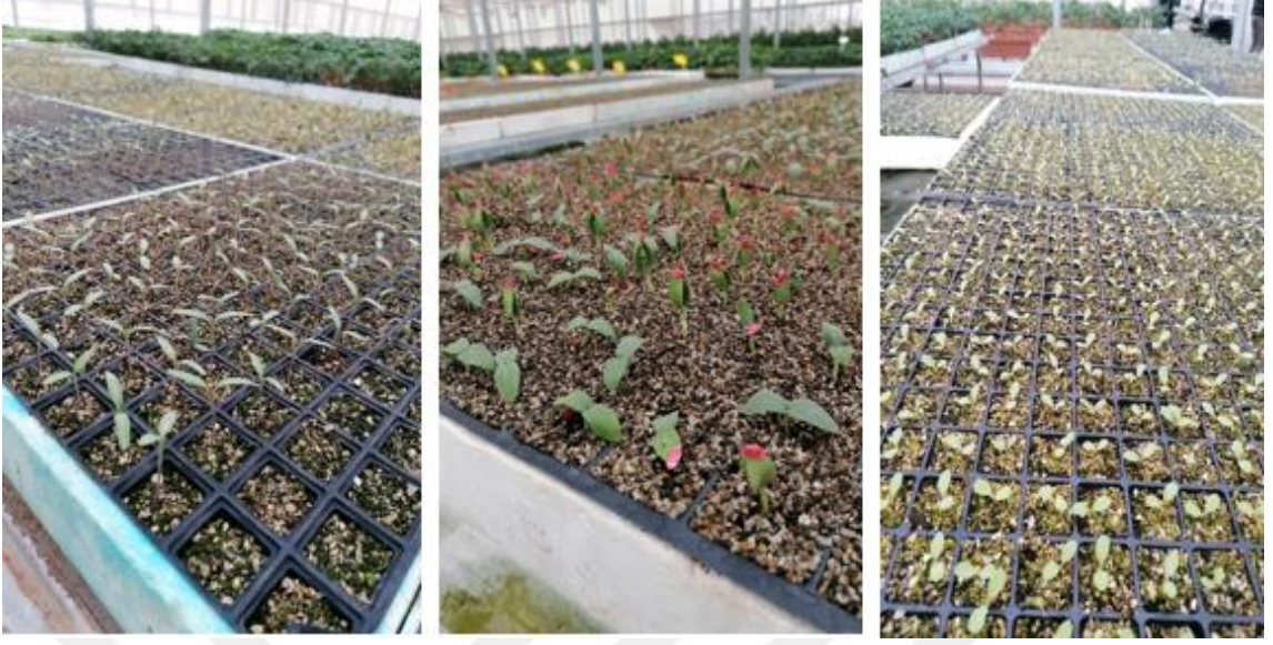
Şekil 3.7. Fırça uygulaması yapılan fideler