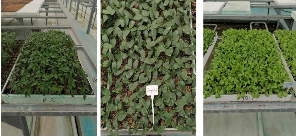
Şekil 3.4. Denemede yetiştirilen bitkiler