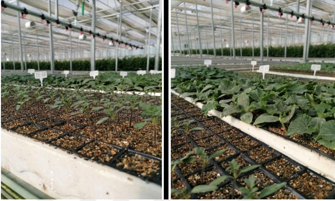
Şekil.3.3. Boom sulama sistemi