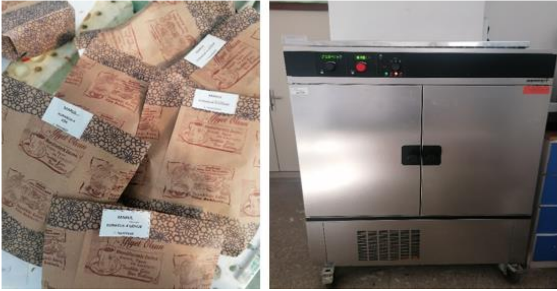
Şekil 3.10. Kurutma işlemi için paketlen bitkiler ve kullanılan etüv

Yaş ağırlık ölçümü yapılan bitkiler etüvde 65 °C sıcaklıkta ağırlıkları sabit değere gelene kadar kurutulmuş ve kuru ağırlıkları 0.01 gram hassasiyete sahip hassas terazide tartılarak kaydedilmiştir. Kurutma işlemi için paketlen bitkiler ve kullanılan etüv Şekil 3.10'da gösterilmiştir.