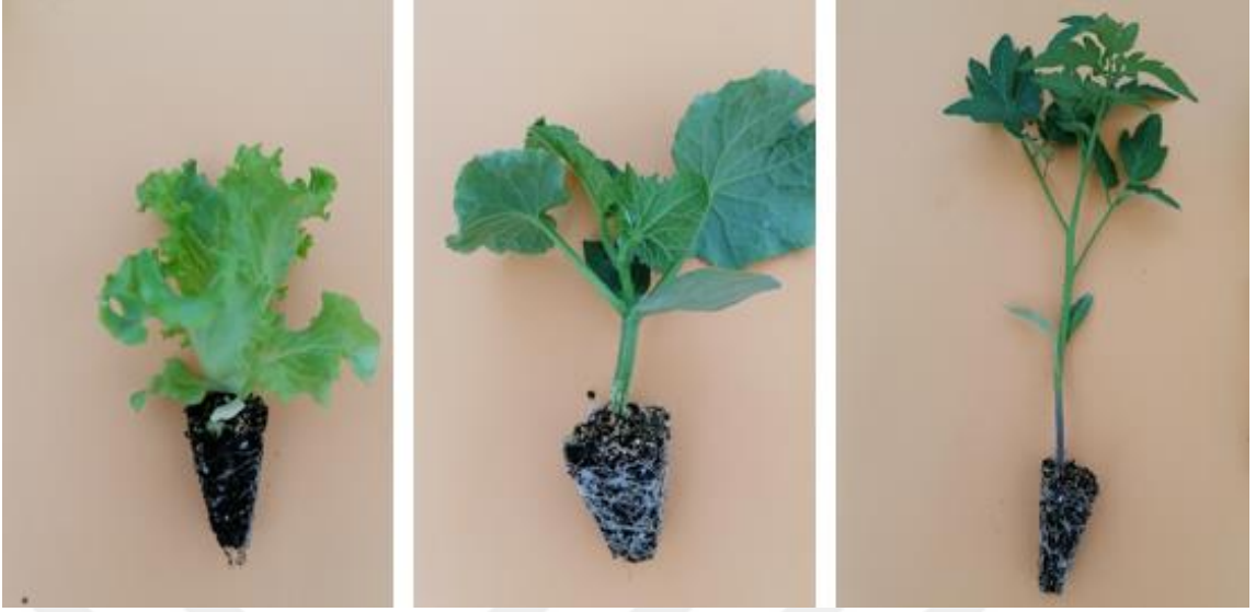
Şekil 3.9. Fidelerin genel görünümü