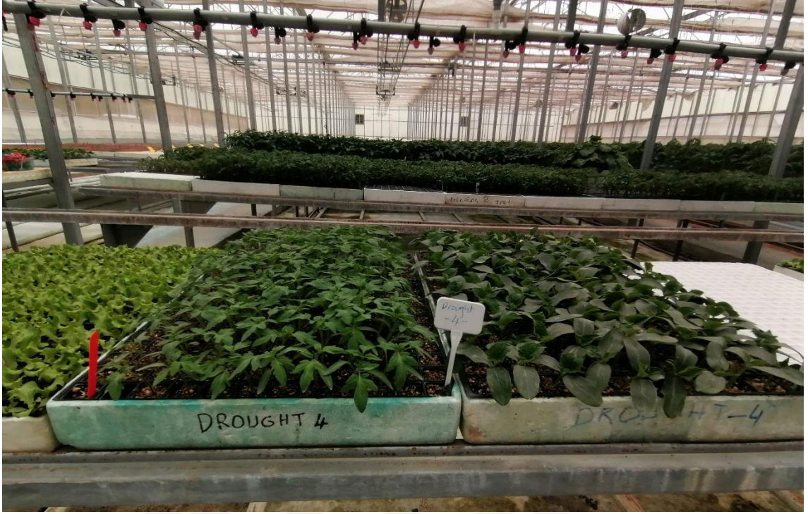
Şekil 3.8. Kuraklık stresi uygulanan bazı bitkiler