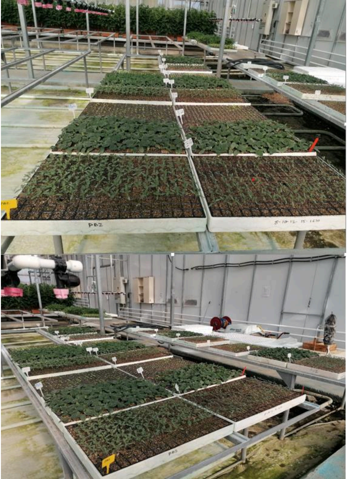
Şekil 3.5. Paklobutrazol uygulanan bitkiler ile birlikte genel denemenin görseli