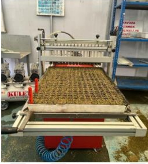
Şekil 3.1. Tohum ekme makinesi