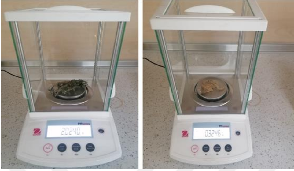
Şekil 3.11. Tartma işleminde kullanılan hassas terazi