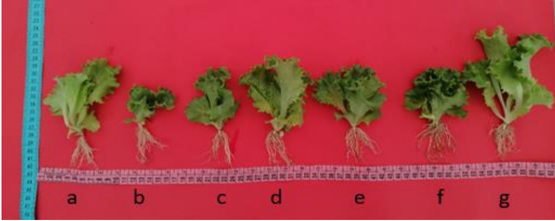
Şekil 4.3. Kıvırcık yapraklı baş salatada uygulamalara göre fide görünümleri. a) Paklobutrazol uygulanan kıvırcık yapraklı baş salata fidesi b) 2 saat ara ile fırça uygulaması yapılan kıvırcık yapraklı baş salata fidesi c) 5 saat ara ile fırça uygulaması yapılan kıvırcık yapraklı baş salata fidesi d) 10 saat ara ile fırça uygulaması yapılan kıvırcık yapraklı baş salata fidesi e) 2 saat süreyle kuraklık stresi uygulanan kıvırcık yapraklı baş salata fidesi f) 4 saat süreyle kuraklık stresi uygulanan kıvırcık yapraklı baş salata fidesi g) Kontrol grubu kıvırcık yapraklı baş salata fidesi