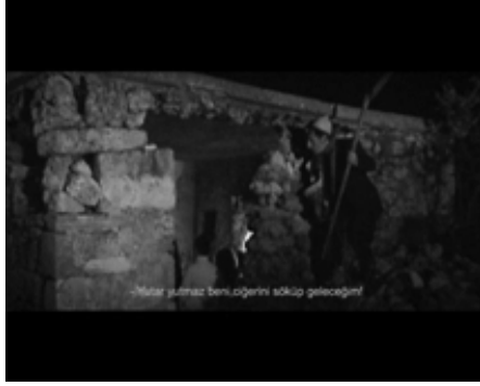
İsmail Ağa'nın Alkarısı ile İlk Karşılaşması