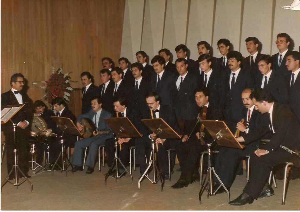
A.Ü. 50. Kuruluş Yıldönümü Konseri, Gazi Üniversitesi Gazi Eğitim Fakültesi,