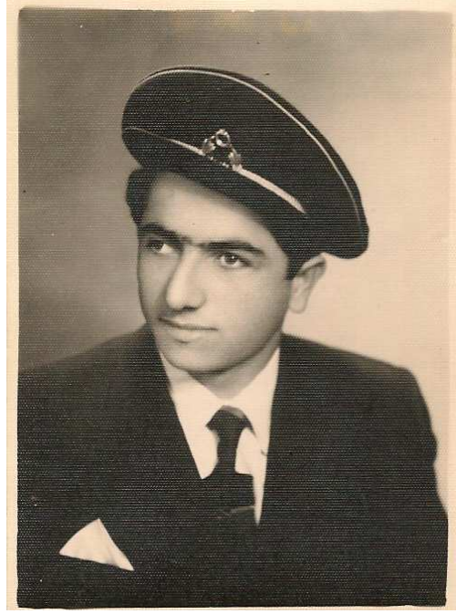
Elazığ Lisesi 5.Sınıf talebelik dönemleri. 14 Mart 1954