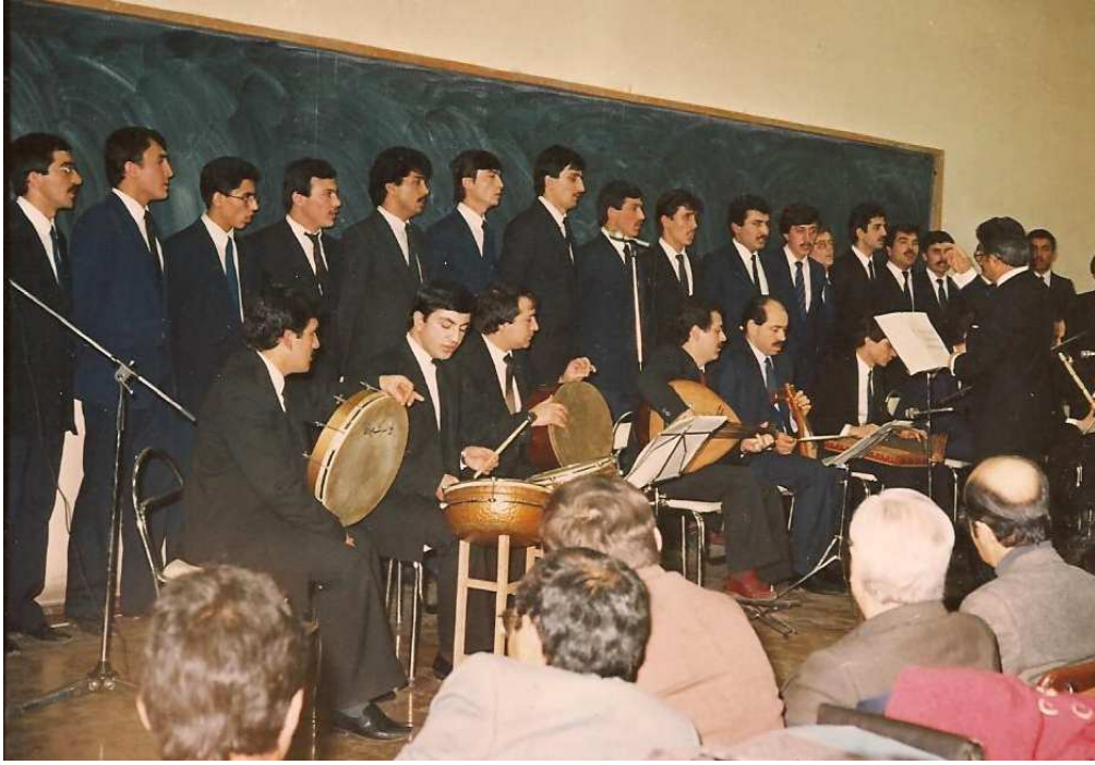
A.Ü. İlahiyat Fakültesi Türk Tasavvuf Mûsikîsi Korusu Konseri - 2 Mart 1986.