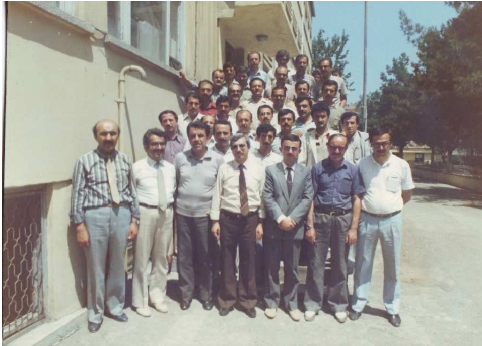
1985 Aynı Kursta Hüsn-ü Hat Hocaları ve Talebeleriyle Birlikte.