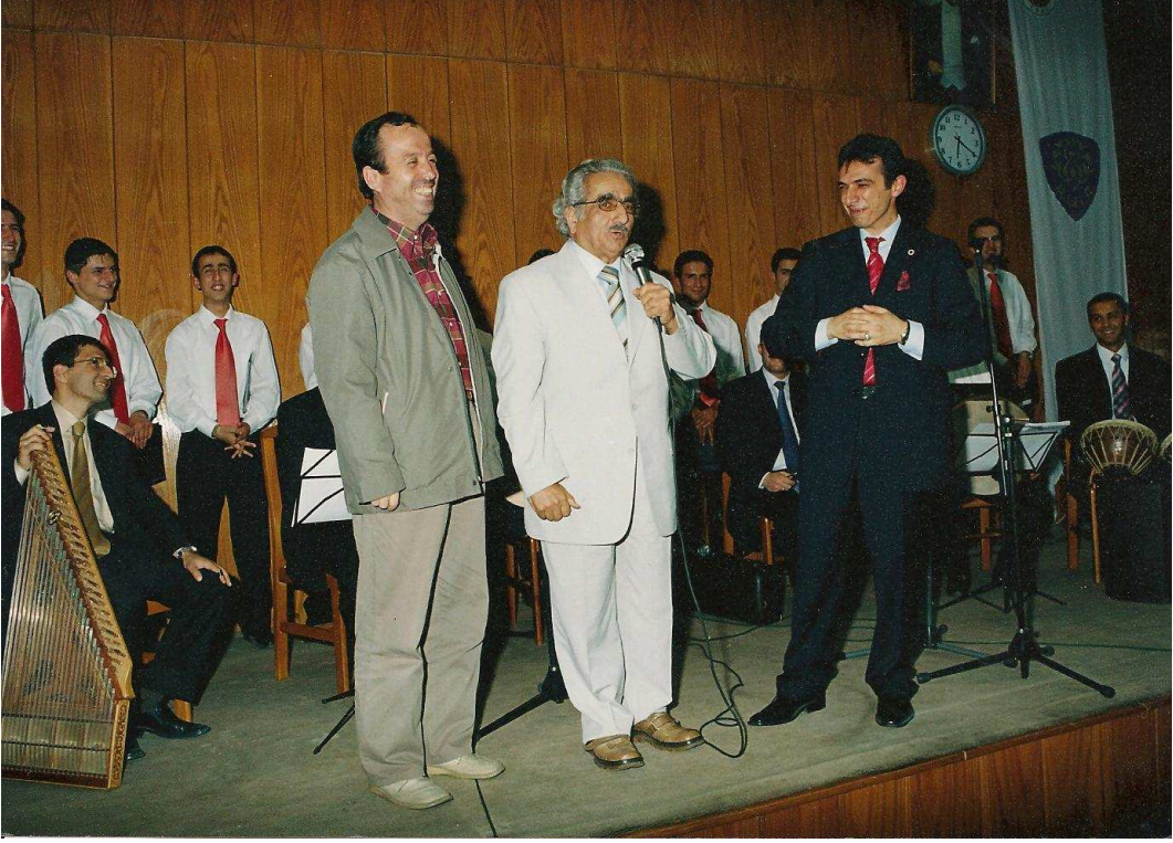
A.Ü. İlahiyat Fakültesi Türk Tasavvuf Mûsikîsi Korosu Mezuniyet Konseri, 2006.