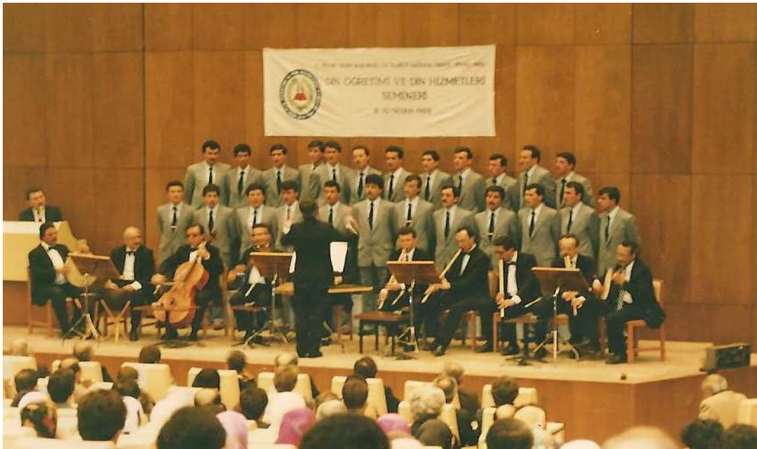
Din Öğretimi ve Din Hizmetleri Semineri Konseri, Ankara 10 Nisan 1988