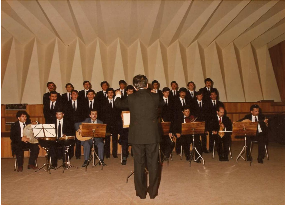
A.Ü. 50. Kuruluş Yıldönümü Konseri, Gazi Üniversitesi Gazi Eğitim Fakültesi, 28 Haziran 1986.