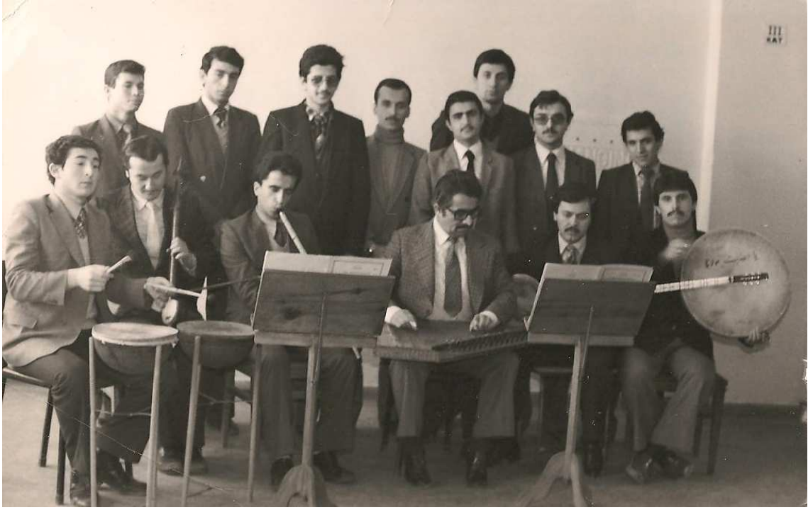
A.Ü. İlahiyat Fakültesi Koro Çalışması – 1986.