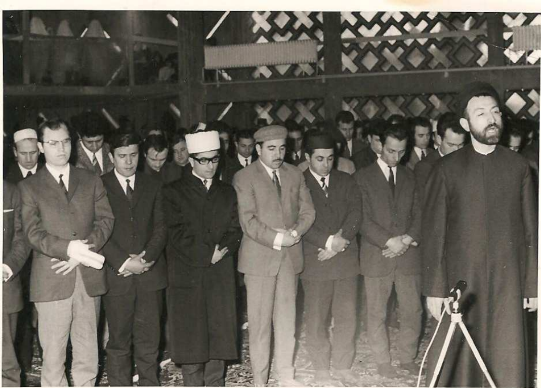
İran Camii Bayram Namazı Hamburg – 1967