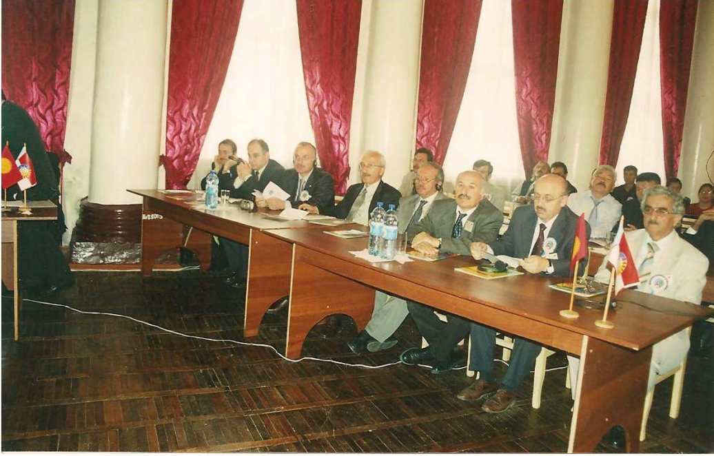
Kırgızistan Oş Devlet Üniversitesi İlahiyat Fakültesi Uluslar Arası Orta Asya'da İslam Sempozyumu, Kazakistan 20-21 Mayıs 2004