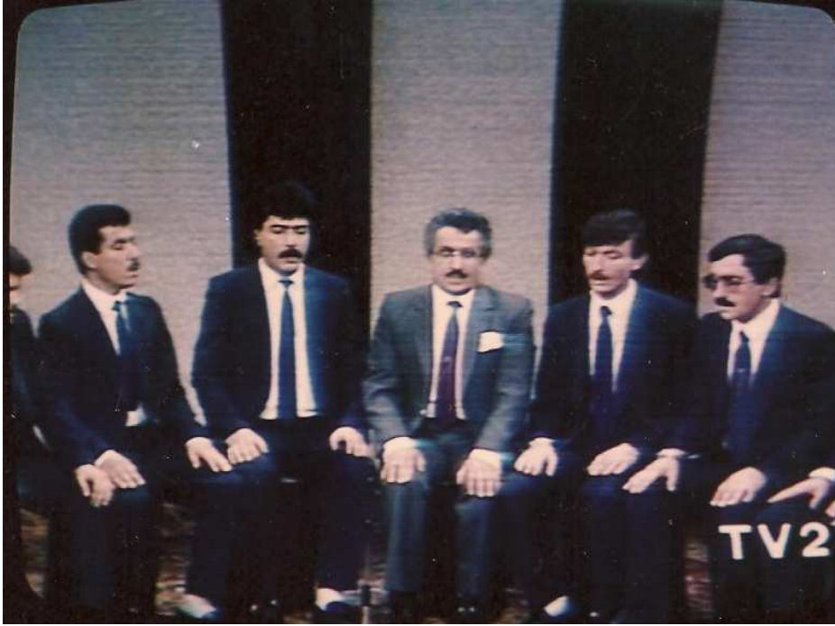
Ankara Üniversitesi İlahiyat Fakültesi Türk Tasavvuf Müsikîsi Korusu TRT 2 Programı - 1984.