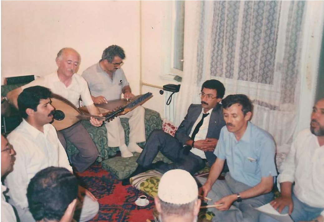
Hizmet İçi Eğitim Kursu, Bartın – 30 Haziran 1989.