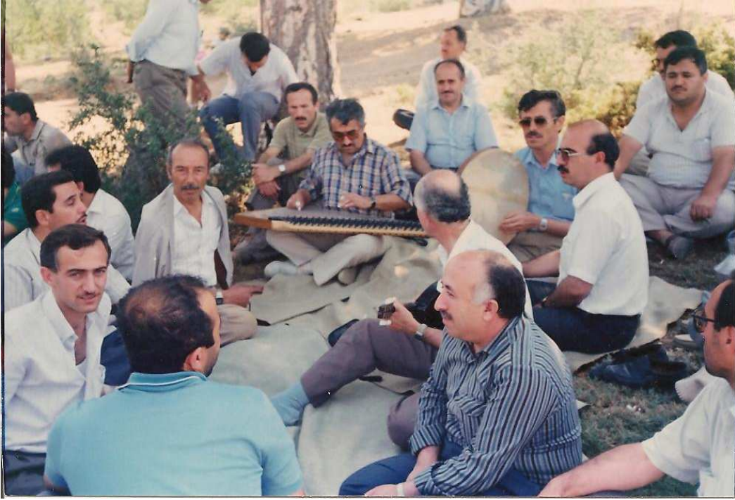
Hizmet İçi Eğitim Kursu, Bartın – 2 Şubat 1989.