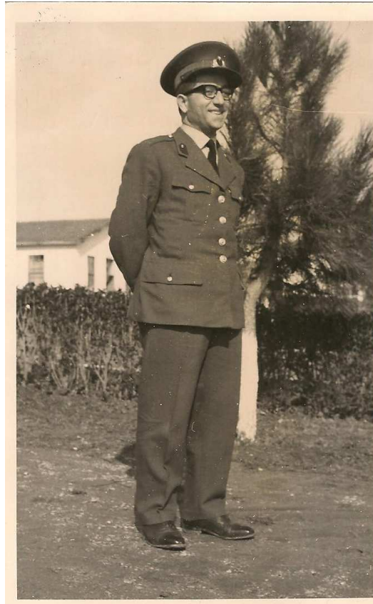
59. Tugay Komutanlığı Levazım Amirliği Levazım Subaylığı Erzincan – 1964