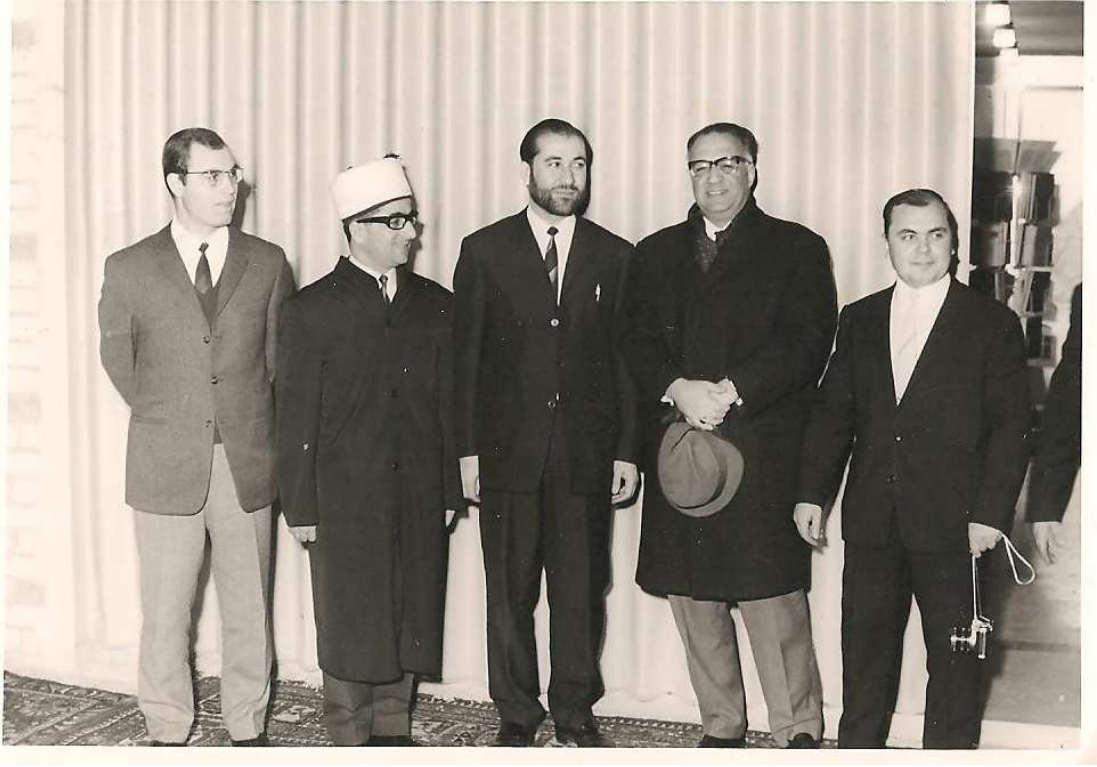
İran Camii'nde bir bayram namazı sonrası sohbet Hamburg – 1967