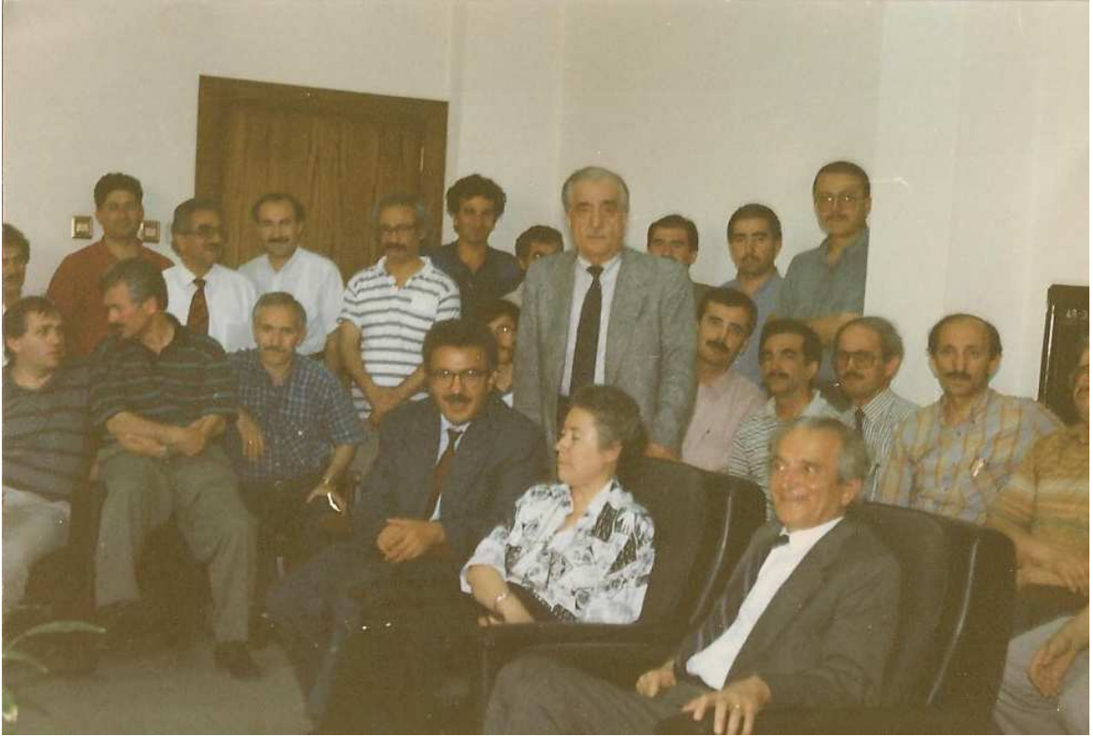
Fakülte de hocalarla birlikte.