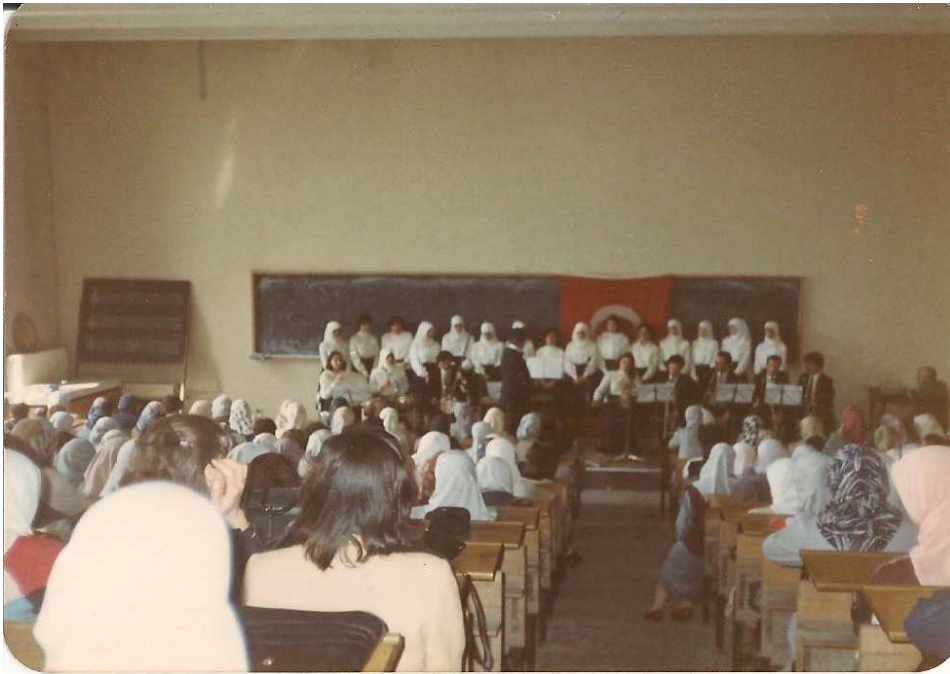
A.Ü. İlahiyat Fakültesi Kız Öğrenciler Korusu Türk Tasavvuf Müsikîsi Konseri 28 Nisan 1985.