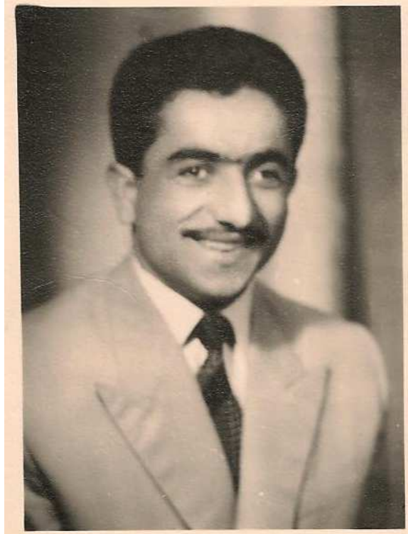
A.Ü. İlahiyat Fakültesi öğrencilik yılları 1958.