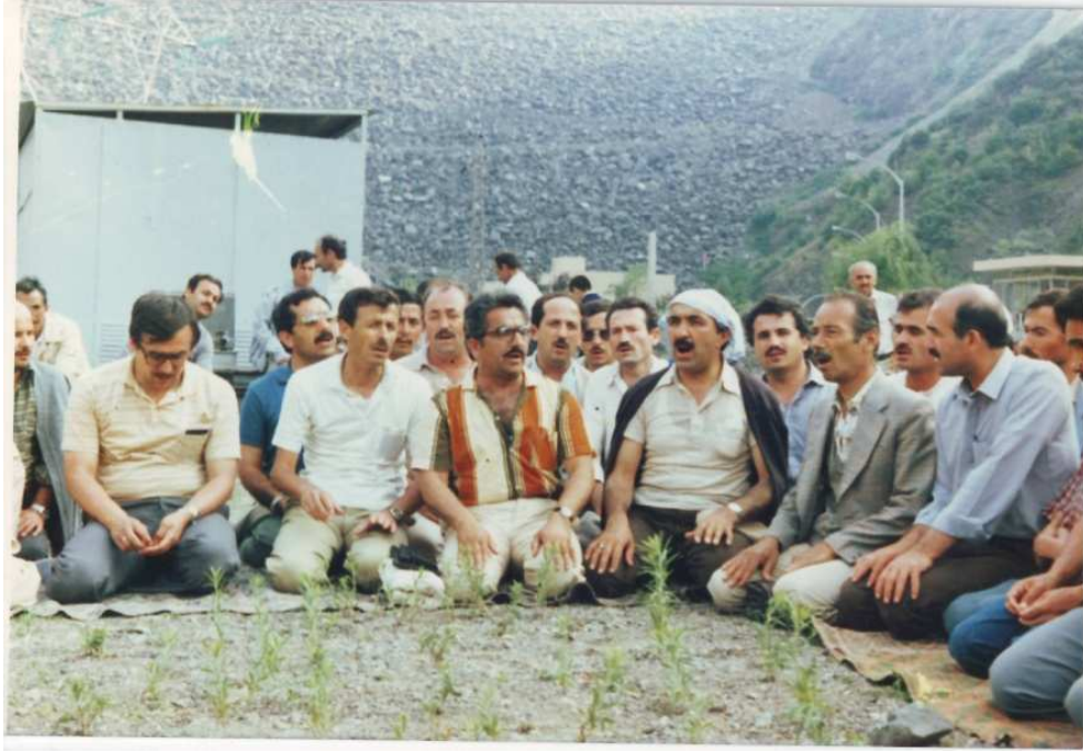
1985 Samsun'da Öğretmenlere Dini Mûsikî Hizmet İçi Kursu'nda, Piknik Esnasında Koro Faliyeti