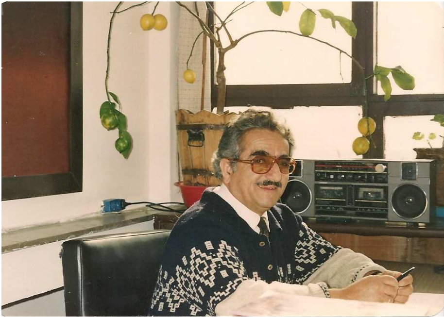
A.Ü. İlahiyat Fakültesi 4. kattaki odasında