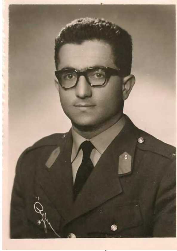
15 Mart 1964 İstanbul.