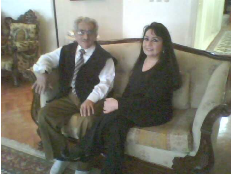
Eşi Türkan Hanımefendi ile birlikte.