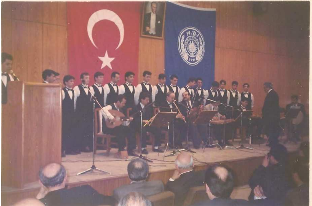
A.Ü. İlahiyat Fakültesi Yıl Sonu Konseri – 1996