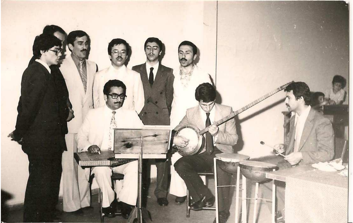
İlahiyat Fakültesi Koro Çalışması 1980