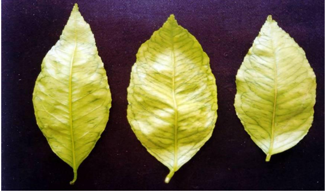
Şekil 4.2. TSDA ile infekteli olgun limon yapraklarının arka yüzeylerindeki yağ/su emmiş gibi görünen damarlar

TSDA ile infekteli ağaçların yapraklarında hastalık, ilkbahar ve sonbahar aktif dönemlerinde oluşan sürgünlerde, genç yapraklarda ortaya çıkmakla birlikte, yapraklar yaşlandıkça da görünümelerini kaybetmemektedirler. Yaşlı yaprakların arka yüzeylerinde damarlar boyunca yağ/su emmiş gibi görünen hatlar oluşmaktadır (Şekil 4.2).