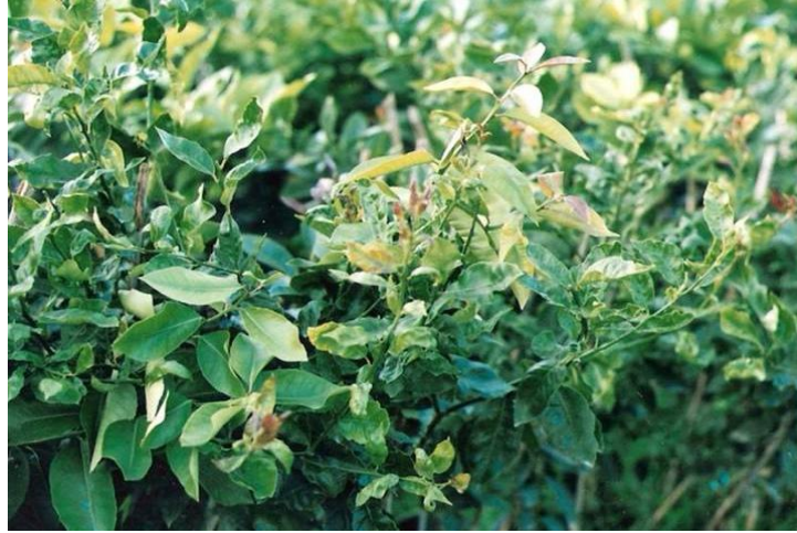
Şekil 4.4. TKC hastalığı ile infekteli bir mandarin ağacında küçülmüş, kıvrılmış, deforme olmuş yapraklar ve sürgünlerde çalı şeklindeki görünüm