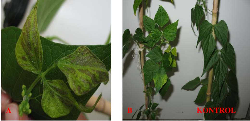
Şekil 4.5. TSDA bulaştırılmış Dermason çeşidi fasulyede tepe yapraklarda nekrozlar (A) ve klorozlar (B)

fasulye bitkilerinin tepe yapraklarının tamamen beyazlaştıkları gözlenmiştir (Şekil 4.7). Kullanılan iki farklı çeşit fasulyede farklı simptomlar gözlenmiştir.