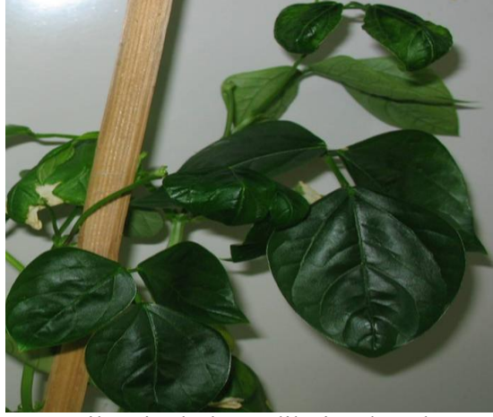
Şekil 4.10. TSDA ile inokule edilmiş börülce yapraklarında küçülme, kaşıklaşma ve hafif klorozlar

Elde edilen sonuçlar, Alshami ve ark. (2003)'nın yapmış oldukları mekanik inokulasyon çalışmalarında börülcede elde ettikleri bulgularla benzerlik göstermemektedir. Araştırmacılar, çalışmalarında börülce üzerinde herhangi bir semptom tespit edememişken, bizim yaptığımız çalışmada, TSDA hastalığı ile inokule edilen börülce bitkilerinin yapraklarında klorotik, nekrotik lekelerin oluştuğu, yaprakların deforme olarak küçüldükleri, bitkilerin boğum aralarının kısalarak, hafif bodur kaldıkları gözlenmiştir.