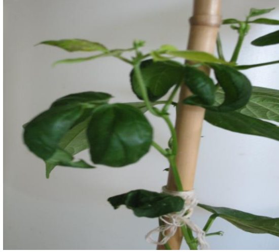
Şekil 4.9. TSDA ile bulaşık Horoz çeşidi fasulye yapraklarında kaşık şeklinde geriye doğru kıvrılmalar

TSDA hastalığı Pakistan’da ilk kez tespit edildiğinde, infekteli ağaçların yapraklarında meydana getirdiği damarlar üzerinde bantlaşmalar, ana ve yan damarlar üzerinde farklı boyutlarda renk açılmaları ve yaprakların kırışması gibi belli başlı belirtiler nedeniyle CVV veya CTV hastalıkları ile akraba olabileceği düşünülmüştür (Catara ve ark., 1993). Bununla birlikte daha sonraki yıllarda yapılan çeşitli çalışmalar sonucu bu hastalığın etmeninin ipliksi şekilli yeni bir virüs olduğu ortaya konmuştur (Alshami ve ark., 2003). Alshami ve ark. (2003)’nin yaptığı çalışmada TSDA hastalığı fasulye bitkilerine ( Phaseolus vulgaris var. Singtamey) özsu inokulasyonu ile taşınabilmiş ve fasulye yapraklarında sistemik mozaik, nekrotik ve değişik renkli lekeler şeklinde belirtiler olduğu bildirilmiştir. Bu çalışmada gerçekleştirilen mekanik inokulasyon çalışmaları sonucunda benzer şekilde Dermason çeşidi fasulyelerin yapraklarında klorotik, nekrotik lekeler, mozaik şekilli belirtiler, lokal lezyonlar gözlenmiştir. Ancak araştırmacılar bu çalışmadaki Horoz fasulye çeşidinde elde edilen bulgulara benzer gondol yaprak oluşumu gibi bir belirtiler gözlediklerini belirtmemişlerdir.