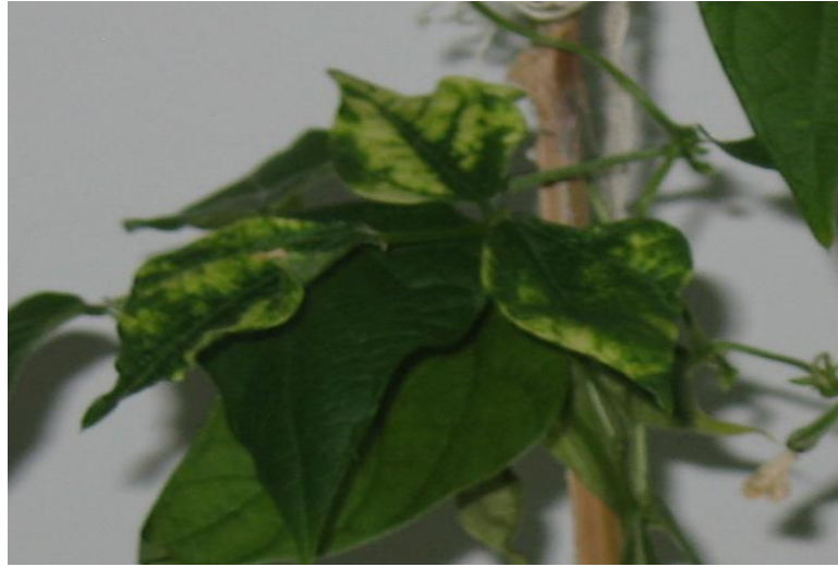
Şekil 4.6. TSDA inokule edilmiş Dermason çeşidi fasulyede genç yapraklarda klorozlar ve deformasyonlar