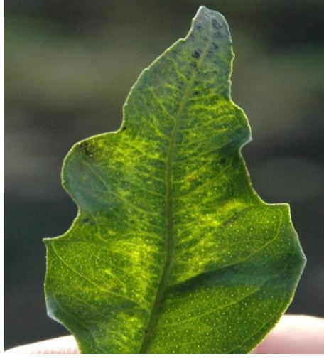
Şekil 4.3. TKC hastalığı ile infekteli bir mandarin yaprağının kenarlarındaki tipik “V” şeklinde kıvrılmalar