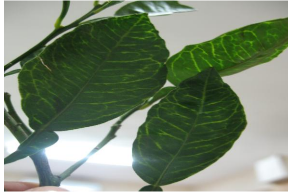
Şekil 4.12. Koch postulatı sonucu turunç çöğürlerinin yapraklarında oluşan damar bantlaşmaları

TSDA hastalığı ile inokule edilen fasulye bitkilerinden inokulum alınarak turunç bitkilerine mekanik inokulasyon yöntemiyle hastalık taşınmaya ve Koch postulatları tamamlanmaya çalışılmıştır. Sonuçta fasulye bitkilerinden turunca hastalığın taşınabildiği ve TSDA hastalığının tipik semptomları olan damarlarda bantlaşmalar, sarı renkli açılmalar, yapraklarda kıvrılmalar, bükülmeler, deformasyonlar ve yaprağın alt yüzünde damarlar boyunca su emmiş gibi görünen semptomlar oluştuğu gözlenmiştir (Şekil 4.12).