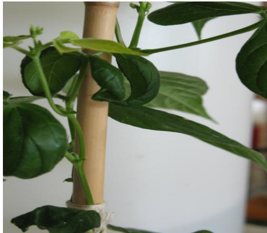
Şekil 4.8. TSDA ile bulaşık Horoz çeşidi fasulye yapraklarında gondol şeklinde kıvrılmalar

TSDA hastalığı ile inokule edilen Horoz çeşidi fasulyelerde, Dermason çeşidinde gözlenen kloroz ve nekrozlar, yapraklarda beyazlaşma ve yaprakların küçülmesi gibi belirtiler, oldukça hafif şekilde ve bitkinin ileriki aşamalarında gözlenmiştir. Ancak Horoz çeşidinde, tipik şekilde yapraklarda gondol (Şekil 4.8) ve kaşık şeklinde geriye doğru bükülmeler görülmüştür (Şekil 4.9). Bu belirtiler Dermason çeşidinde gözlenmemiştir.