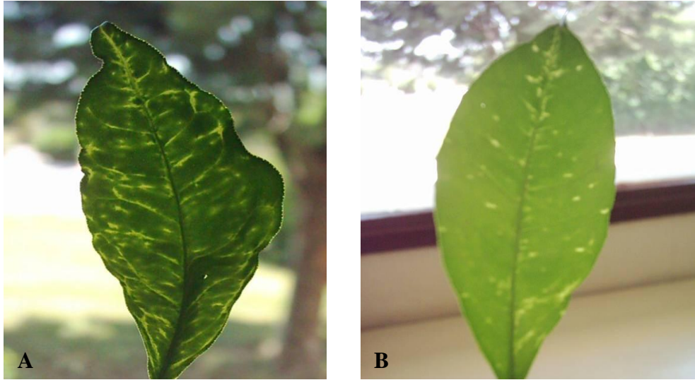
Şekil 4.1. TSDA ile infekteli Kütdiken limon ağaçlarından alınmış yapraklarda yan damarlar boyunca gözlemlenen bantlaşmalar, yapraklarda meydana gelen kıvrılmalar (A) ve beneklenmeler (B).

TSDA hastalığı, Çukurova Üniversitesi Ziraat Fakültesi Araştırma Uygulama Çiftliği turunçgil koleksiyon parsellerinde bulunan Kütdiken limon ve turunç çeşitlerine ait ağaçlarda, genç yapraklarda damarlar üzerinde bantlaşmalar, yaprakların ana ve yan damarları üzerinde farklı boyutlarda sarı renk açılmaları şeklinde ortaya çıkmaktadır. Yapraklardaki renk açılmaları, beneklenmeler şeklinde de görülebilmektedir. Yapraklar normal boyuttan daha küçük gelişmekte, kenarlarında kıvrılıp bükülmeler, buruşup kırışmalar şeklinde yaprak deformasyonları gelişmektedir. Hastalığın belirtileri, yapraklar ışığa doğru tutulduğunda daha net olarak görülmektedir. (Şekil 4.1).