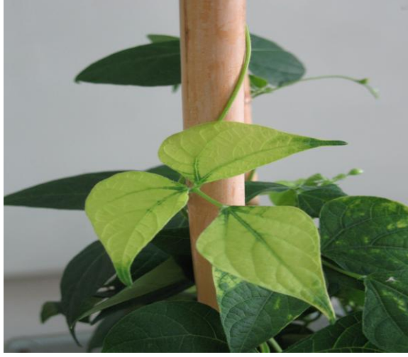
Şekil 4.7. TSDA inokule edilmiş Dermason çeşidi fasulyede tepe yapraklarda beyazlaşmalar