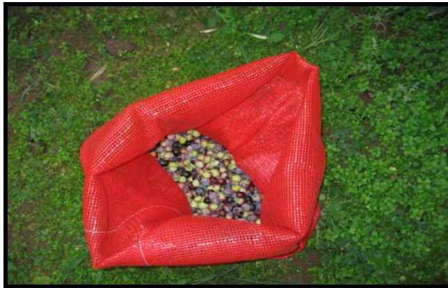
Resim 3.3. Alınan meyve örnekleri ve laboratuara getirildikleri gözenekli torbanın görünümü

Yörede hasadın yoğun olarak gerçekleştiği kasım-aralık aylarına rastlayan dönemde, önceden işaretlenmiş ağaçların her yönünden; bitki besin elementleri, ağır metaller ve yağ analizlerinde değerlendirilmek üzere her bahçeden yaklaşık 3.5 kg meyve örneği alınmıştır. Örnekler toplam fenol içeriğinin bozulmasını önlenmek düşüncesiyle laboratuara gözenekli torbalarda getirilmiş, bekletilmeden yağ elde edilmiştir. Elementel analizler için ayrılan örnekler de +4 °C'de buzdolabında korunmuştur.