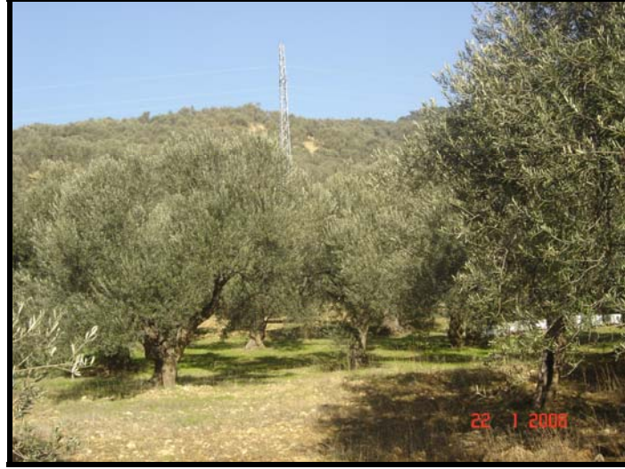
Resim 3.1. Örnekleme yapılan bahçelerden bir görünüm

etkisi gösteren Kazdağları ile, yaz kurağı ve kış ayazının olumsuz etkisini azaltan ve Edremit Körfezi'nden esen ılık "İmbat Rüzgarları"nın varlığı gelmektedir. Bu denli öneme sahip yörede zeytin ağaçları çoğunlukla 50-100 yaşlarında bulunmakta, bir çoğunun yaşları da tahmin edilemeyecek kadar eskilere dayanmaktadır.