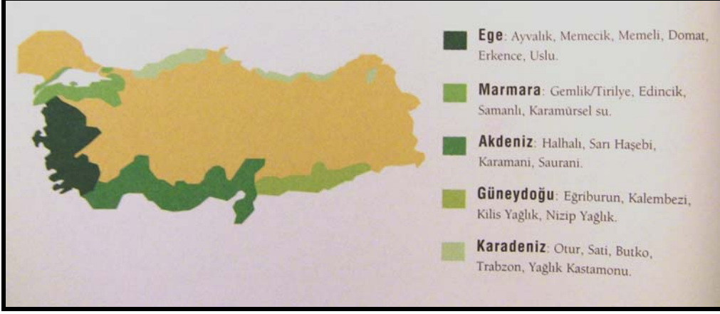
Şekil 1.1. Türkiye’de Zeytin Üretim Alanlarının Dağılımı ve Bölgelere Göre Yetiştirilen Zeytin Çeşitleri (Boynudelik, 2008).

Sözü edilen koşullarda var olan ekolojik farklılıklar çeşit zenginliğini ortaya çıkarmaktadır. Şekil 1.1’de Türkiye’nin zeytin üretim bölgeleri ve her birinde yetiştirilen çeşitler görülmektedir.