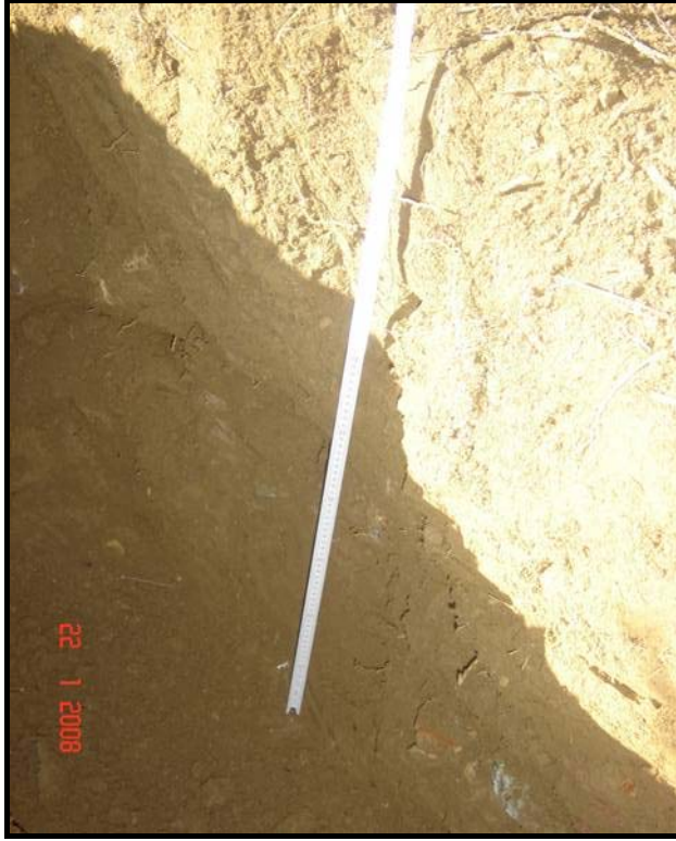
Resim 3.2. Açılan profillerden bir kesit

sonra 2 mm çaplı elekten elenerek analize hazırlanmıştır. Bu nedenle bahçede belirlenen katman sayısı ve her katmanın derinliği farklılık göstermiştir.